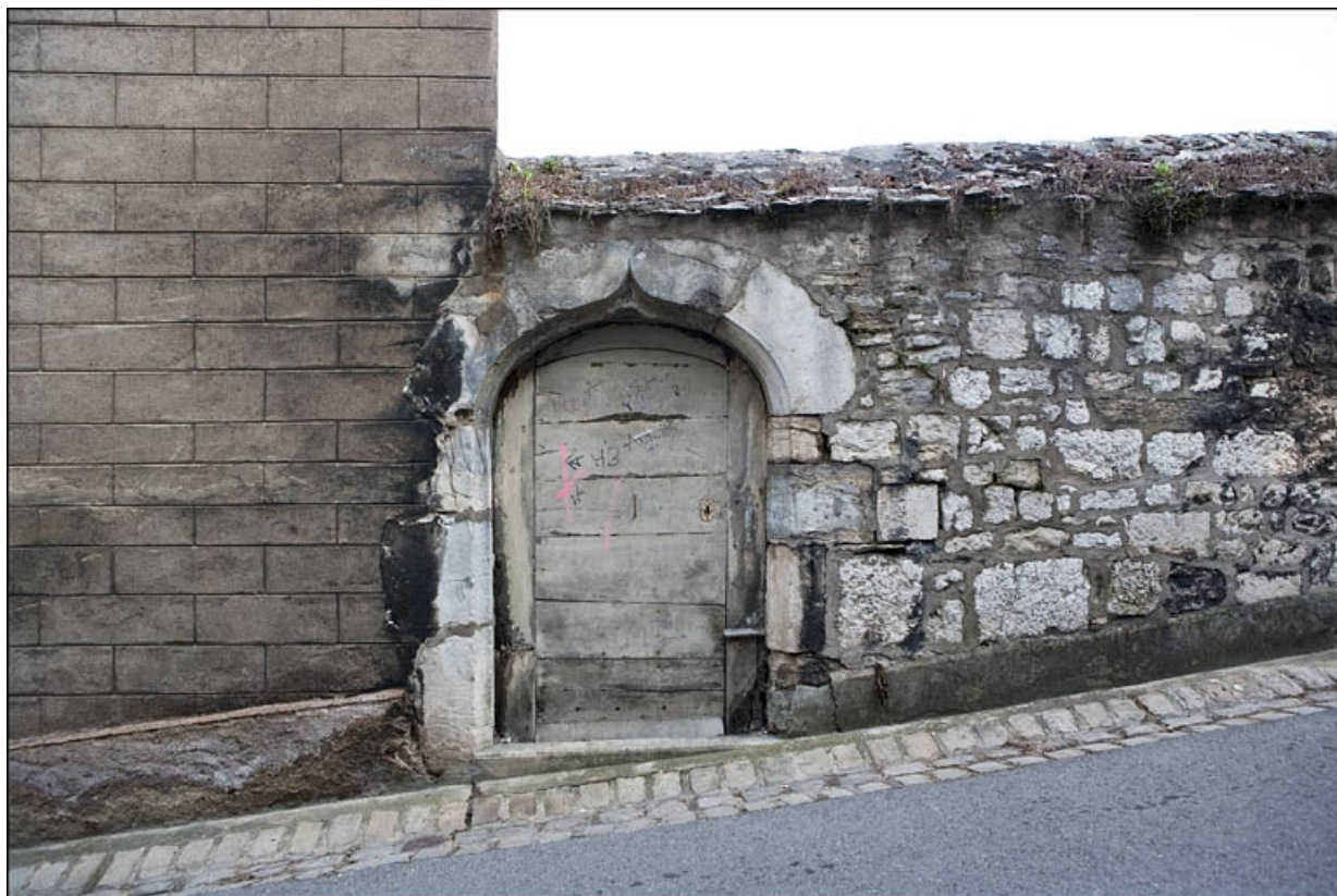
Détail de la porte dans la clôture de jardin.

25, Besançon, 14 rue de la Convention, lieudit : îlot Boitouset