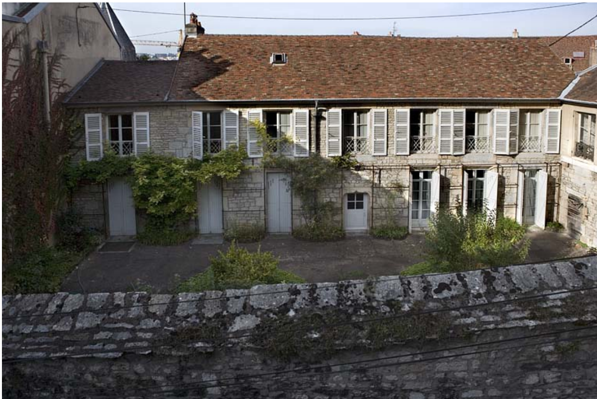
Vue d'ensemble de la façade postérieure depuis le jardin de l'hôtel Franchet de Rans.

25, Besançon, 14 rue de la Convention, lieudit : îlot Boitouset