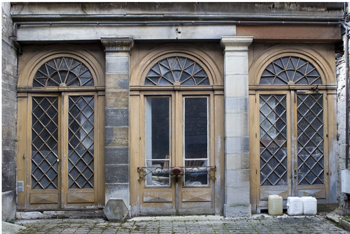
Détail du rez-de-chaussée de l'aile droite.

25, Besançon, 14 rue de la Convention, lieudit : îlot Boitouset