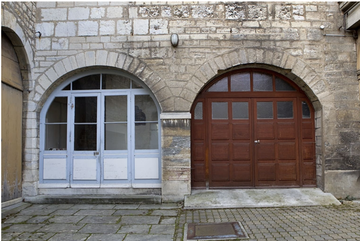
Détail du rez-de-chaussée du logis en fond de cour.

25, Besançon, 14 rue de la Convention, lieudit : îlot Boitouset