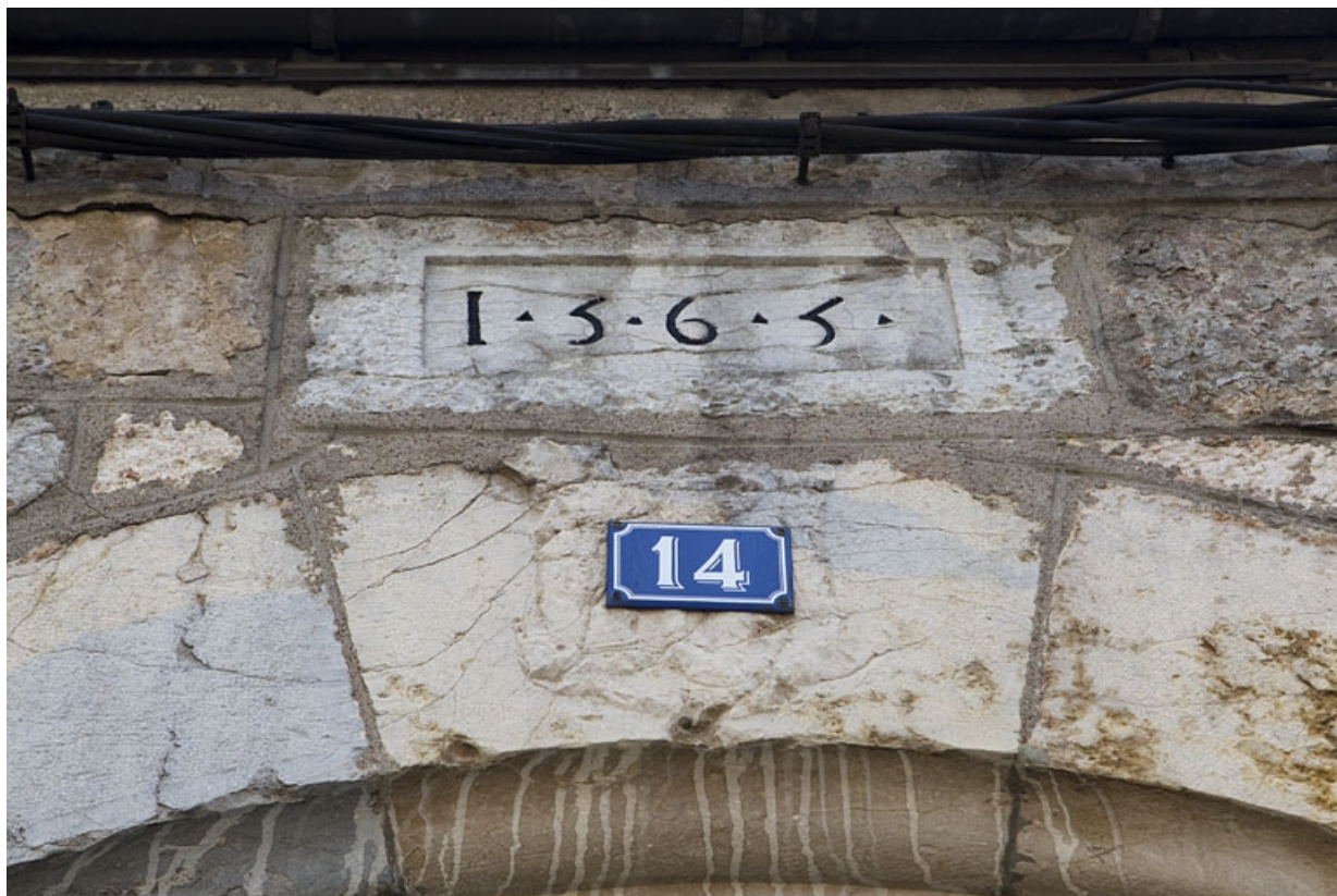
Détail de la date sur le linteau du portail dans clôture.

25, Besançon, 14 rue de la Convention, lieudit : îlot Boitouset