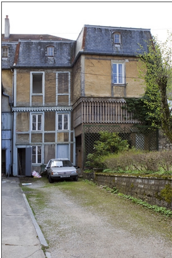
Détail de l'aile sur cour, de face.

25, Besançon, 12 rue de la Convention, lieudit : îlot Boitouset