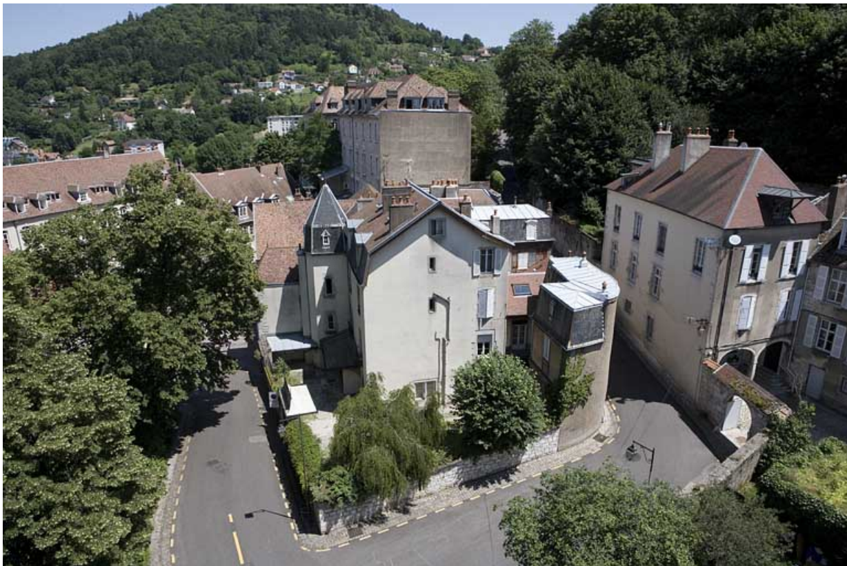
Vue plongeante sur la demeure depuis le clocher de la cathédrale Saint-Jean.

25, Besançon, 12 rue de la Convention, lieudit : îlot Boitouset