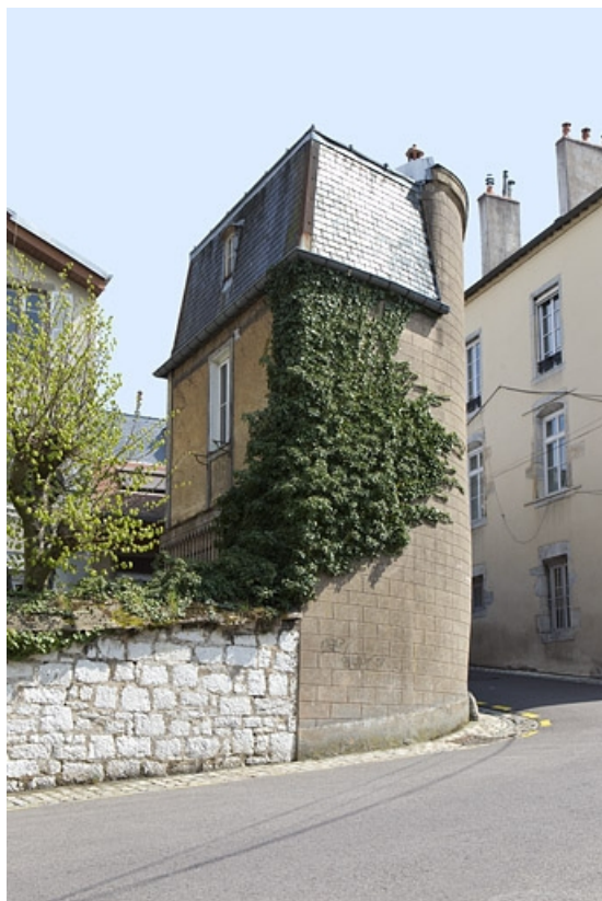
Détail de l'aile sur cour depuis la rue.

25, Besançon, 12 rue de la Convention, lieudit : îlot Boitouset