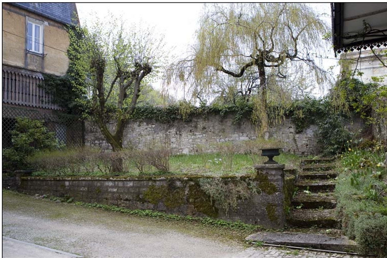
Vue d'ensemble du petit jardin depuis la cour.

25, Besançon, 12 rue de la Convention, lieudit : îlot Boitouset