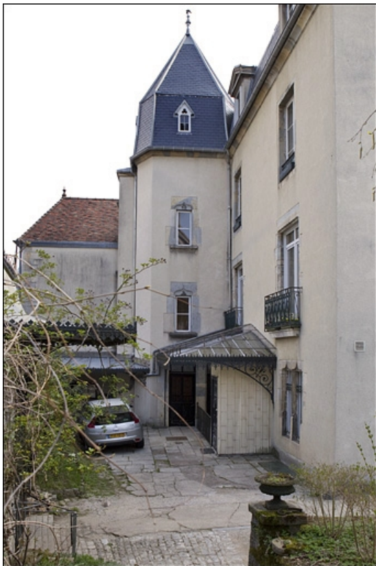
Logis principal : détail de la tour d'escalier.

25, Besançon, 12 rue de la Convention, lieudit : îlot Boitouset