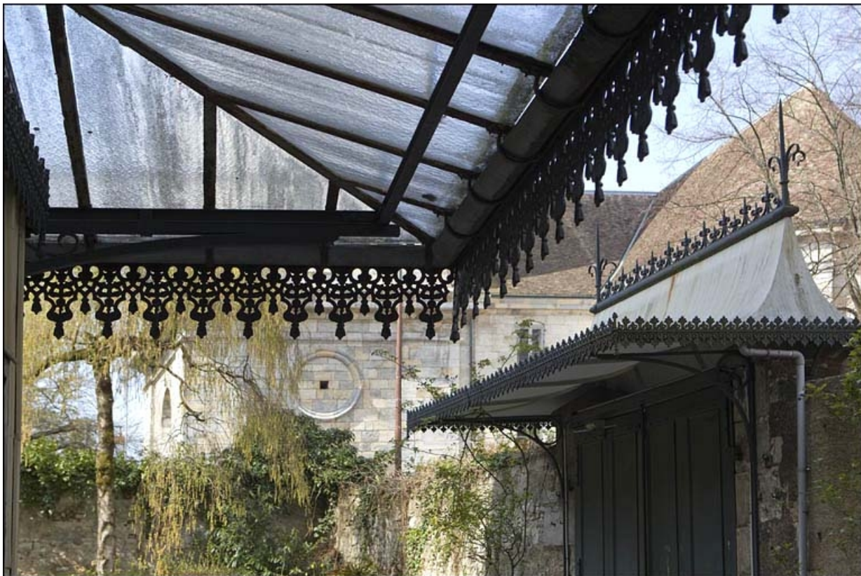
Détail du toit en tôle du portail dans clôture, depuis la porte du logis principal.

25, Besançon, 12 rue de la Convention, lieudit : îlot Boitouset