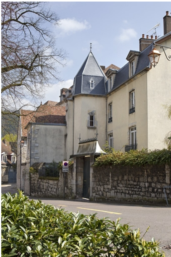
Vue d'ensemble du logis principal de trois quarts droit depuis la rue.

25, Besançon, 12 rue de la Convention, lieudit : îlot Boitouset