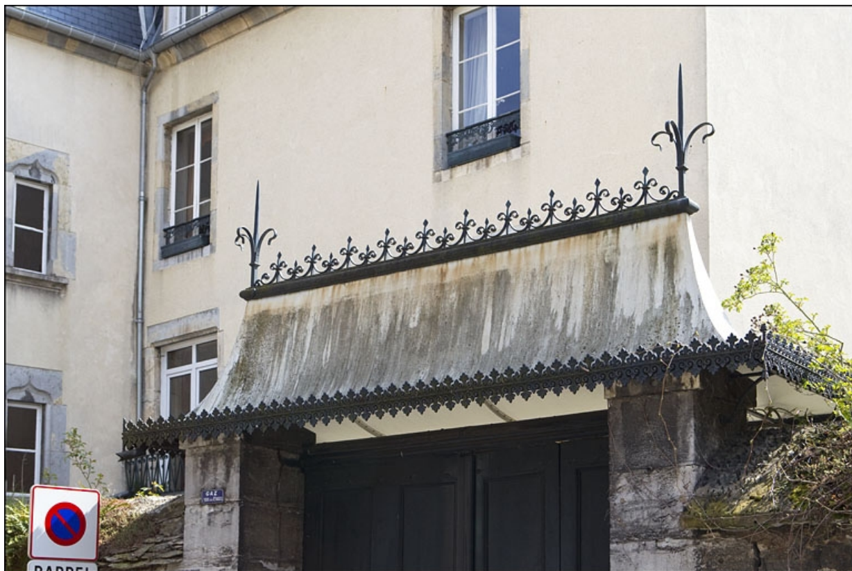
Détail de la toiture en tôle du portail dans clôture.

25, Besançon, 12 rue de la Convention, lieudit : îlot Boitouset