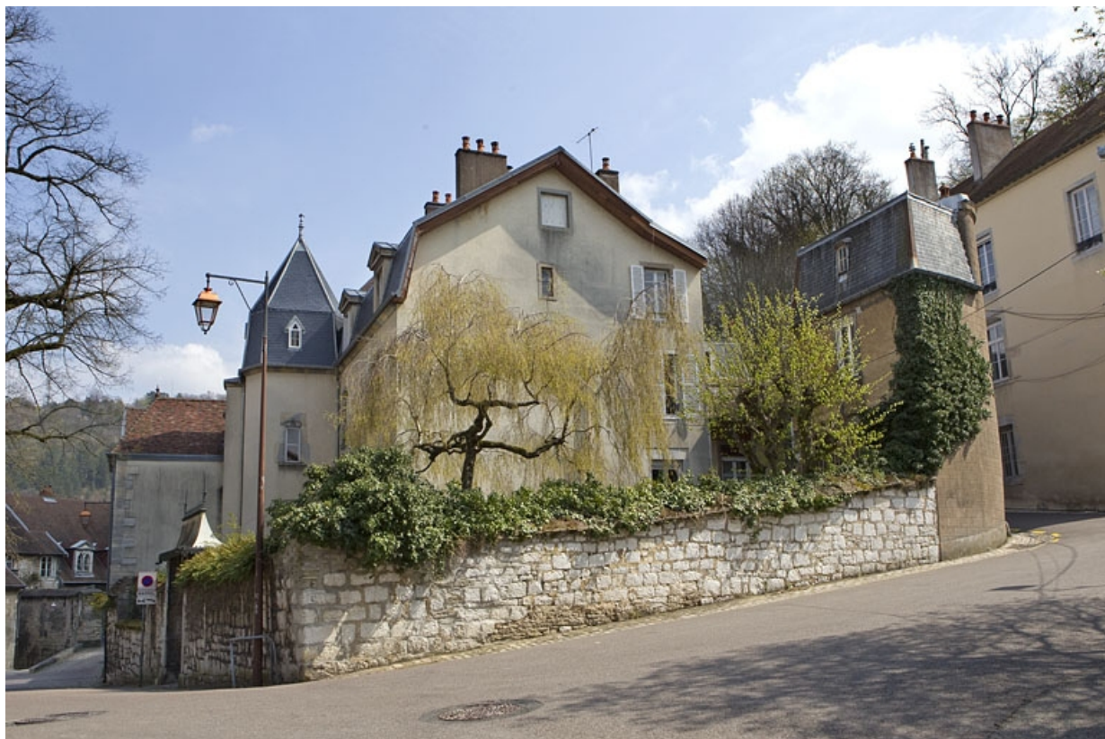
Vue d'ensemble de trois quarts droit depuis la rue.

25, Besançon, 12 rue de la Convention, lieudit : îlot Boitouset