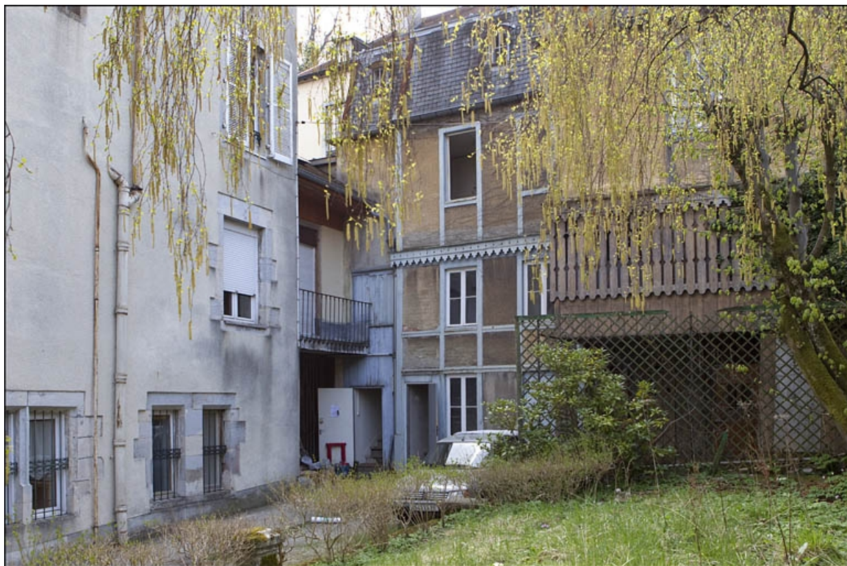
Détail de l'aile sur cour, de trois quarts droit.

25, Besançon, 12 rue de la Convention, lieudit : îlot Boitouset