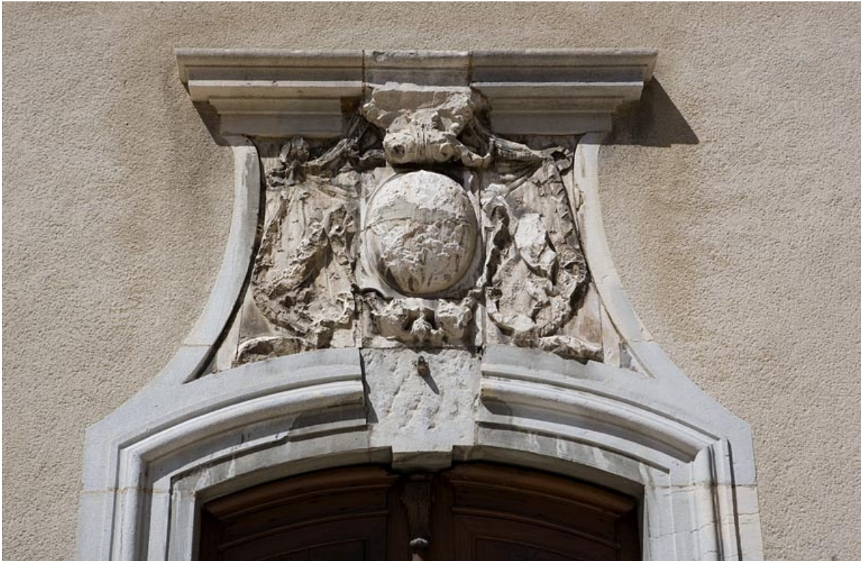
Détail des armoiries bûchées sur la porte d'entrée du logis.

25, Besançon, 11 rue de la Convention, lieudit : îlot Boitouset