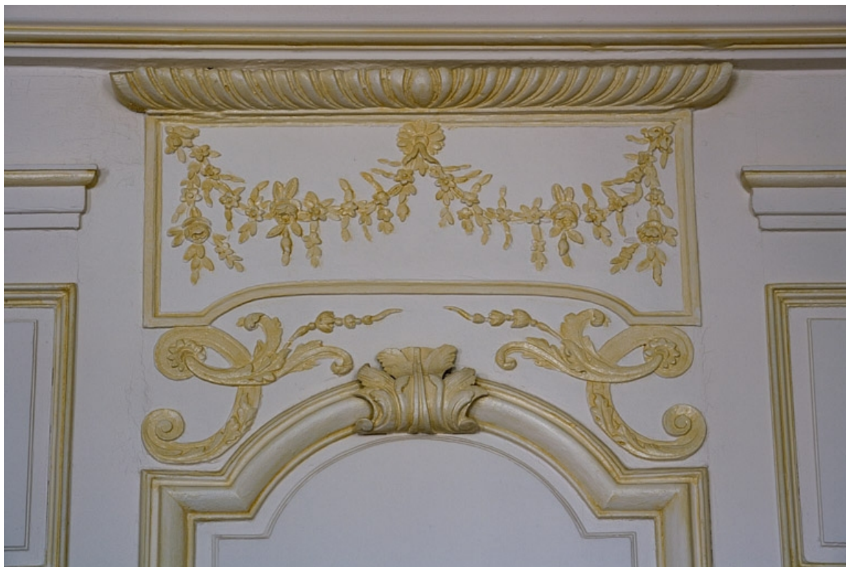
Intérieur : lambris de la chambre, détail du décor à la partie supérieure d'un panneau.

25, Besançon, 11 rue de la Convention, lieudit : îlot Boitouset