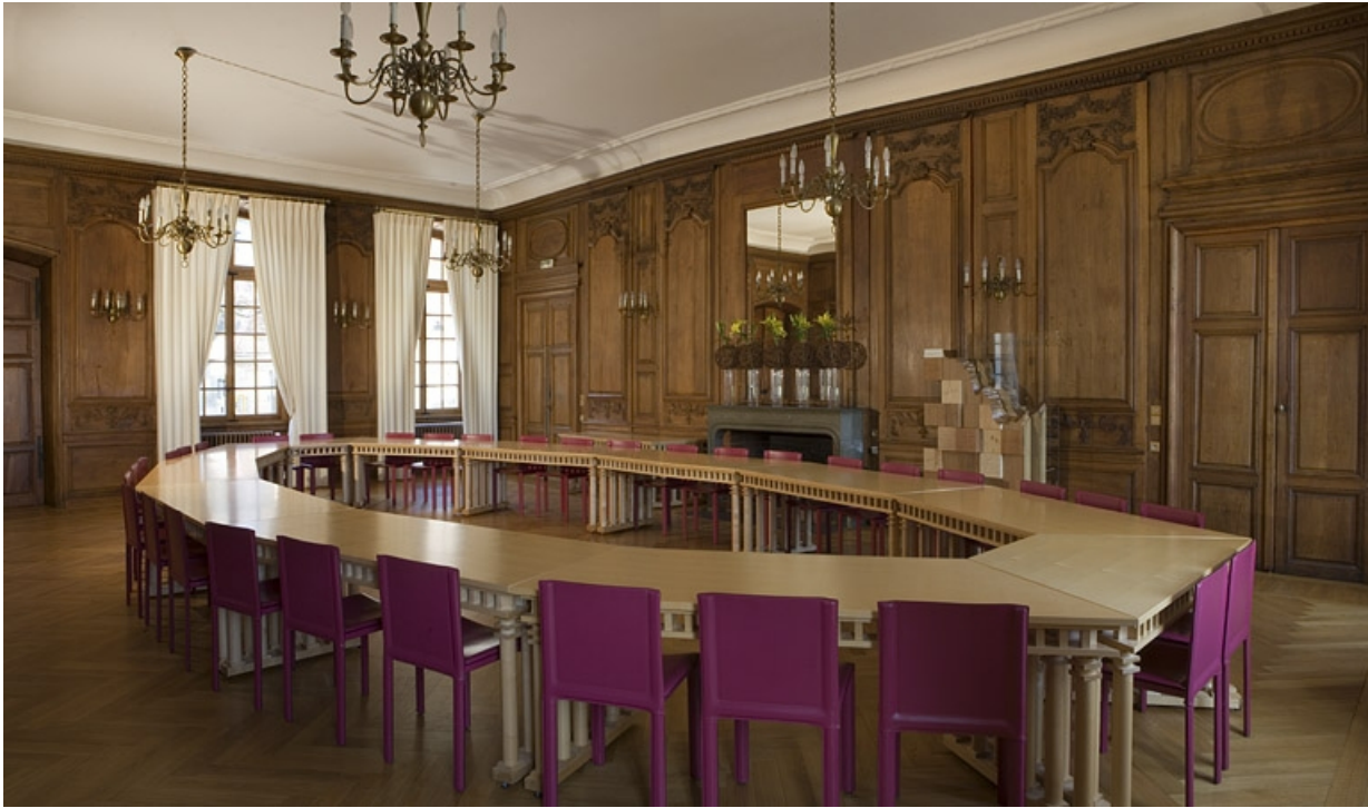
Intérieur : vue d'ensemble de la grande salle depuis le fond de la pièce.

25, Besançon, 11 rue de la Convention, lieudit : îlot Boitouset