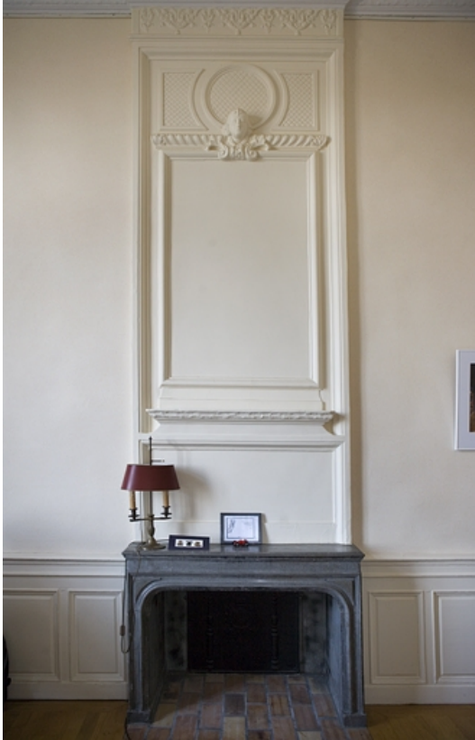
Intérieur : détail d'une cheminée dans une petite pièce du rez-de-chaussée.

25, Besançon, 11 rue de la Convention, lieudit : îlot Boitouset