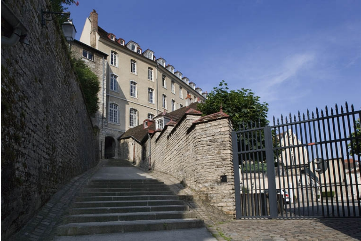
Vue de la façade postérieure depuis la rue du Chambrier.

25, Besançon, 11 rue de la Convention, lieudit : îlot Boitouset