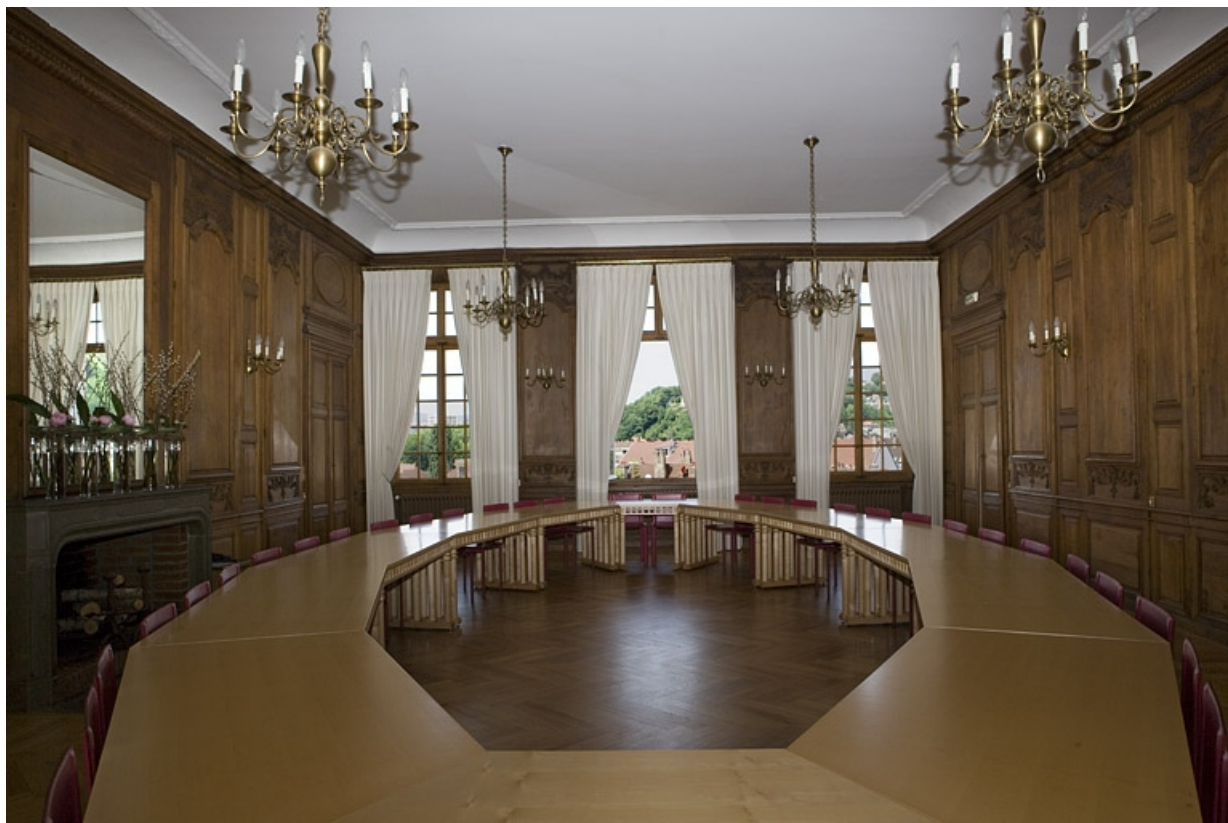
Intérieur : vue d'ensemble de la grande salle depuis l'entrée sur cour, de face.

25, Besançon, 11 rue de la Convention, lieudit : îlot Boitouset