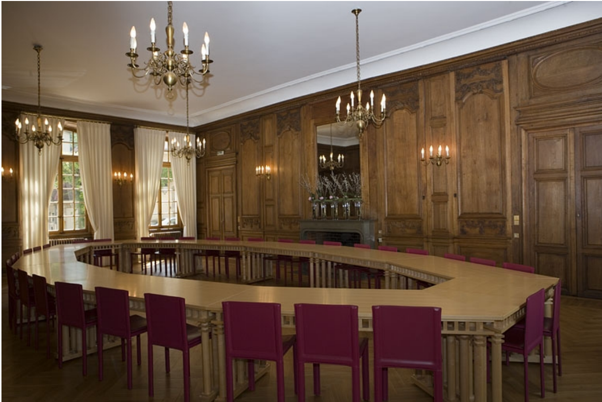
Intérieur : vue d'ensemble de la grande salle depuis le fond, de trois quarts gauche.

25, Besançon, 11 rue de la Convention, lieudit : îlot Boitouset