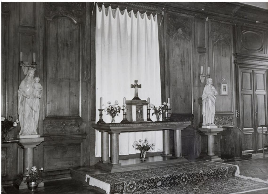
Photographie ancienne montrant le grand salon transformé en chapelle, lors de l'occupation des lieux par l'école Notre-Dame. 25, Besançon, 11 rue de la Convention, lieudit : îlot Boitouset

Photographie ancienne, 1e moitié 20e siècle. Lieu de conservation : collection particulière