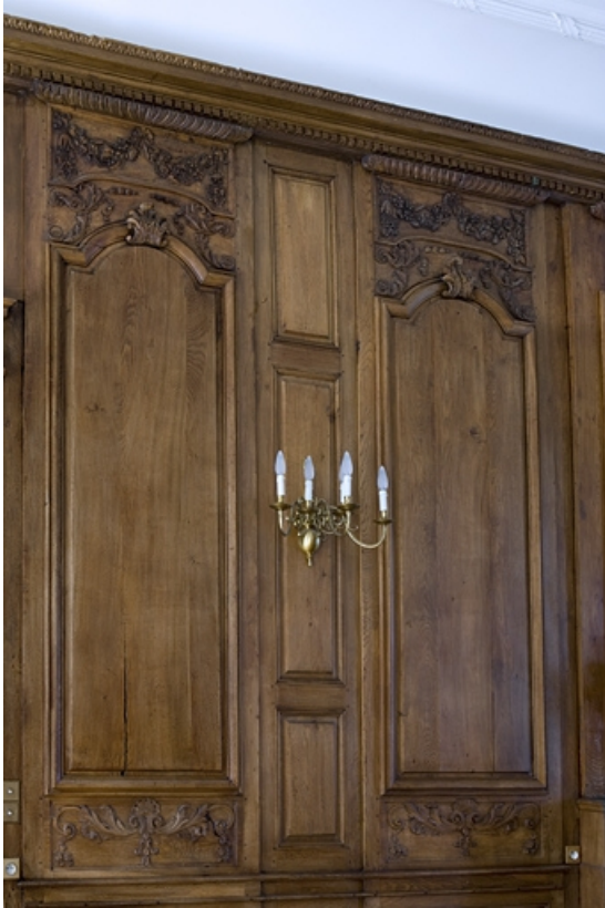
Intérieur : lambris de la grande salle, détail de deux panneaux.

25, Besançon, 11 rue de la Convention, lieudit : îlot Boitouset