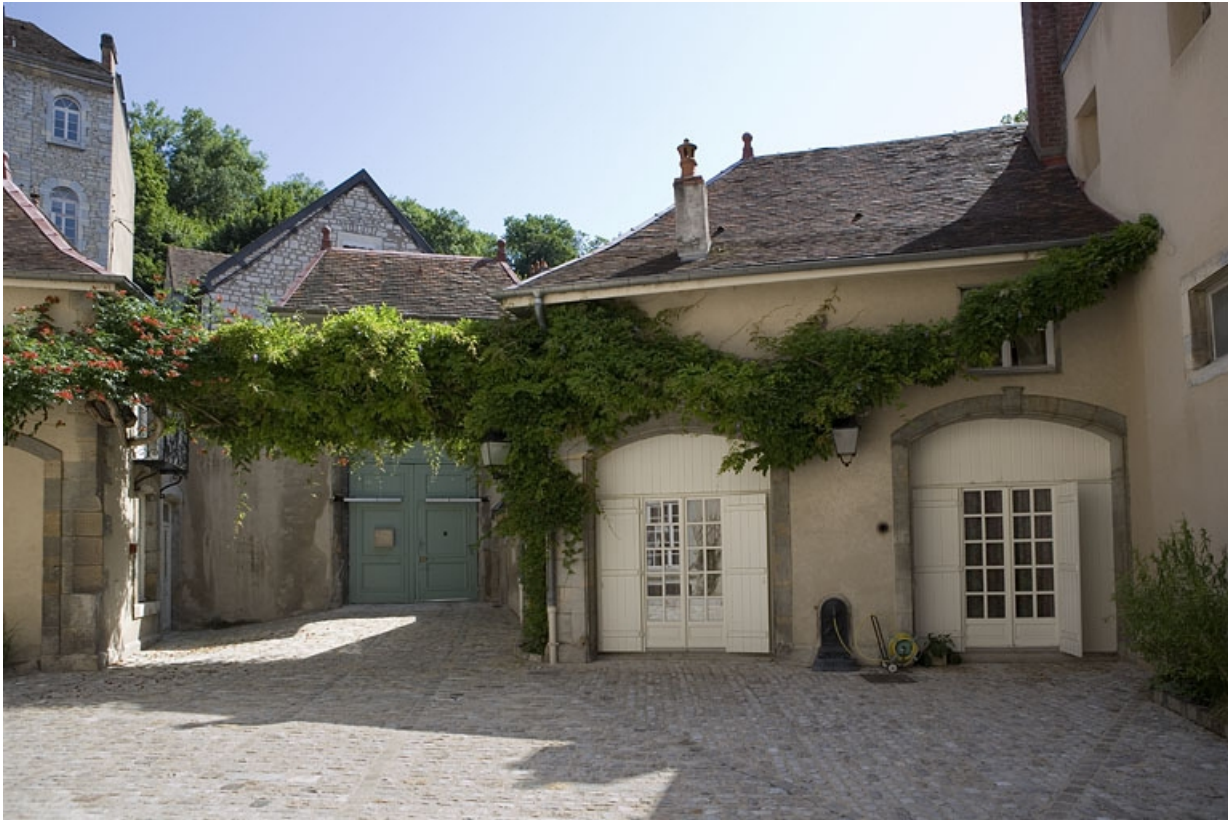
Détail des communs, partie droite de face.

25, Besançon, 11 rue de la Convention, lieudit : îlot Boitouset