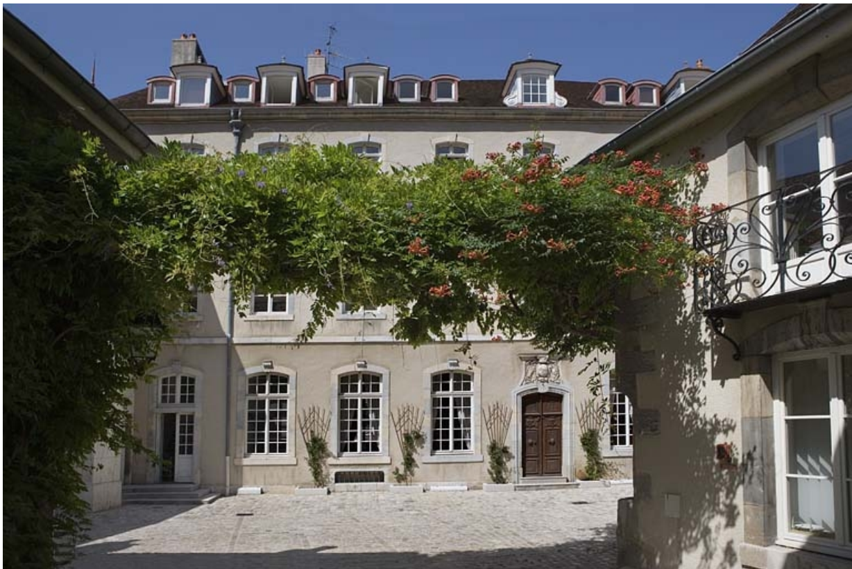
Vue d'ensemble du logis depuis le portail d'entrée.

25, Besançon, 11 rue de la Convention, lieudit : îlot Boitouset