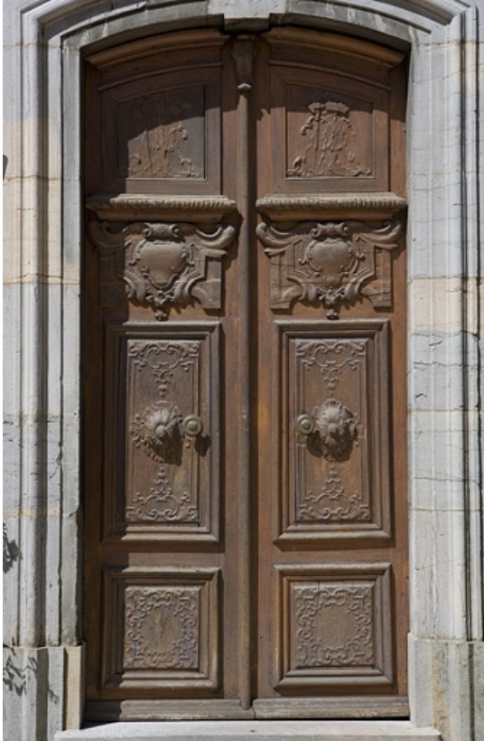
Détail des vantaux de la porte d'entrée du logis.

25, Besançon, 11 rue de la Convention, lieudit : îlot Boitouset