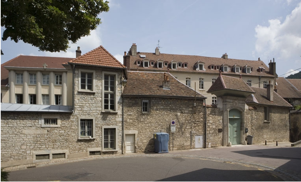
Vue d'ensemble rapprochée de la clôture et du portail depuis la rue.

25, Besançon, 11 rue de la Convention, lieudit : îlot Boitouset