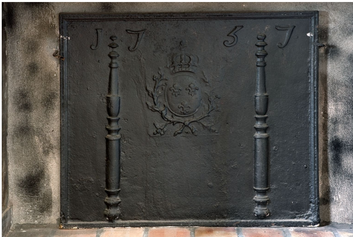
Intérieur : détail de la plaque de cheminée de l'ancienne cuisine.

25, Besançon, 11 rue de la Convention, lieudit : îlot Boitouset