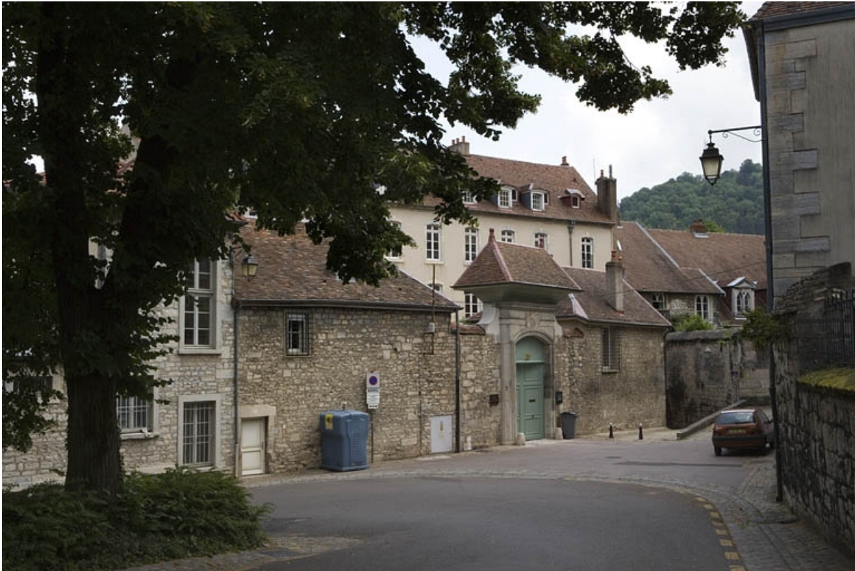
Vue d'ensemble du portail d'entrée depuis l'extérieur.

25, Besançon, 11 rue de la Convention, lieudit : îlot Boitouset