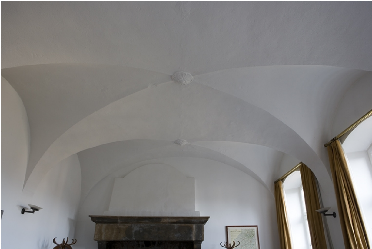
Intérieur : détail des voûtes d'arêtes de l'ancienne cuisine.

25, Besançon, 11 rue de la Convention, lieudit : îlot Boitouset