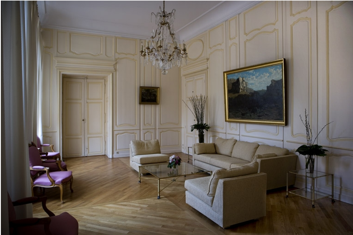
Intérieur : vue d'ensemble de l'antichambre depuis l'entrée.

25, Besançon, 11 rue de la Convention, lieudit : îlot Boitouset