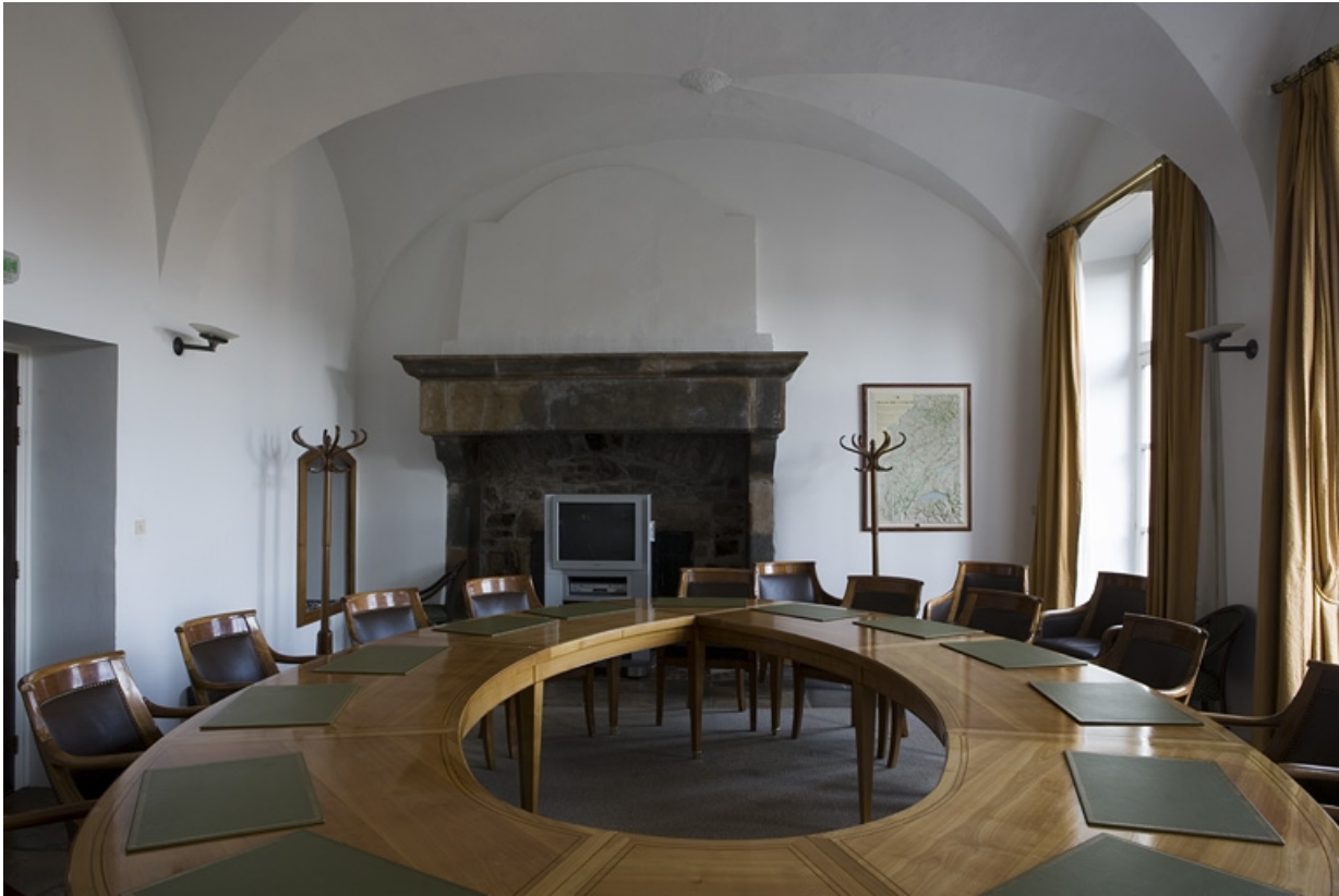
Intérieur : vue d'ensemble de l'ancienne cuisine.

25, Besançon, 11 rue de la Convention, lieudit : îlot Boitouset