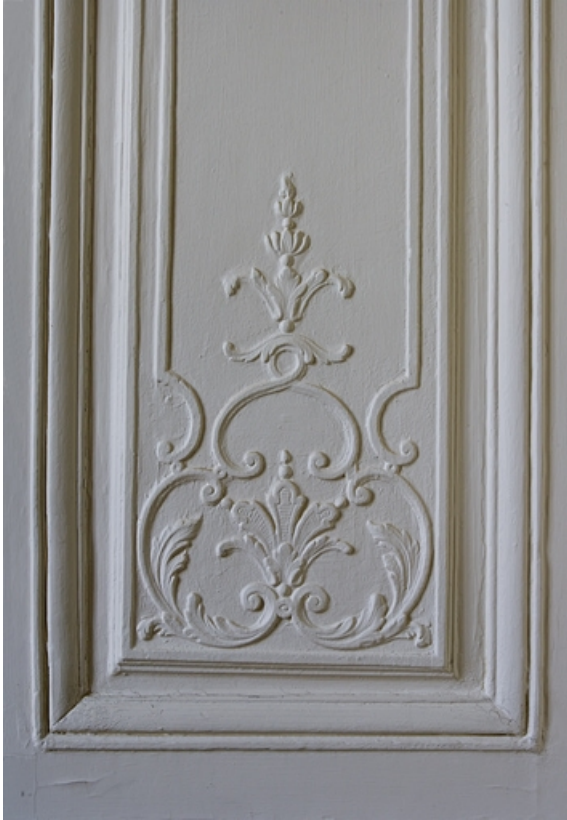
Intérieur : lambris d'un ancien cabinet, détail du décor à la partie inférieure d'un panneau. 25, Besançon, 11 rue de la Convention, lieudit : îlot Boitouset