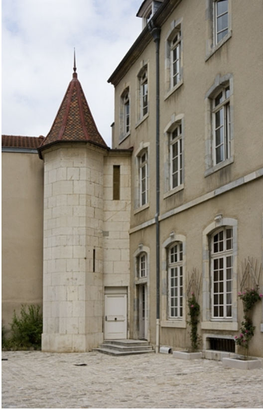
Façade antérieure, détail de la tour d'escalier, vue éloignée.

25, Besançon, 11 rue de la Convention, lieudit : îlot Boitouset