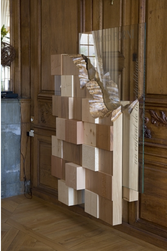
Intérieur : vue d'ensemble de la sculpture dédiée au président Raymond Forni, de trois-quarts.

25, Besançon, 11 rue de la Convention, lieudit : îlot Boitouset