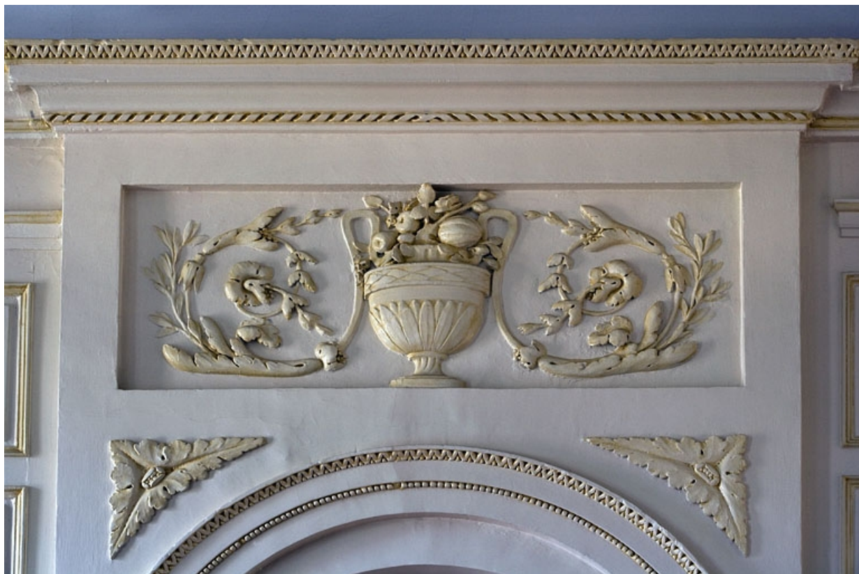
Intérieur : chambre, détail du décor au-dessus de la niche du poêle.

25, Besançon, 11 rue de la Convention, lieudit : îlot Boitouset