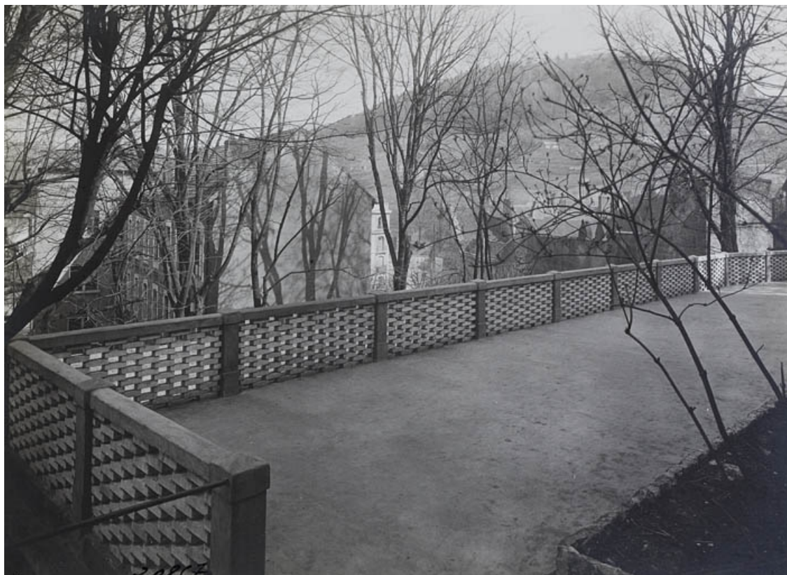
Photographie ancienne montrant la terrasse (disparue) derrière l'édifice.

25, Besançon, 11 rue de la Convention, lieudit : îlot Boitouset