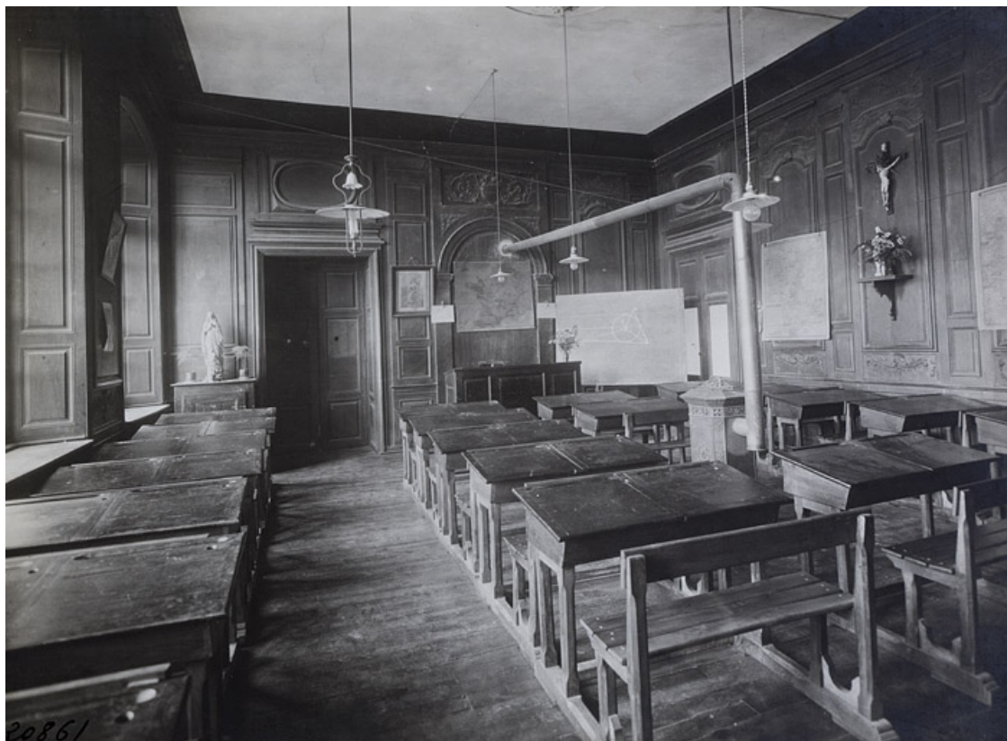
Photographie ancienne montrant la chambre, transformée en salle de classe, lors de l'occupation des lieux par l'école Notre-Dame. 25, Besançon, 11 rue de la Convention, lieudit : îlot Boitouset

Photographie ancienne, 1e moitié 20e siècle.