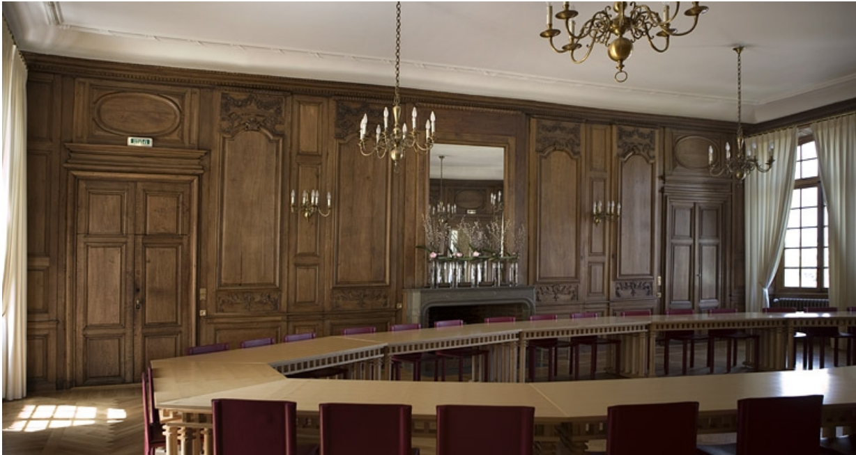
Intérieur : vue d'ensemble de la grande salle, depuis l'entrée vers l'antichambre.

25, Besançon, 11 rue de la Convention, lieudit : îlot Boitouset