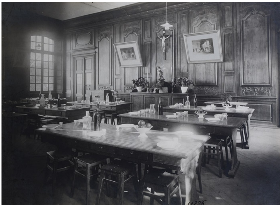
Photographie du grand salon, transformé en réfectoire, lors de l'occupation des lieux par l'école Notre-Dame. 25, Besançon, 11 rue de la Convention, lieudit : îlot Boitouset

Photographie ancienne, 1e moitié 20e siècle. Lieu de conservation : collection particulière