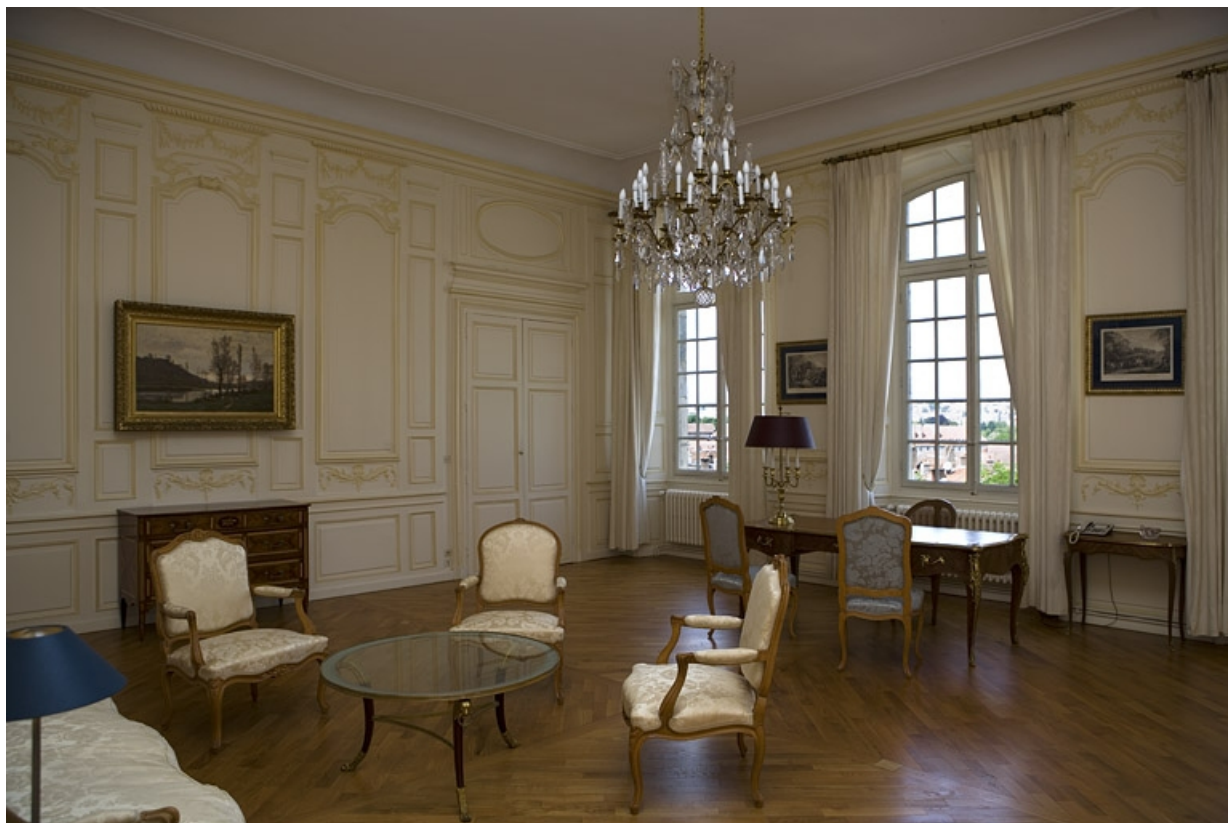
Intérieur : vue d'ensemble de la chambre depuis l'entrée vers l'antichambre.

25, Besançon, 11 rue de la Convention, lieudit : îlot Boitouset