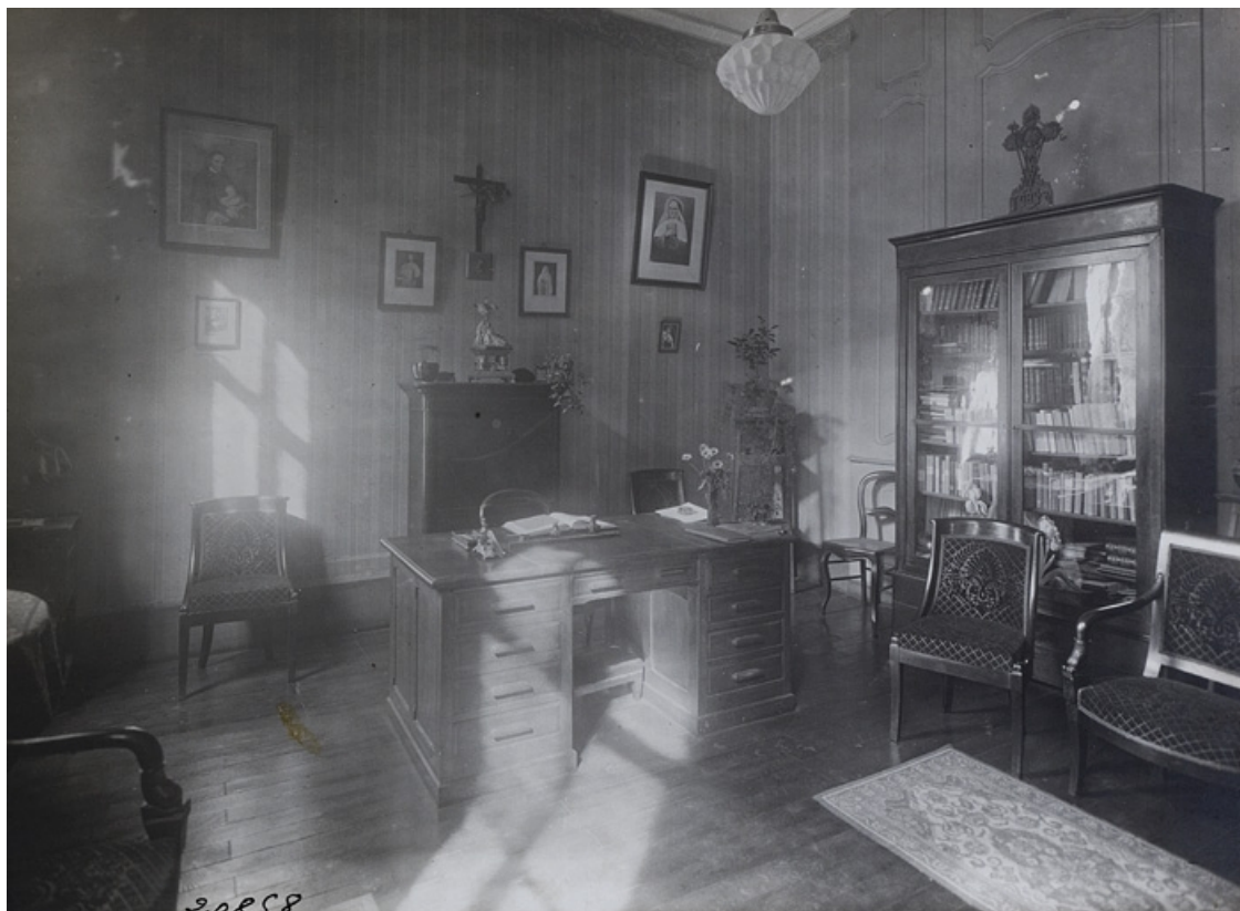
Photographie ancienne montrant l'antichambre transformée en bureau pour la directrice de l'école Notre-Dame. 25, Besançon, 11 rue de la Convention, lieudit : îlot Boitouset

Photographie ancienne, 1e moitié 20e siècle. Lieu de conservation : collection particulière