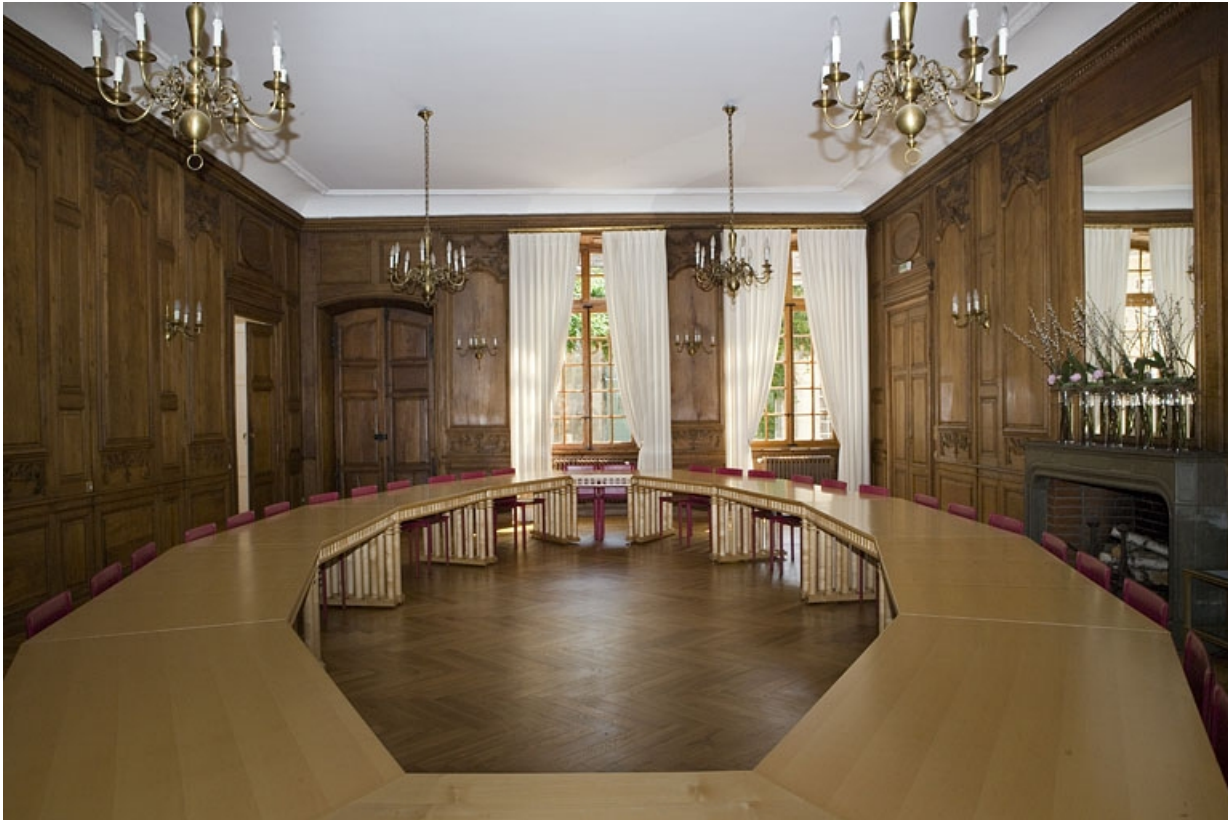
Intérieur : vue d'ensemble de la grande salle depuis le fond, de face.

25, Besançon, 11 rue de la Convention, lieudit : îlot Boitouset