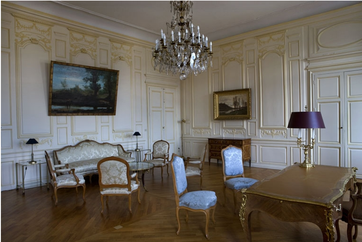
Intérieur : vue d'ensemble de la chambre depuis le fond de la pièce, de trois quarts gauche.

25, Besançon, 11 rue de la Convention, lieudit : îlot Boitouset