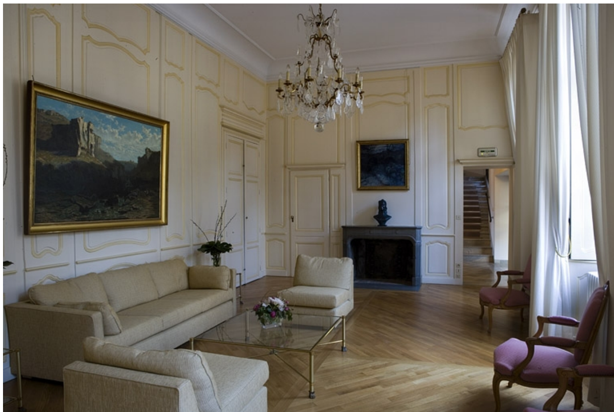
Intérieur : vue d'ensemble de l'antichambre depuis le fond de la pièce.

25, Besançon, 11 rue de la Convention, lieudit : îlot Boitouset