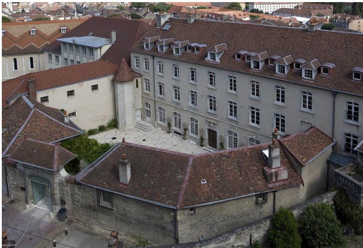
Vue d'ensemble rapprochée des bâtiments autour de la cour.

25, Besançon, 11 rue de la Convention, lieudit : îlot Boitouset