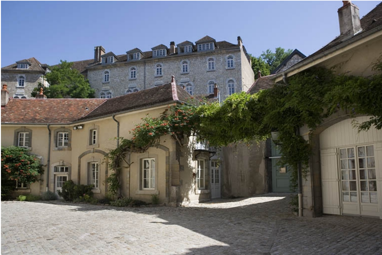
Détail des communs, partie gauche de trois quart droit. 25, Besançon, 11 rue de la Convention, lieudit : îlot Boitouset