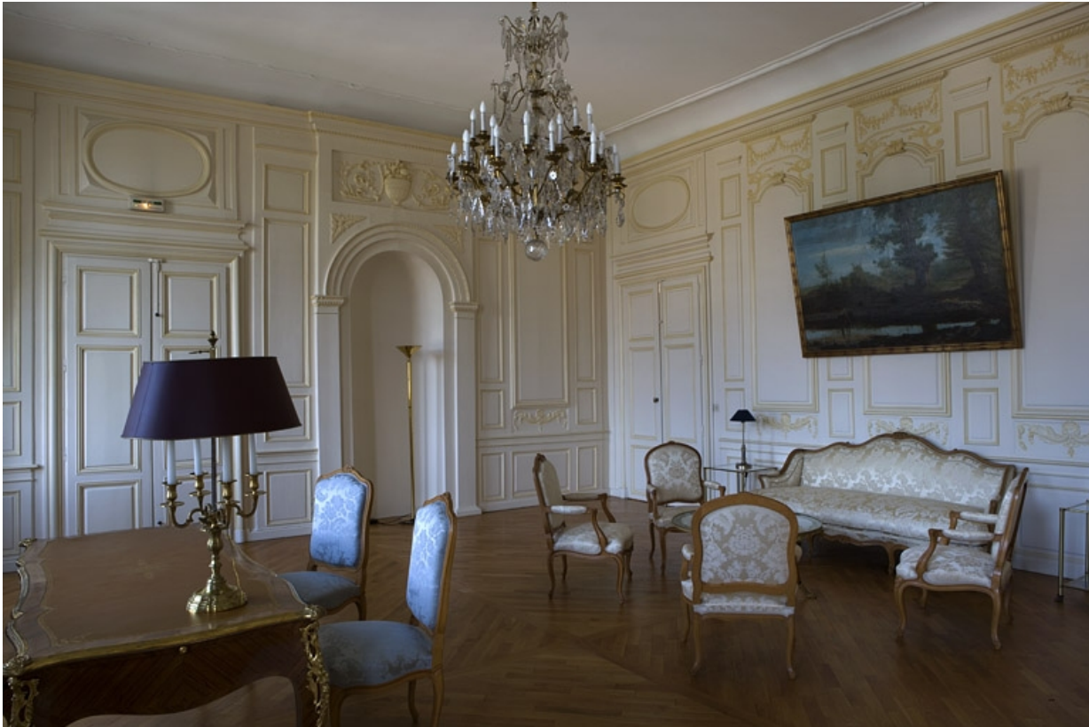
Intérieur : vue d'ensemble de la chambre depuis l'entrée vers la grande salle.

25, Besançon, 11 rue de la Convention, lieudit : îlot Boitouset