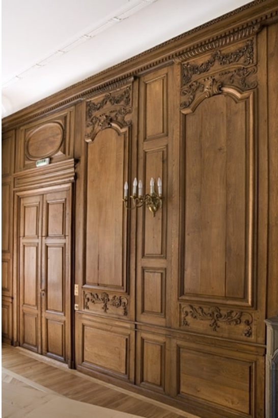
Intérieur : lambris de la grande salle à gauche de la cheminée, de trois quarts.

25, Besançon, 11 rue de la Convention, lieudit : îlot Boitouset