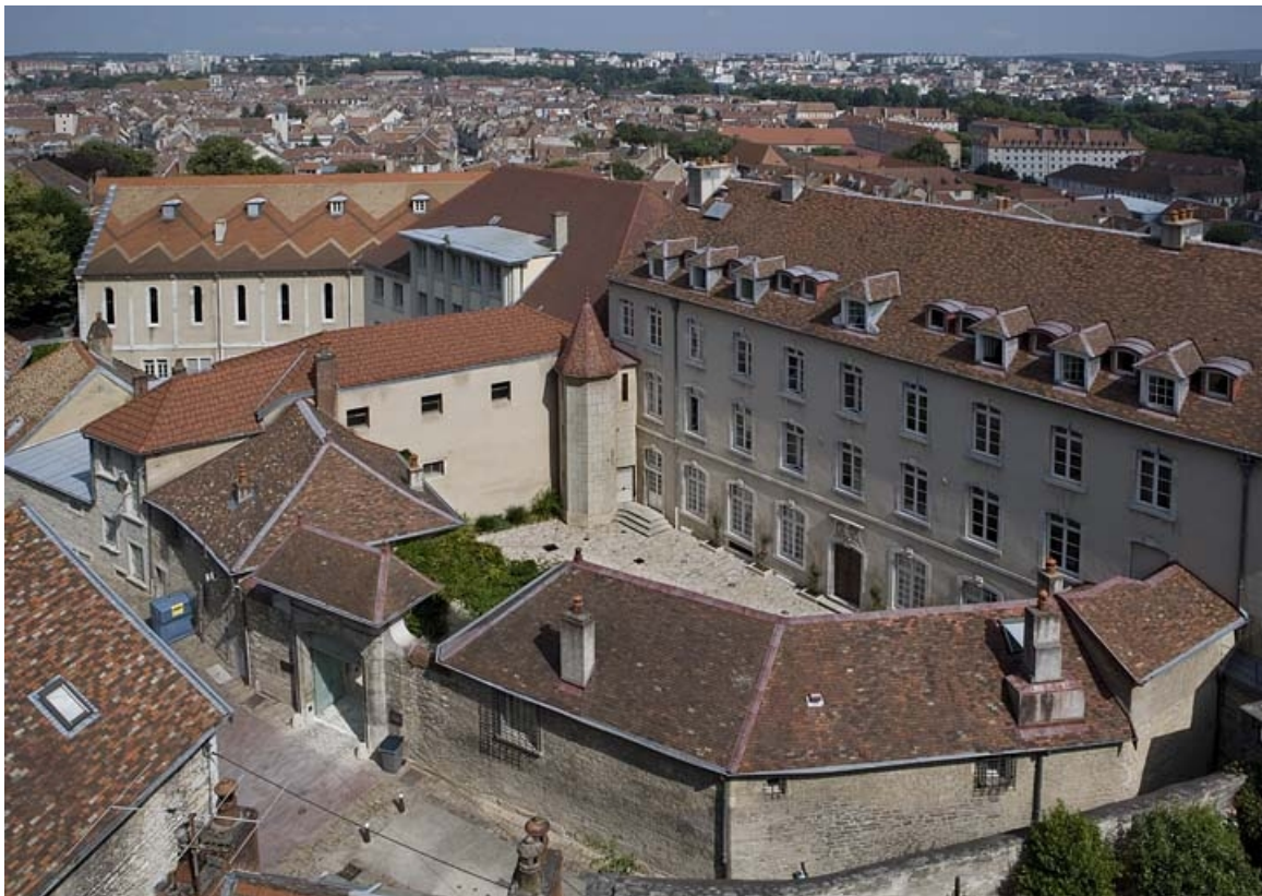
Vue d'ensemble des bâtiments autour de la cour.

25, Besançon, 11 rue de la Convention, lieudit : îlot Boitouset