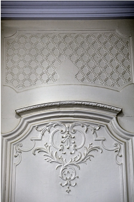
Intérieur : détail d'un lambris d'un ancien cabinet.

25, Besançon, 11 rue de la Convention, lieudit : îlot Boitouse