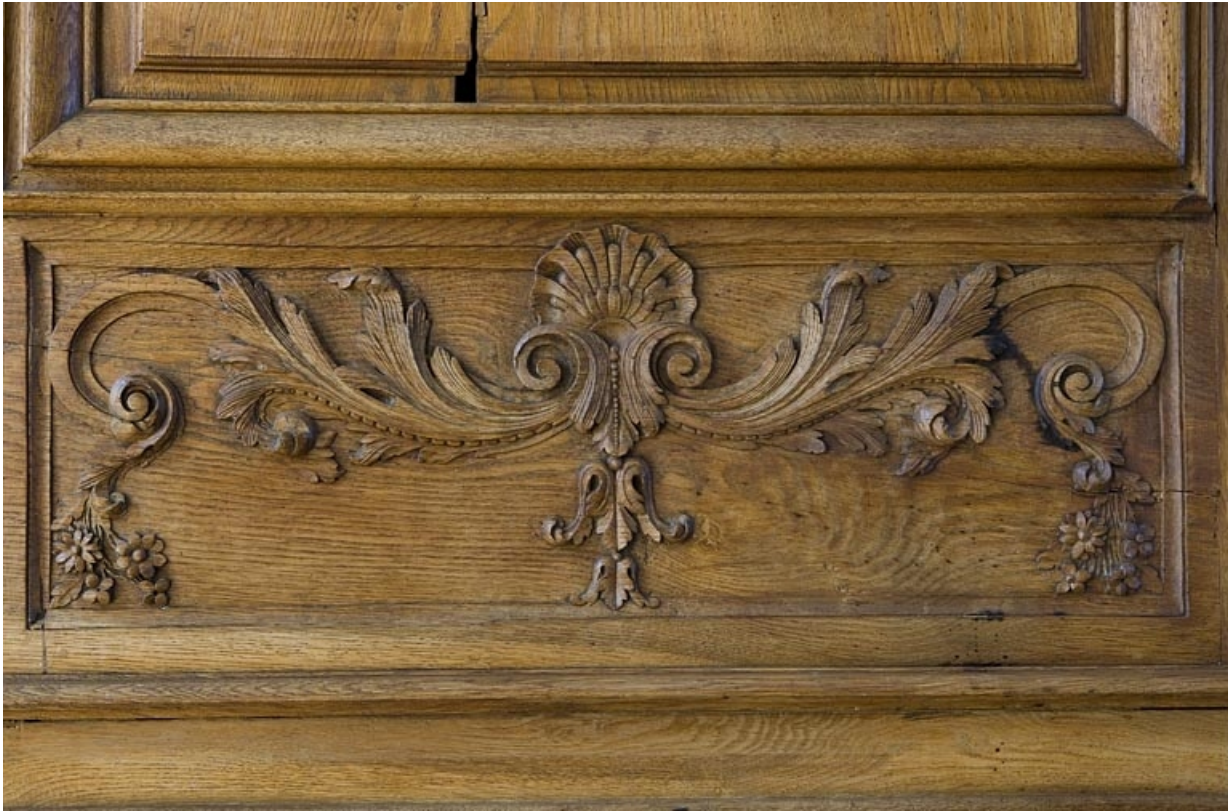
Intérieur : lambris de la grande salle, détail d'un petit panneau sculpté.

25, Besançon, 11 rue de la Convention, lieudit : îlot Boitouset