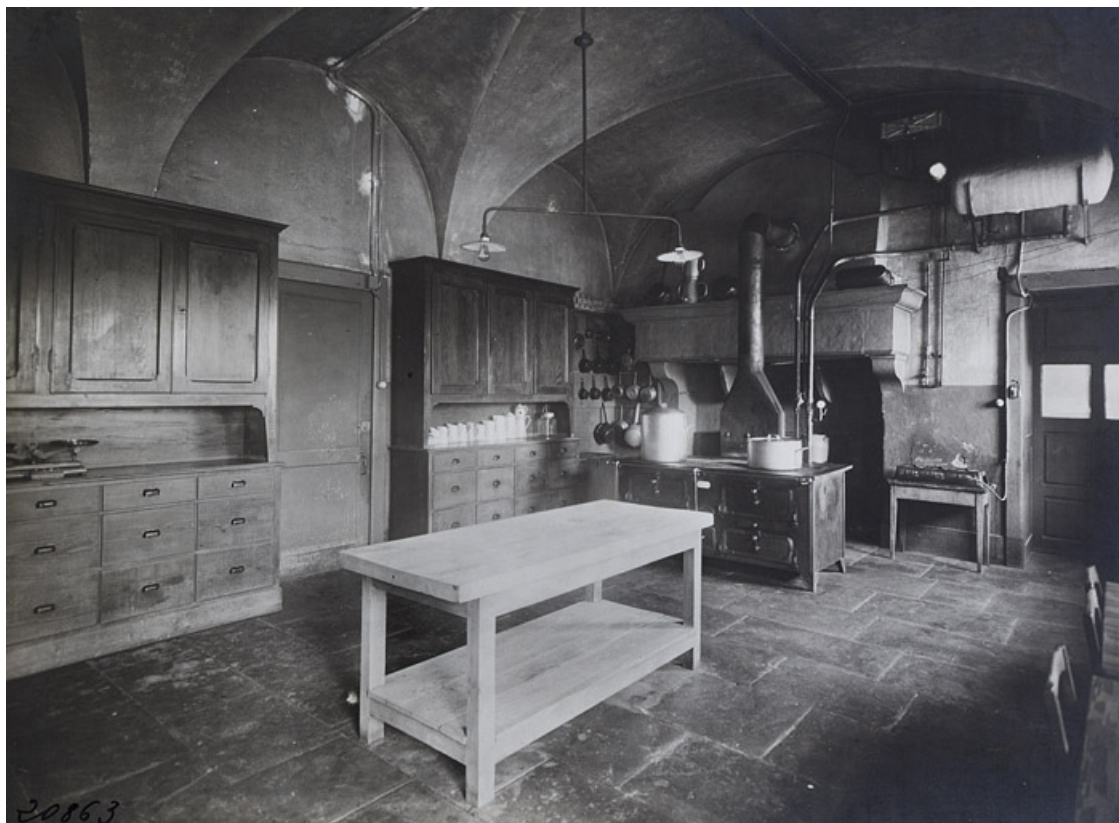
Photographie ancienne montrant la cuisine.

25, Besançon, 11 rue de la Convention, lieudit : îlot Boitouset