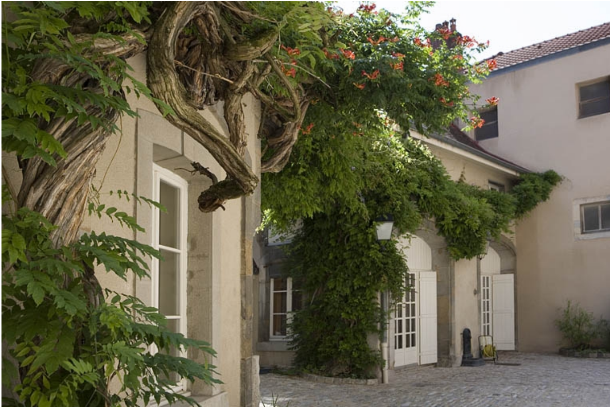
Détail des communs, vue rapprochée de trois quarts gauche.

25, Besançon, 11 rue de la Convention, lieudit : îlot Boitouset