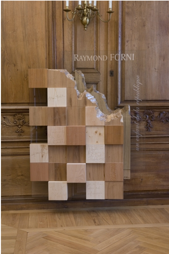
Intérieur : vue d'ensemble de la sculpture dédiée au président Raymond Forni, de face.

25, Besançon, 11 rue de la Convention, lieudit : îlot Boitouset