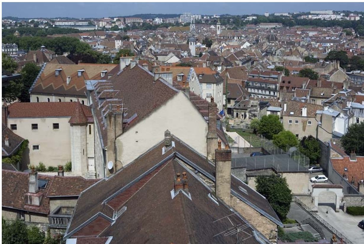
Vue d'ensemble éloignée de profil depuis les locaux du CRDP.

25, Besançon, 11 rue de la Convention, lieudit : îlot Boitouset