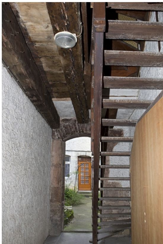
Vue d'ensemble du passage sous l'escalier à cage ouverte.

25, Besançon, 28 rue Rivotte, lieudit : îlot Boitouset