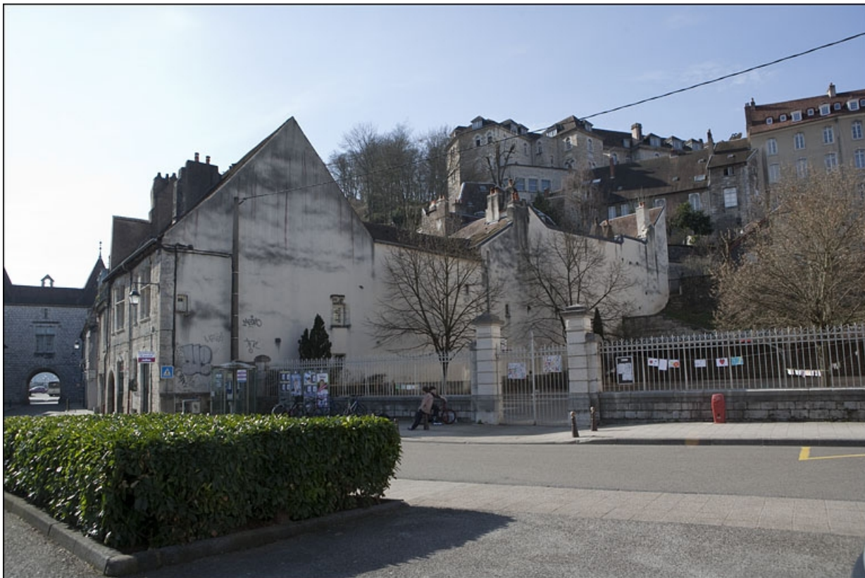
Vue d'ensemble de l'édifice depuis la rue, de trois quarts droit.

25, Besançon, 28 rue Rivotte, lieudit : îlot Boitouset