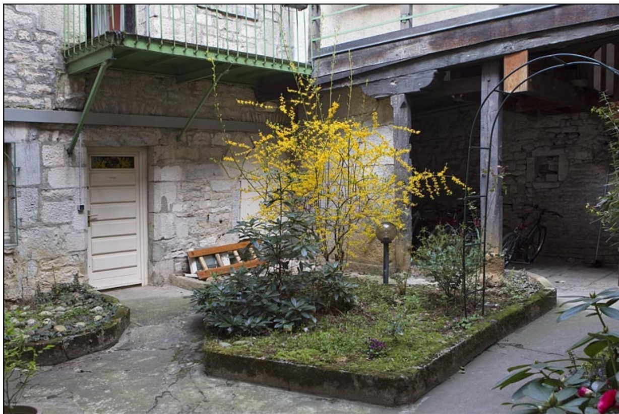
Détail du fond de la première cour, de trois quarts droit.

25, Besançon, 28 rue Rivotte, lieudit : îlot Boitouset