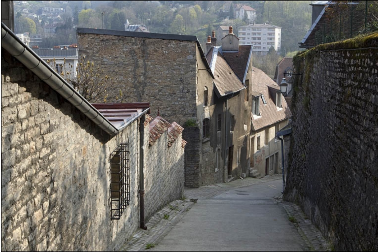
Façade latérale gauche du logis secondaire, en descendant la rue du Chambrier.

25, Besançon, 28 rue Rivotte, lieudit : îlot Boitouset