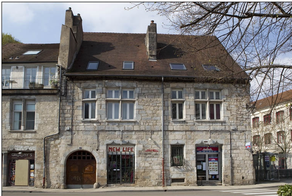
Vue d'ensemble du logis principal depuis la rue, de face.

25, Besançon, 28 rue Rivotte, lieudit : îlot Boitouset