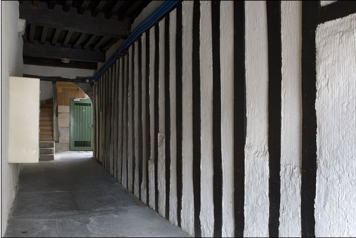
Vue du mur latéral droit, en pan de bois, du passage cocher.

25, Besançon, 28 rue Rivotte, lieudit : îlot Boitouset