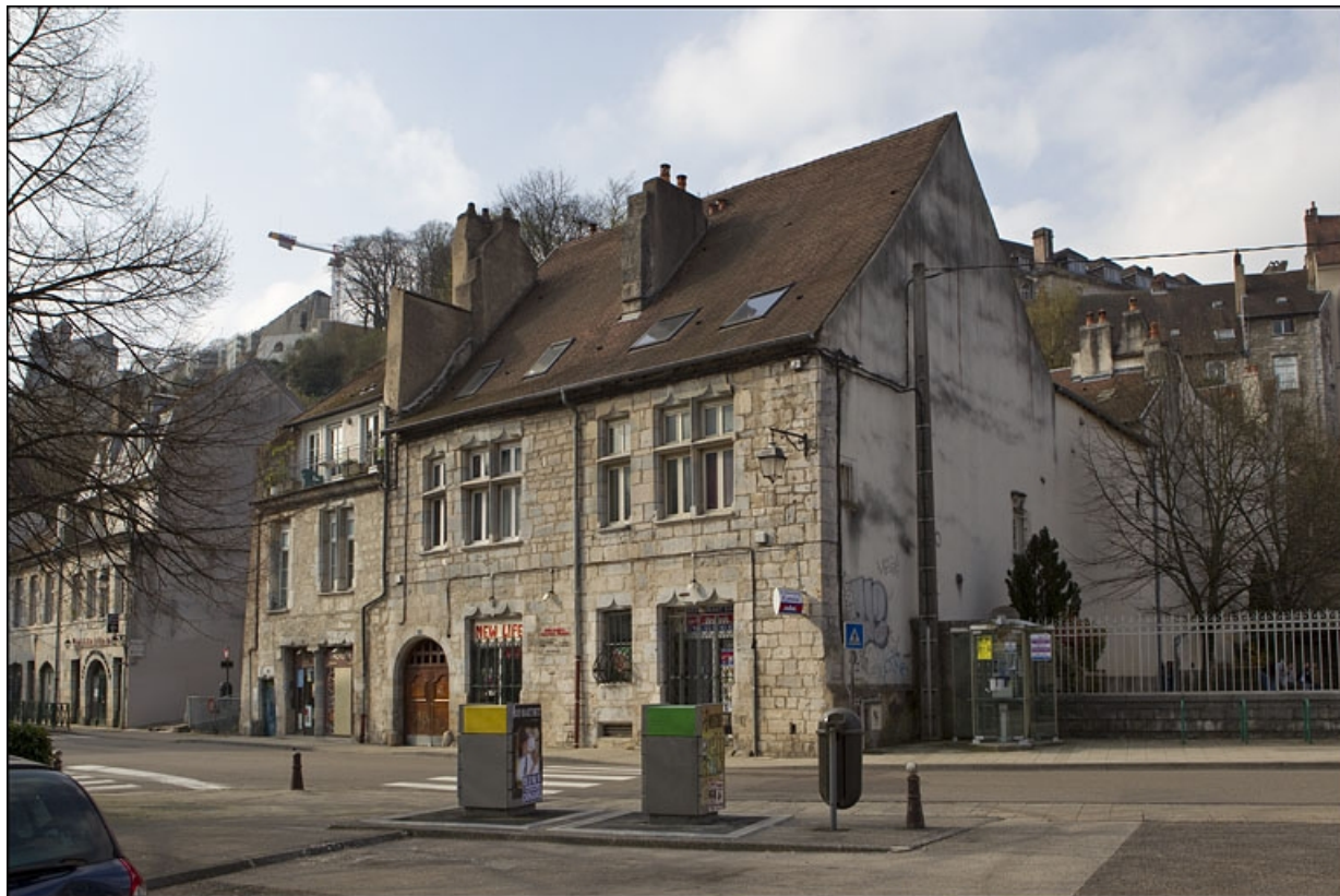
Vue d'ensemble du logis principal depuis la rue, de trois quarts droit.

25, Besançon, 28 rue Rivotte, lieudit : îlot Boitouset