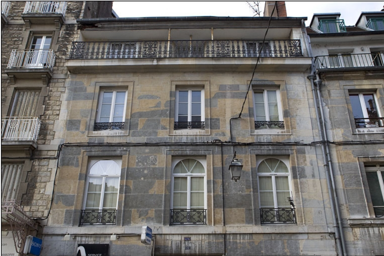
Vue de la façade antérieure sur rue du logis principal à partir du premier étage.

25, Besançon, 22 rue Rivotte, lieudit : îlot Boitouset