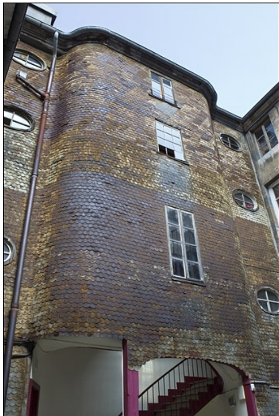
Vue d'ensemble de l'escalier à cage ouverte depuis la cour.

25, Besançon, 22 rue Rivotte, lieudit : îlot Boitouset