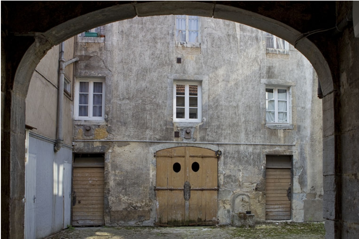
Façade antérieure du deuxième logis secondaire depuis le passage cocher. 25, Besançon, 22 rue Rivotte, lieudit : îlot Boitouset