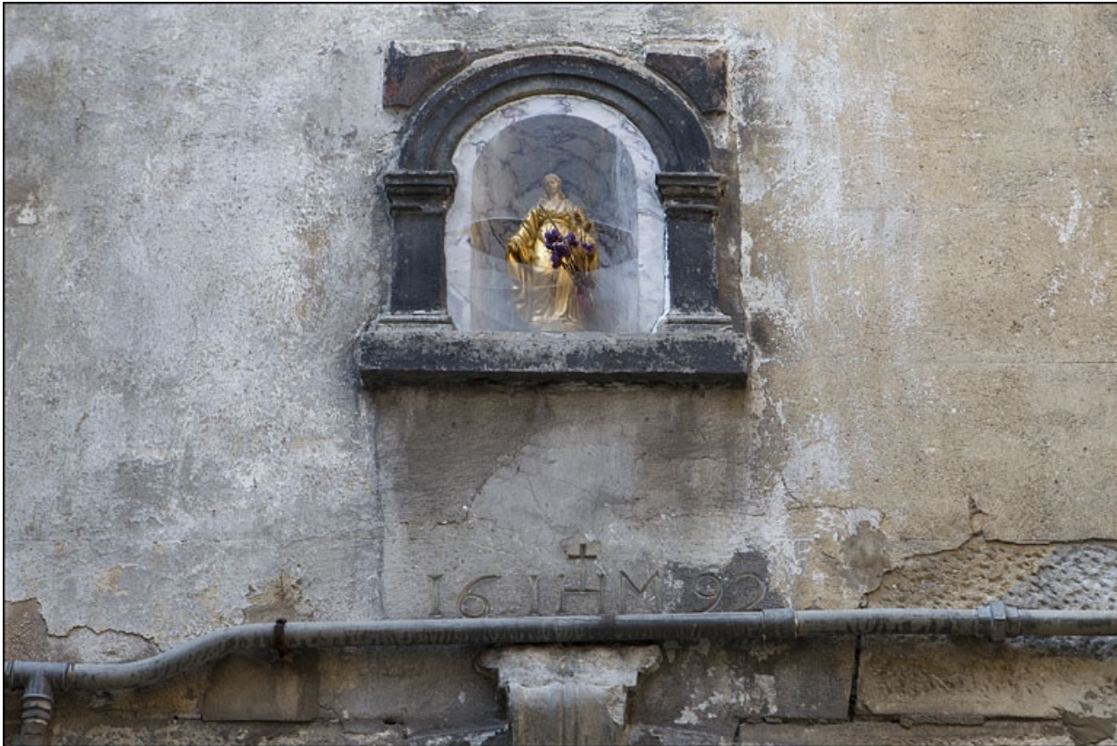
Détail de la niche sur la façade antérieure du premier logis secondaire.

25, Besançon, 22 rue Rivotte, lieudit : îlot Boitouset