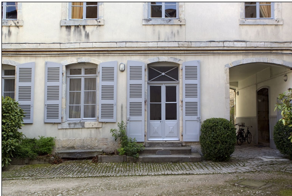
Détail du rez-de-chaussée de l'aile gauche du logis secondaire.

25, Besançon, 8 rue Péclet, lieudit : îlot Boitouset