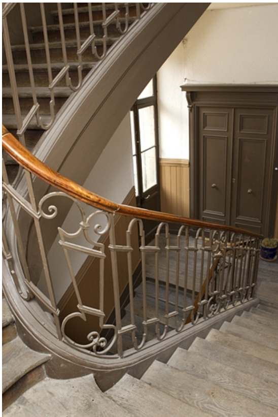
Vue de l'intérieur de l'escalier.

25, Besançon, 8 rue Péclet, lieudit : îlot Boitouset