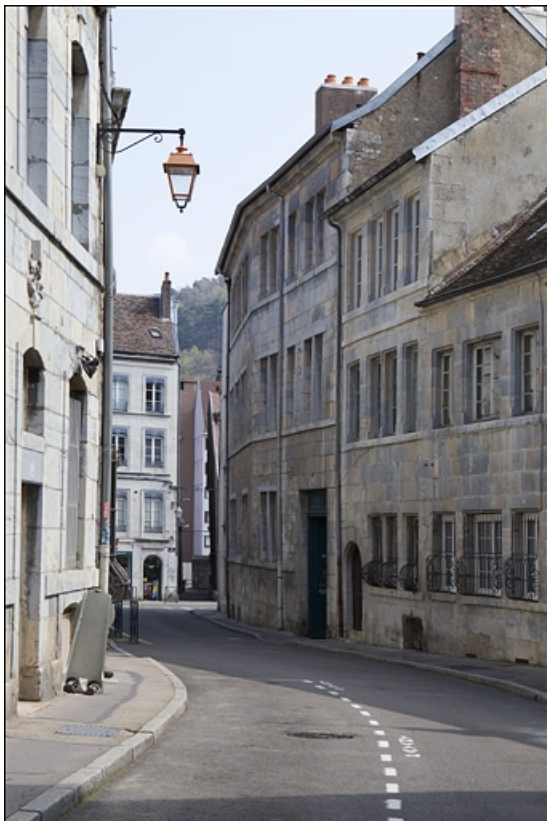
Façade antérieure du logis principal, de trois quarts droit.

25, Besançon, 8 rue Péclet, lieudit : îlot Boitouset