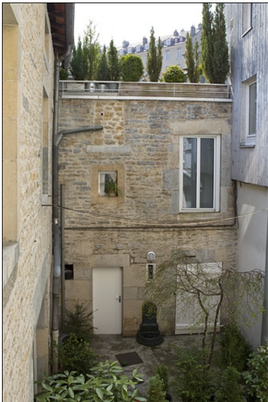
Vue de la façade antérieure de la maison donnant sur l'ancienne basse-cour. 25, Besançon, 8 rue Pécelet, lieudit : îlot Boitouset