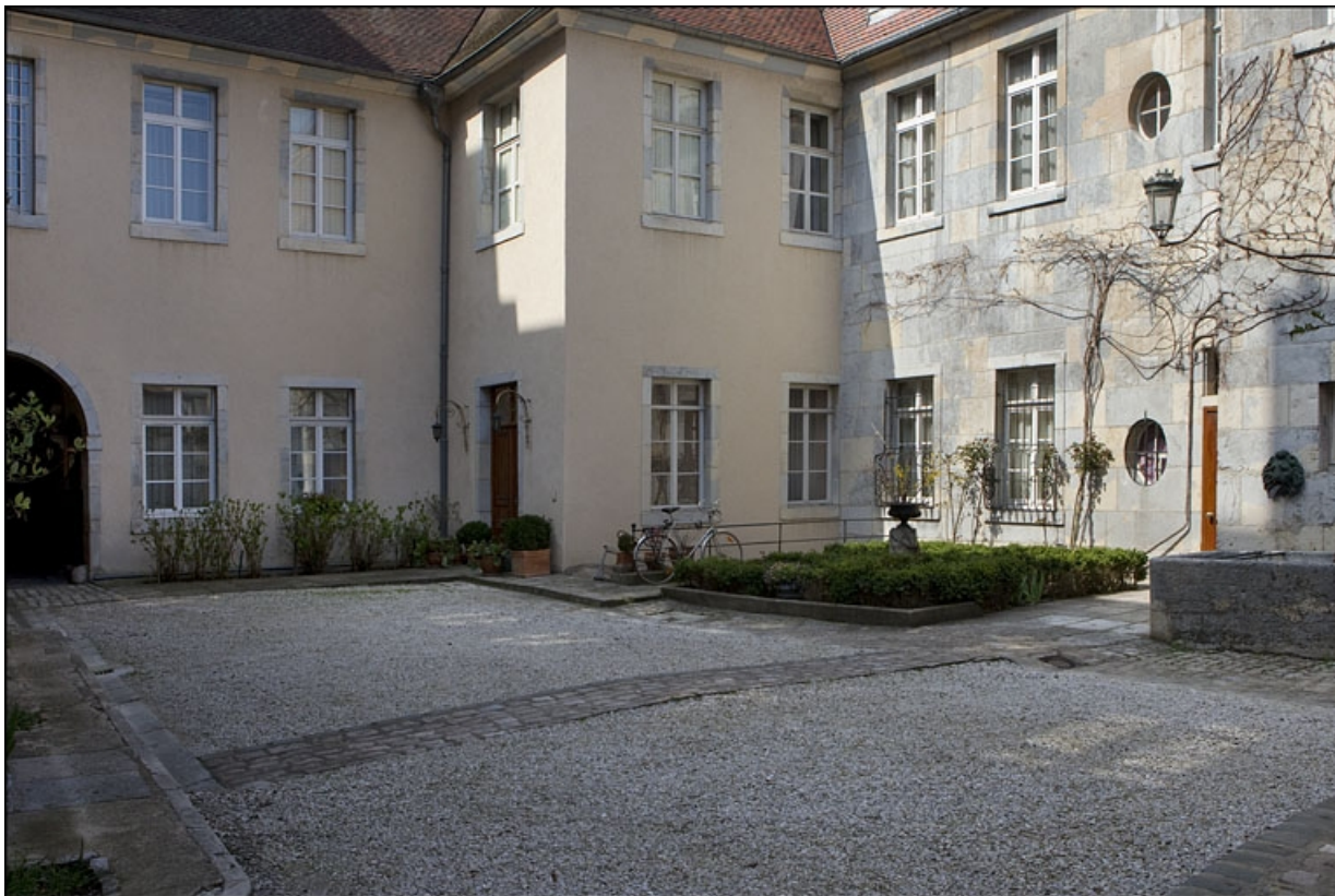
Vue d'ensemble de l'angle entre l'aile sur cour et la façade postérieure du logis principal.

25, Besançon, 6 place Castan, lieu-dit : îlot Boitouset