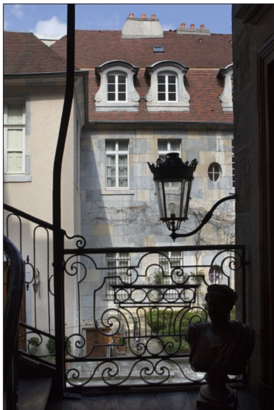
Vue de l'aile sur cour, depuis l'escalier à cage ouverte.

25, Besançon, 6 place Castan, lieudit : îlot Boitouset