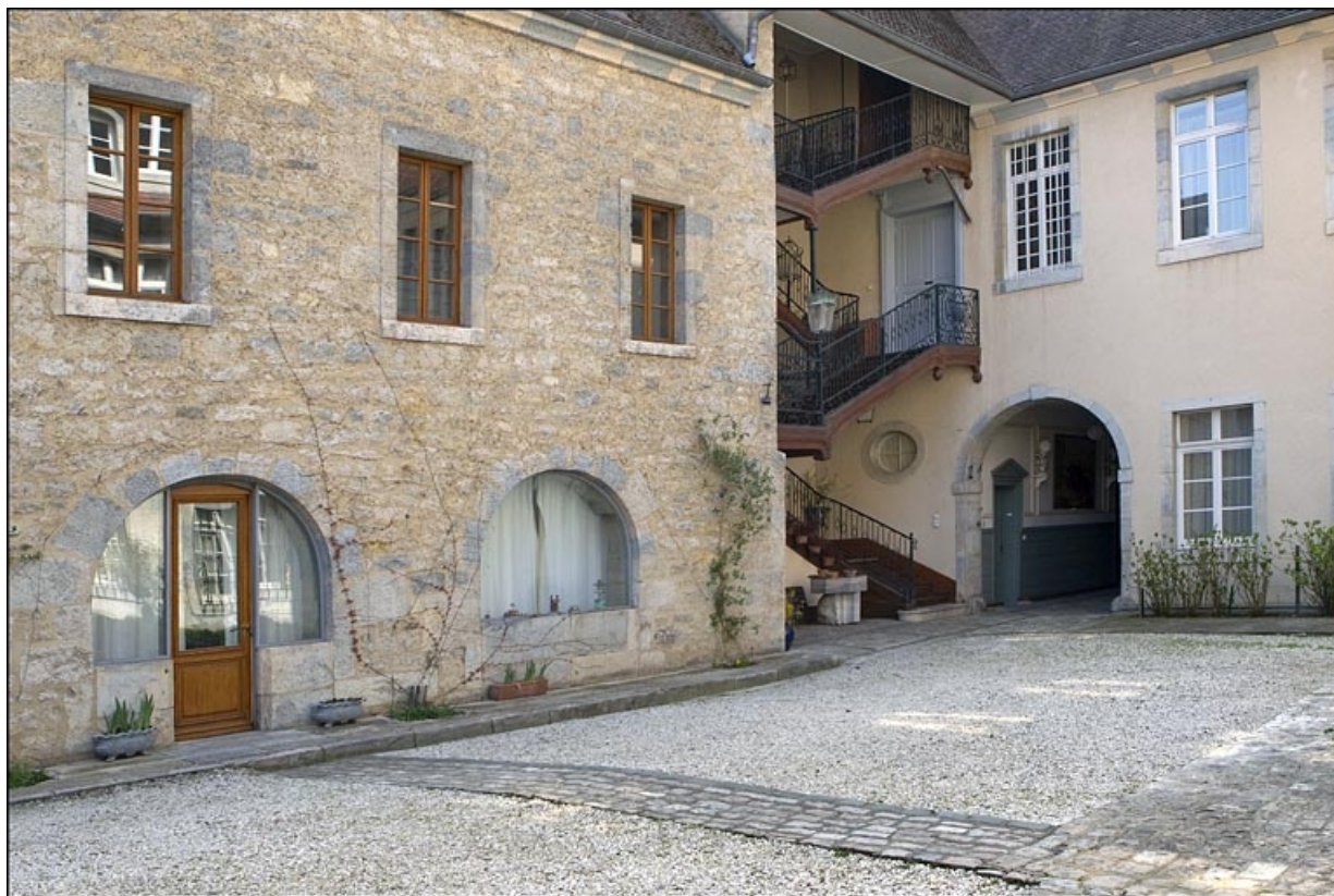
Vue d'ensemble du bâtiment des cuisines et de l'escalier à cage ouverte depuis le fond de la cour.

25, Besançon, 6 place Castan, lieudit : îlot Boitouset