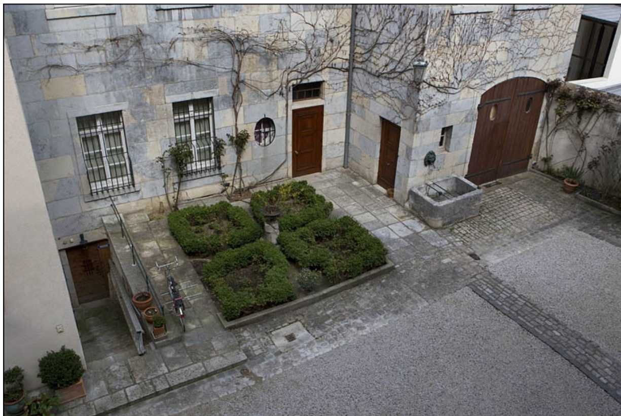
Vue du rez-de-chaussée de l'aile sur cour, depuis l'escalier à cage ouverte.

25, Besançon, 6 place Castan, lieu-dit : îlot Boitouset