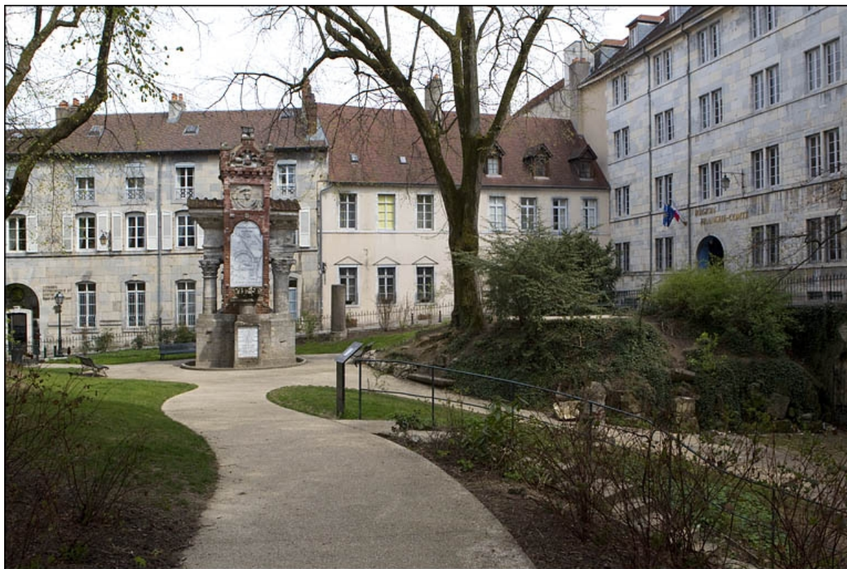
Vue d'ensemble de la façade antérieure du logis principal depuis le square Castan.

25, Besançon, 6 place Castan, lieudit : îlot Boitouset