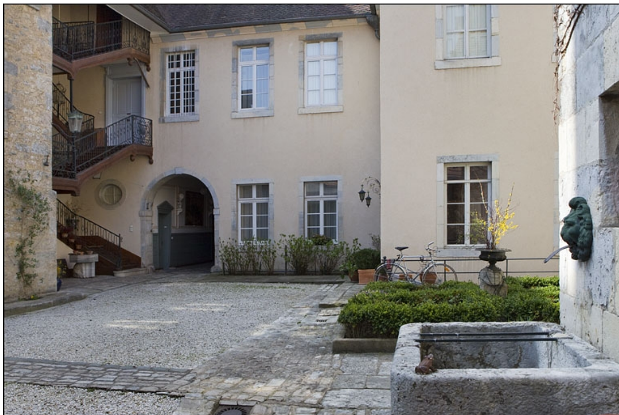
Vue d'ensemble de la façade postérieure du logis principal et de l'escalier à cage ouverte.

25, Besançon, 6 place Castan, lieudit : îlot Boitouset