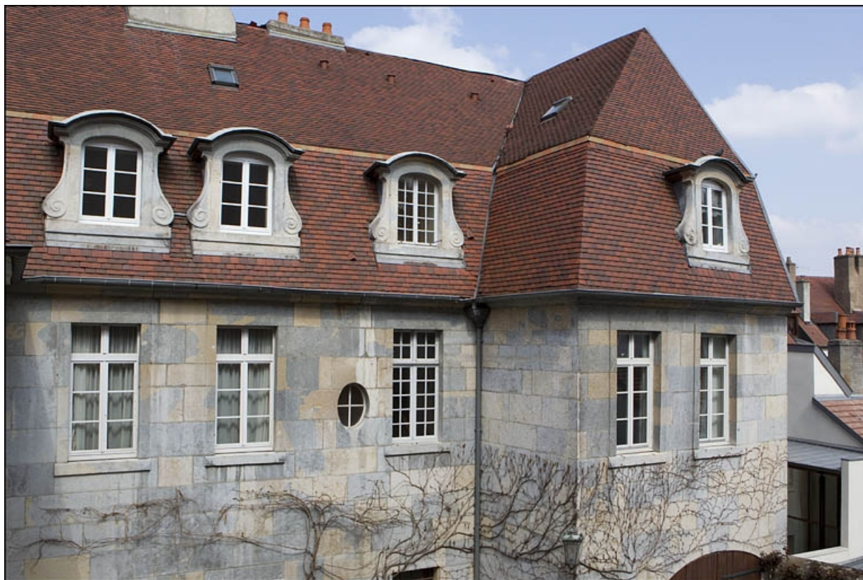
Vue de la partie supérieure de l'aile sur cour, depuis l'escalier à cage ouverte.

25, Besançon, 6 place Castan, lieu-dit : îlot Boitouset