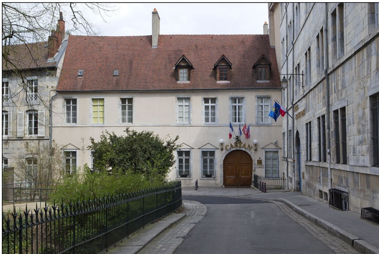
Vue d'ensemble de la façade antérieure du logis principal depuis la rue.

25, Besançon, 6 place Castan, lieu-dit : îlot Boitouset