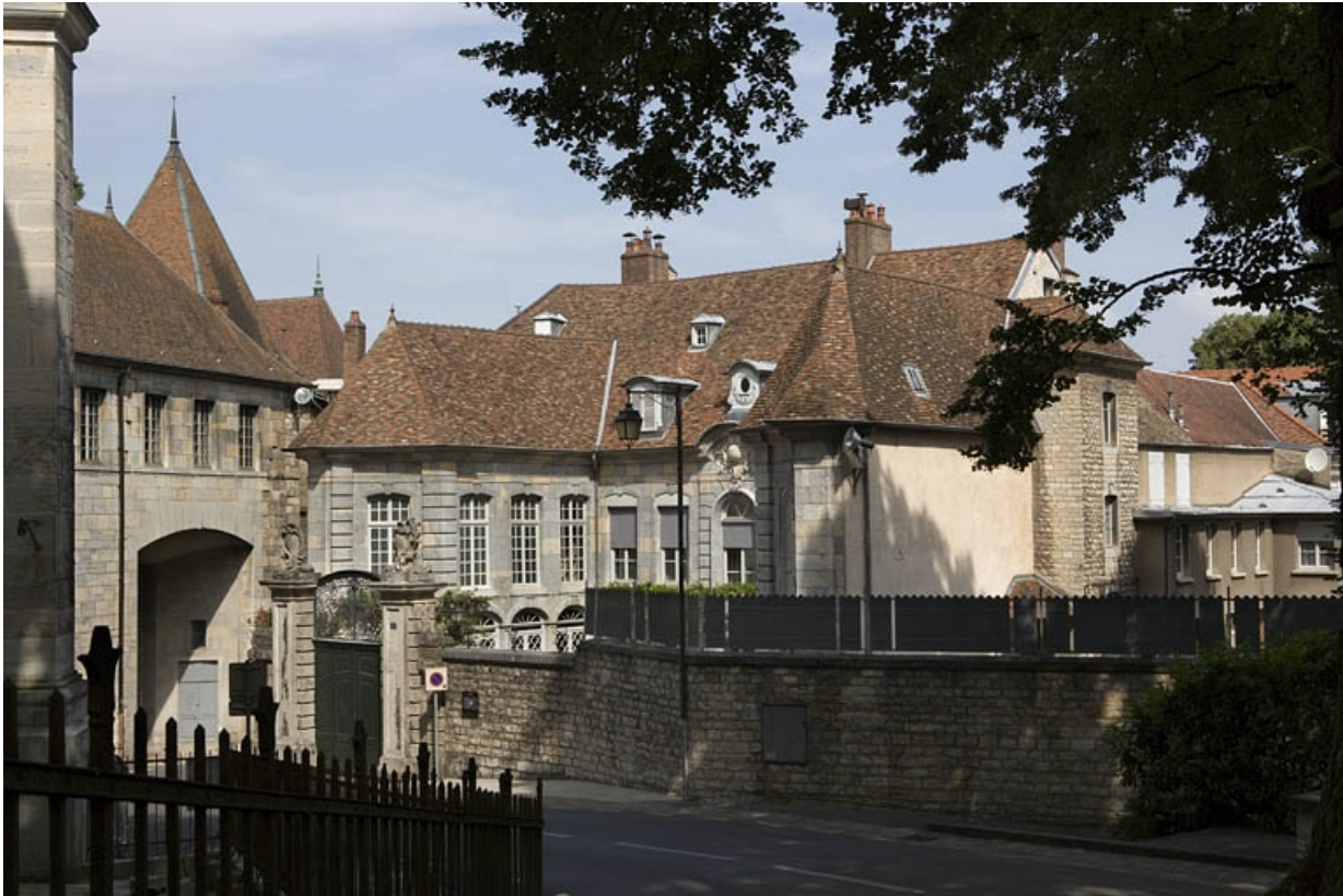
Vue d'ensemble de l'hôtel depuis la rue : de trois quarts droit.

25, Besançon, 3, 5 rue de la Convention, lieudit : îlot Boitouset