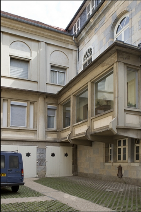
Détail des façades donnant sur la cour postérieure.

25, Besançon, 3, 5 rue de la Convention, lieudit : îlot Boitouset