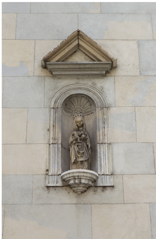
Détail de la niche sur la façade sur rue du logis principal.

25, Besançon, 13 rue des Martelots, lieudit : îlot des Martelots