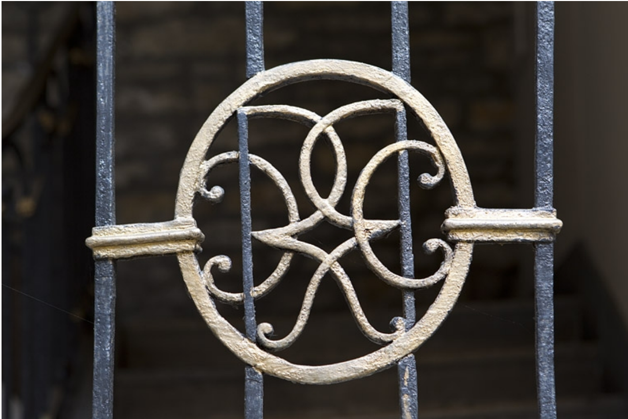
Détail du médaillon en ferronnerie de la rampe de l'escalier principal.

25, Besançon, 13 rue des Martelots, lieudit : îlot des Martelots