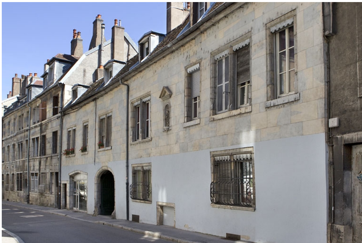
Vue d'ensemble du logis principal depuis la rue, de trois quarts droit.

25, Besançon, 13 rue des Martelots, lieudit : îlot des Martelots