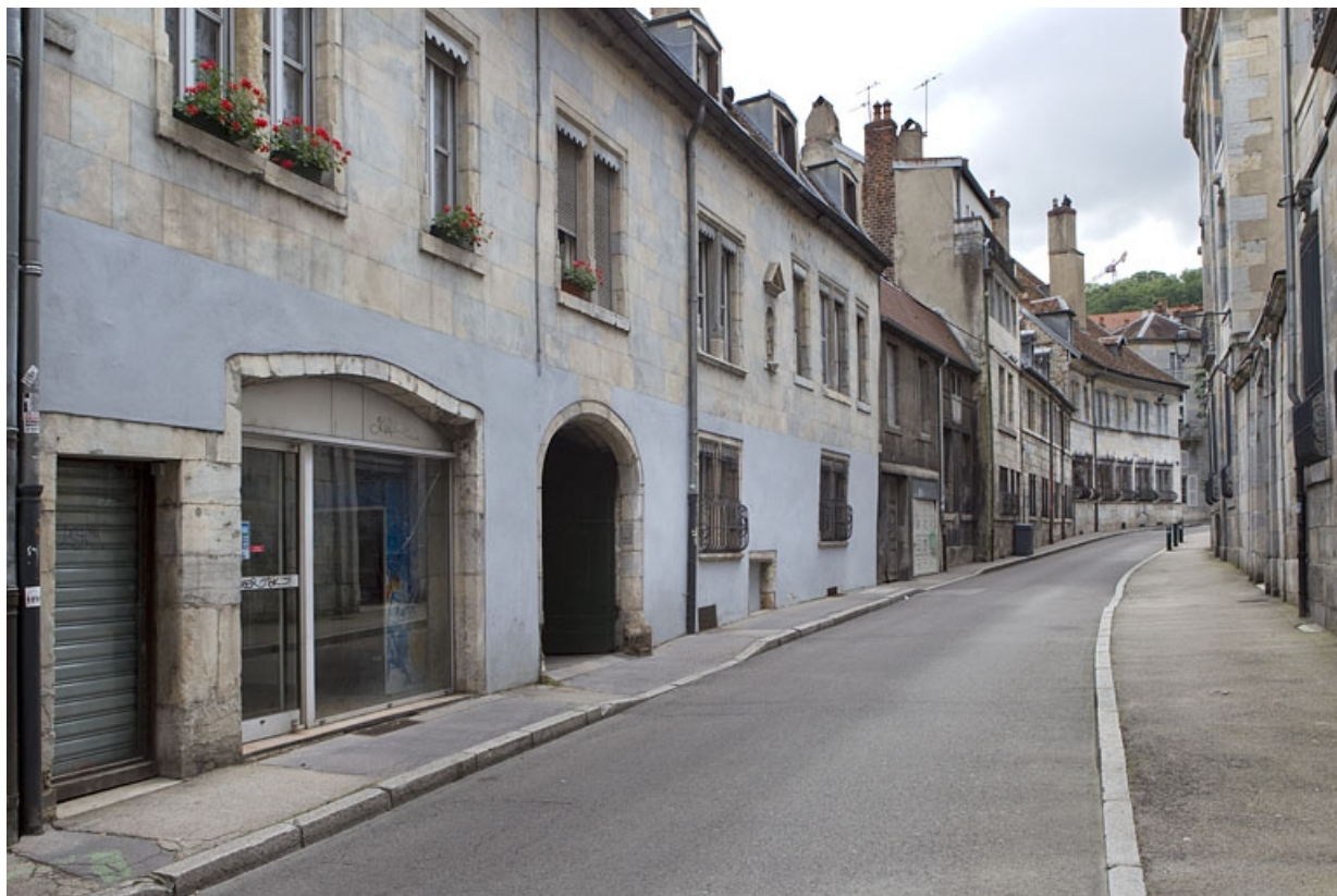
Vue d'ensemble du logis principal depuis la rue, de trois quarts gauche.

25, Besançon, 13 rue des Martelots, lieudit : îlot des Martelots