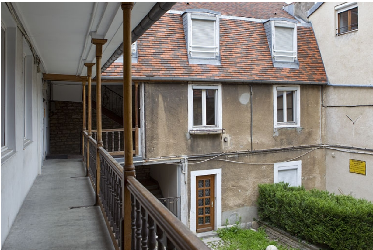
Détail de galerie sur cour du logis principal.

25, Besançon, 13 rue des Martelots, lieudit : îlot des Martelots