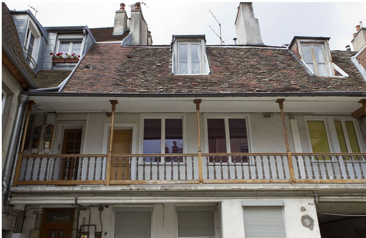
Vue d'ensemble de la galerie du logis principal depuis la cour.

25, Besançon, 13 rue des Martelots, lieudit : îlot des Martelots