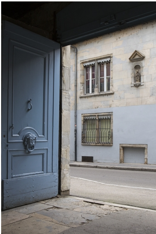
Détail de la façade sur rue depuis le portail de la maison d'en face.

25, Besançon, 13 rue des Martelots, lieudit : îlot des Martelots