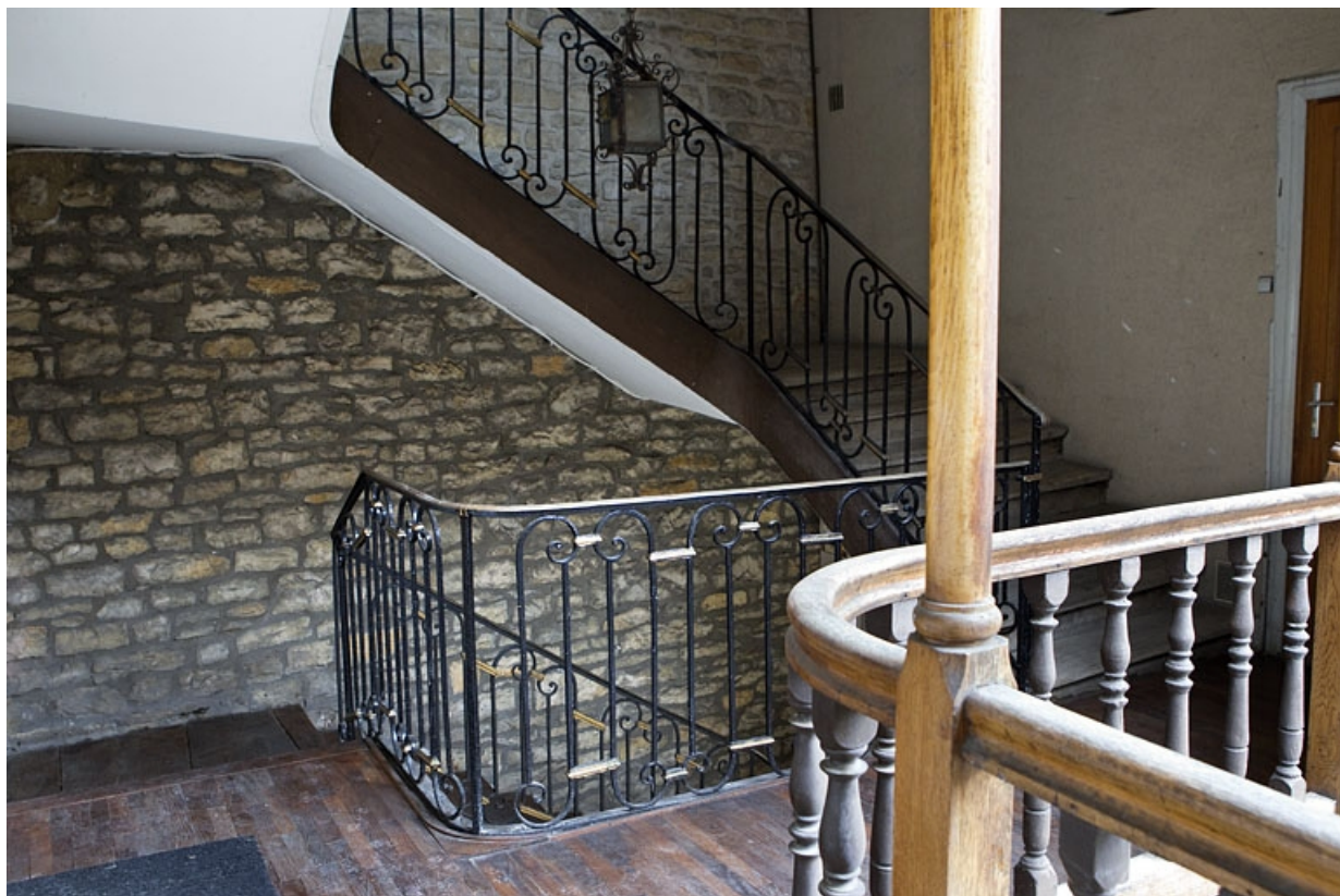
Détail de l'intérieur de l'escalier principal.

25, Besançon, 13 rue des Martelots, lieudit : îlot des Martelots