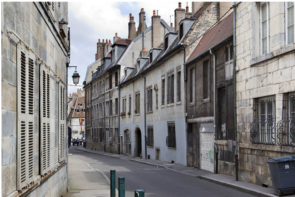
Vue d'ensemble du logis principal dans l'alignement de la rue de trois quarts droit.

25, Besançon, 13 rue des Martelots, lieudit : îlot des Martelots