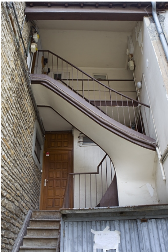
Vue d'ensemble de l'escalier à cage ouverte secondaire.

25, Besançon, 13 rue des Martelots, lieudit : îlot des Martelots