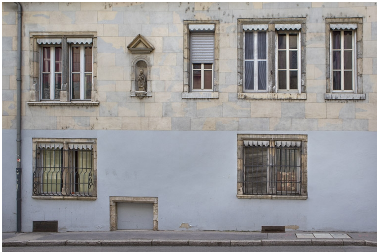
Détail de la façade sur rue du logis principal.

25, Besançon, 13 rue des Martelots, lieudit : îlot des Martelots