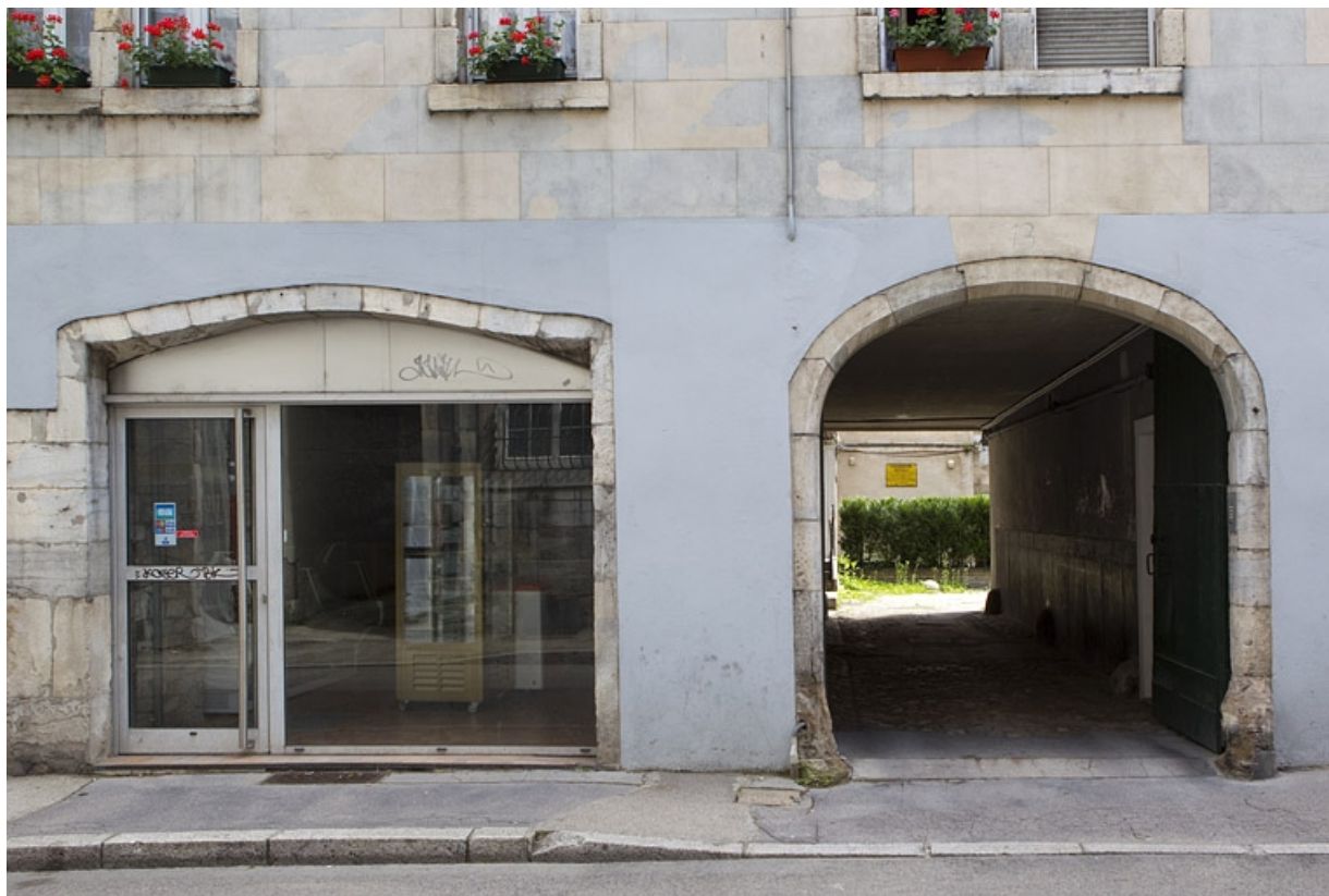
Détail du portail d'entrée et du passage cocher.

25, Besançon, 13 rue des Martelots, lieudit : îlot des Martelots