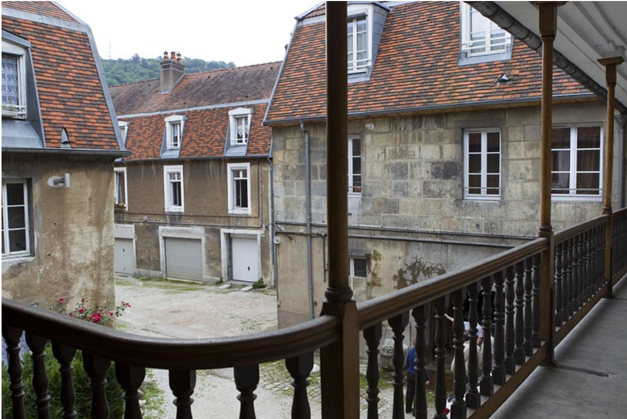
Vue d'ensemble des logis sur cour depuis la galerie du logis principal.

25, Besançon, 13 rue des Martelots, lieudit : îlot des Martelots