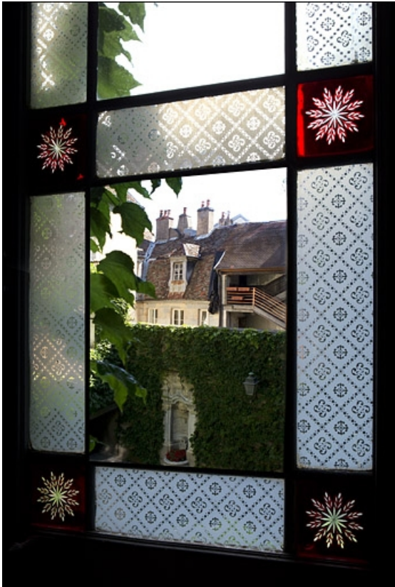
Détail de la borne fontaine depuis la cage de l'escalier.

25, Besançon, 5 rue Péclet, lieudit : îlot des Martelots