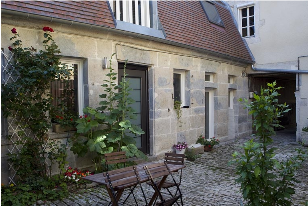
Vue d'ensemble du bâtiment des communs dans la deuxième cour.

25, Besançon, 5 rue Péclet, lieudit : îlot des Martelots