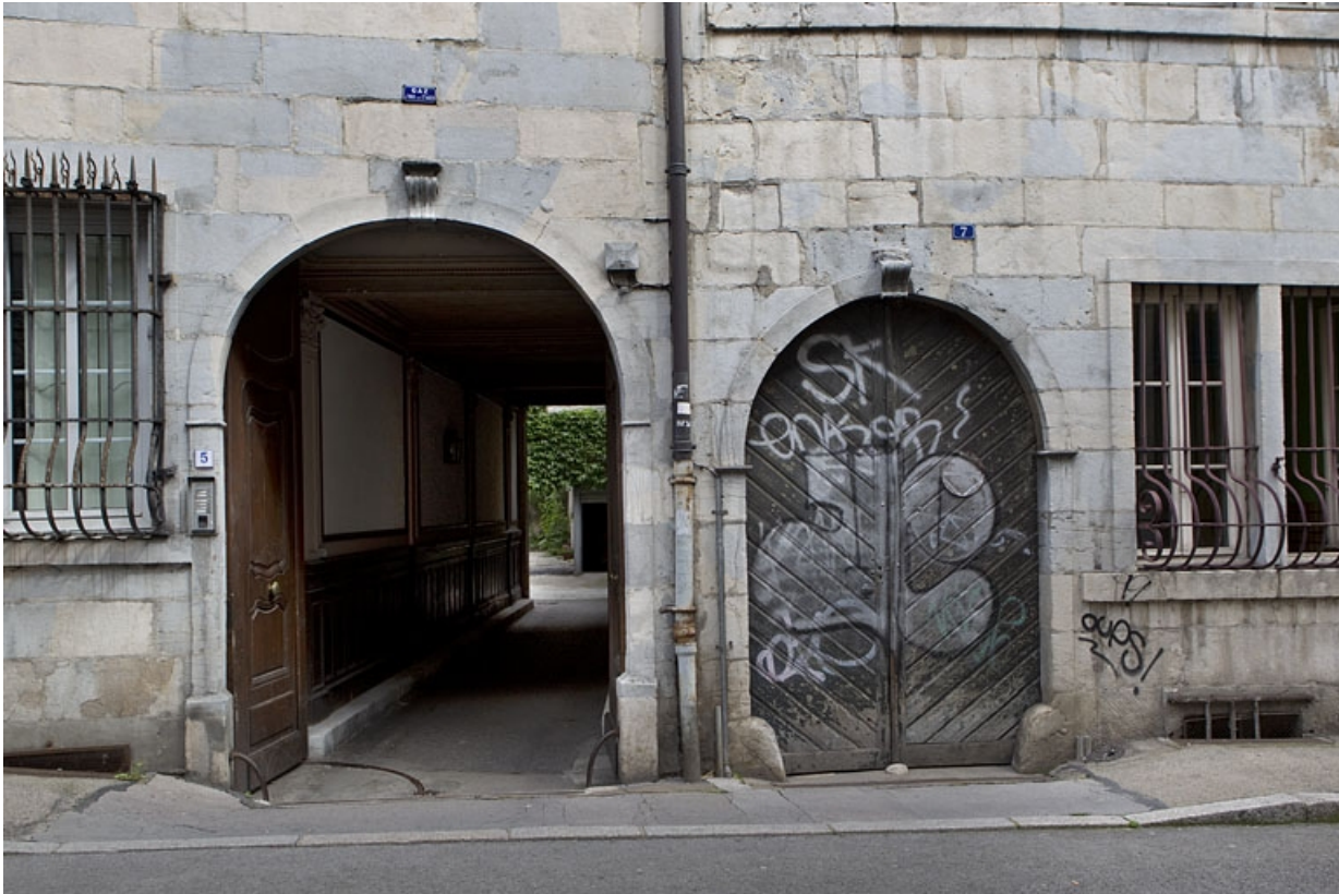
Façade sur rue du logis principal : détail de l'entrée cochère.

25, Besançon, 5 rue Péclet, lieudit : îlot des Martelots