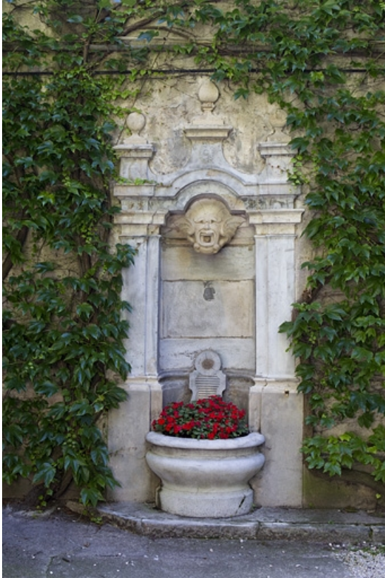
Détail de la borne fontaine dans la première cour. 25, Besançon, 5 rue Péclet, lieudit : îlot des Martelots