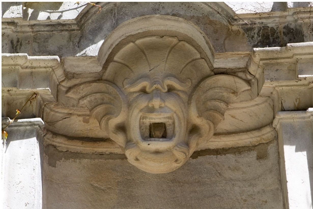
Borne-fontaine : détail de la sculpture.

25, Besançon, 5 rue Péclet, lieudit : îlot des Martelots