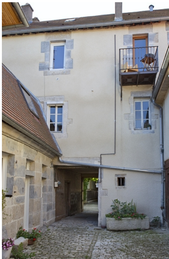
Vue d'ensemble de la façade postérieure du logis secondaire.

25, Besançon, 5 rue Péclet, lieudit : îlot des Martelots