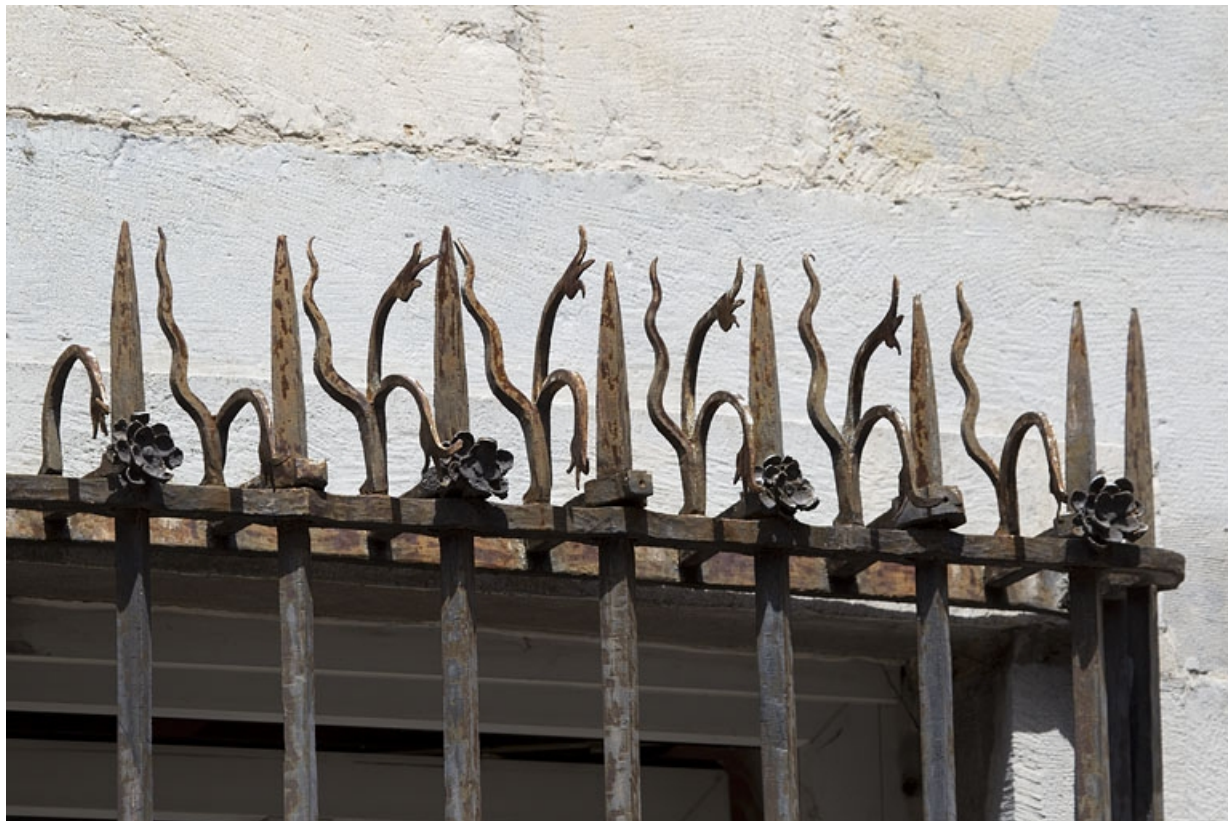
Façade sur rue du logis principal : détail de la partie supérieure des grilles devant les fenêtres du rez-de-chaussée. 25, Besançon, 5 rue Péclet, lieudit : îlot des Martelots