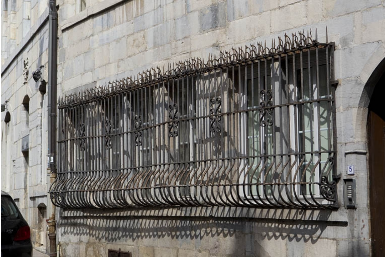
Façade sur rue du logis principal : détail des grilles devant les fenêtres du rez-de-chaussée.

25, Besançon, 5 rue Péclet, lieudit : îlot des Martelots