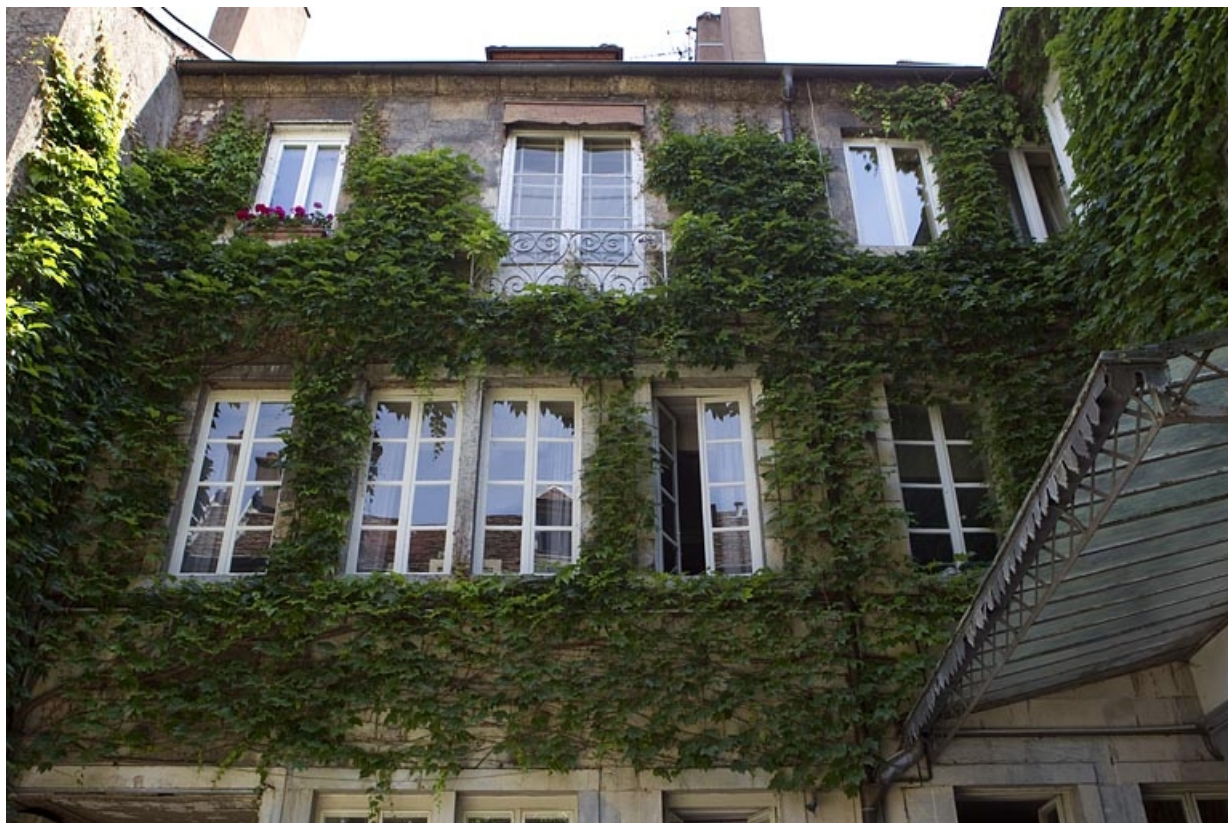
Façade postérieure du logis principal : détail de la partie supérieure.

25, Besançon, 5 rue Péclet, lieudit : îlot des Martelots