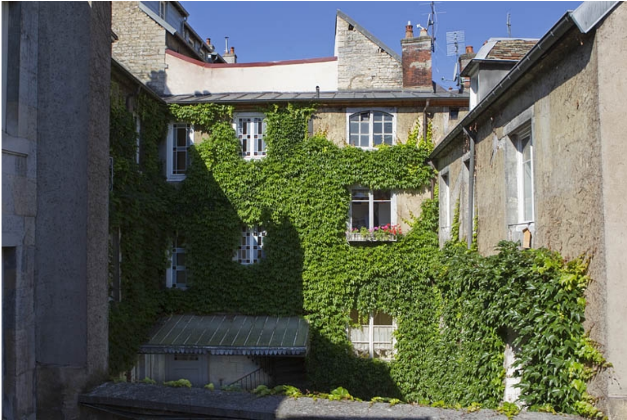
Vue d'ensemble de l'aile contenant l'escalier principal.

25, Besançon, 5 rue Péclet, lieudit : îlot des Martelots