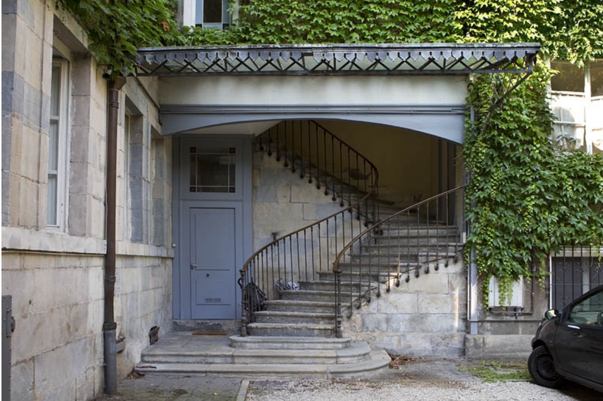
Aile sur la première cour : détail du départ de l'escalier.

25, Besançon, 5 rue Péclet, lieudit : îlot des Martelots