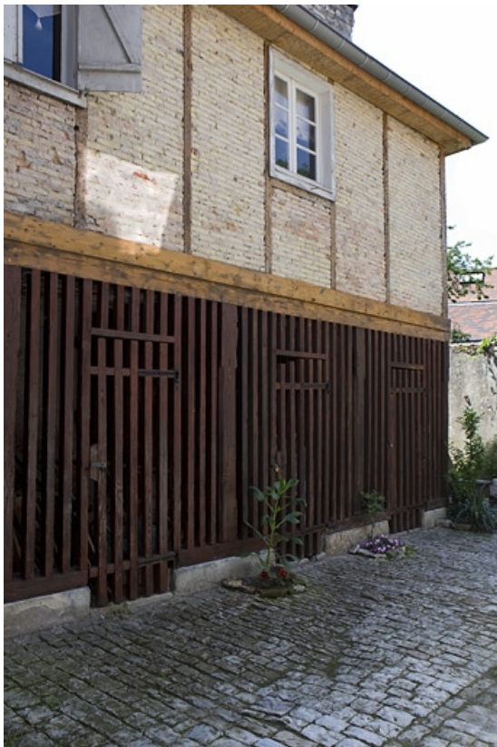
Vue d'ensemble du bûcher dans la cour des communs.

25, Besançon, 5 rue Péclet, lieudit : îlot des Martelots