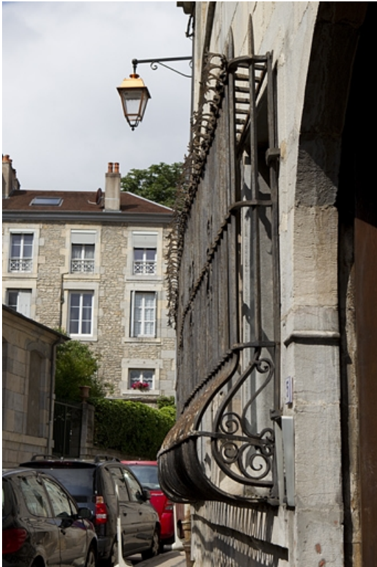
Façade sur rue du logis principal : détail des grilles devant les fenêtres du rez-de-chaussée, de profil. 25, Besançon, 5 rue Péclet, lieudit : îlot des Martelots