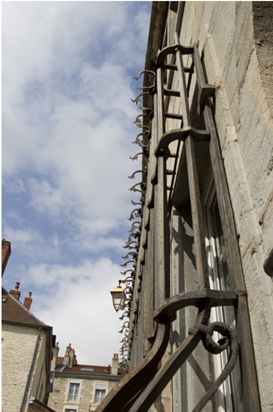
Façade sur rue du logis principal : détail des grilles devant les fenêtres du rez-de-chaussée, de profil, vue rapprochée. 25, Besançon, 5 rue Péclet, lieudit : îlot des Martelots