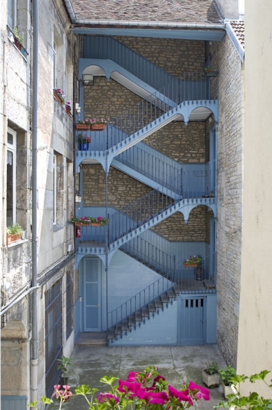
Vue d'ensemble de l'escalier à cage ouverte à gauche de la cour.

25, Besançon, 6 rue de Pontarlier, lieudit : îlot des Martelots