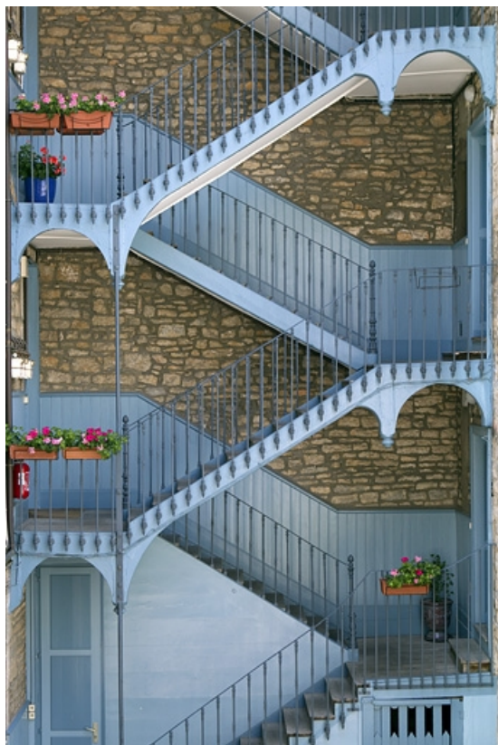
Détail de l'escalier à cage ouverte à gauche de la cour. 25, Besançon, 6 rue de Pontarlier, lieu dit : îlot des Martelots