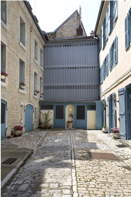
Vue d'ensemble du séchoir au fond de la cour.

25, Besançon, 6 rue de Pontarlier, lieudit : îlot des Martelots