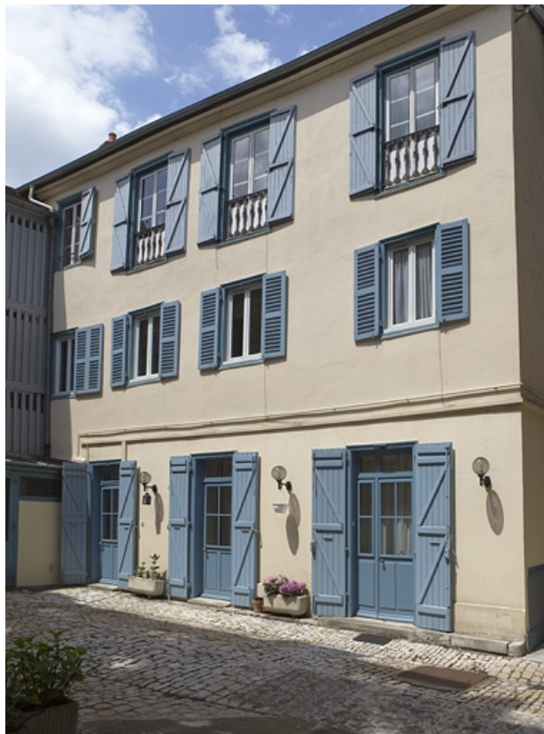
Vue d'ensemble du logis secondaire droit.

25, Besançon, 6 rue de Pontarlier, lieudit : îlot des Martelots