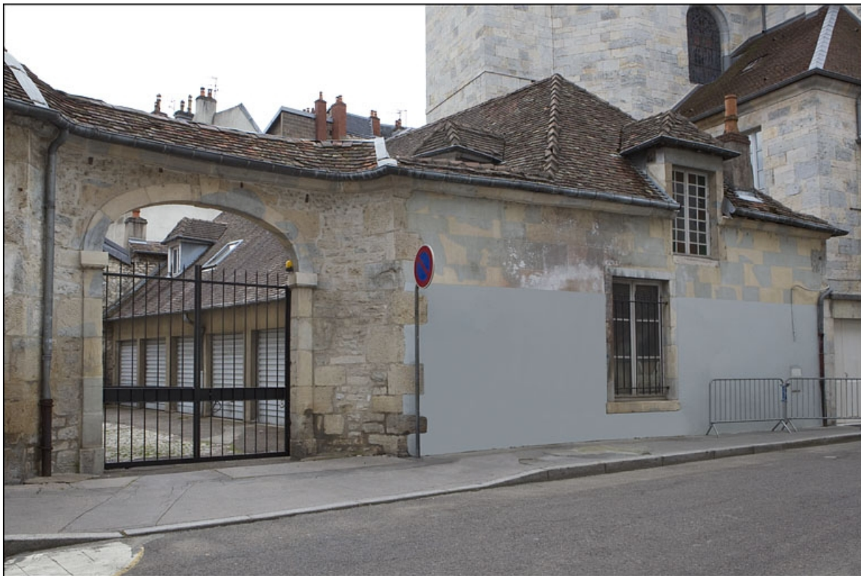
Vue d'ensemble de l'entrée secondaire de l'hôtel, de trois quarts gauche.

25, Besançon, 123 Grande Rue, lieudit : îlot Saint-Maurice