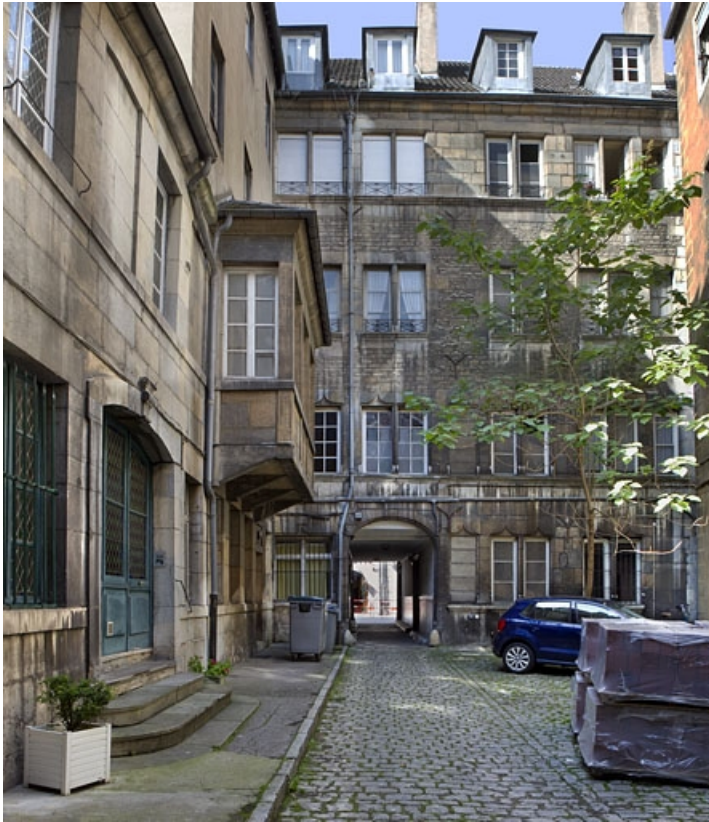
Façade postérieure sur cour de l'immeuble : vue d'ensemble de face. 25, Besançon, 123 Grande Rue, lieudit : îlot Saint-Maurice