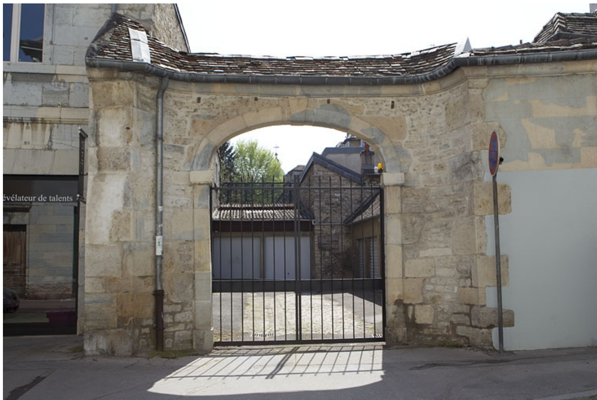
Vue d'ensemble de l'entrée secondaire de l'hôtel, de face.

25, Besançon, 123 Grande Rue, lieudit : îlot Saint-Maurice