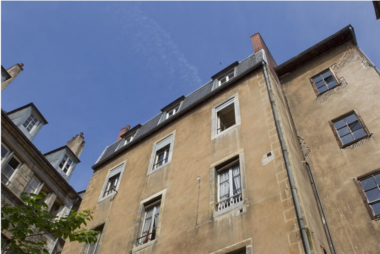
Vue de l'aile gauche de l'immeuble de trois quarts droit.

25, Besançon, 123 Grande Rue, lieudit : îlot Saint-Maurice