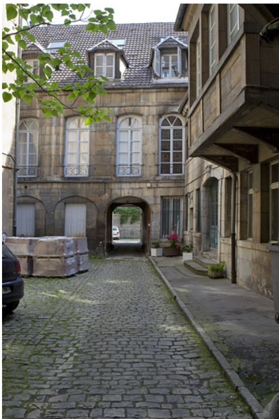
Vue de l'aile de l'hôtel au fond de la première cour.

25, Besançon, 123 Grande Rue, lieudit : îlot Saint-Maurice