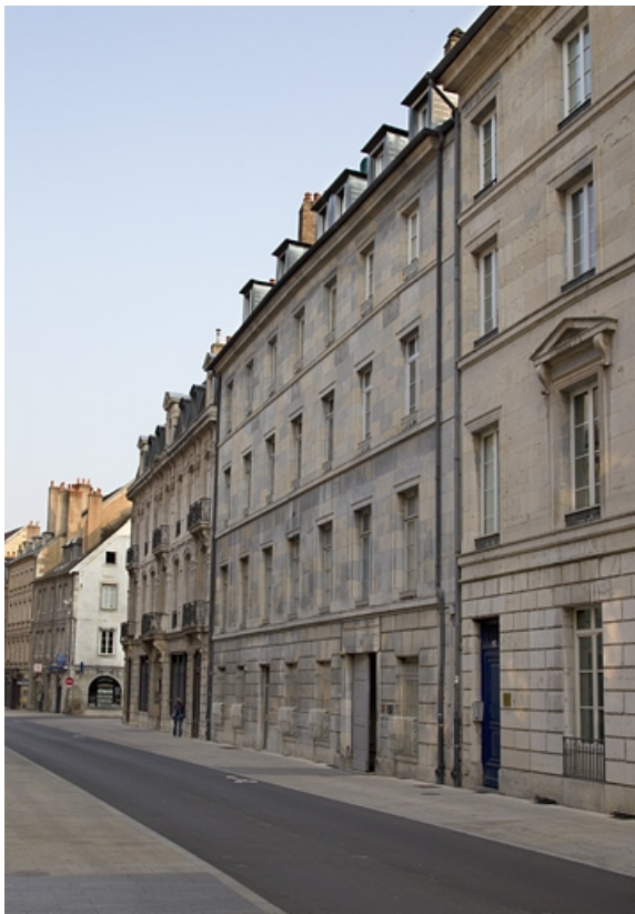
Vue d'ensemble de la façade antérieure de l'immeuble depuis la rue, de trois quarts droit. 25, Besançon, 123 Grande Rue, lieudit : îlot Saint-Maurice