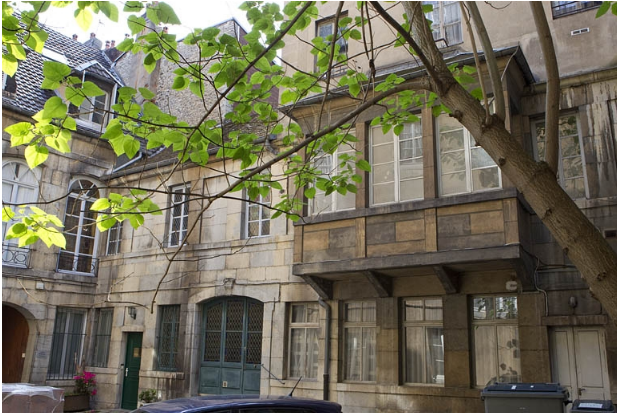
Vue de l'aile droite de l'hôtel donnant sur la première cour.

25, Besançon, 123 Grande Rue, lieudit : îlot Saint-Maurice