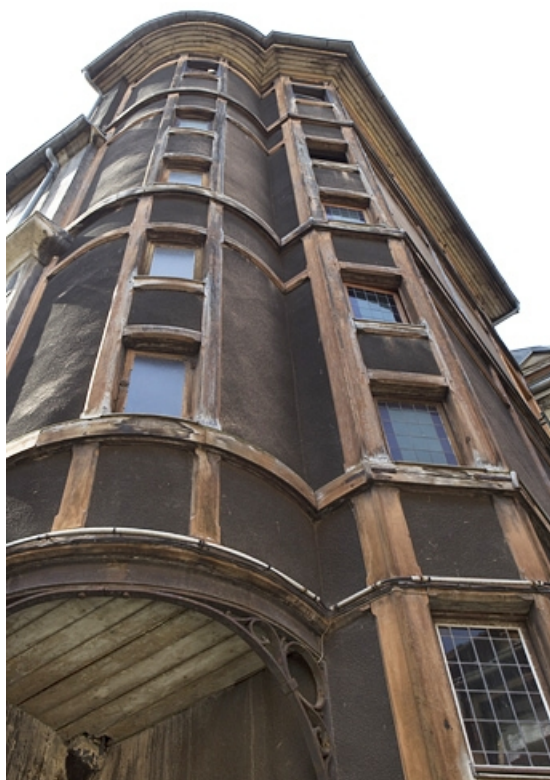
Vue d'ensemble de la cage d'escalier en pan de bois.

25, Besançon, 133 Grande Rue, lieudit : îlot Saint-Maurice