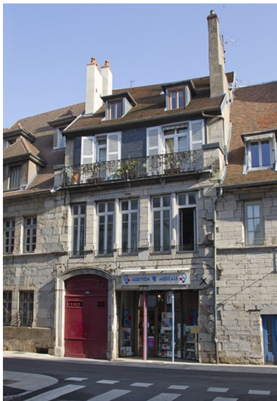
Vue d'ensemble depuis la rue.

25, Besançon, 133 Grande Rue, lieudit : îlot Saint-Maurice