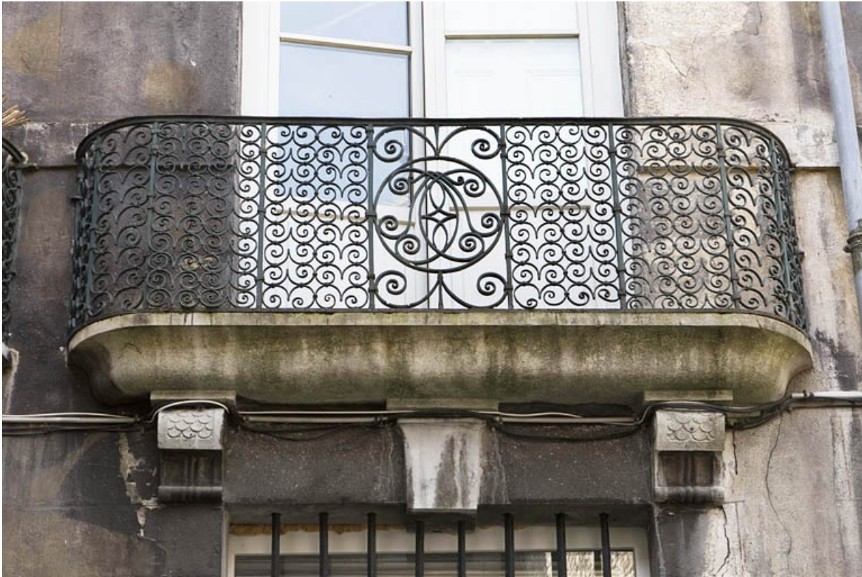
Logis principal, façade sur cour : détail d'un garde-corps.

25, Besançon, 133 Grande Rue, lieudit : îlot Saint-Maurice