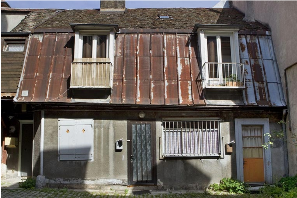
Logis secondaire à gauche de la cour : vue d'ensemble.

25, Besançon, 133 Grande Rue, lieudit : îlot Saint-Maurice