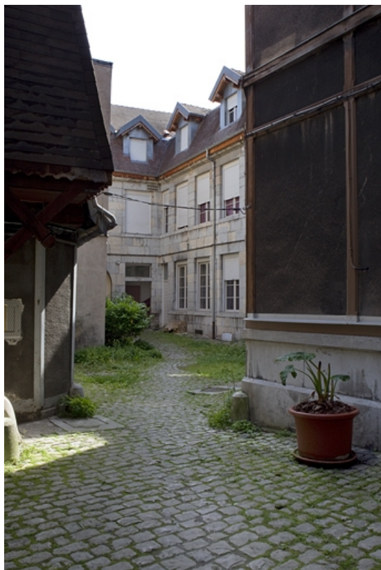
Vue du logis secondaire en L depuis l'entrée de la cour. 25, Besançon, 133 Grande Rue, lieudit : îlot Saint-Maurice