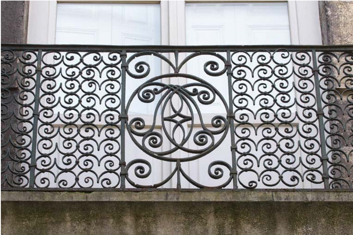
Logis principal, façade sur cour : détail de la ferronnerie d'un garde-corps.

25, Besançon, 133 Grande Rue, lieudit : îlot Saint-Maurice