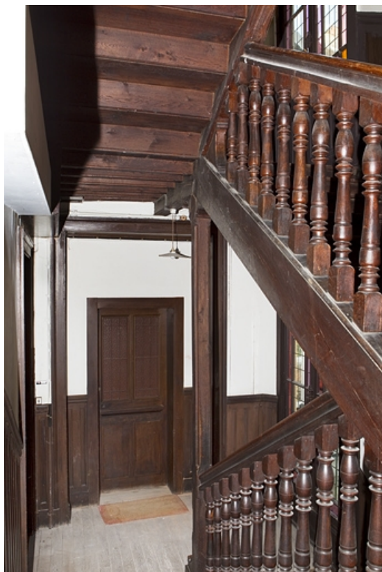
Cage d'escalier en pan de bois : détail de l'escalier.

25, Besançon, 133 Grande Rue, lieudit : îlot Saint-Maurice