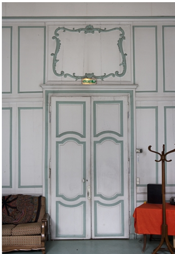
Intérieur, premier étage, pièce donnant sur la rue : détail de la porte d'entrée.

25, Besançon, 127 Grande Rue, lieudit : îlot Saint-Maurice