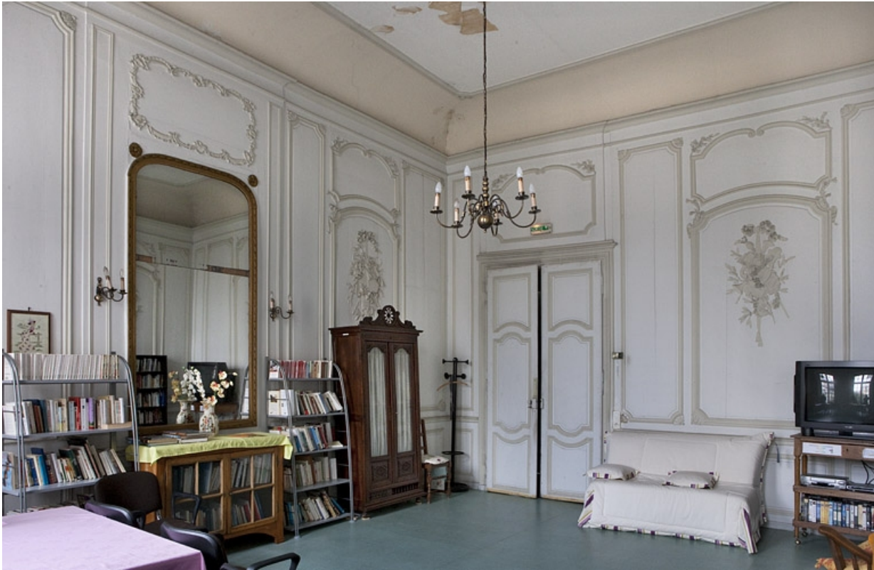
Intérieur, premier étage, pièce donnant sur la cour : vue depuis le fond de trois quarts gauche. 25, Besançon, 127 Grande Rue, lieudit : îlot Saint-Maurice