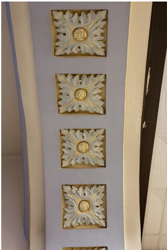
Intérieur, détail du décor de l'intrados de l'arc séparant l'escalier de l'ancien passage cocher. 25, Besançon, 127 Grande Rue, lieudit : îlot Saint-Maurice