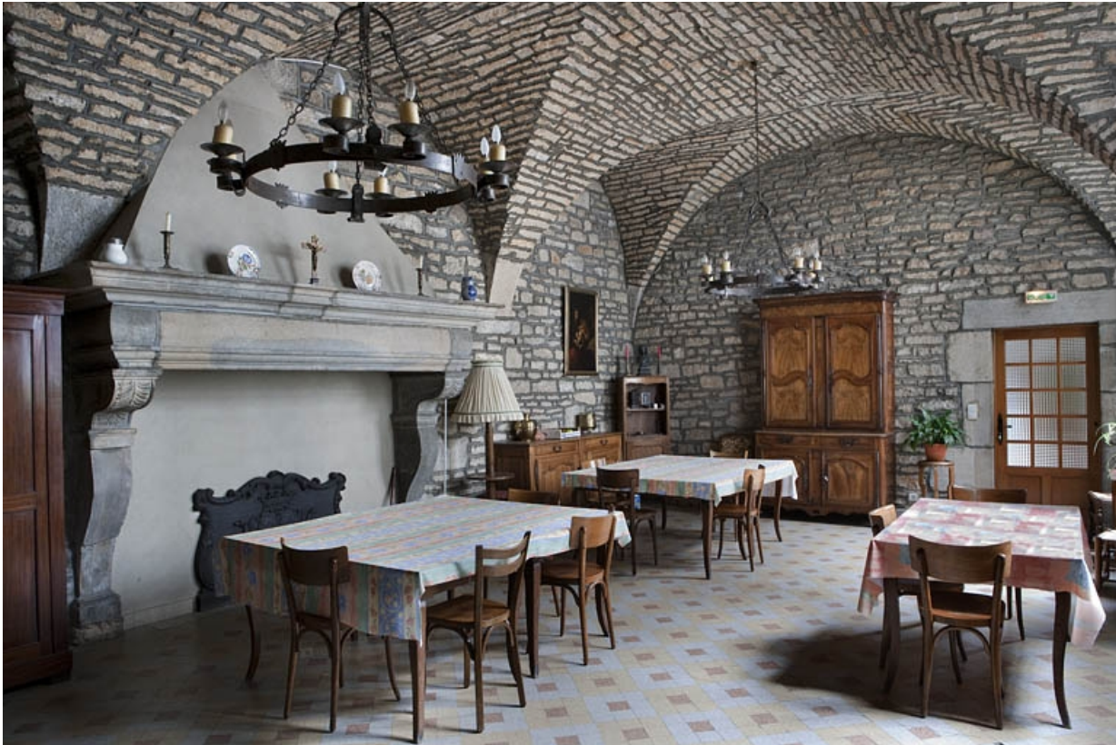
Intérieur, vue d'ensemble de la cuisine depuis l'entrée. 25, Besançon, 127 Grande Rue, lieudit : îlot Saint-Maurice