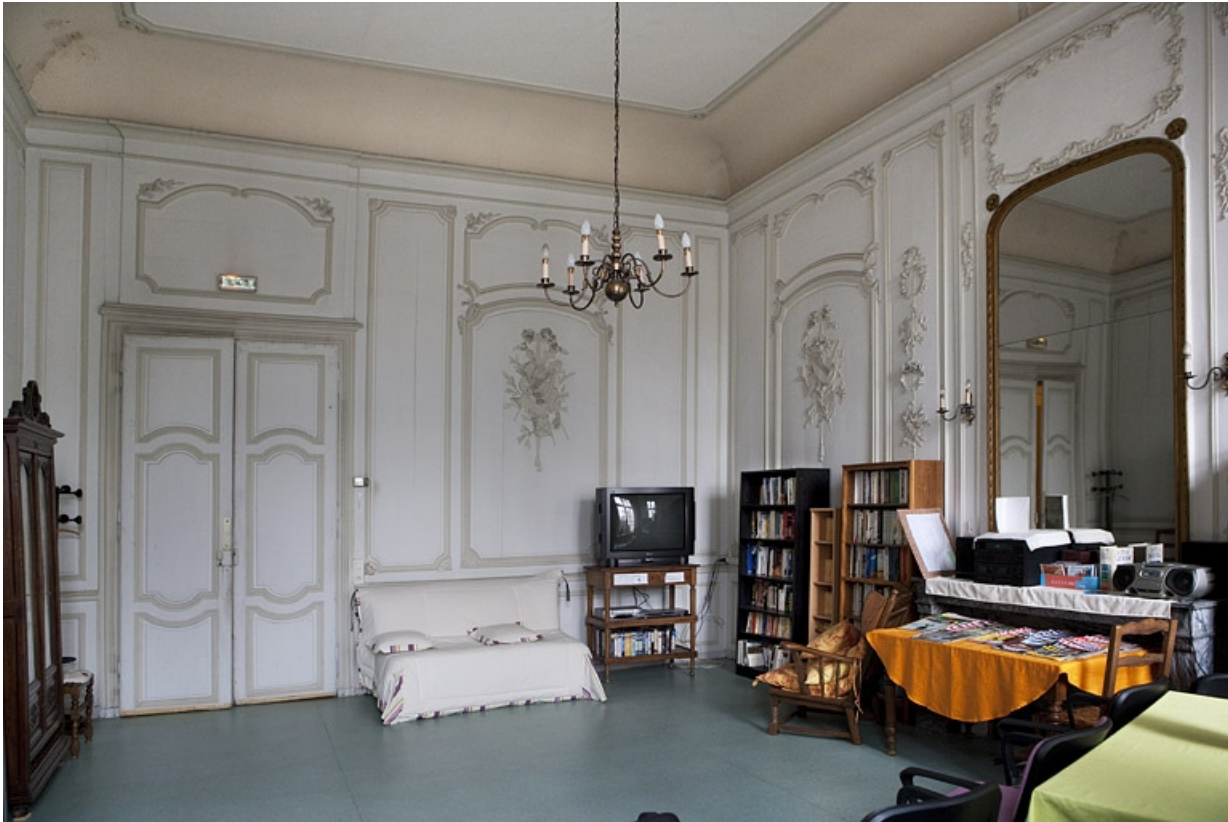
Intérieur, premier étage, pièce donnant sur la cour : vue d'ensemble depuis le fond.

25, Besançon, 127 Grande Rue, lieudit : îlot Saint-Maurice