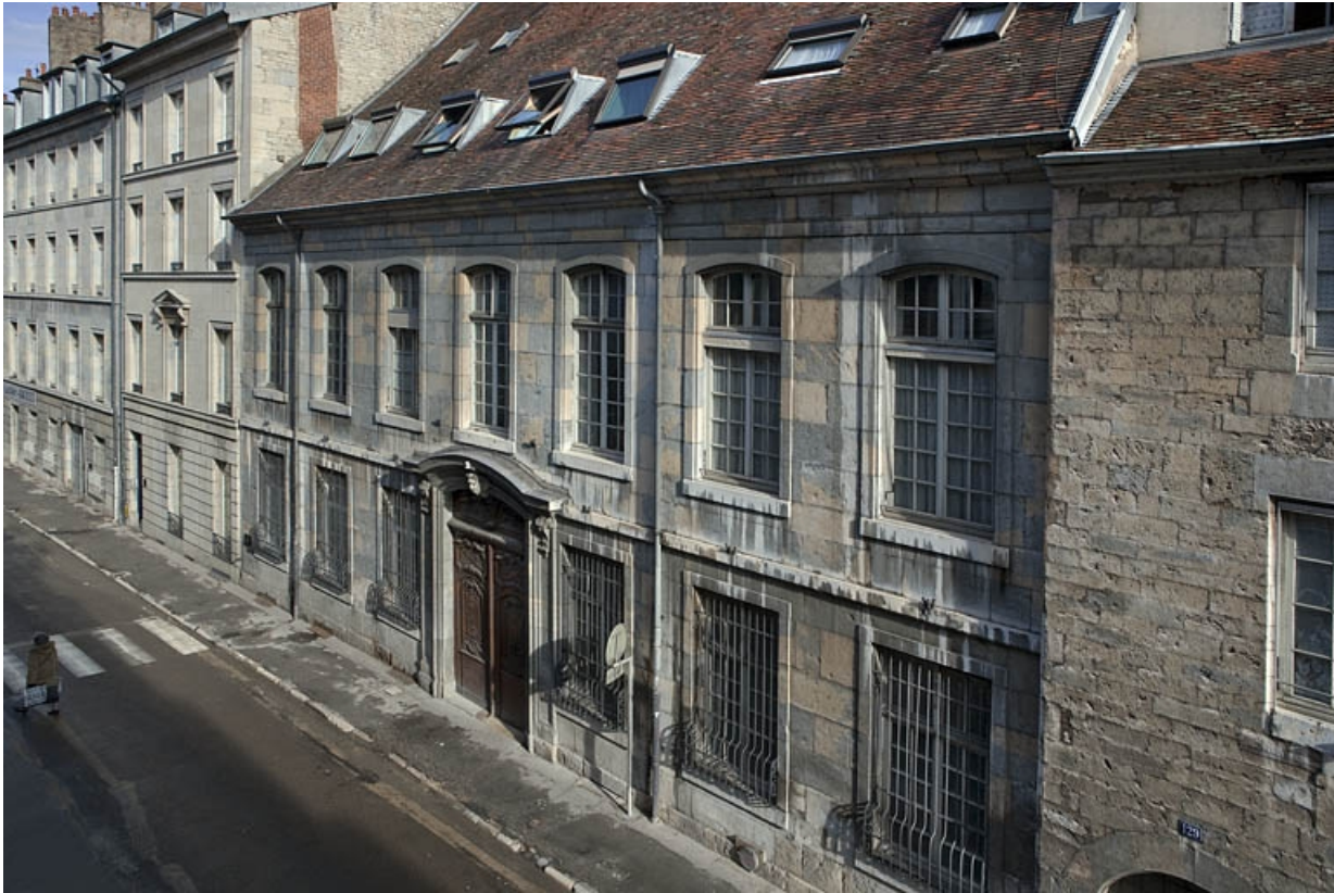
Façade antérieure sur rue, de trois quarts droit, vue éloignée. 25, Besançon, 127 Grande Rue, lieudit : îlot Saint-Maurice