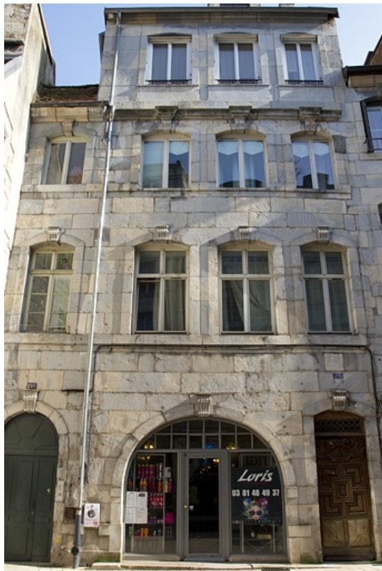
Vue d'ensemble de la façade antérieure.

25, Besançon, 137 Grande Rue, lieudit : îlot Saint-Maurice