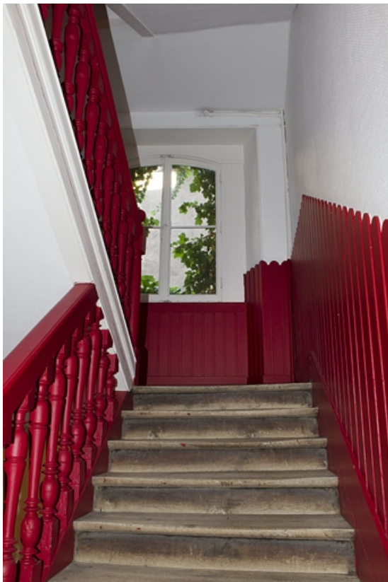
Logis principal : détail de l'escalier.

25, Besançon, 137 Grande Rue, lieudit : îlot Saint-Maurice