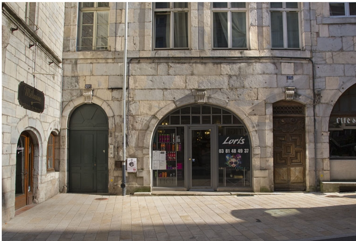
Façade antérieure : détail du rez-de-chaussée.

25, Besançon, 137 Grande Rue, lieudit : îlot Saint-Maurice