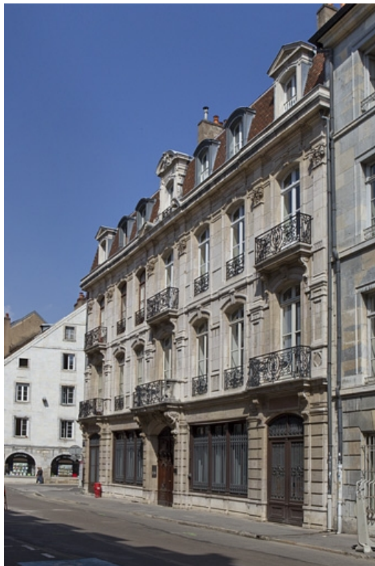
Vue d'ensemble de trois quarts droit.

25, Besançon, 121 Grande Rue, lieudit : îlot Saint-Maurice