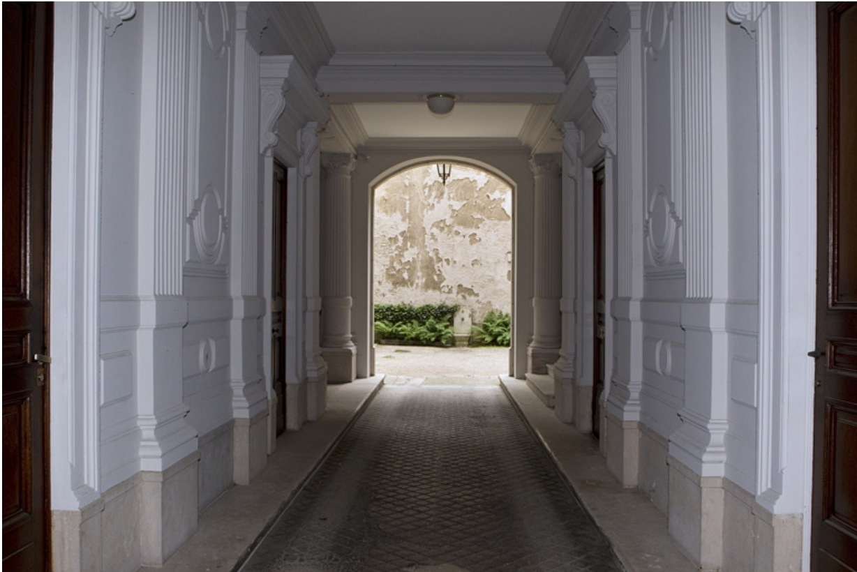
Passage cocher :vue d'ensemble depuis la cour.

25, Besançon, 121 Grande Rue, lieudit : îlot Saint-Maurice