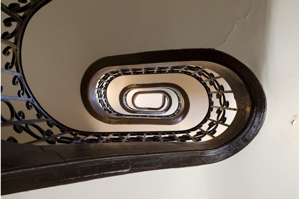
Intérieur, vue de l'escalier à jour central situé dans l'une des ailes, depuis le bas.

25, Besançon, 121 Grande Rue, lieudit : îlot Saint-Maurice