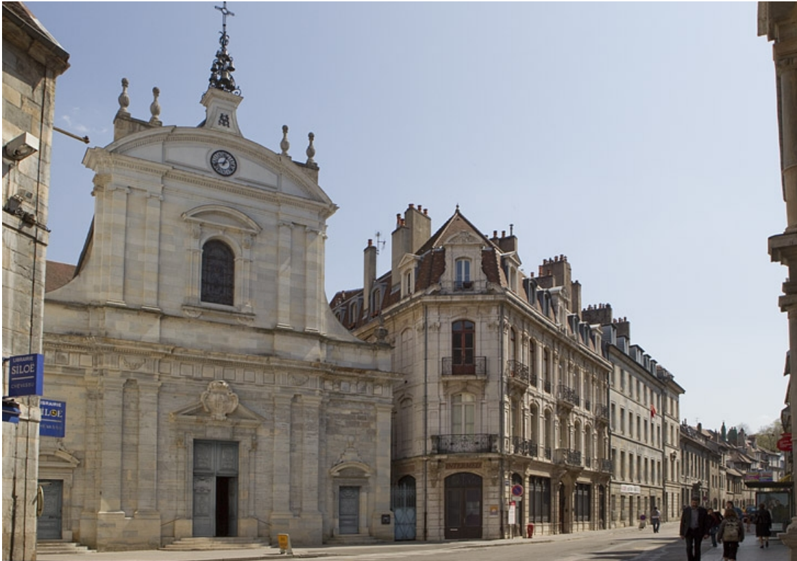
Vue d'ensemble éloignée de trois quarts gauche avec la façade antérieure de l'église Saint-Maurice.

25, Besançon, 121 Grande Rue, lieudit : îlot Saint-Maurice