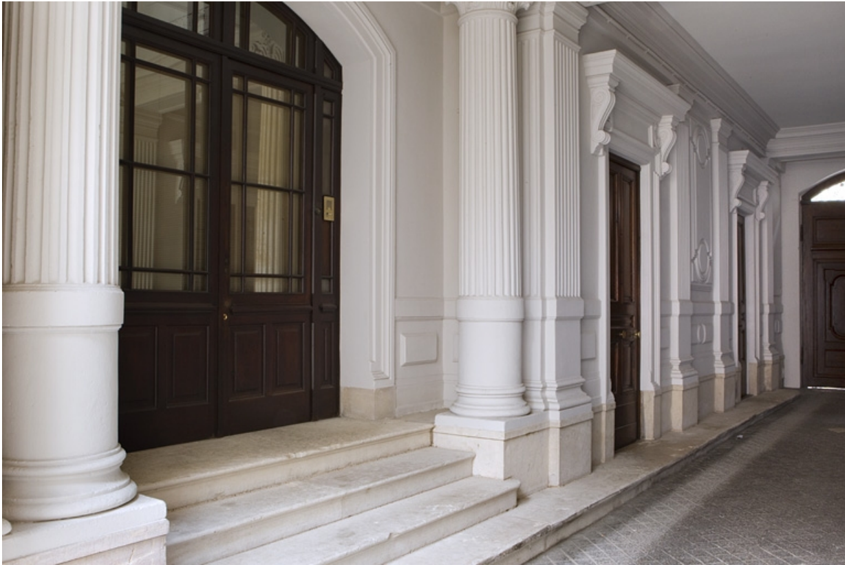
Passage cocher :détail du mur droit.

25, Besançon, 121 Grande Rue, lieudit : îlot Saint-Maurice