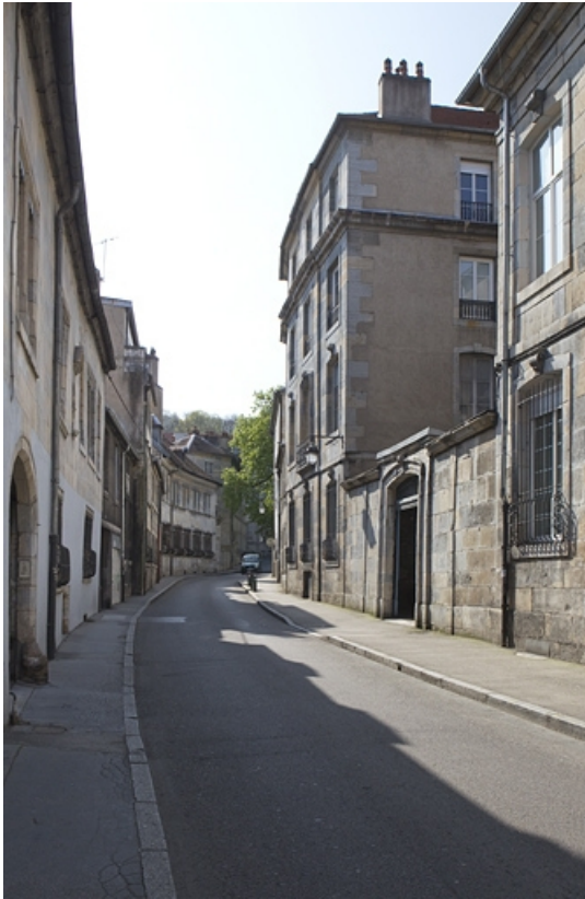
Vue d'ensemble depuis la rue, de trois quarts droit.

25, Besançon, 8 rue des Martelots, lieudit : îlot Saint-Maurice