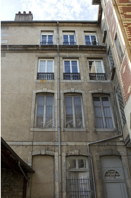
Vue d'ensemble de l'aile gauche sur cour.

25, Besançon, 8 rue des Martelots, lieudit : îlot Saint-Maurice