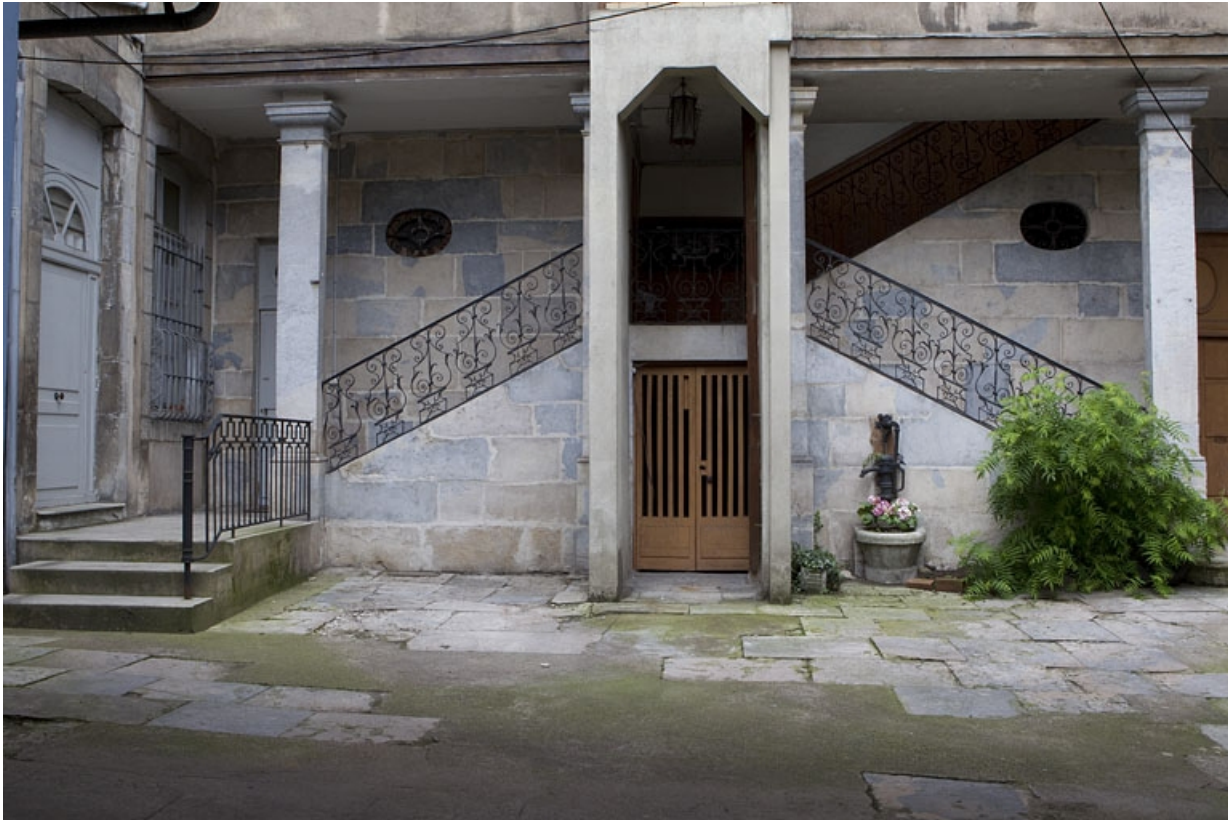
Vue du départ de l'escalier en fond de cour, de face.

25, Besançon, 8 rue des Martelots, lieudit : îlot Saint-Maurice