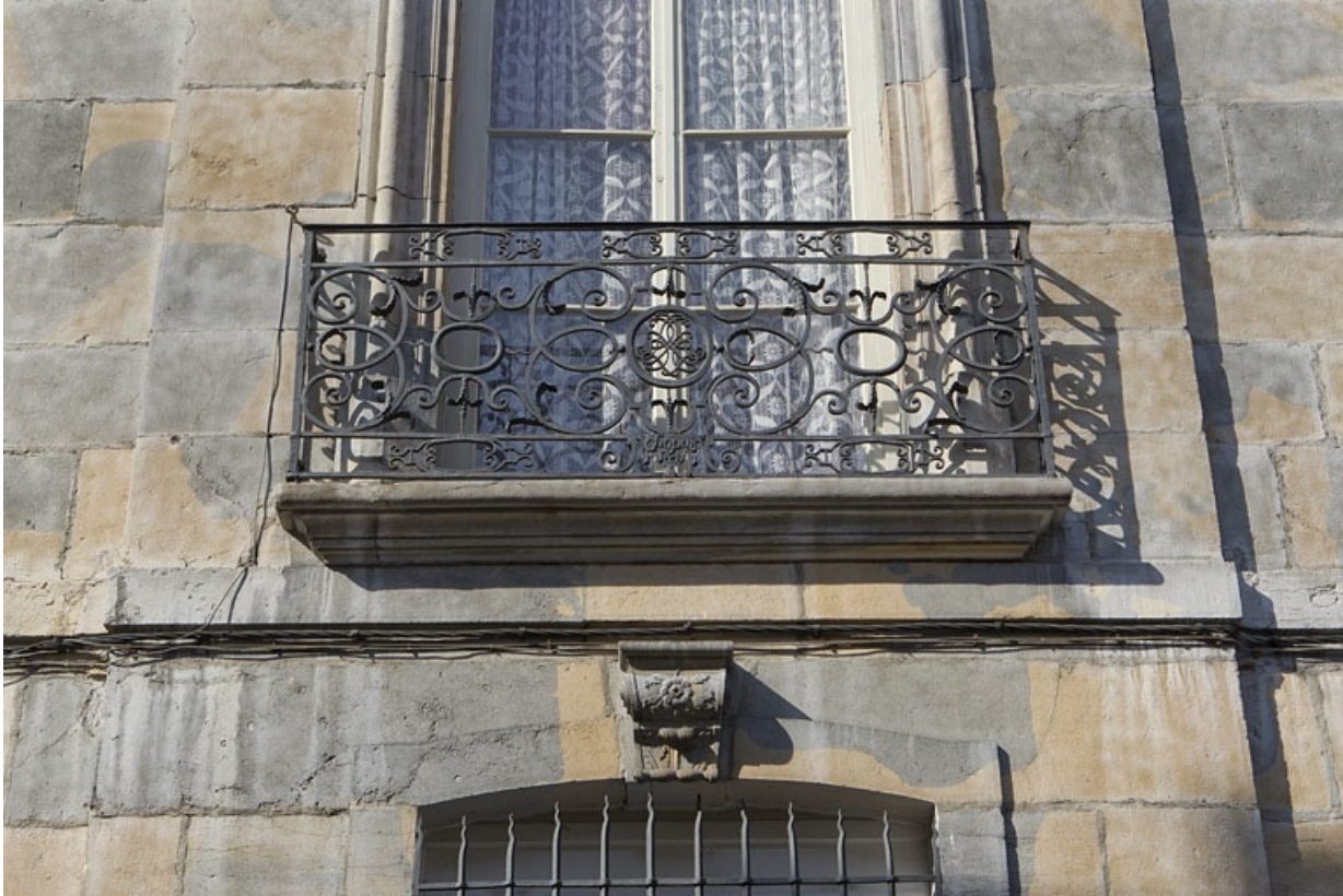
Aile droite : détail d'un garde-corps d'une fenêtre du premier étage.

25, Besançon, 8 rue des Martelots, lieudit : îlot Saint-Maurice