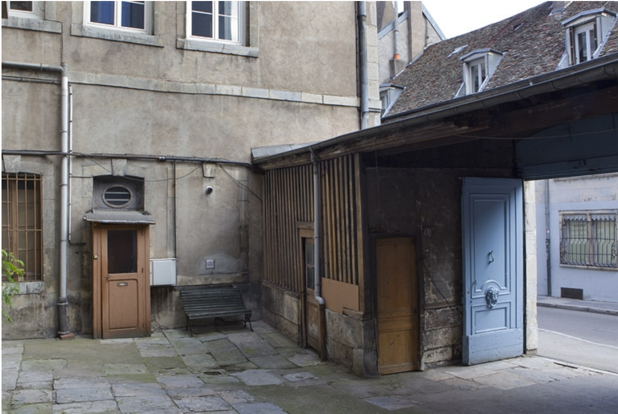
Détail du bûcher à droite du portail d'entrée.

25, Besançon, 8 rue des Martelots, lieudit : îlot Saint-Maurice