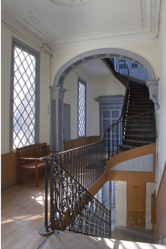
Vue des volées supérieures de l'escalier.

25, Besançon, 8 rue des Martelots, lieudit : îlot Saint-Maurice