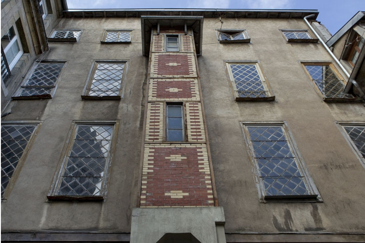
Vue d'ensemble de l'aile de l'escalier en fond de cour.

25, Besançon, 8 rue des Martelots, lieudit : îlot Saint-Maurice