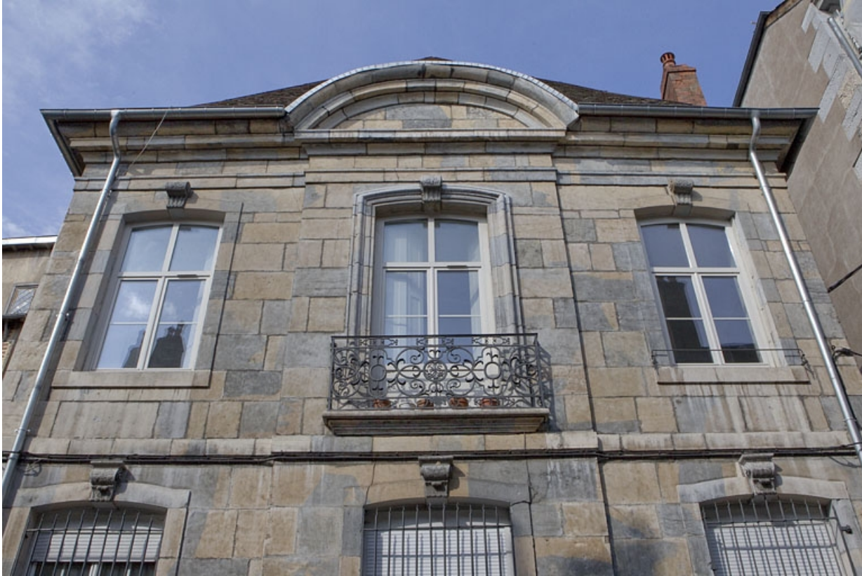
Aile droite : partie supérieure de la façade sur rue surmontée d'un fronton cintré.

25, Besançon, 8 rue des Martelots, lieudit : îlot Saint-Maurice