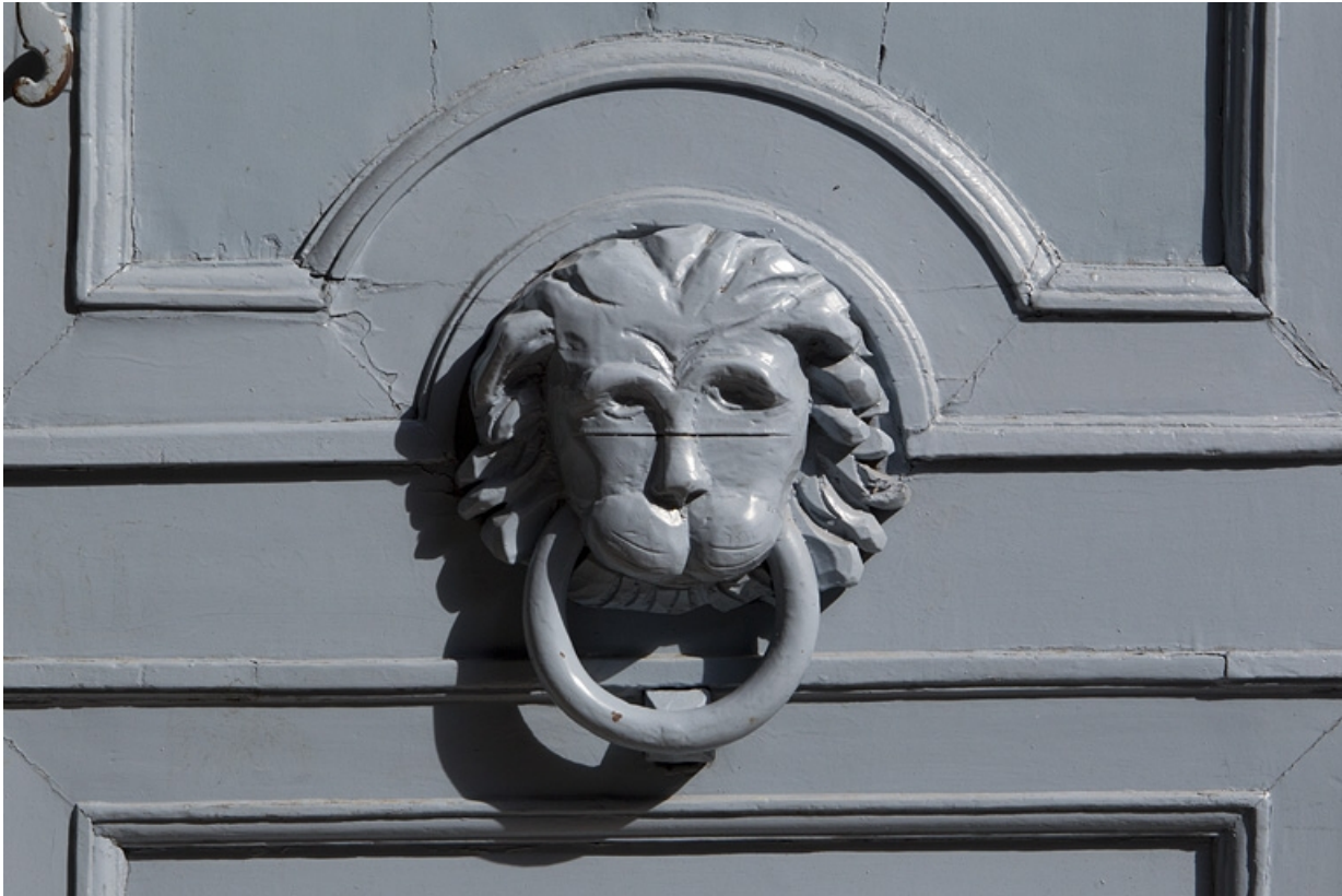
Portail d'entrée : détail du heurtor.

25, Besançon, 8 rue des Martelots, lieudit : îlot Saint-Maurice