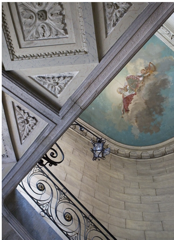
Intérieur : détail du plafond de la cage d'escalier.

25, Besançon, 2 rue des Martelots, lieudit : îlot Saint-Maurice