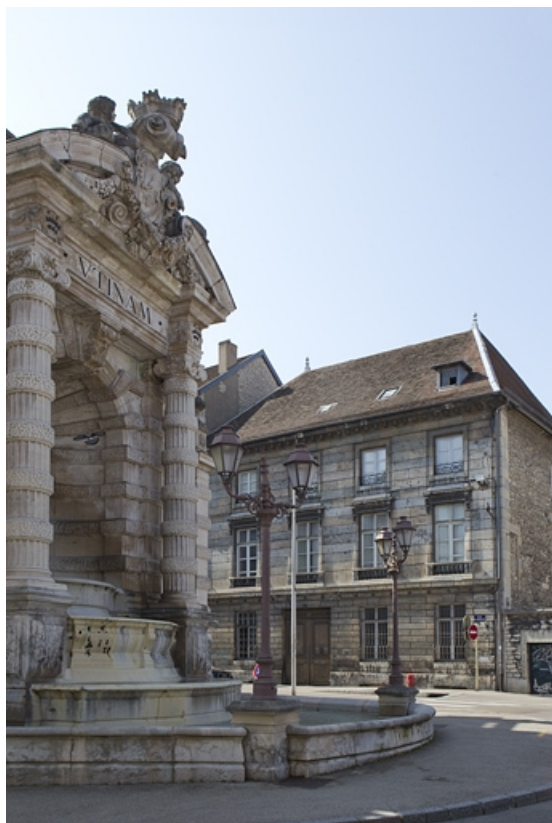
Vue d'ensemble éloignée de trois quarts droit.

25, Besançon, 2 rue des Martelots, lieudit : îlot Saint-Maurice