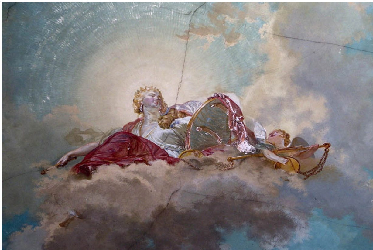
Intérieur, plafond de la cage d'escalier : détail du personnage féminin.

25, Besançon, 2 rue des Martelots, lieudit : îlot Saint-Maurice