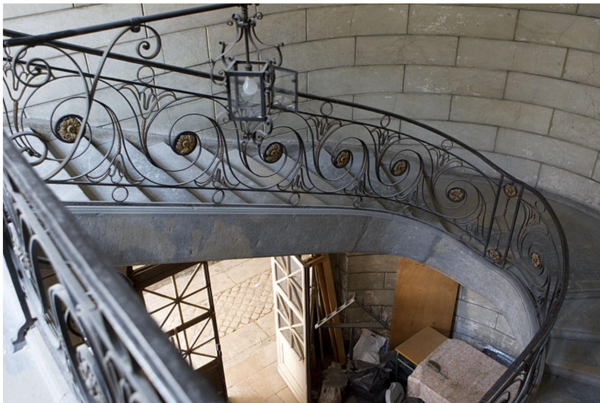
Intérieur : vue d'ensemble de l'escalier.

25, Besançon, 2 rue des Martelots, lieudit : îlot Saint-Maurice