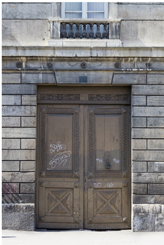
Façade antérieure : détail du portail d'entrée.

25, Besançon, 2 rue des Martelots, lieudit : îlot Saint-Maurice