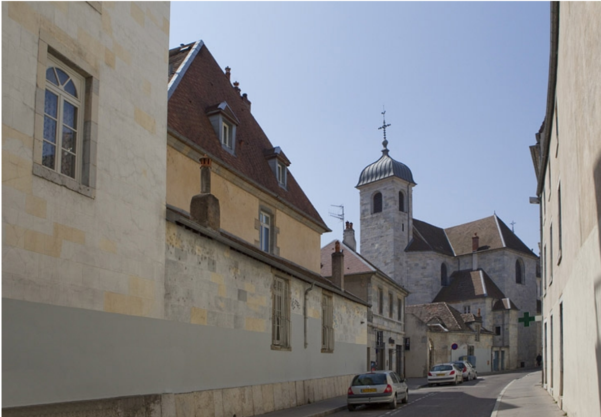
Vue d'ensemble des bâtiments depuis l'entrée de la rue de la Bibliothèque.

25, Besançon, 92 rue des Granges, lieudit : îlot Saint-Maurice