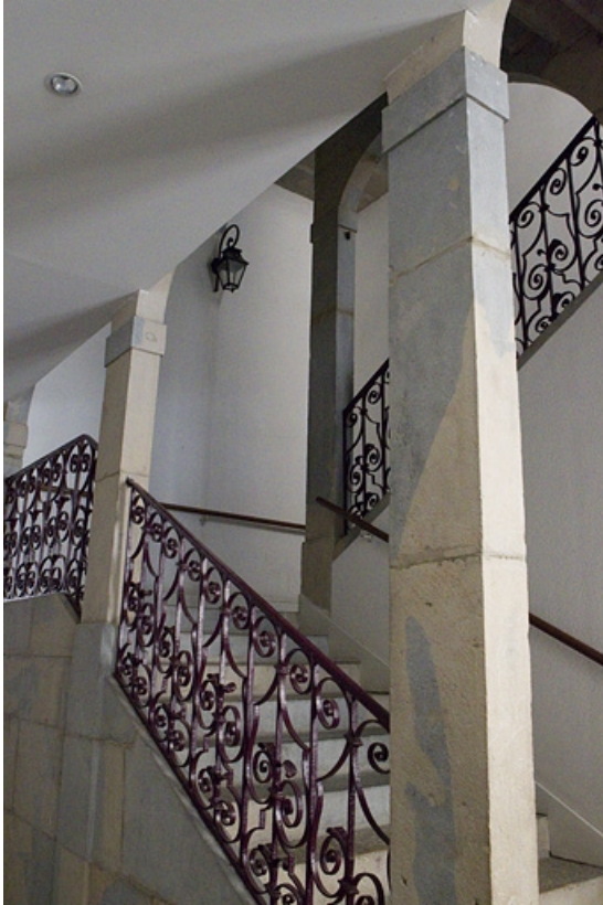
Maison entre les deux cours : détail des premières volées de l'escalier rampe sur rampe.

25, Besançon, 92 rue des Granges, lieudit : îlot Saint-Maurice