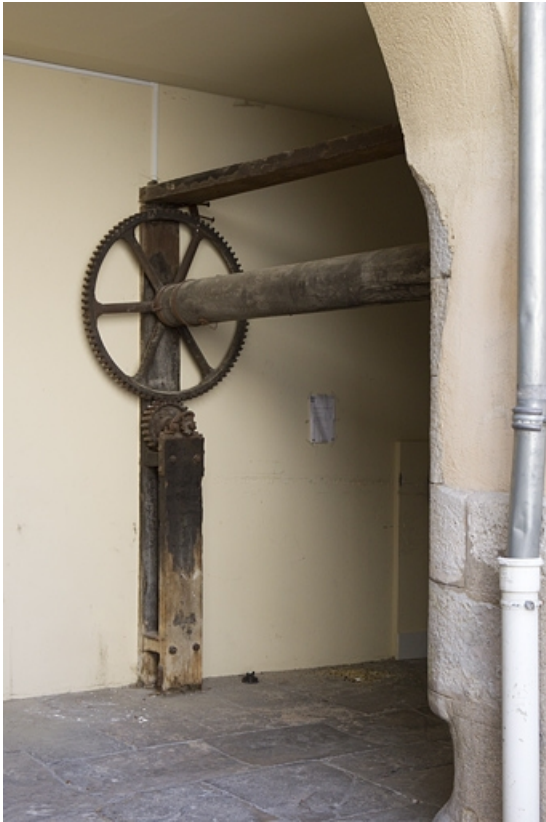
Détail du treuil pour monter et descendre les tonneaux dans la cave de l'immeuble.

25, Besançon, 92 rue des Granges, lieudit : îlot Saint-Maurice