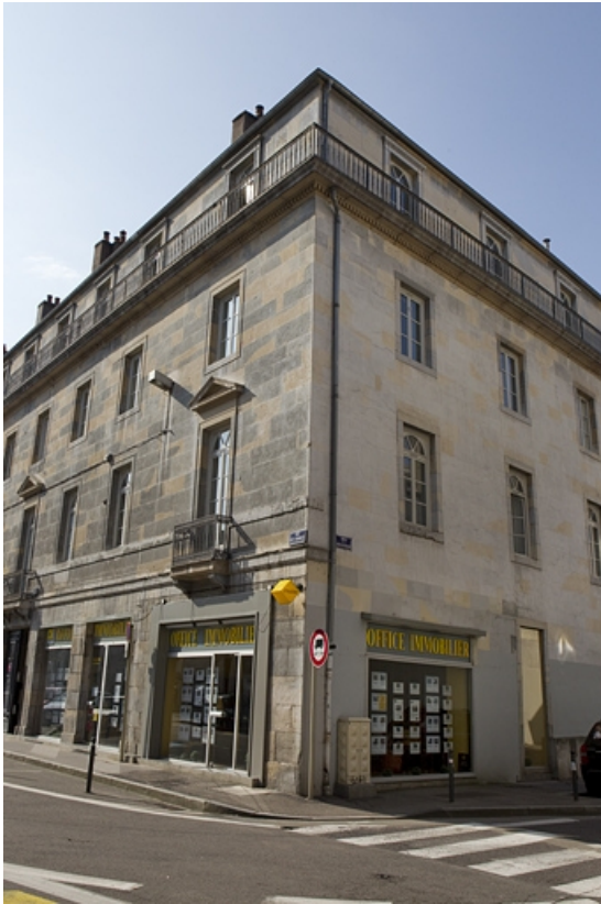
Immeuble sur rue : détail de l'angle droit, de trois quarts droit.

25, Besançon, 92 rue des Granges, lieudit : îlot Saint-Maurice