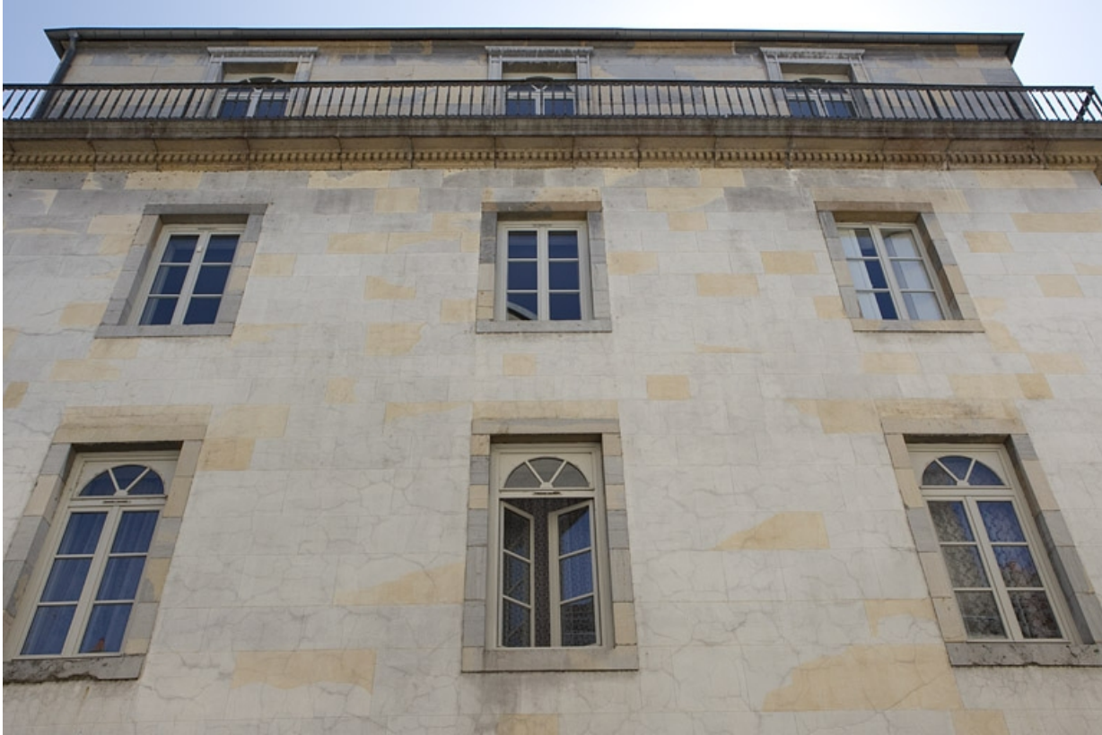
Immeuble sur rue : façade latérale droite.

25, Besançon, 92 rue des Granges, lieudit : îlot Saint-Maurice