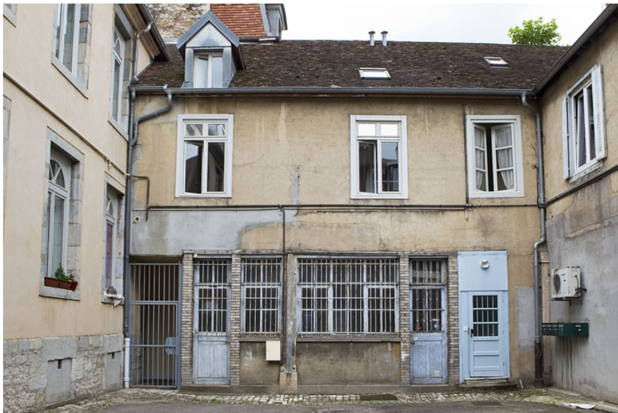
Bâtiment en U : détail de l'aile au fond de la deuxième cour avec un atelier au rez-de-chaussée. 25, Besançon, 92 rue des Granges, lieudit : îlot Saint-Maurice