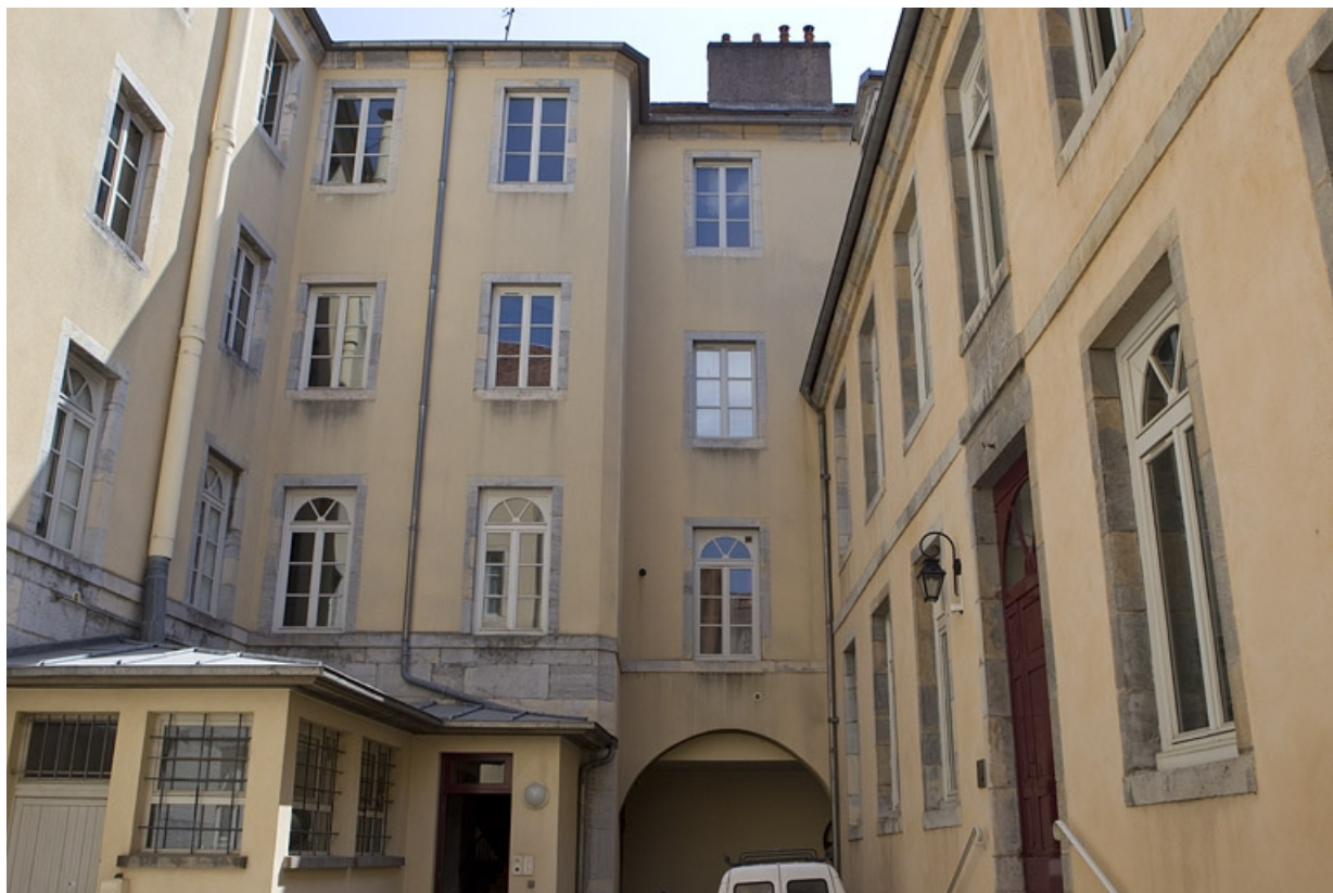
Aile droite de l'immeuble et façade antérieure de la maison entre les deux cours.

25, Besançon, 92 rue des Granges, lieudit : îlot Saint-Maurice