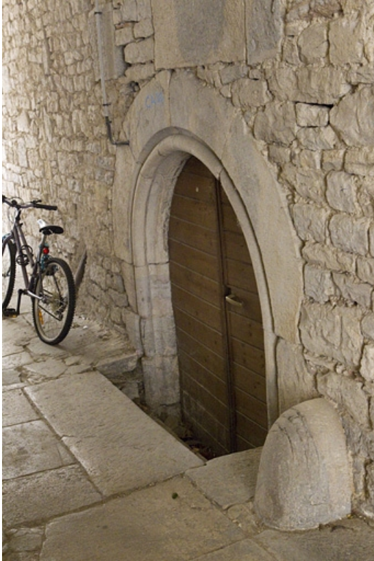
Détail de l'entrée de la cave de la maison entre les deux cours.

25, Besançon, 92 rue des Granges, lieudit : îlot Saint-Maurice