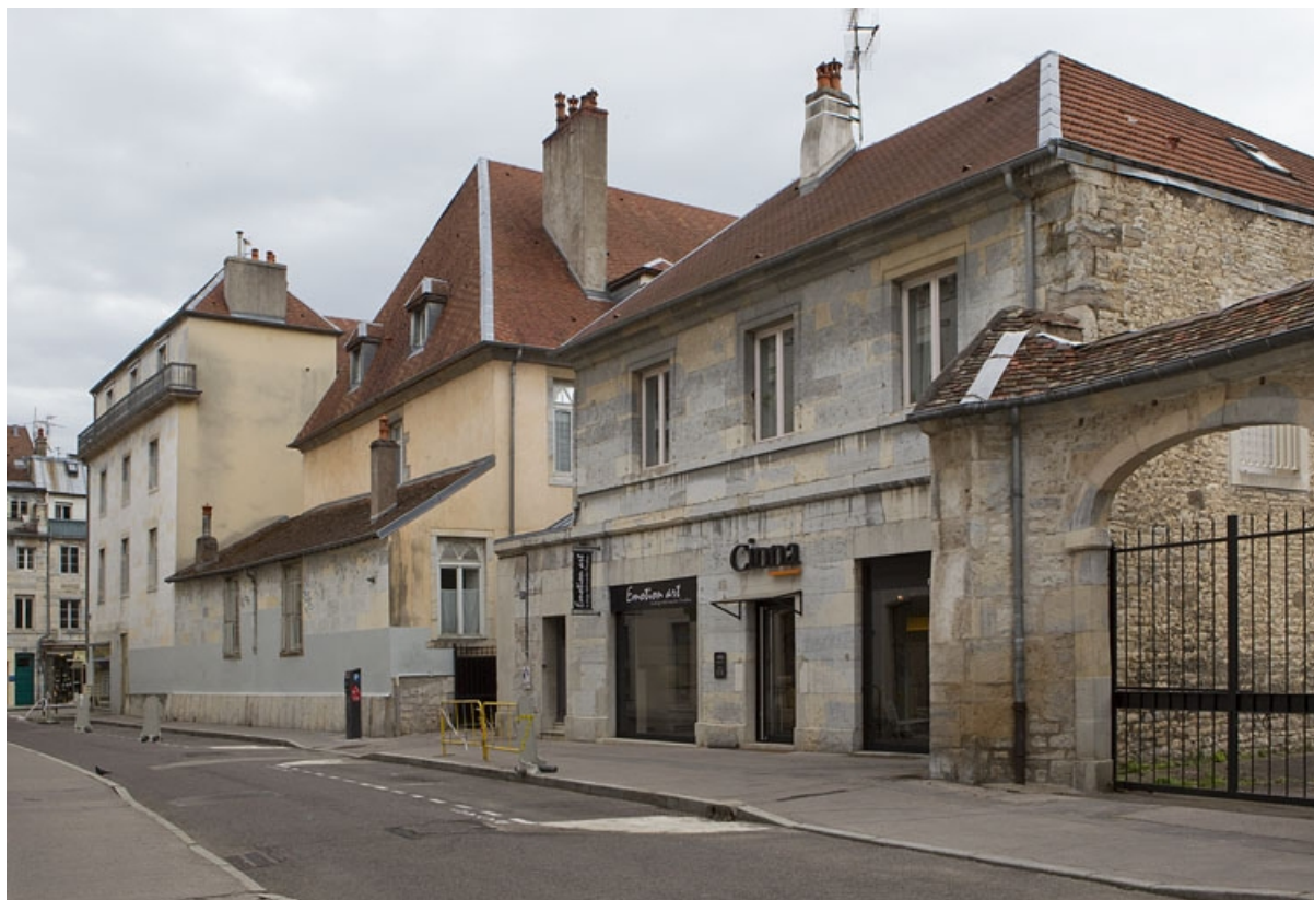
Vue d'ensemble rapprochée des bâtiments depuis la rue de la bibliothèque.

25, Besançon, 92 rue des Granges, lieudit : îlot Saint-Maurice