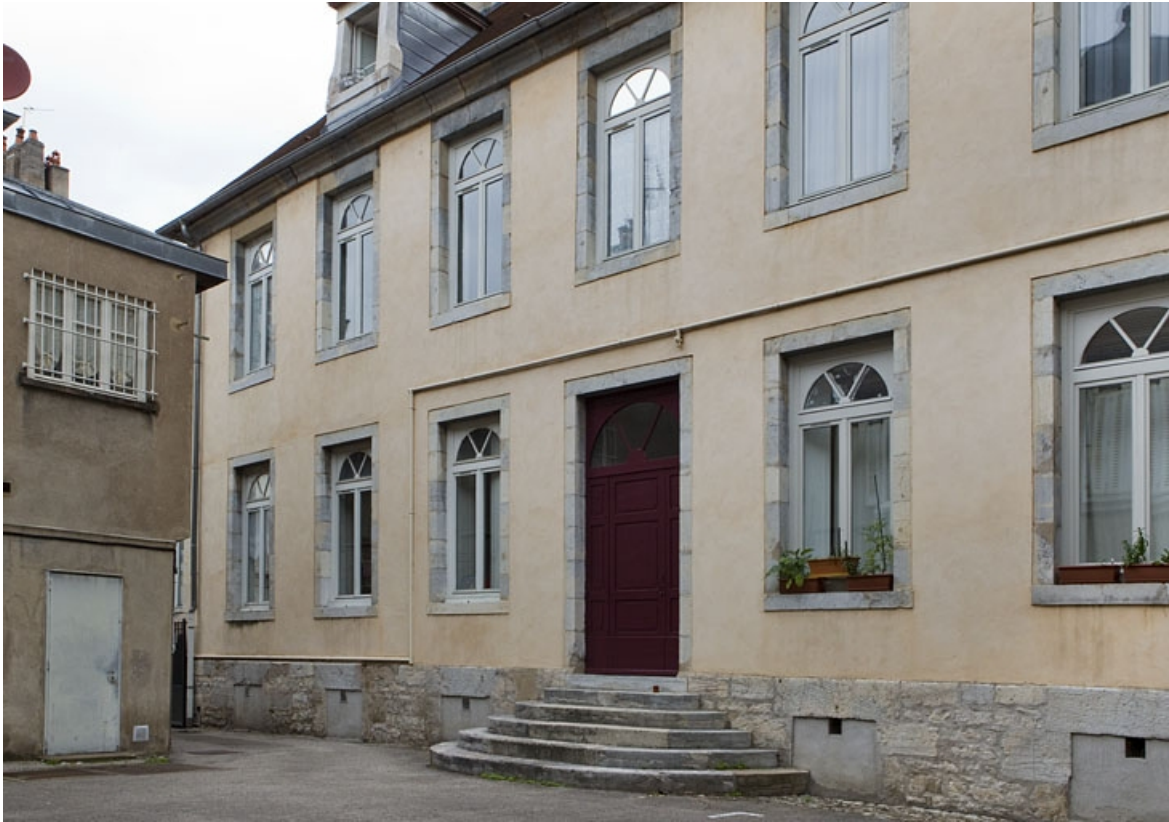
Maison entre les deux cour : façade postérieure de trois quarts droit.

25, Besançon, 92 rue des Granges, lieudit : îlot Saint-Maurice