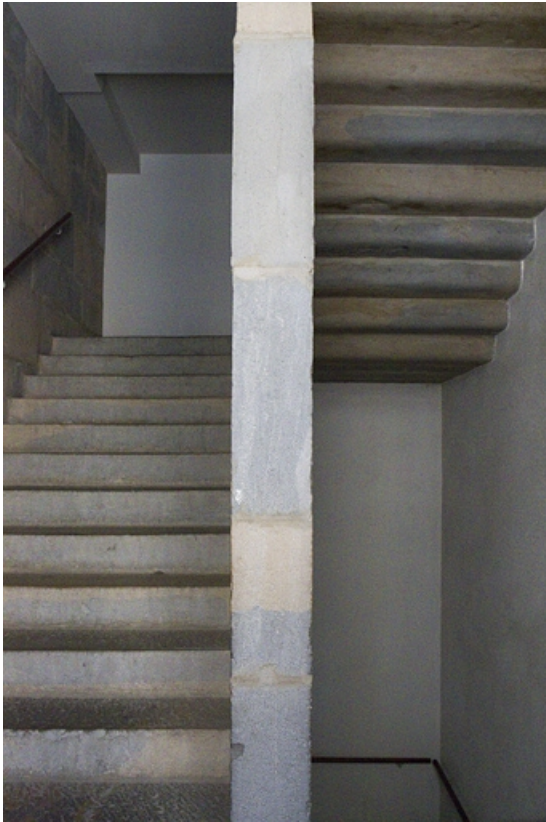
Maison entre les deux cours : détail de l'escalier rampe sur rampe, partie supérieure.

25, Besançon, 92 rue des Granges, lieudit : îlot Saint-Maurice