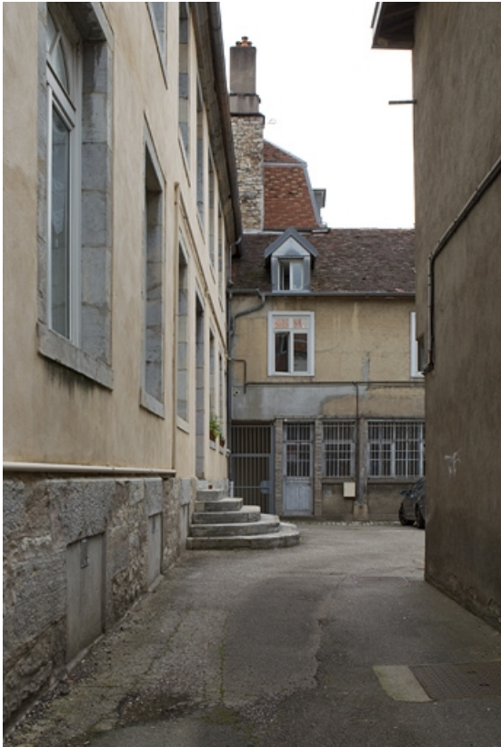
Vue de la deuxième cour depuis l'entrée.

25, Besançon, 92 rue des Granges, lieudit : îlot Saint-Maurice