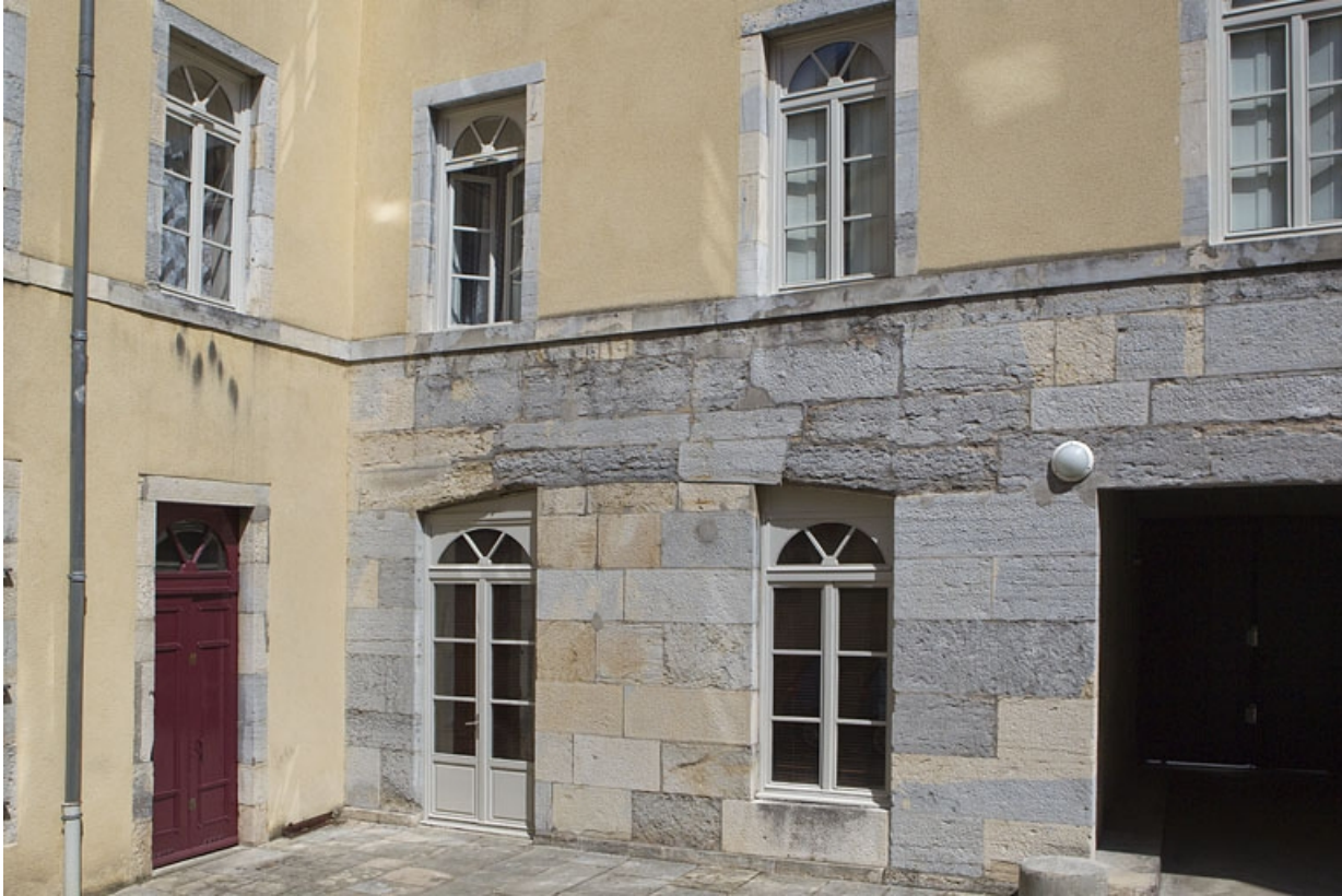
Immeuble : vue des façades sur la première cour à droite du passage cocher.

25, Besançon, 92 rue des Granges, lieudit : îlot Saint-Maurice