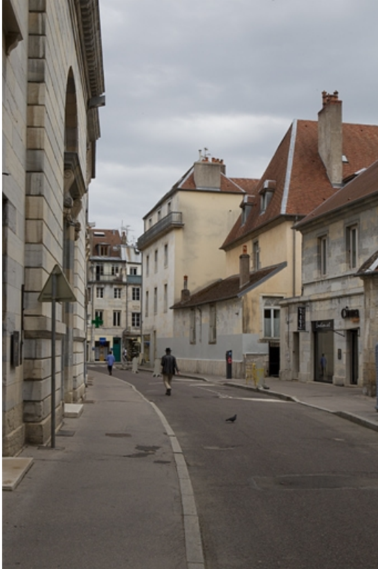
Vue d'ensemble des bâtiments depuis la rue de la bibliothèque.

25, Besançon, 92 rue des Granges, lieudit : îlot Saint-Maurice