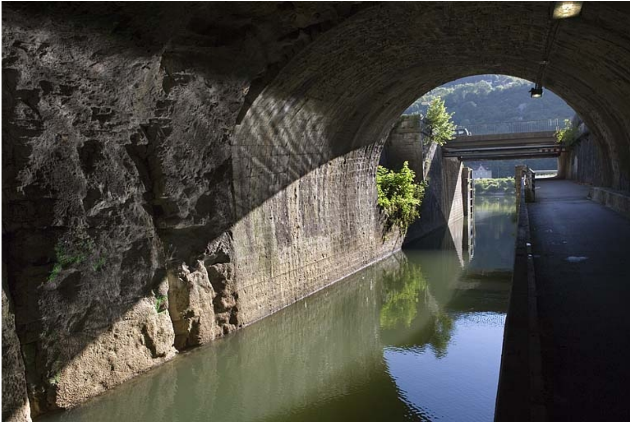
Vue d'ensemble depuis le tunnel.