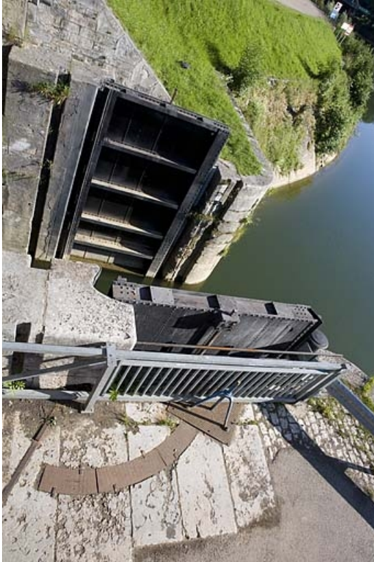
Vue plongeante sur les deux vantaux.

25, Besançon Faubourg Rivotte, lieudit : îlot Faubourg Rivotte