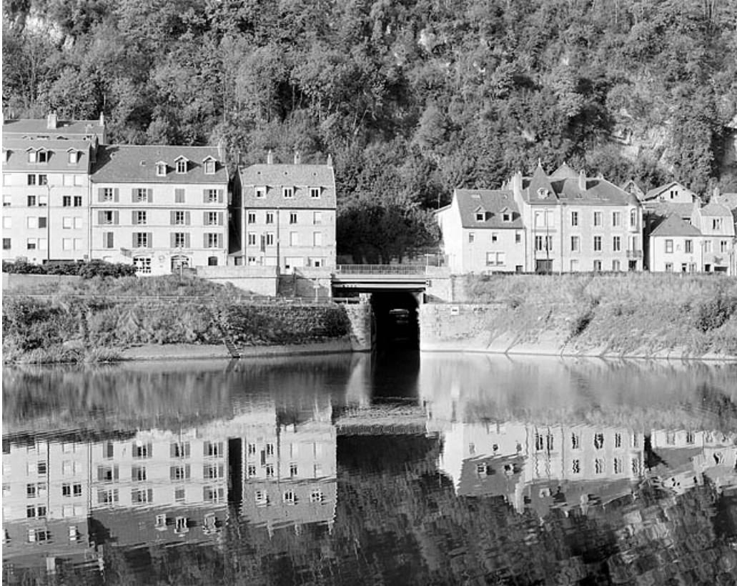
Vue d'ensemble de la porte de garde et de l'extrémité amont du tunnel.

25, Besançon Faubourg Rivotte, lieudit : îlot Faubourg Rivotte