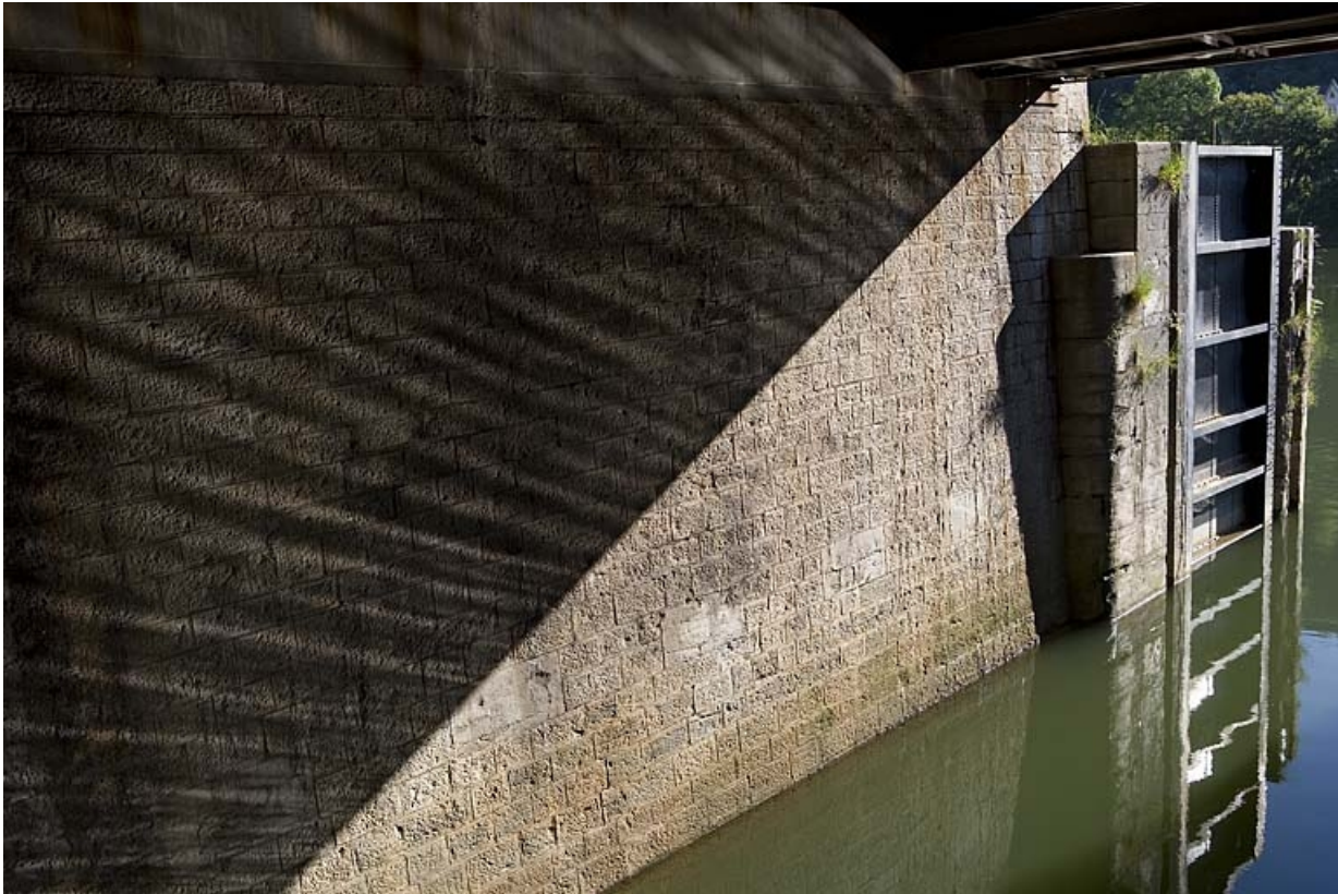
Vantail et bajoyer droit, depuis le passage sous le pont routier.

25, Besançon Faubourg Rivotte, lieudit : îlot Faubourg Rivotte