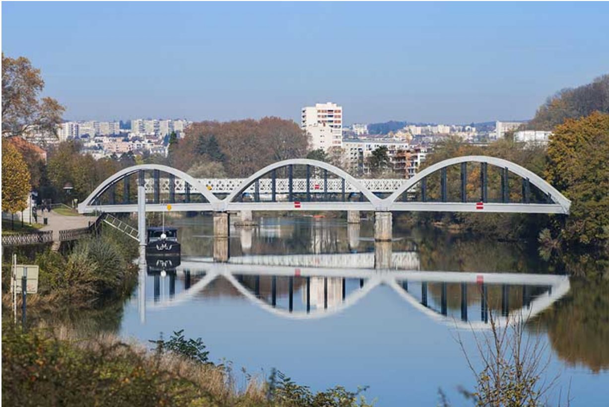
Vue d'ensemble depuis l'aval en 2013.