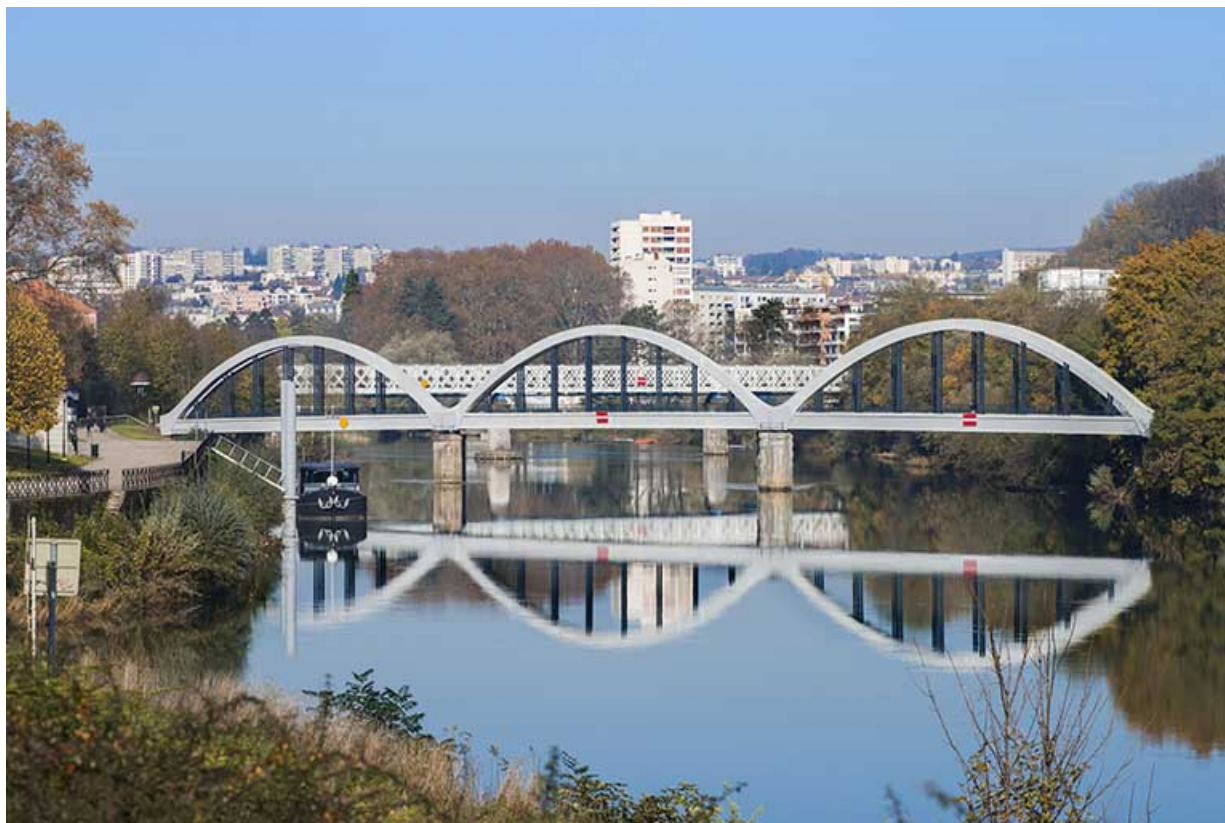
Vue d'ensemble depuis l'aval en 2013.