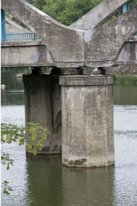
Piles côté rive gauche.

25, Besançon Faubourg Rivotte, lieudit : îlot Porte Rivotte