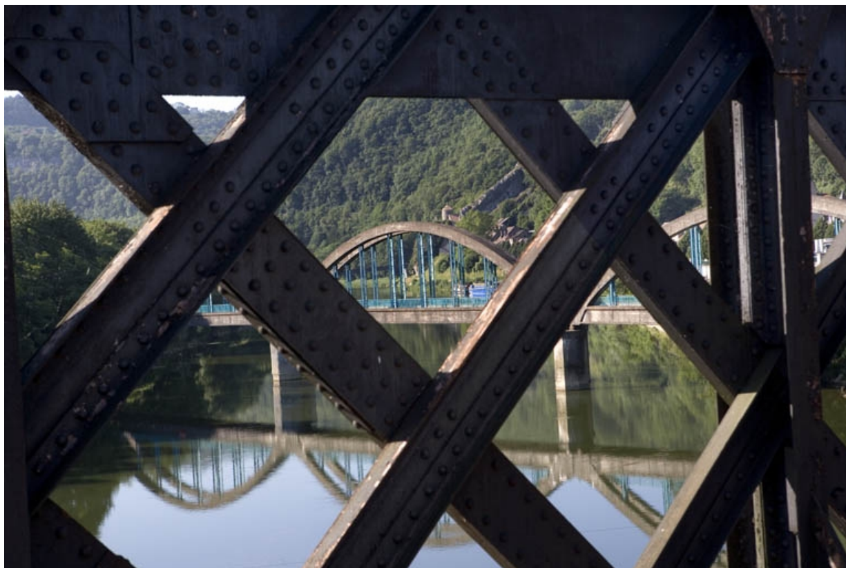
Vue d'ensemble du pont au travers du treillis métallique du pont-rail de la ligne de Morteau.

25, Besançon Faubourg Rivotte, lieu-dit : îlot Porte Rivotte