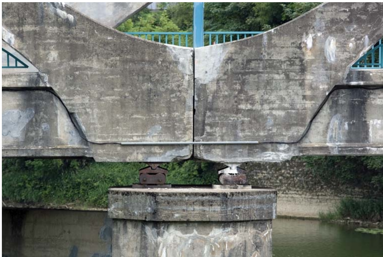
Doubles rotules supportant le tablier (piles côté rive gauche).

25, Besançon Faubourg Rivotte, lieudit : îlot Porte Rivotte