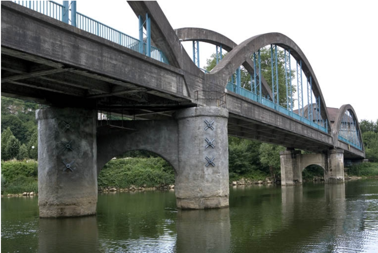
Face aval depuis la rive droite.

25, Besançon Faubourg Rivotte, lieudit : îlot Porte Rivotte