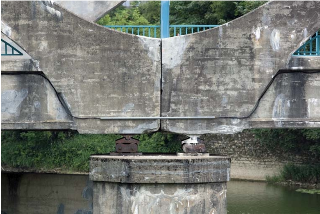
Doubles rotules supportant le tablier (piles côté rive gauche).

25, Besançon Faubourg Rivotte, lieudit : îlot Porte Rivotte