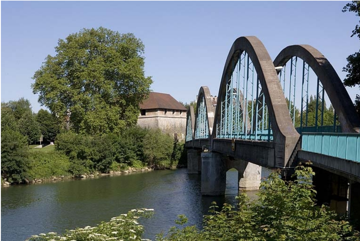
Face amont depuis la rive droite.

25, Besançon Faubourg Rivotte, lieudit : îlot Porte Rivotte