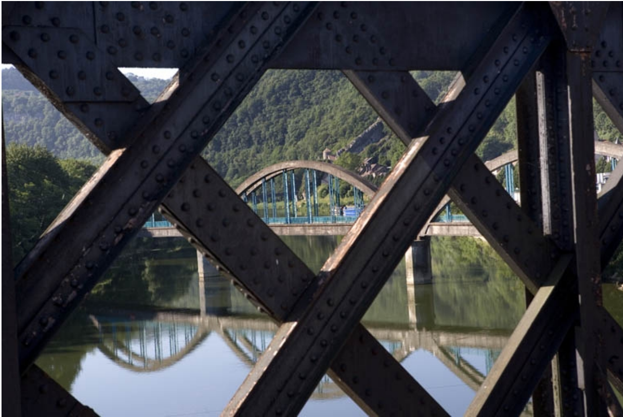
Vue d'ensemble du pont au travers du treillis métallique du pont-rail de la ligne de Morteau.

25, Besançon Faubourg Rivotte, lieudit : îlot Porte Rivotte