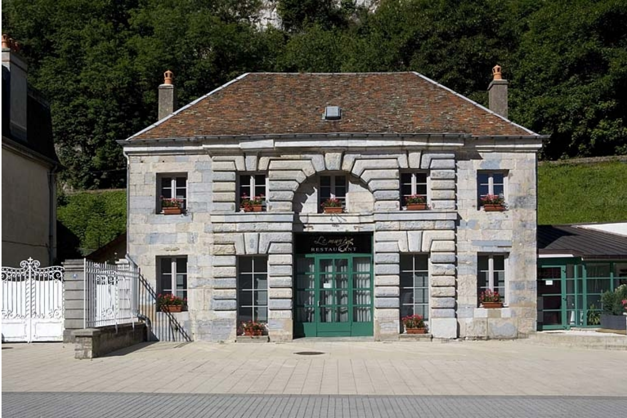
Vue d'ensemble, de face.