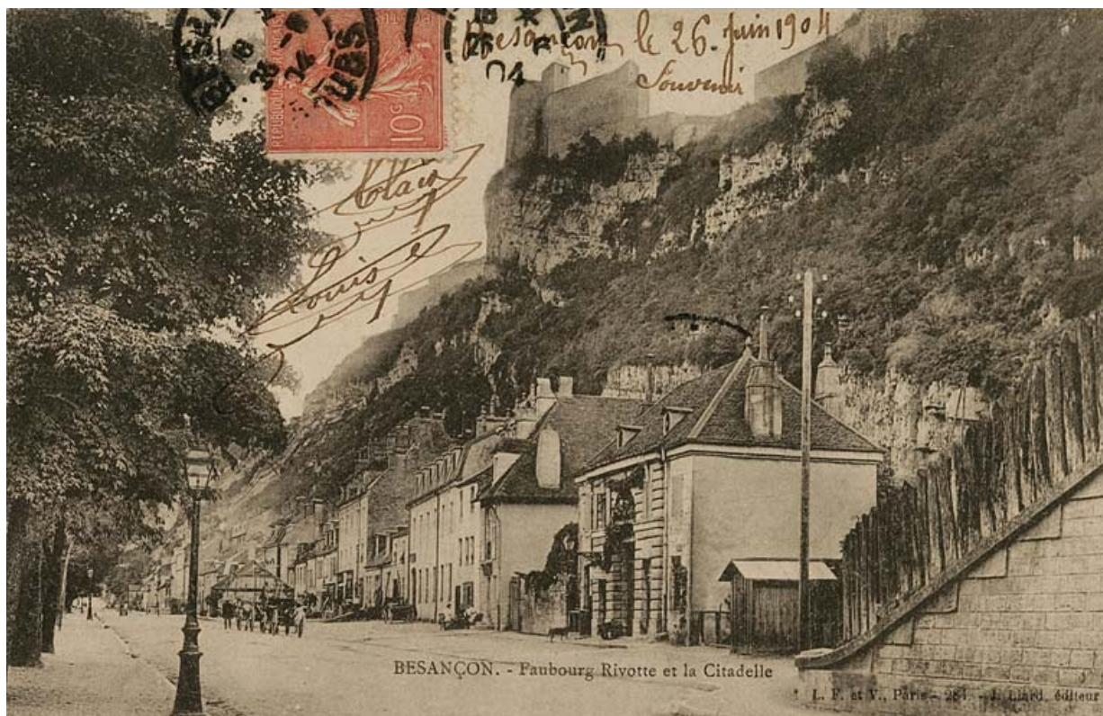
Besançon. - Faubourg Rivotte et la Citadelle [depuis la route sous le pont du chemin de fer], avant le 26 juin 1904.

25, Besançon Faubourg Rivotte 2, lieudit : îlot Porte Rivotte