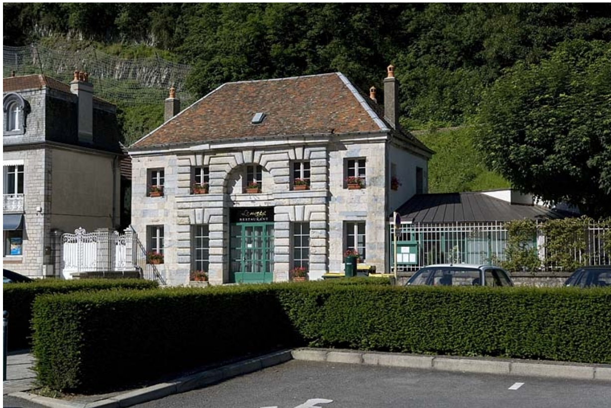
Vue d'ensemble, de trois quarts droite.

25, Besançon Faubourg Rivotte 2, lieudit : îlot Porte Rivotte