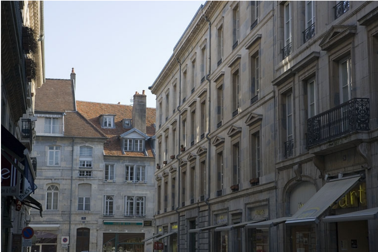
Détail de la façade principale, de trois quart droit.

25, Besançon, 12 rue Moncey, lieudit : îlot Forum