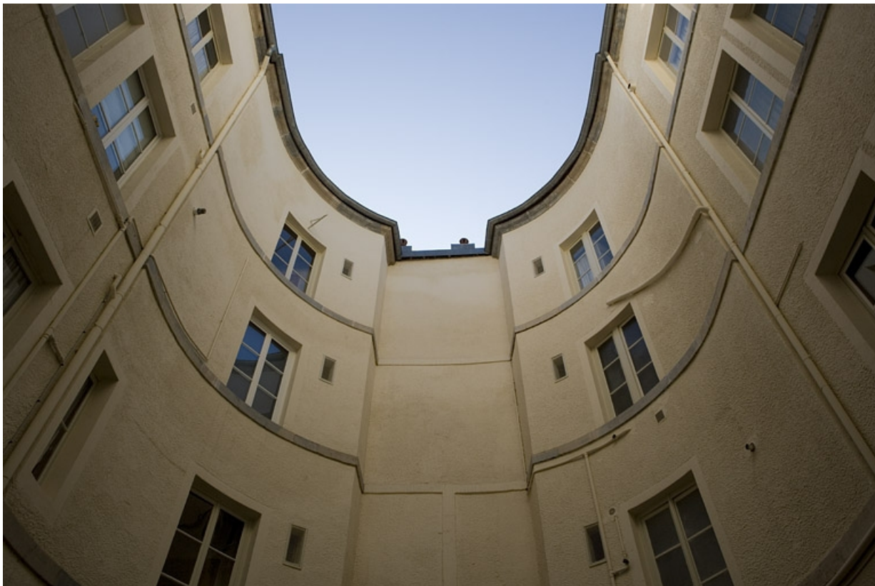
Vue des bâtiments autour de la cour en contre-plongée.

25, Besançon, 12 rue Moncey, lieudit : îlot Forum