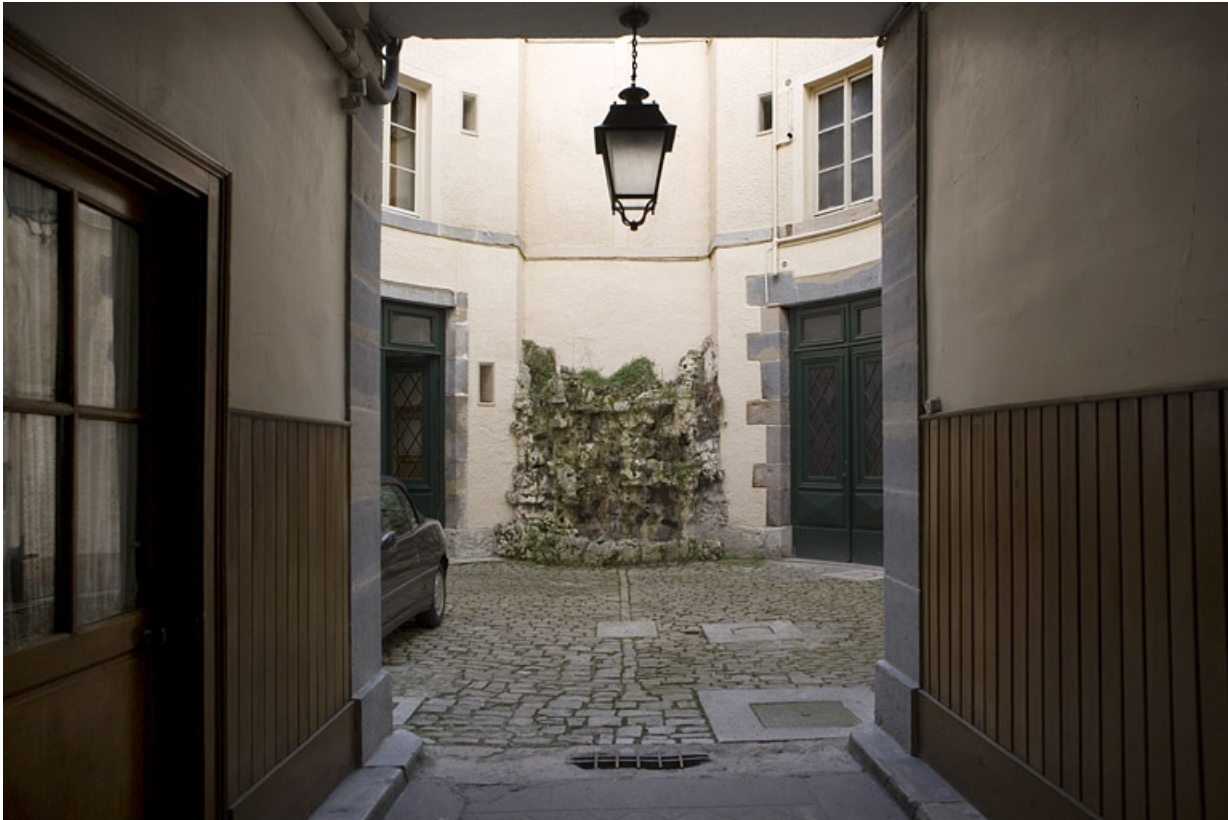
Vue de la cour depuis le passage cochier.

25, Besançon, 12 rue Moncey, lieudit : îlot Forum