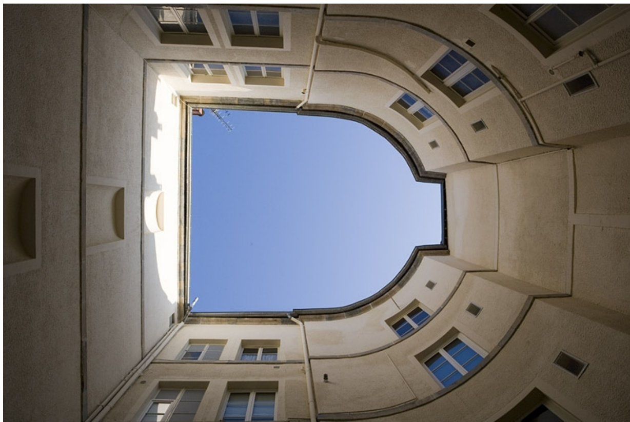
Vue des bâtiments autour de la cour en contre-plongée.

25, Besançon, 12 rue Moncey, lieudit : îlot Forum