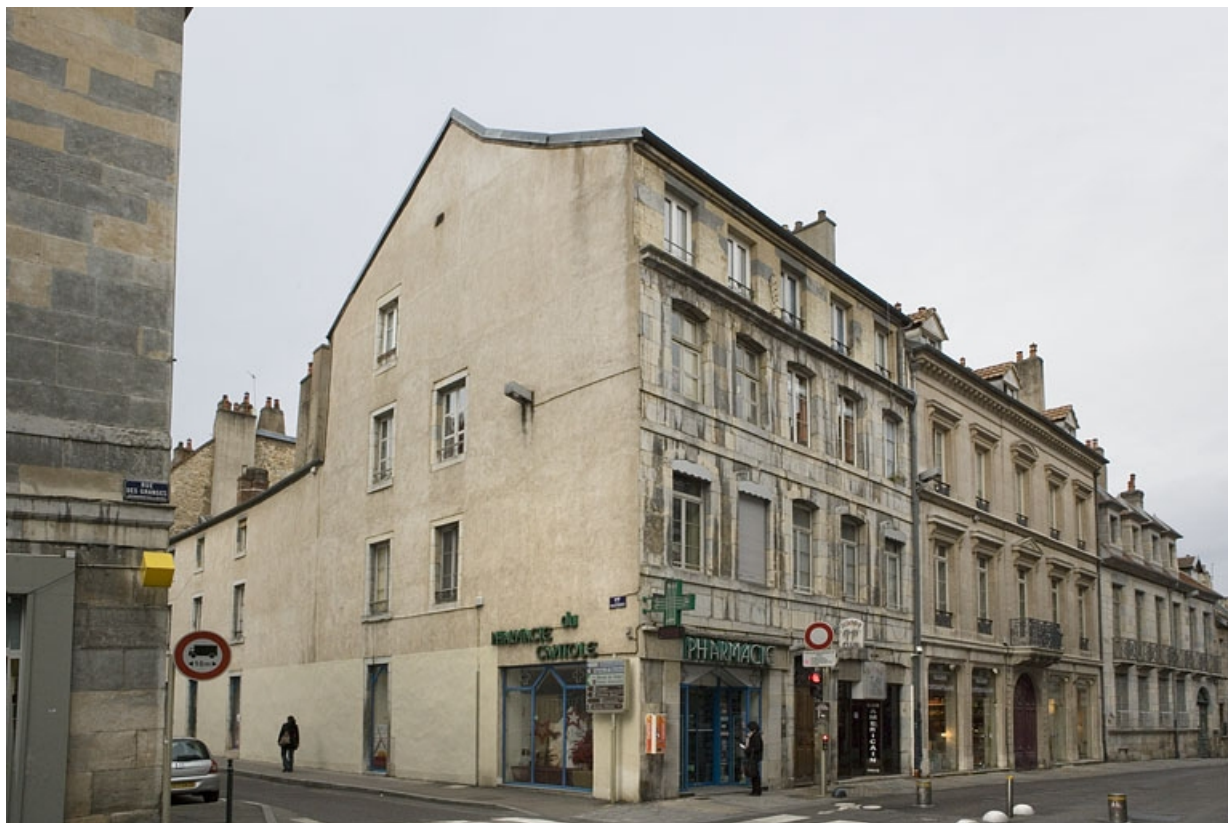
Vue d'ensemble de la maison de trois quarts gauche.

25, Besançon, 90 rue des Granges, lieudit : îlot Forum