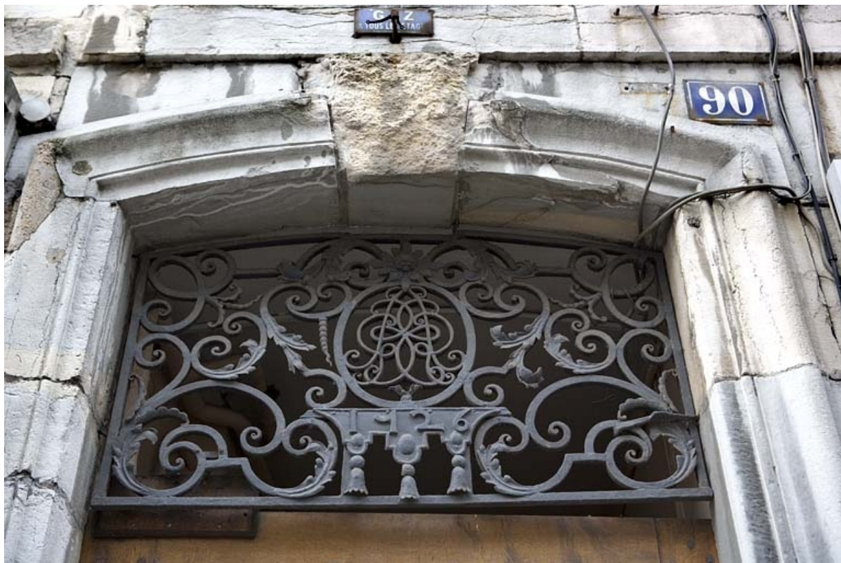
Détail du tympan en ferronnerie de la porte du couloir.

25, Besançon, 90 rue des Granges, lieudit : îlot Forum