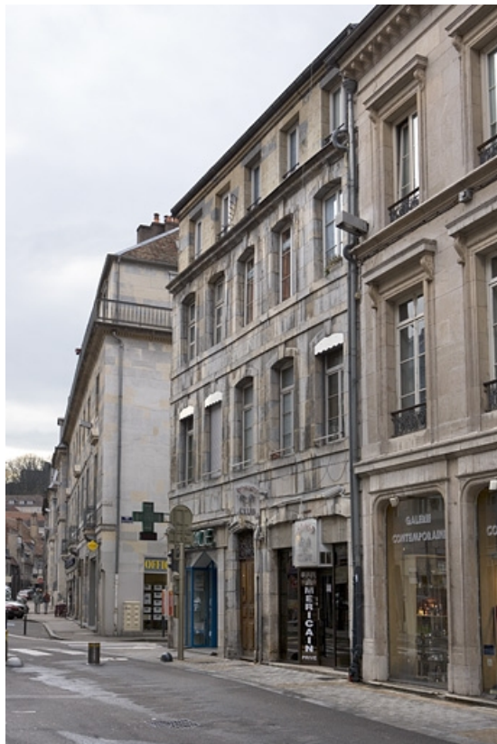
Vue d'ensemble de la façade sur rue de trois quarts droit.

25, Besançon, 90 rue des Granges, lieudit : îlot Forum