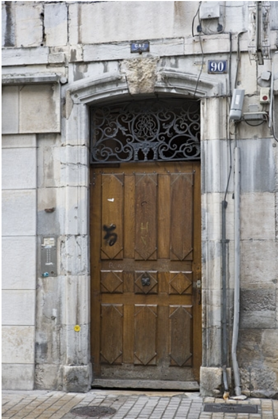
Détail de la porte du couloir d'entrée.

25, Besançon, 90 rue des Granges, lieudit : îlot Forum