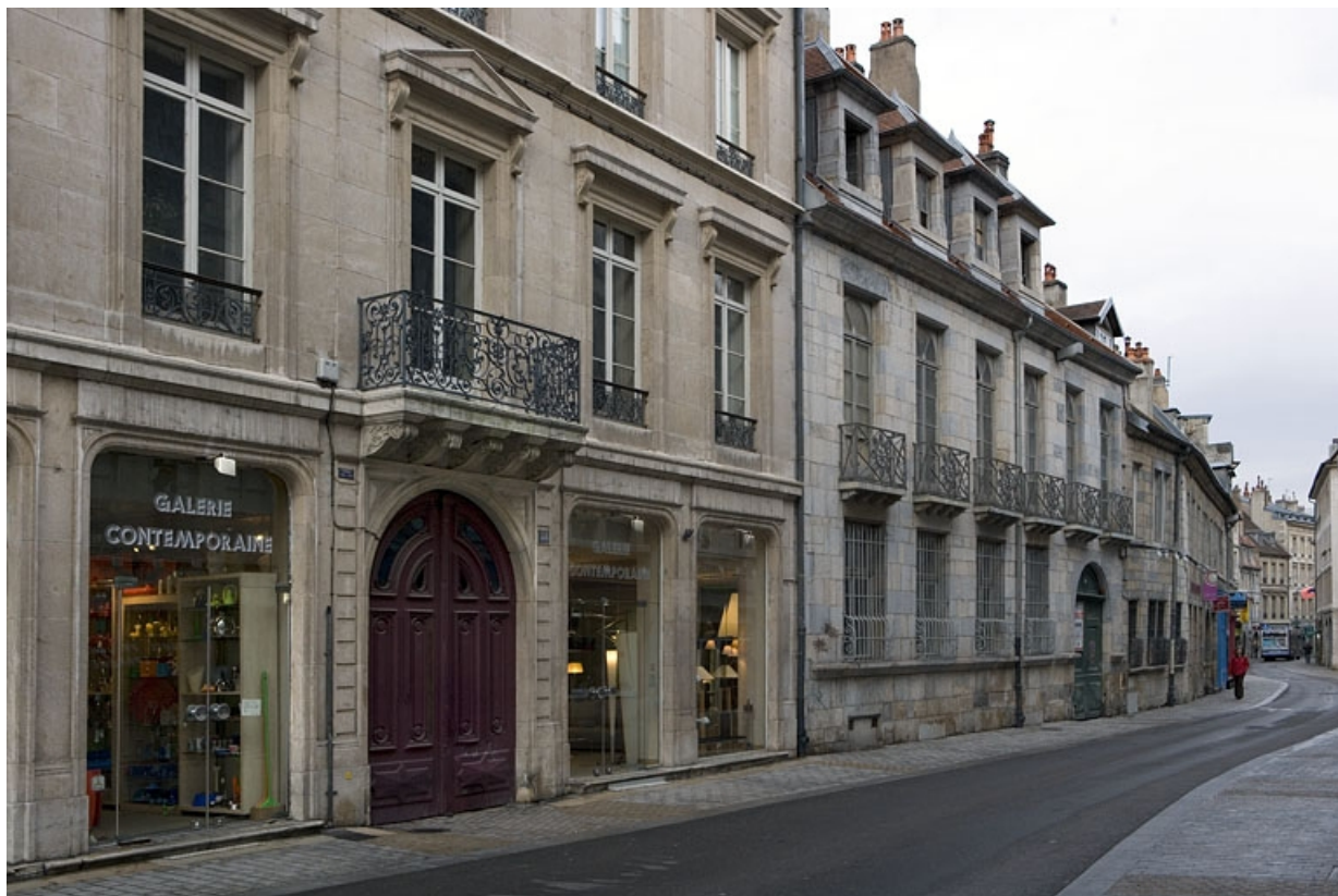
Vue d'ensemble de la façade sur rue, de trois quarts gauche.

25, Besançon, 88 rue des Granges, lieudit : îlot Forum