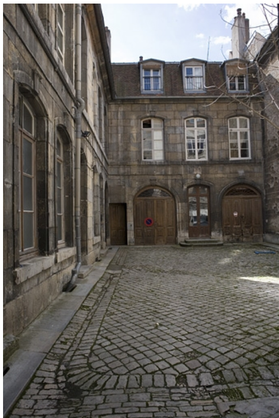
Vue d'ensemble de l'aile en fond de cour.

25, Besançon, 88 rue des Granges, lieudit : îlot Forum