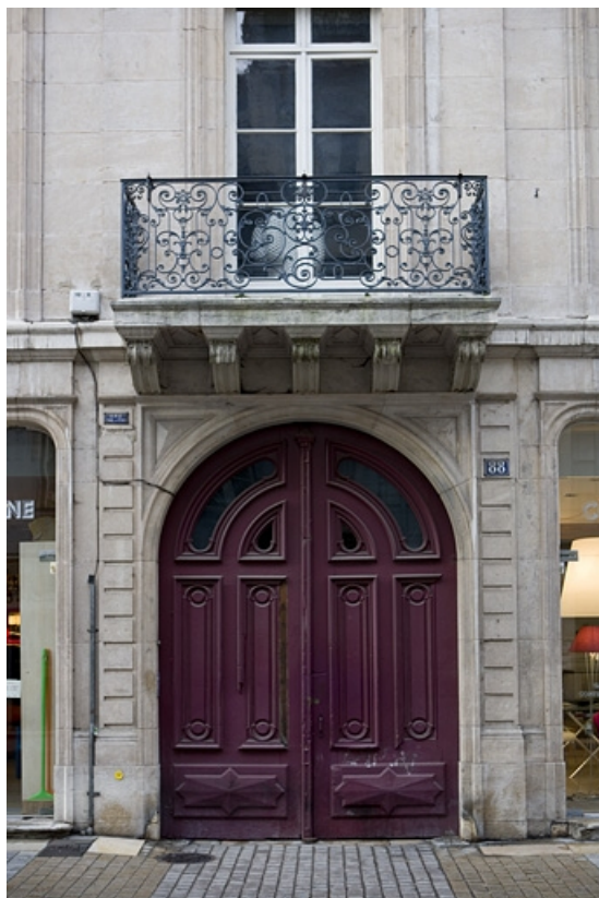
Détail du portail d'entrée, de face.

25, Besançon, 88 rue des Granges, lieudit : îlot Forum