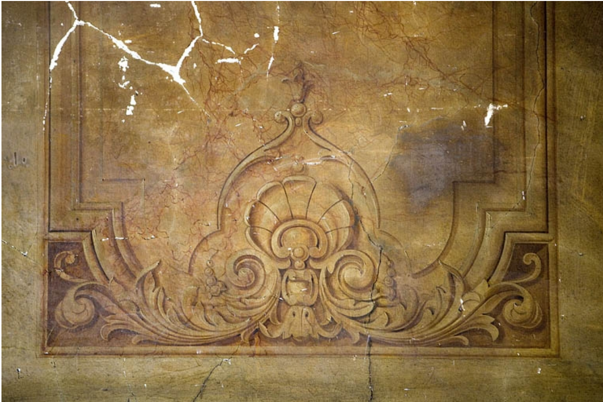
Peintures murales du passage cocher : détail du décor à la partie inférieure d'un panneau.

25, Besançon, 88 rue des Granges, lieudit : îlot Forum