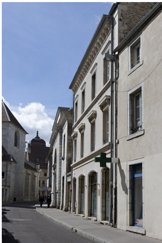
Vue éloignée du logis secondaire situé rue de la Bibliothèque,dans l'alignement de la rue.

25, Besançon, 88 rue des Granges, lieudit : îlot Forum