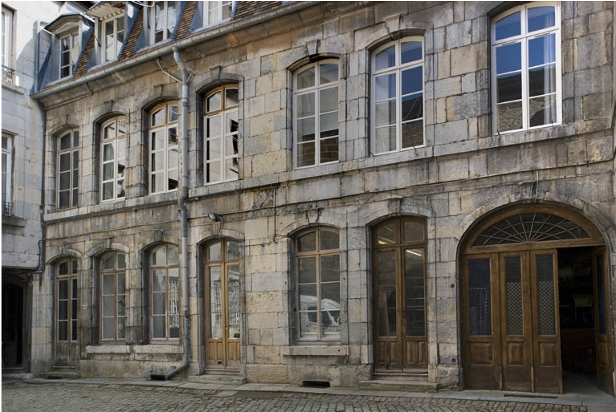
Vue d'ensemble de l'aile gauche sur cour.

25, Besançon, 88 rue des Granges, lieudit : îlot Forum