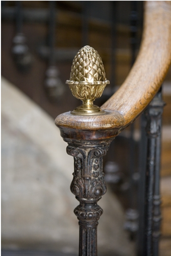
Détail du départ de la rampe d'appui de l'escalier principal.

25, Besançon, 88 rue des Granges, lieudit : îlot Forum