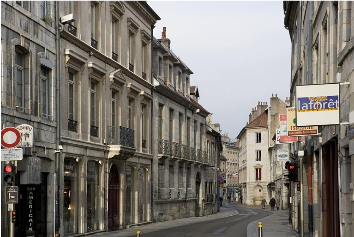
Vue d'ensemble de la façade sur rue de trois quarts gauche.

25, Besançon, 88 rue des Granges, lieudit : îlot Forum