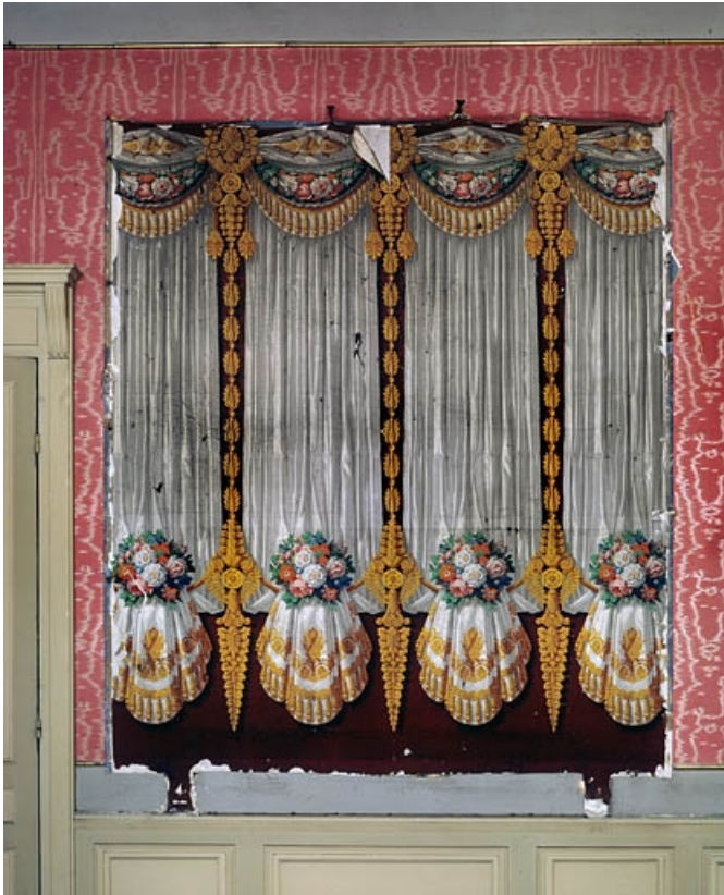
Logis principal : détail d'un papier peint du premier étage.

25, Besançon, 86 rue des Granges, lieudit : îlot Forum