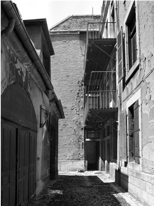
Logis secondaire droit : façade latérale gauche.

25, Besançon, 86 rue des Granges, lieudit : îlot Forum