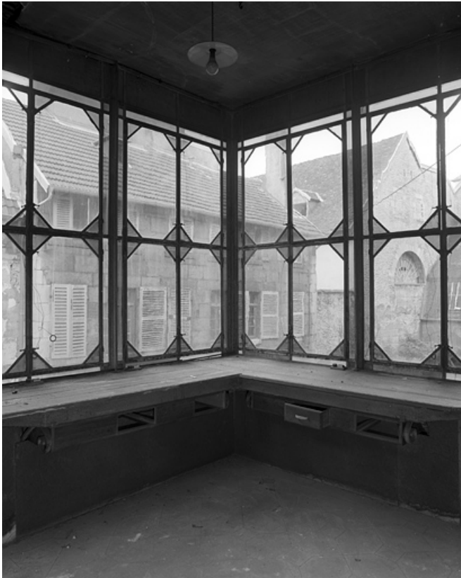
L'atelier d'horloger : vue intérieure.

25, Besançon, 86 rue des Granges, lieudit : îlot Forum