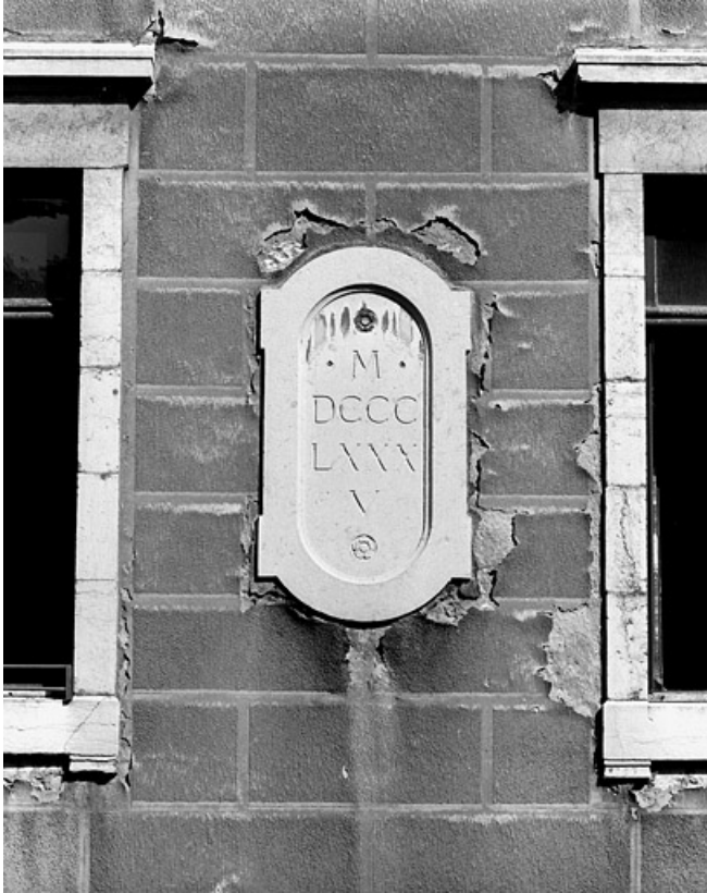
Logis secondaire : façade antérieure, détail du médaillon gauche.

25, Besançon, 86 rue des Granges, lieudit : îlot Forum