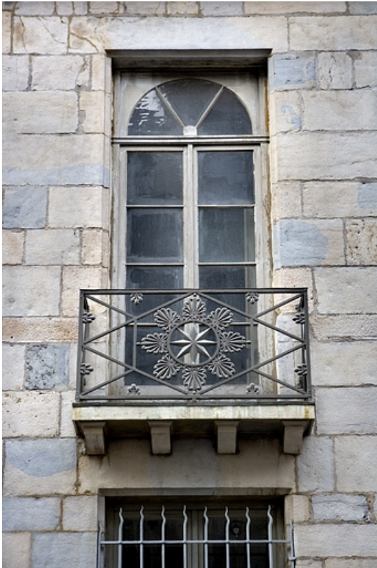
Détail d'une fenêtre du premier étage sur rue.

25, Besançon, 86 rue des Granges, lieudit : îlot Forum