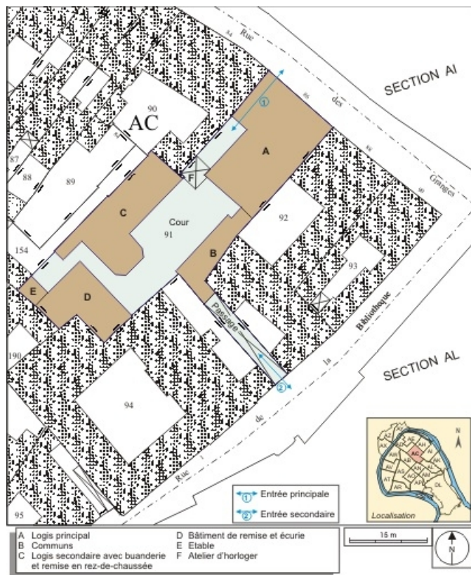
Plan masse et de situation. Extrait du plan cadastral, 1974, section AC. 25, Besançon, 86 rue des Granges, lieudit : îlot Forum