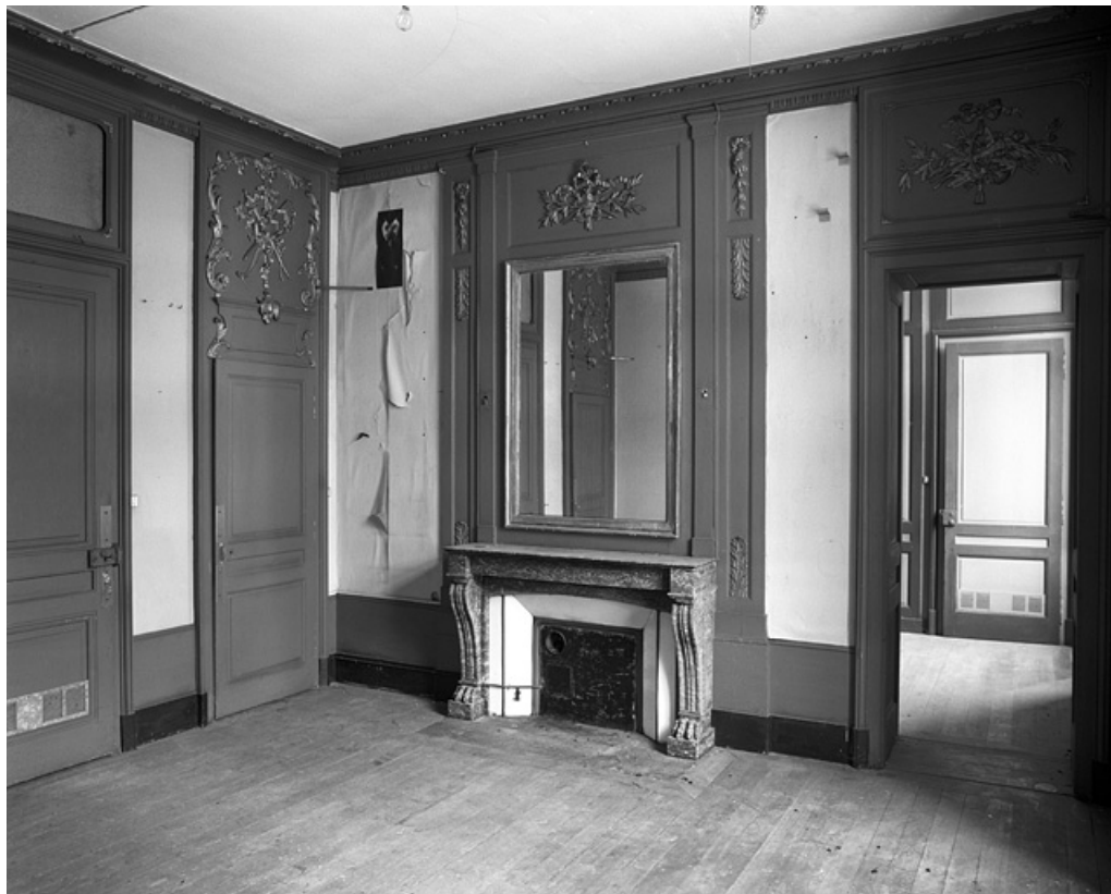
Logis secondaire droit : détail d'une pièce du premier étage.

25, Besançon, 86 rue des Granges, lieudit : îlot Forum