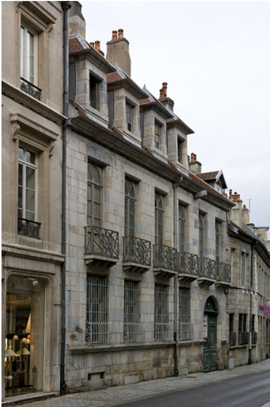
Vue d'ensemble depuis la rue de trois quarts gauche.

25, Besançon, 86 rue des Granges, lieudit : îlot Forum