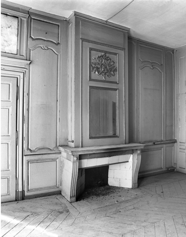
Logis principal : vue d'une cheminée dans une pièce du premier étage.

25, Besançon, 86 rue des Granges, lieudit : îlot Forum