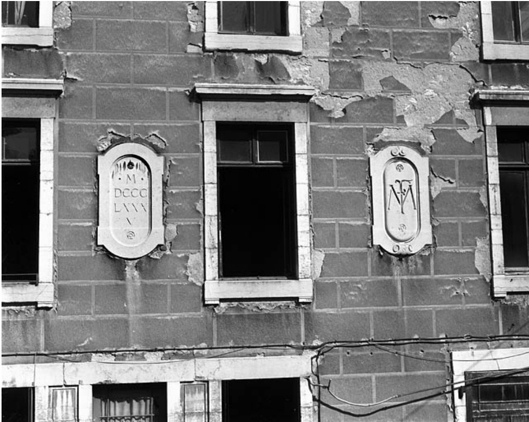
Logis secondaire : façade antérieure, détail des médaillons.

25, Besançon, 86 rue des Granges, lieudit : îlot Forum