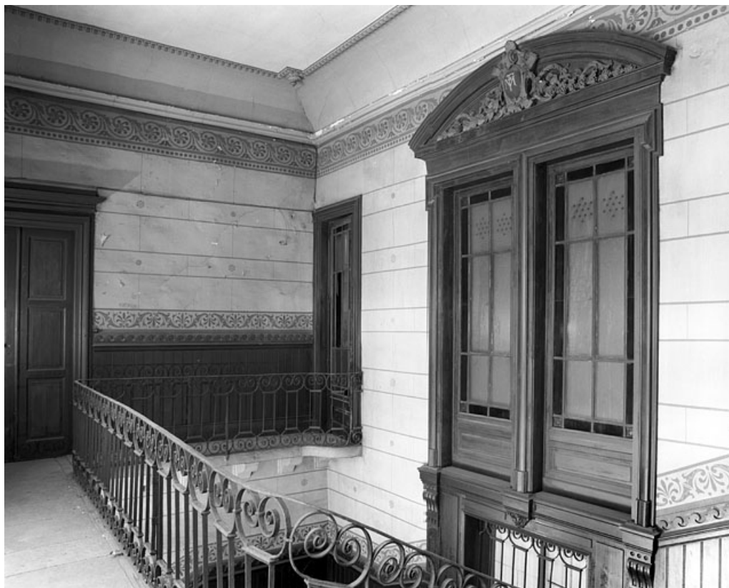
L'escalier d'honneur : vue depuis le palier du premier étage.

25, Besançon, 86 rue des Granges, lieudit : îlot Forum