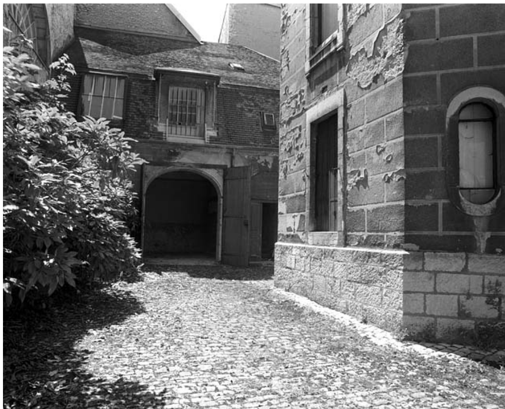
Vue du bâtiment des remises, de face.

25, Besançon, 86 rue des Granges, lieudit : îlot Forum