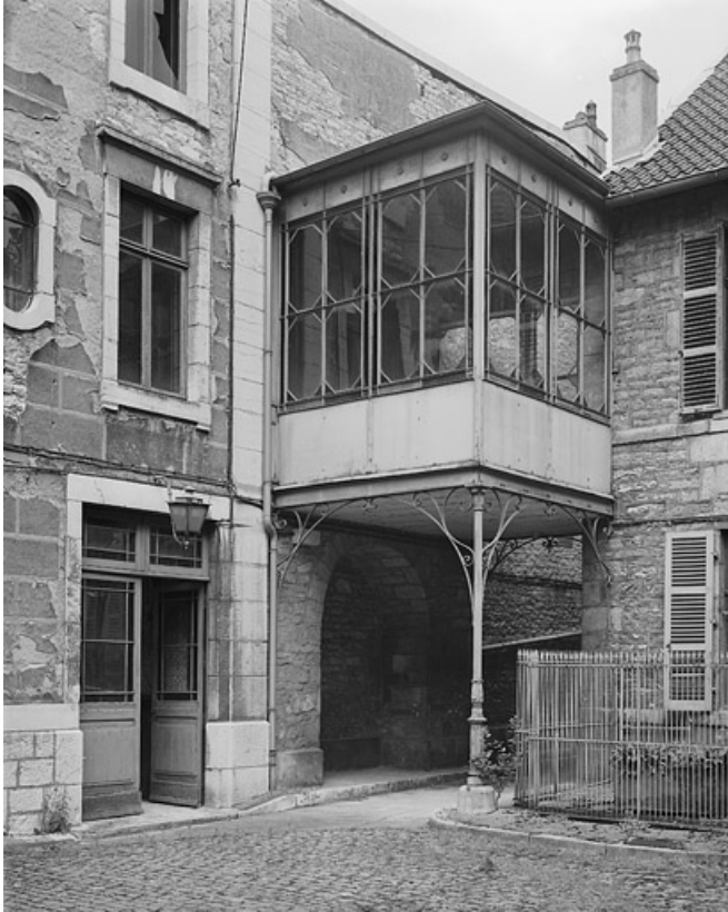
L'atelier d'horloger depuis l'extérieur.

25, Besançon, 86 rue des Granges, lieudit : îlot Forum