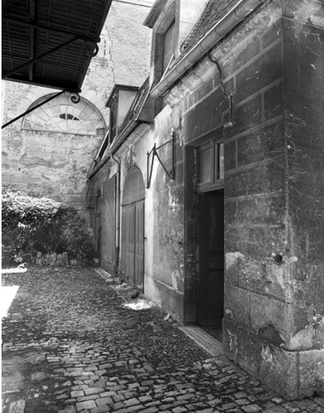
Façade antérieure de trois quarts droit des remises et écurie.

25, Besançon, 86 rue des Granges, lieudit : îlot Forum