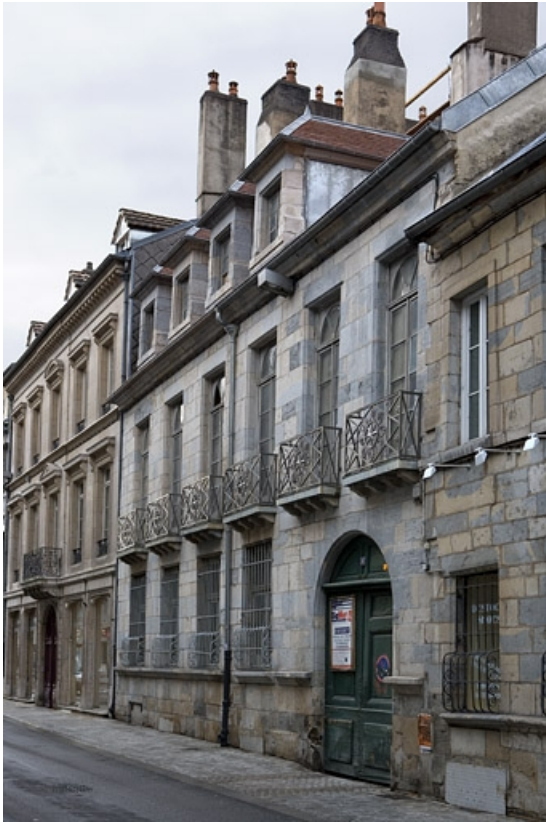
Vue d'ensemble depuis la rue de trois quarts droit. 25, Besançon, 86 rue des Granges, lieudit : îlot Forum