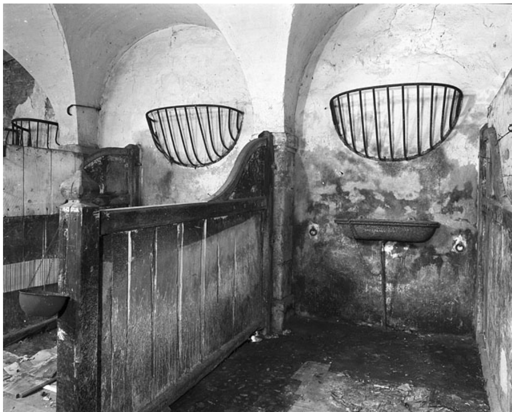
Ecurie : détail d'une stalle.

25, Besançon, 86 rue des Granges, lieudit : îlot Forum