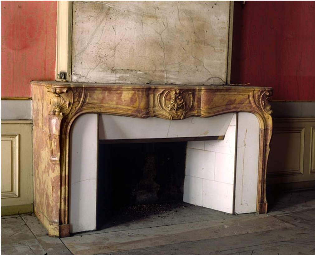
Logis principal : détail d'une cheminée du premier étage.

25, Besançon, 86 rue des Granges, lieudit : îlot Forum