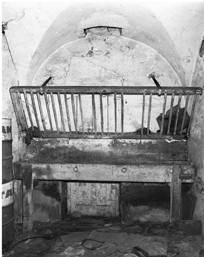
Etable : vue de l'intérieur.

25, Besançon, 86 rue des Granges, lieudit : îlot Forum