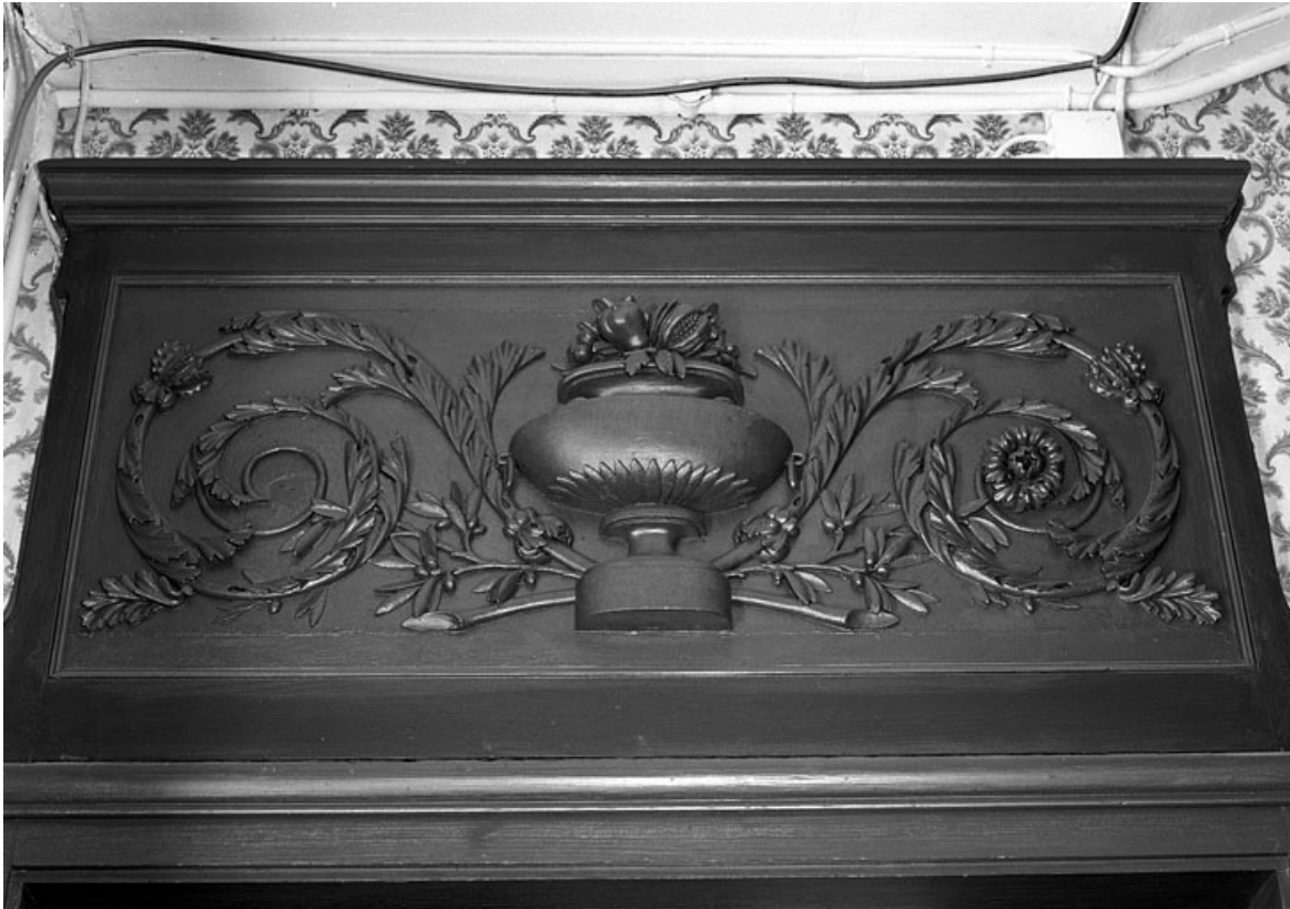
Logis principal : intérieur, détail du décor de la niche d'un poêle dans une pièce du premier étage. 25, Besançon, 86 rue des Granges, lieudit : îlot Forum