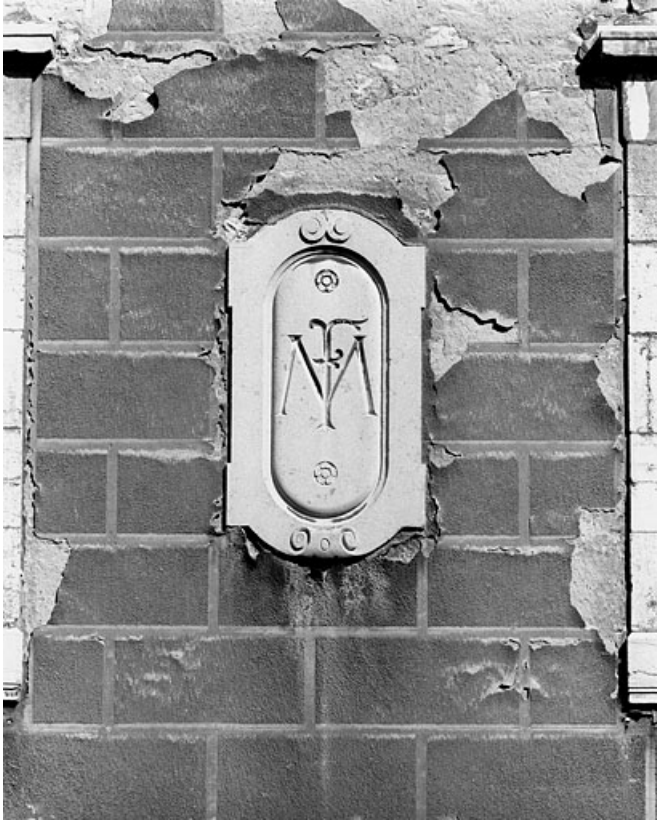
Logis secondaire : façade antérieure, détail du médaillon droit. 25, Besançon, 86 rue des Granges, lieudit : îlot Forum