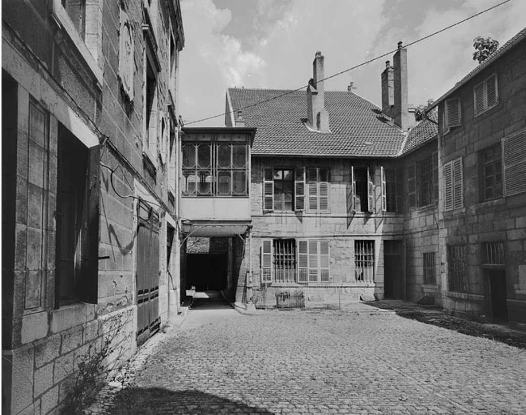
Vue d'ensemble depuis le fond de la cour.

25, Besançon, 86 rue des Granges, lieudit : îlot Forum