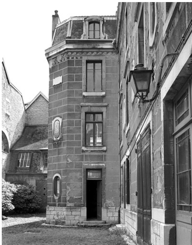
Façade antérieure du logis secondaire droit : détail de l'avant-corps gauche.

25, Besançon, 86 rue des Granges, lieudit : îlot Forum