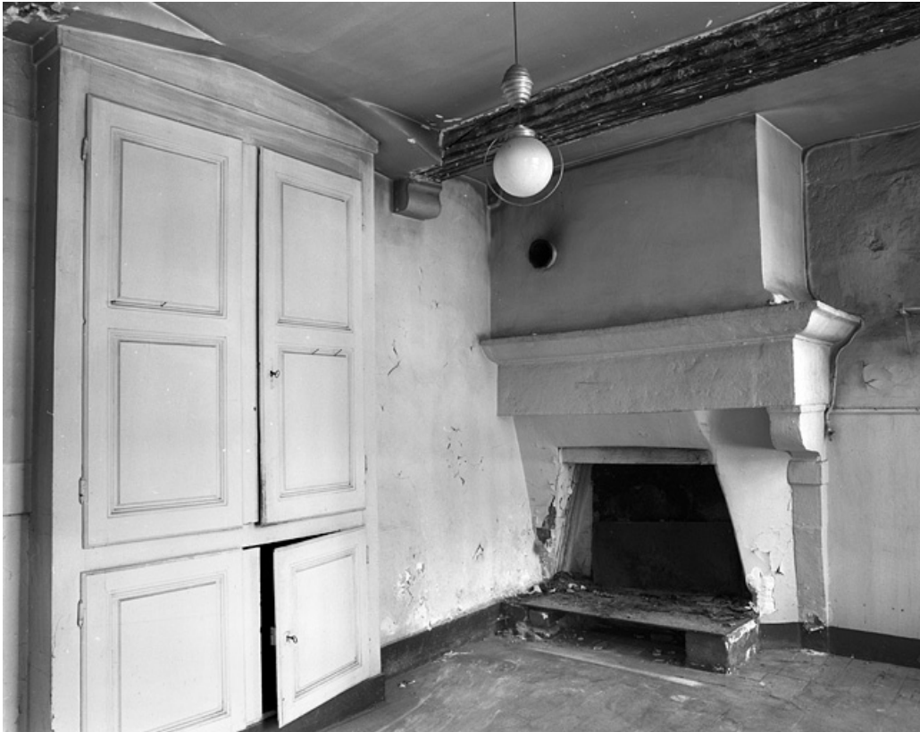
Communs : intérieur de la cuisine.

25, Besançon, 86 rue des Granges, lieudit : îlot Forum