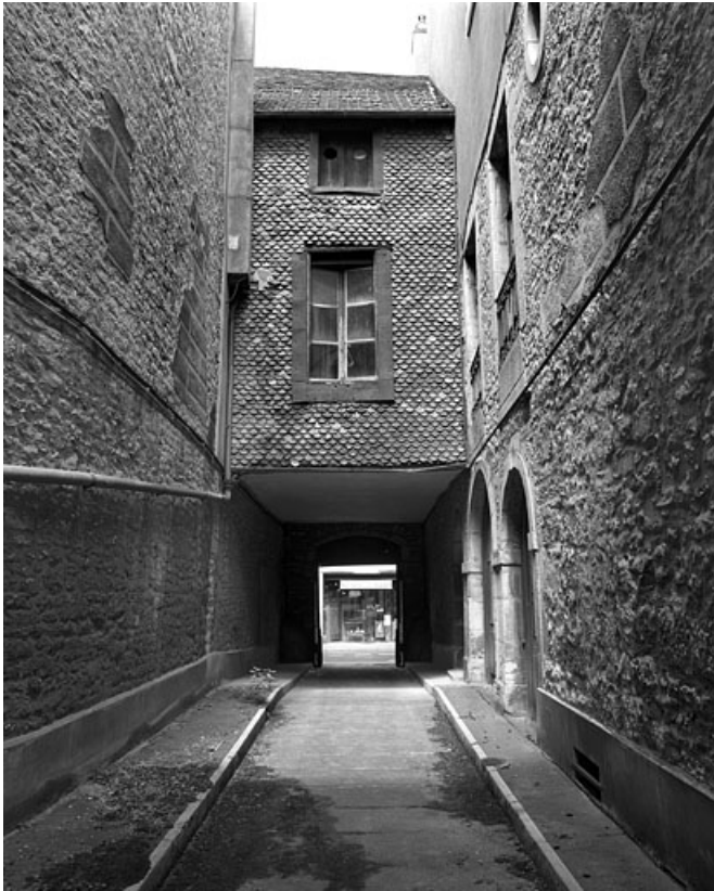
Passage cocher depuis la cour.

25, Besançon, 86 rue des Granges, lieudit : îlot Forum