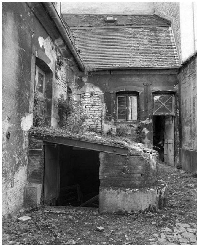
Vue de l'étable, de face.

25, Besançon, 86 rue des Granges, lieudit : îlot Forum