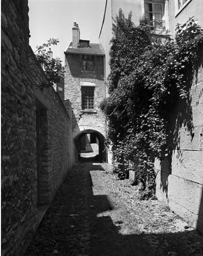
Entrée secondaire de l'édifice, rue de la Bibliothèque.

25, Besançon, 86 rue des Granges, lieudit : îlot Forum