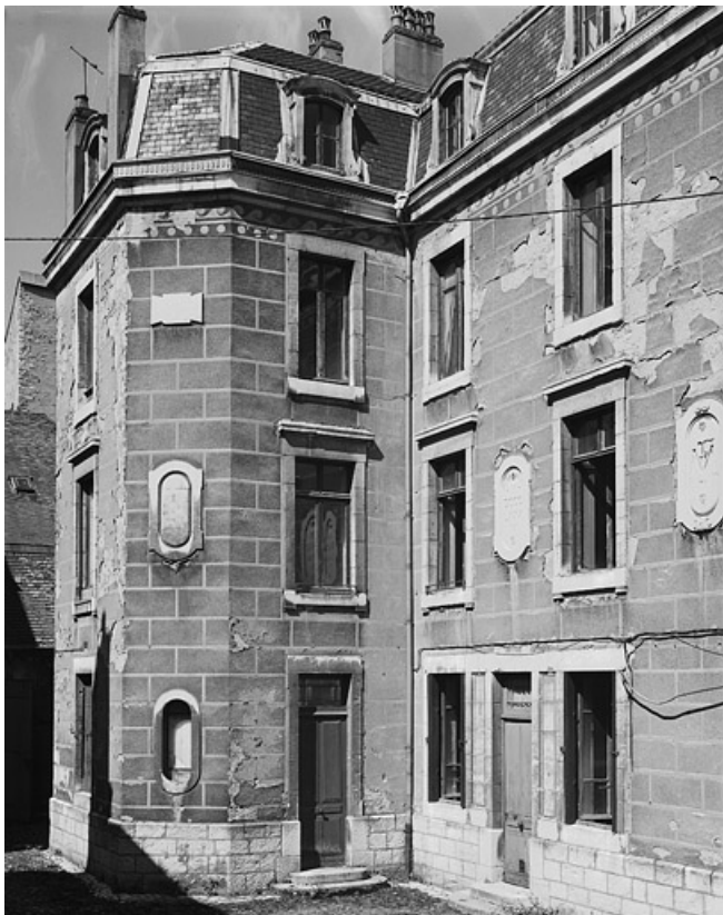
Logis droit : extrémité gauche.

25, Besançon, 86 rue des Granges, lieudit : îlot Forum