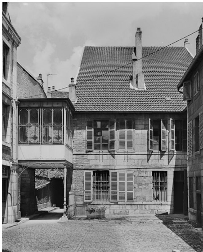
Logis sur rue : façade postérieure.

25, Besançon, 86 rue des Granges, lieudit : îlot Forum