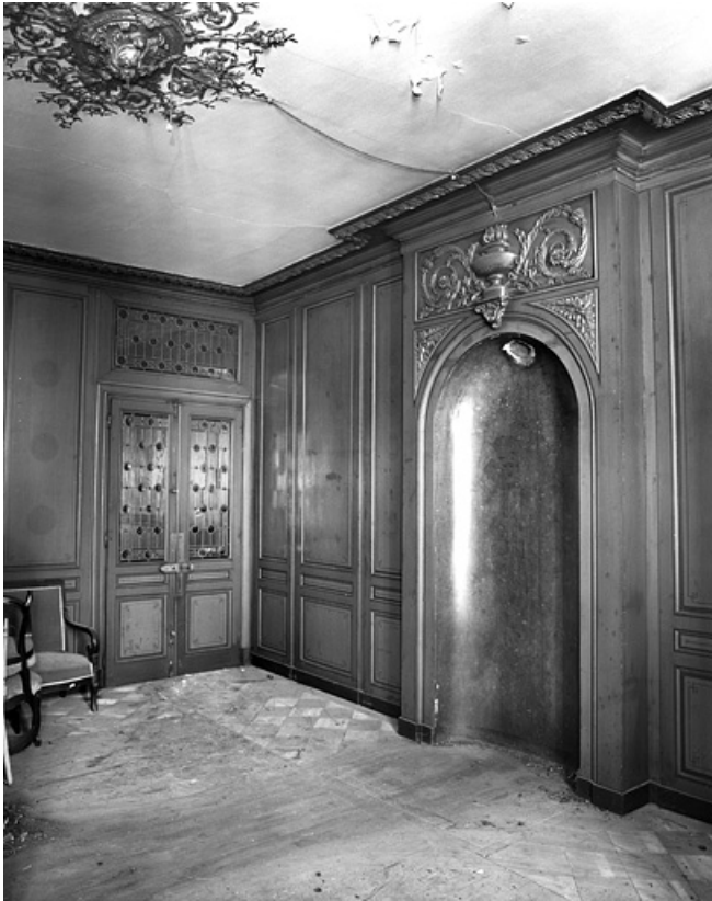
Logis principal : vue d'une pièce du premier étage avec la niche du poêle.

25, Besançon, 86 rue des Granges, lieudit : îlot Forum