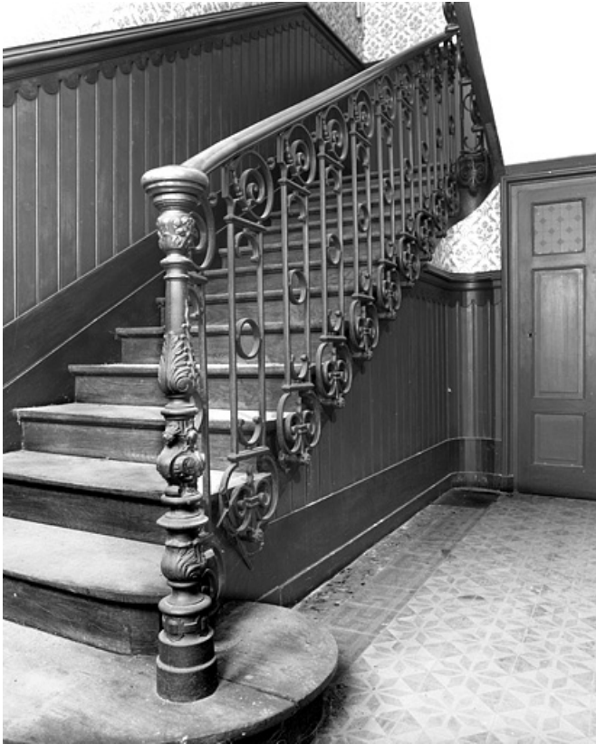
Logis secondaire droit : intérieur, détail de l'escalier.

25, Besançon, 86 rue des Granges, lieudit : îlot Forum