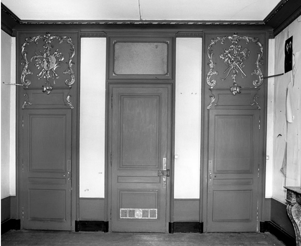
Logis secondaire droit : détail des lambris d'une pièce du premier étage.

25, Besançon, 86 rue des Granges, lieudit : îlot Forum