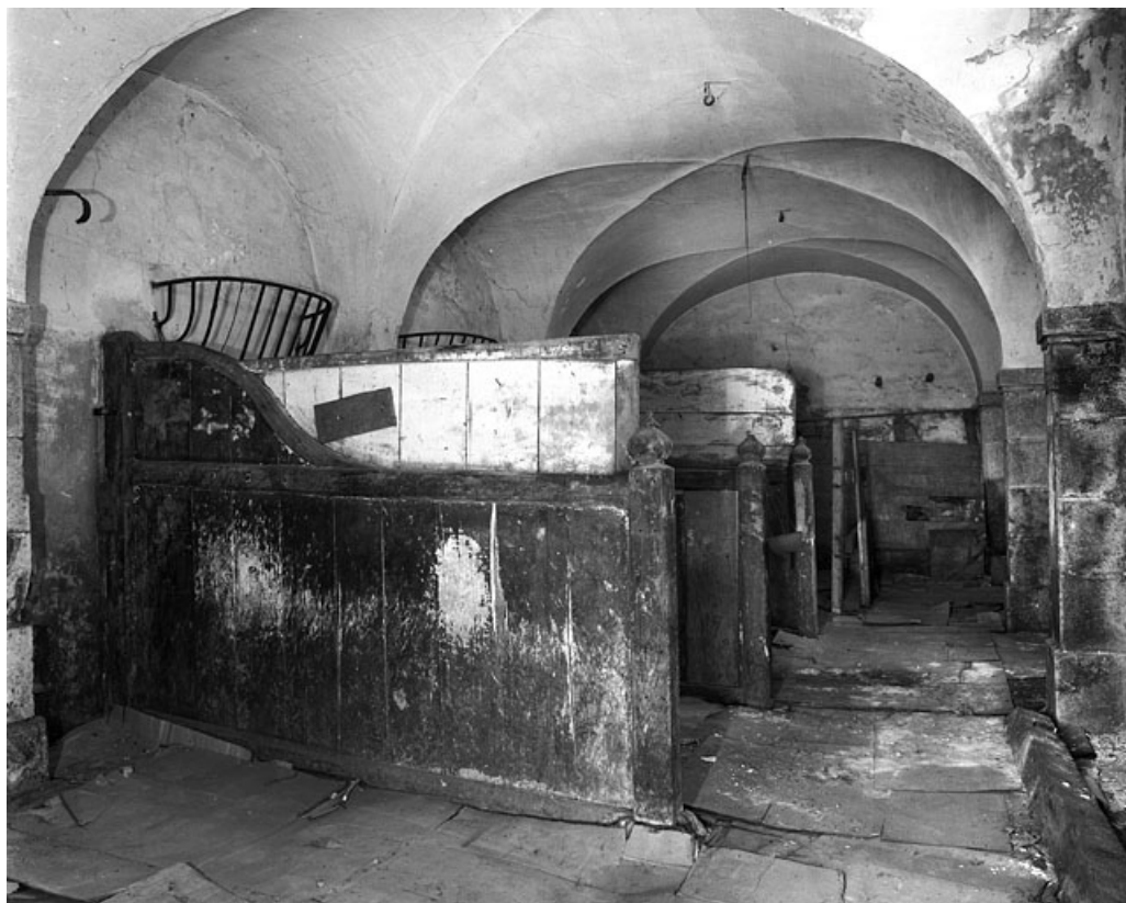
Ecurie : vue d'ensemble.

25, Besançon, 86 rue des Granges, lieudit : îlot Forum