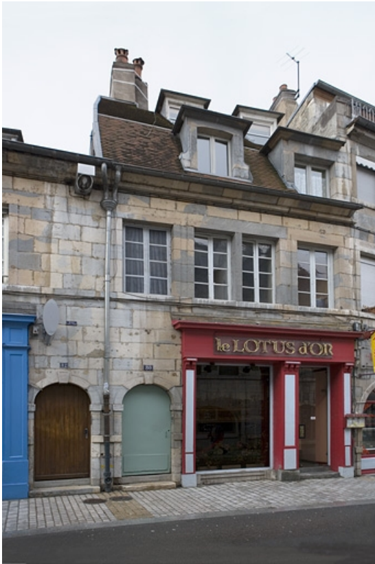
Vue rapprochée depuis la rue, de trois quarts gauche.

25, Besançon, 80 rue des Granges, lieudit : îlot Forum