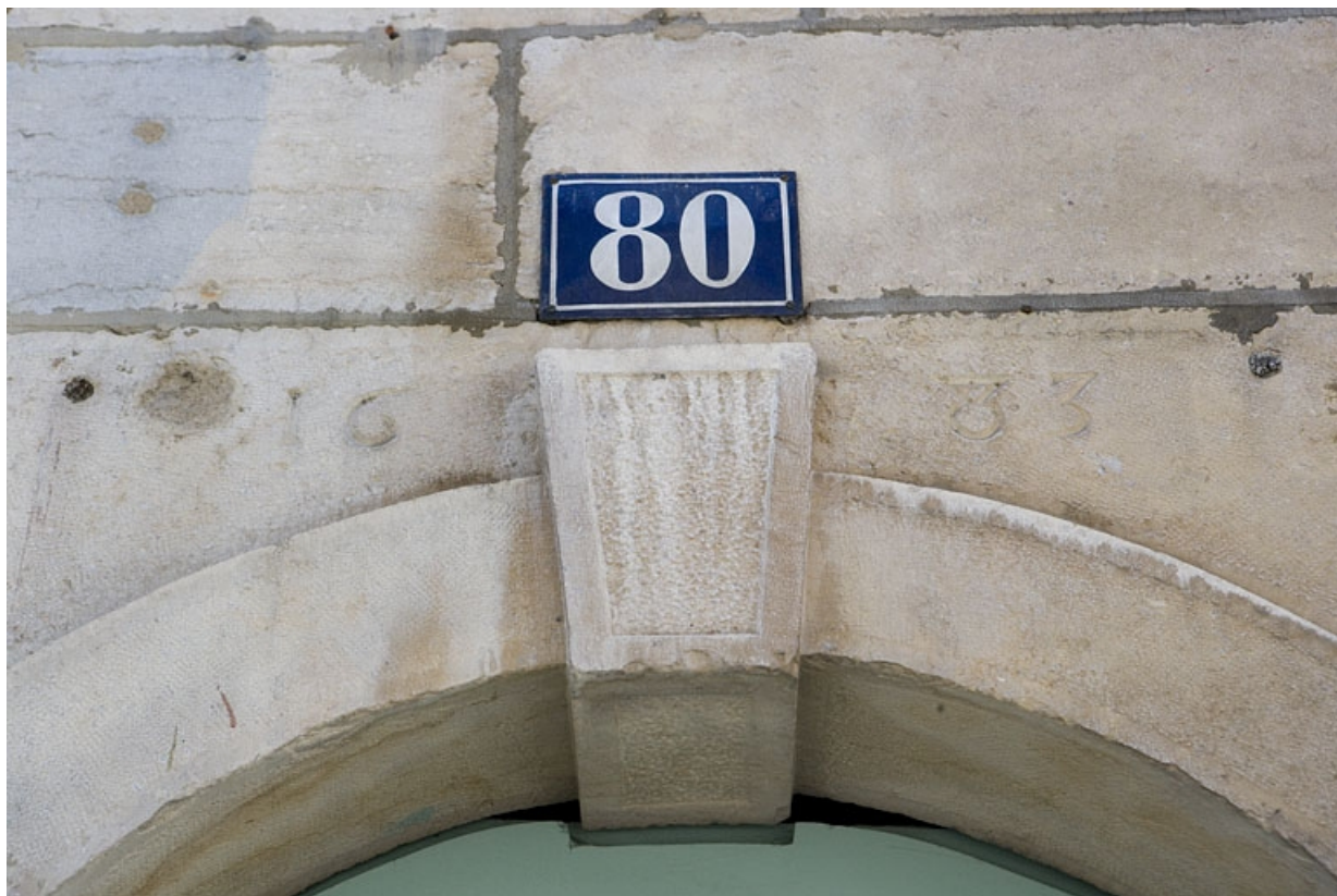
Détail de la date au-dessus de la porte d'entrée du couloir.

25, Besançon, 80 rue des Granges, lieudit : îlot Forum