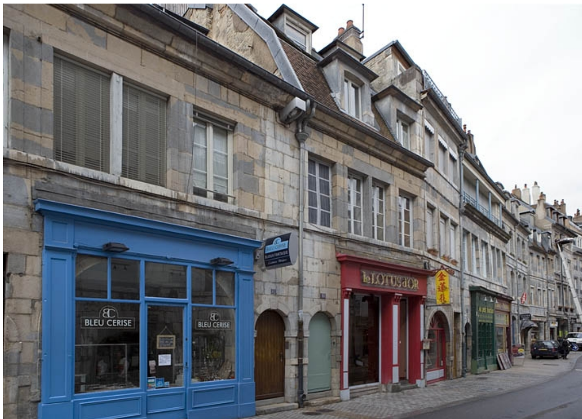
Vue d'ensemble depuis la rue de trois quarts gauche.

25, Besançon, 80 rue des Granges, lieudit : îlot Forum