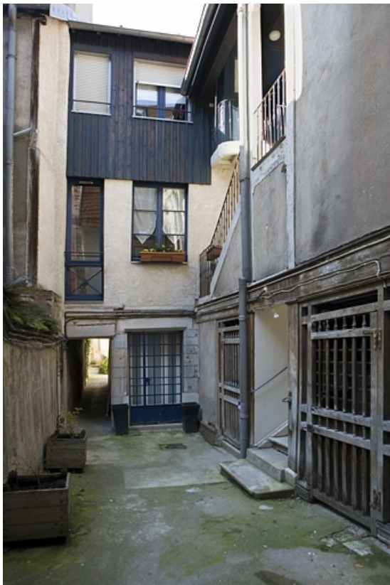
Vue d'ensemble de la façade antérieure du logis secondaire.

25, Besançon, 80 rue des Granges, lieudit : îlot Forum