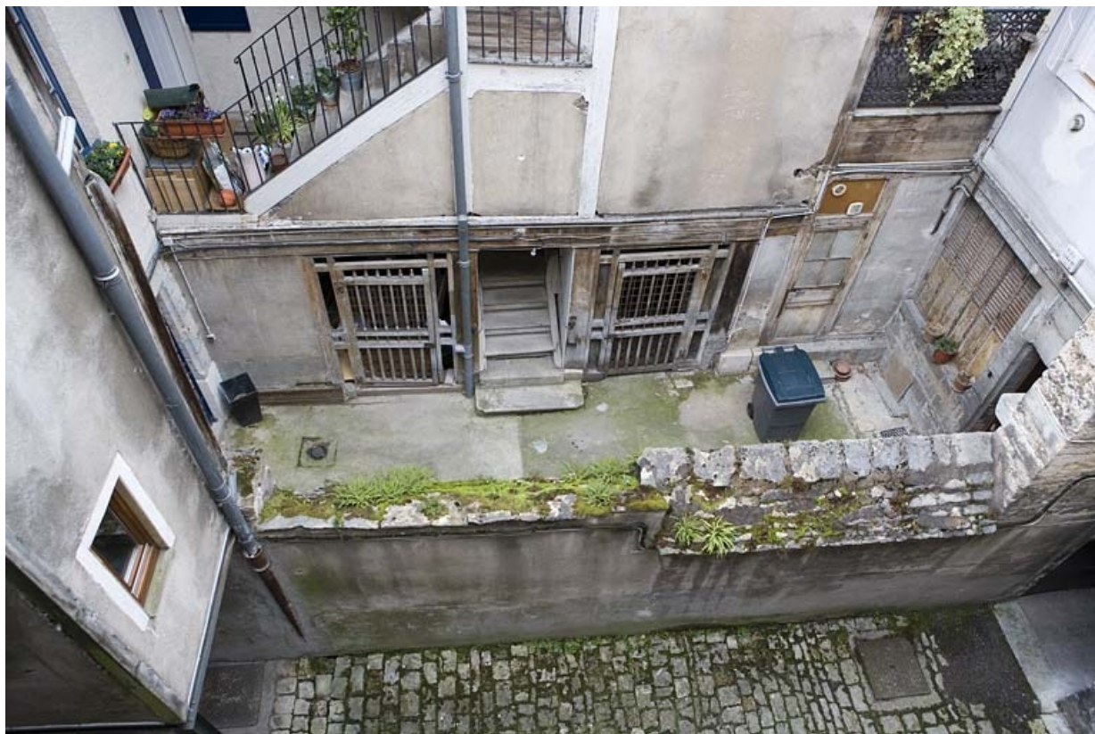
Vue plongeante sur la cour depuis la parcelle voisine.

25, Besançon, 80 rue des Granges, lieudit : îlot Forum