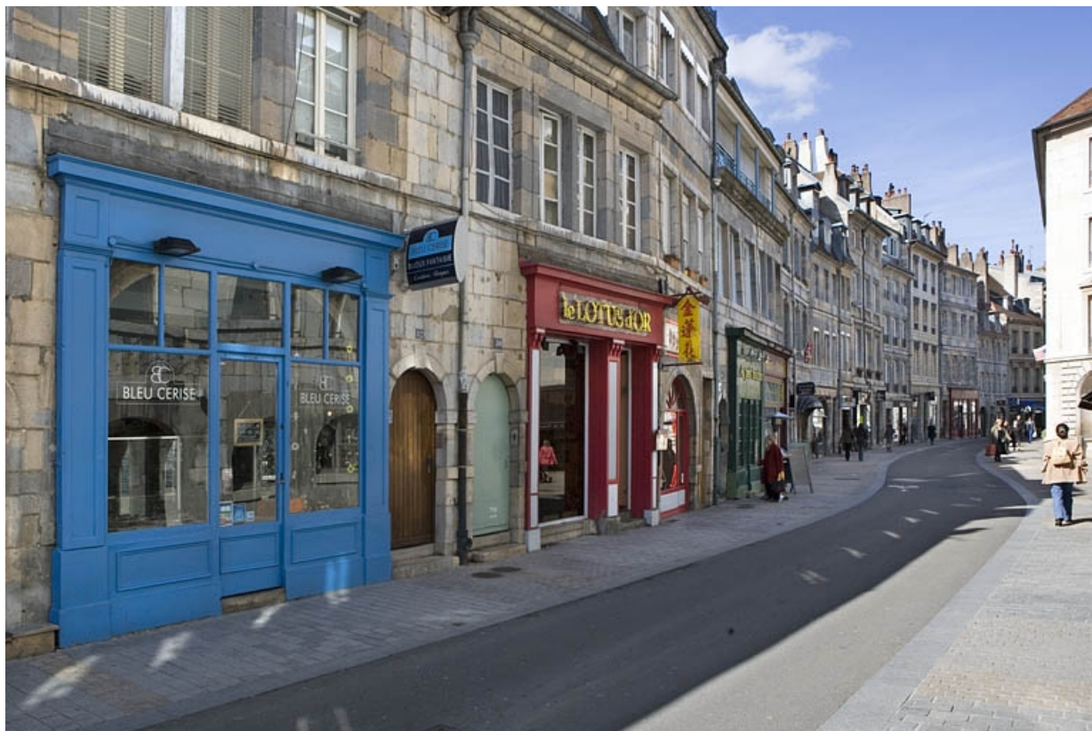
Vue éloignée de la maison dans l'alignement de la rue.

25, Besançon, 80 rue des Granges, lieudit : îlot Forum