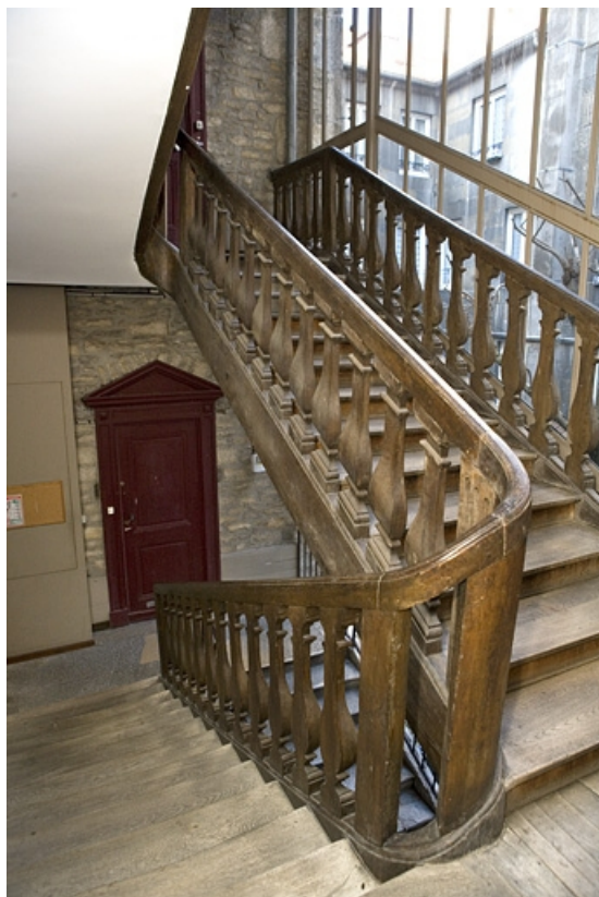
Détail du premier escalier à cage ouverte depuis l'intérieur de la cage.

25, Besançon, 68 rue des Granges, lieudit : îlot Forum