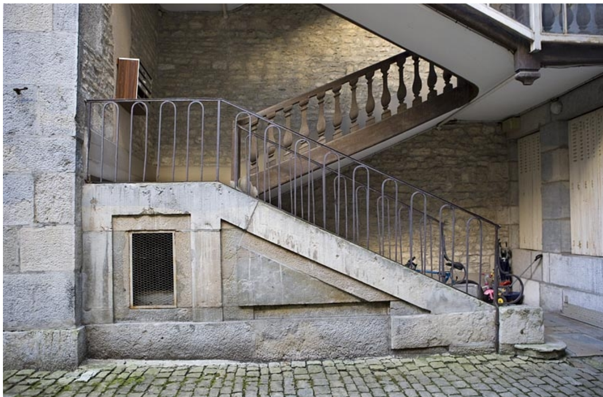
Détail du départ du premier escalier à cage ouverte depuis la cour.

25, Besançon, 68 rue des Granges, lieudit : îlot Forum