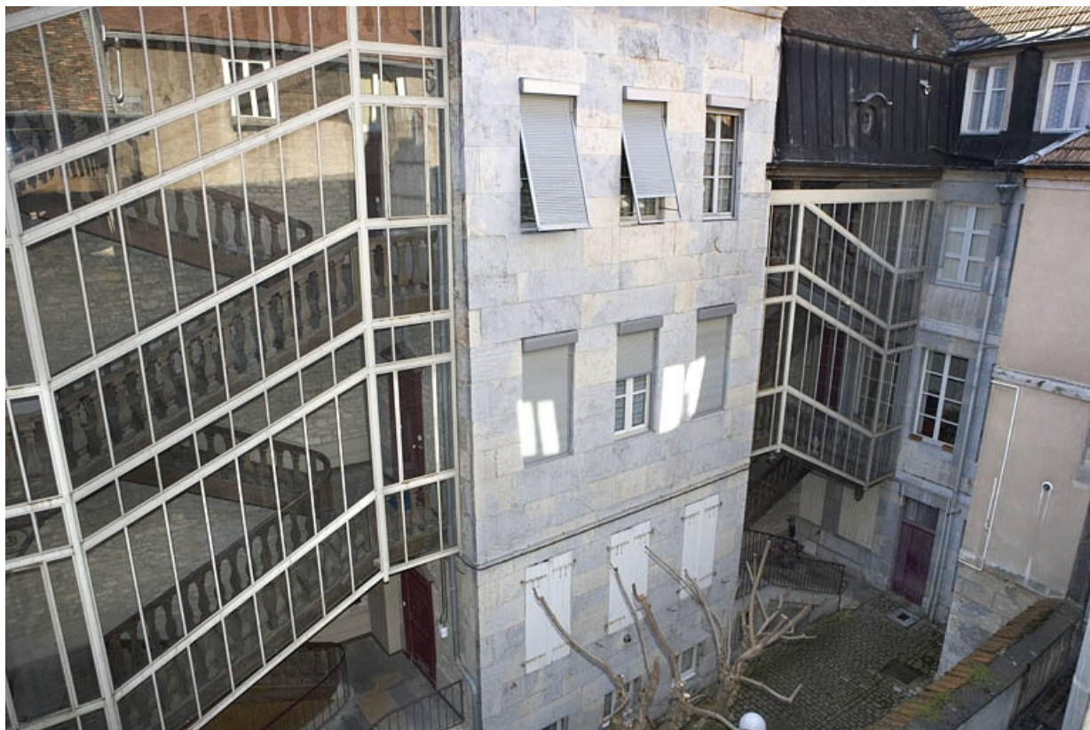
Bâtiment à gauche de la première cour : vue rapprochée.

25, Besançon, 68 rue des Granges, lieudit : îlot Forum