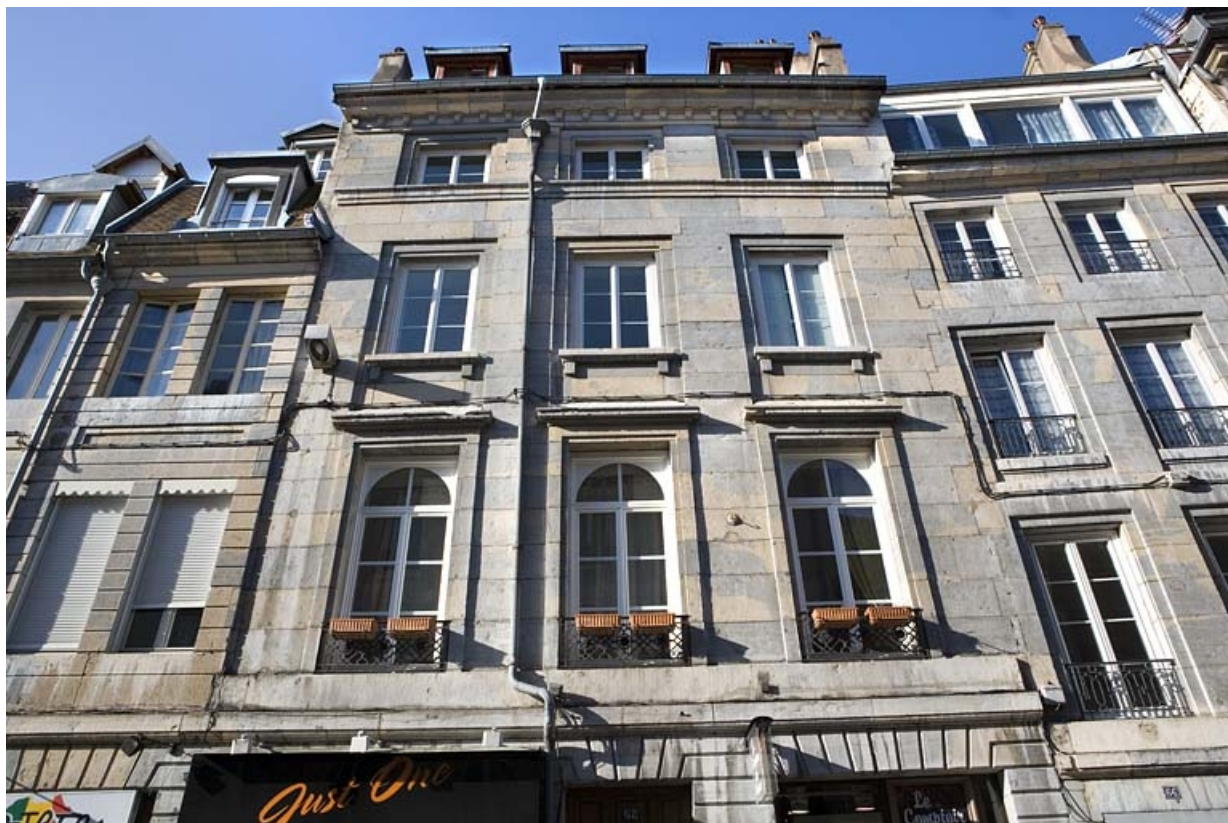
Détail de la façade sur rue au-dessus du rez-de-chaussée, de face.

25, Besançon, 68 rue des Granges, lieudit : îlot Forum