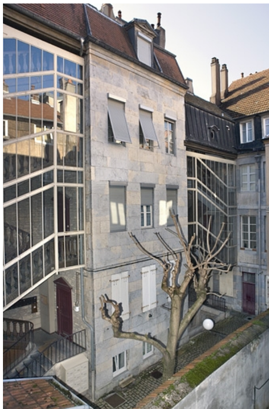
Vue d'ensemble du bâtiment encadrant les deux escaliers à cage ouverte situés dans la première cour.

25, Besançon, 68 rue des Granges, lieudit : îlot Forum