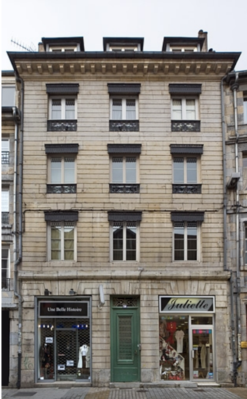
Vue d'ensemble de la façade sur rue, de face.

25, Besançon, 64 rue des Granges, lieudit : îlot Forum