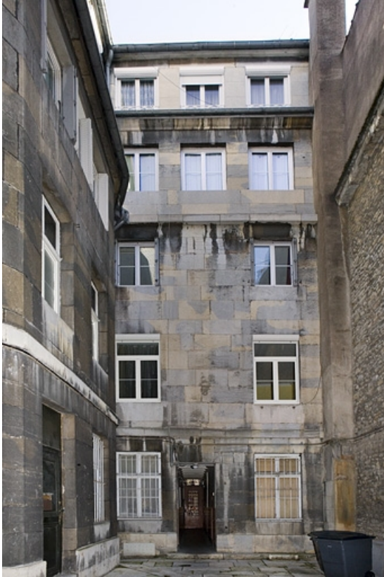
Vue d'ensemble de la façade postérieure du logis principal.

25, Besançon, 64 rue des Granges, lieudit : îlot Forum