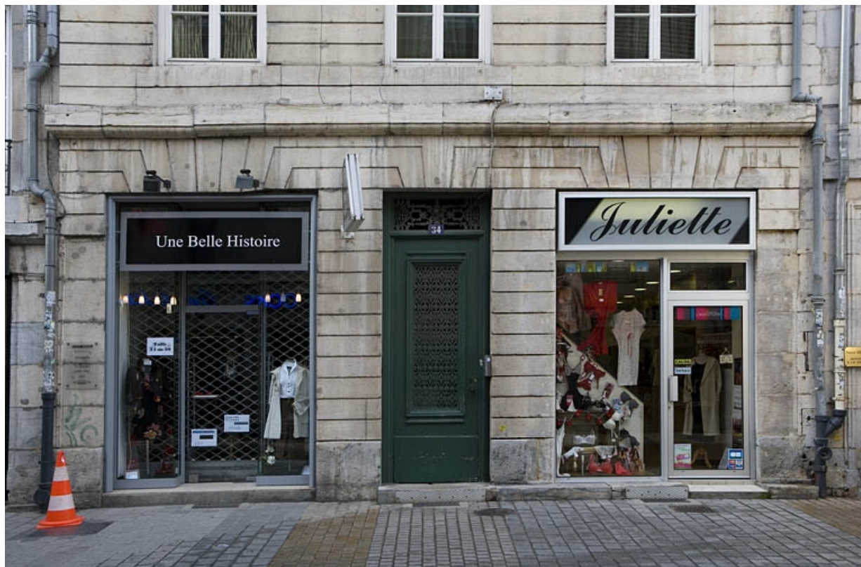
Détail du rez-de-chaussée de la façade sur rue.

25, Besançon, 64 rue des Granges, lieudit : îlot Forum