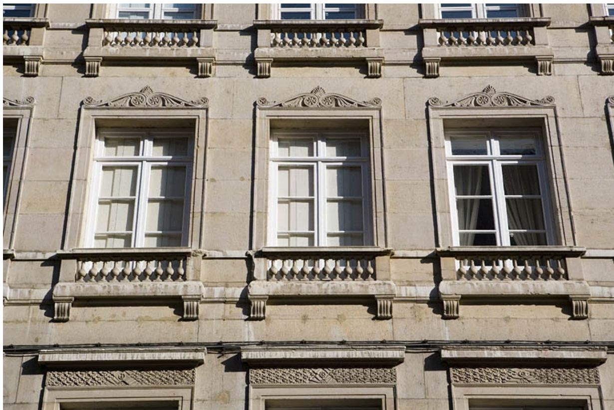
Détail des fenêtres du premier étage.

25, Besançon Grande Rue 117, lieudit : îlot Forum