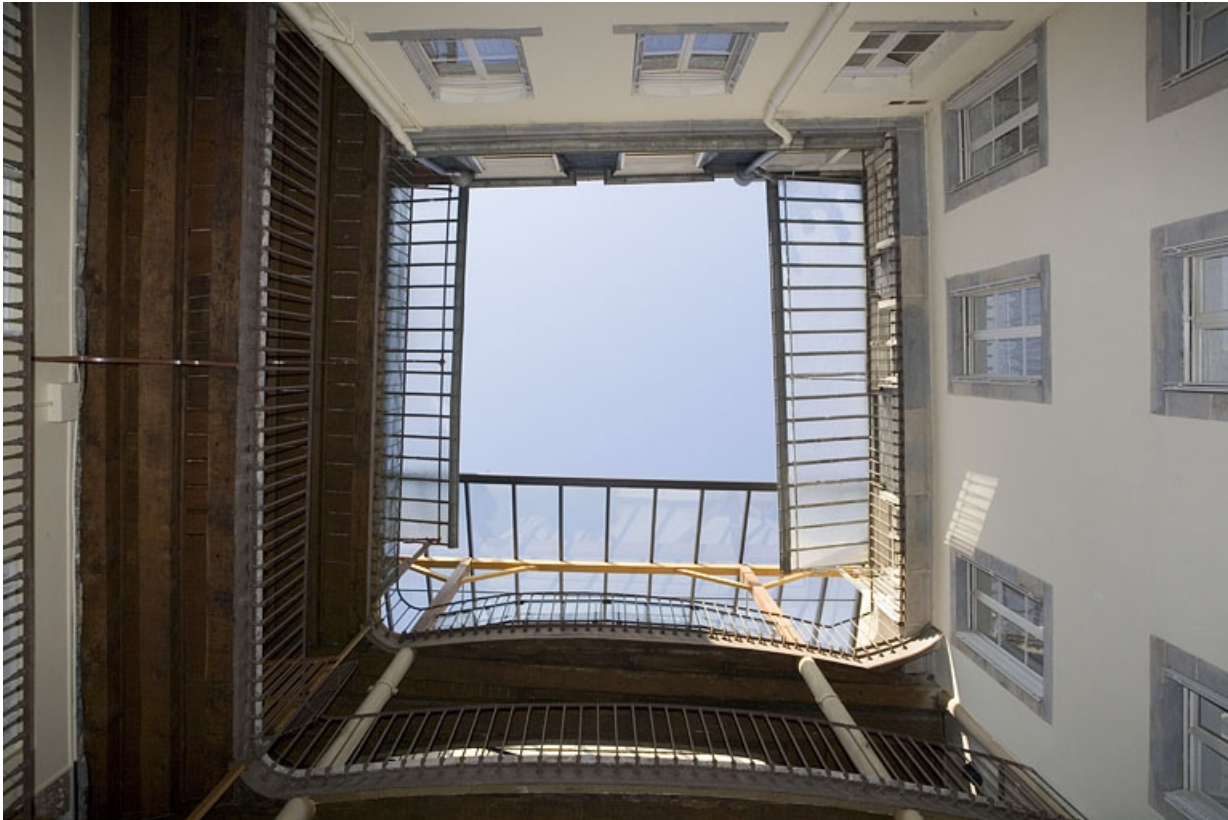
Première cour : vue en contre-plongée de l'escalier à cage ouverte.

25, Besançon Grande Rue 117, lieudit : îlot Forum