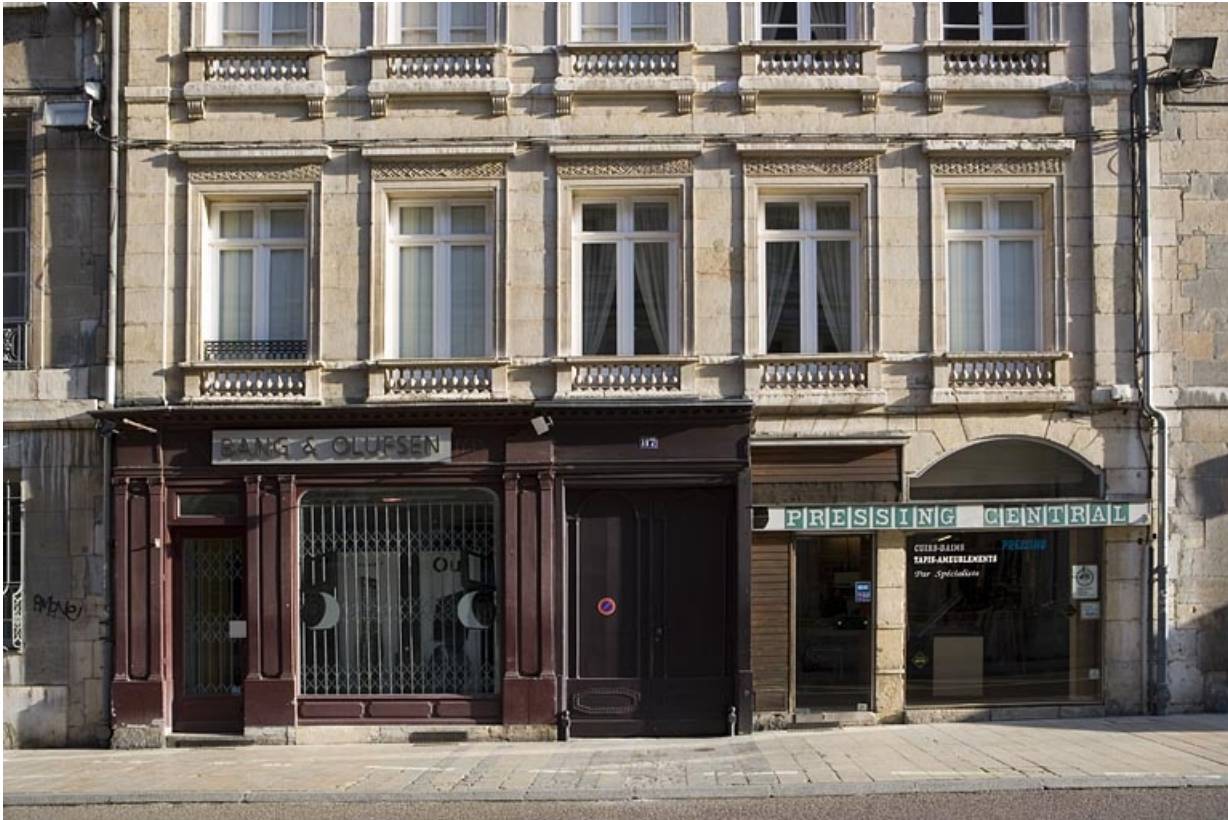
Logis principal, façade sur rue : détail du rez-de-chaussée.

25, Besançon Grande Rue 117, lieudit : îlot Forum