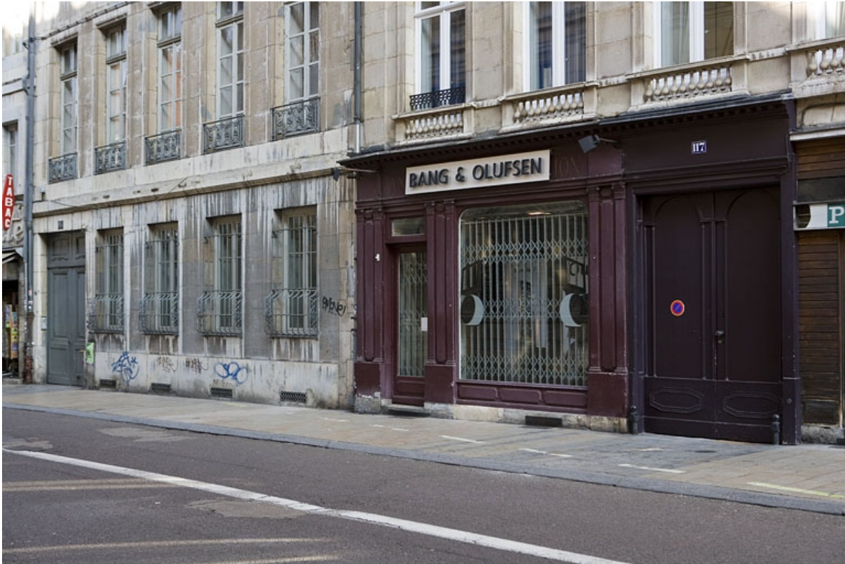
Logis principal, façade sur rue : détail de la devanture du magasin de trois quarts droit.

25, Besançon Grande Rue 117, lieudit : îlot Forum