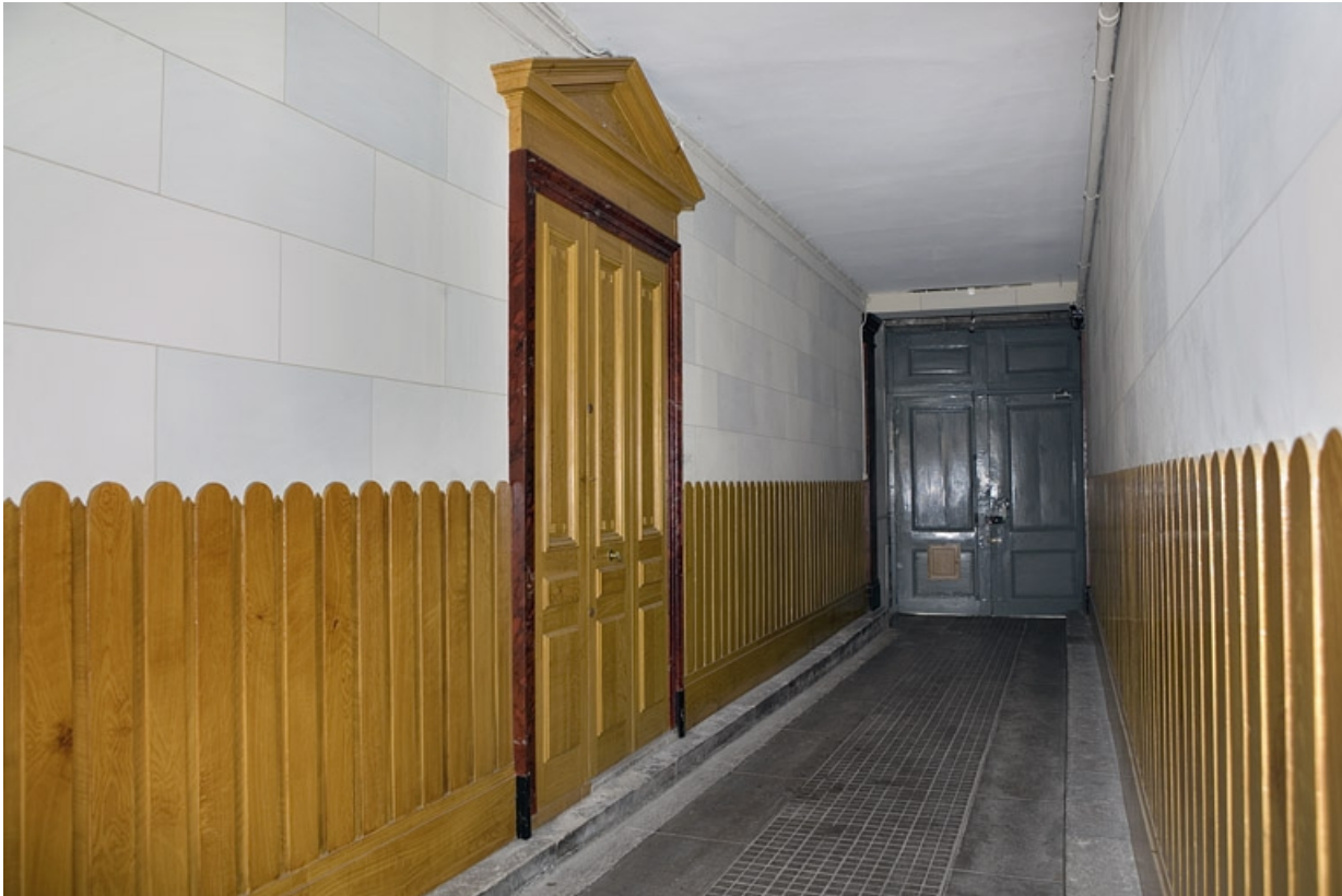
Détail du passage cocher depuis l'entrée de la cour.

25, Besançon Grande Rue 115, lieudit : îlot Forum