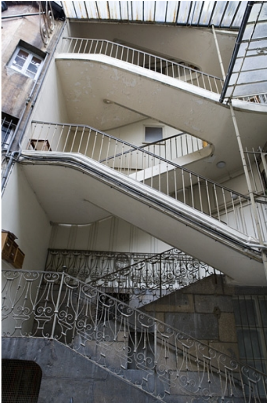
Vue d'ensemble de l'escalier à cage ouverte.

25, Besançon Grande Rue 109, lieudit : îlot Forum