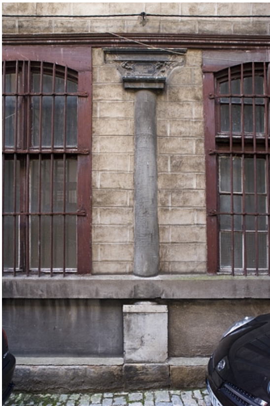
Détail d'une colonne du portique à droite de la deuxième cour.

25, Besançon Grande Rue 91, lieudit : îlot Forum