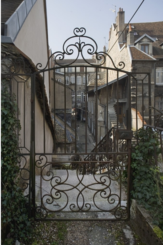
Détail de la grille de la porte de l'escalier isolé.

25, Besançon Grande Rue 91, lieudit : îlot Forum