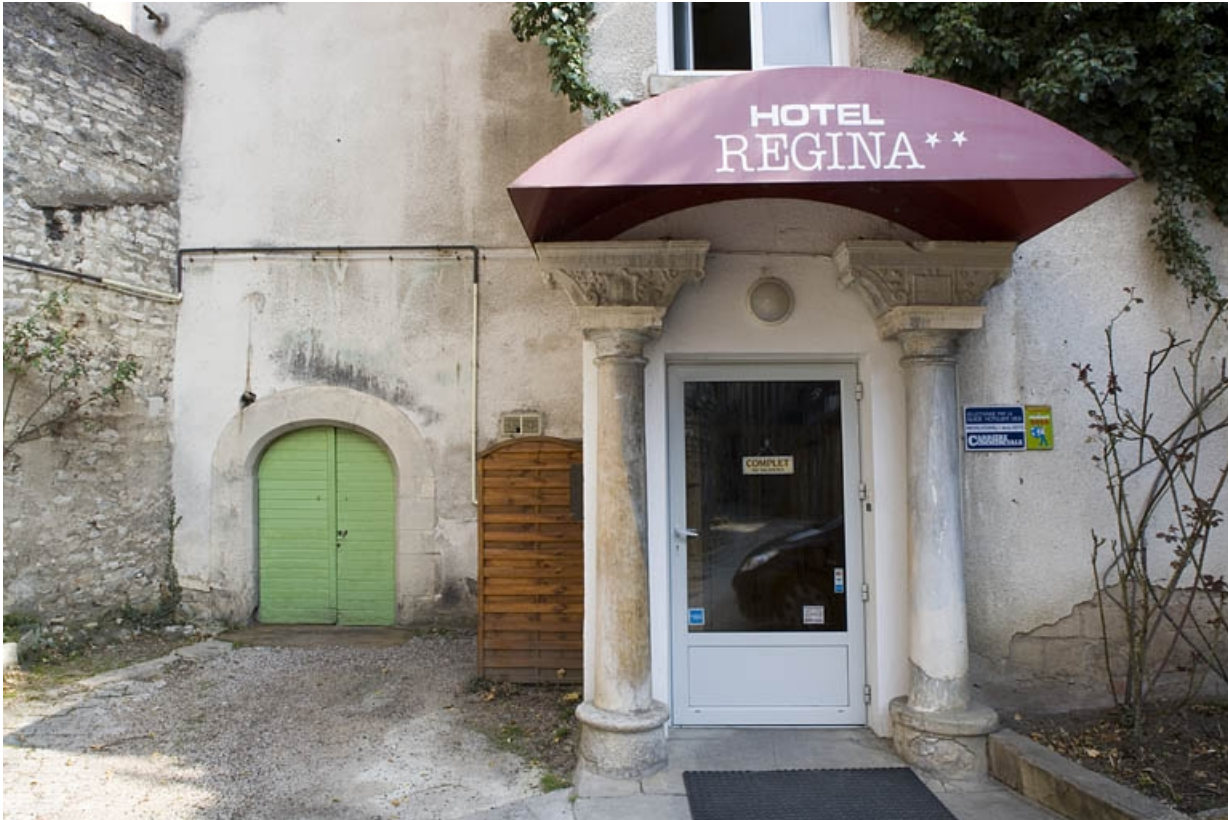
Détail du rez-de-chaussée du logis secondaire au fond de la deuxième cour.

25, Besançon Grande Rue 91, lieudit : îlot Forum