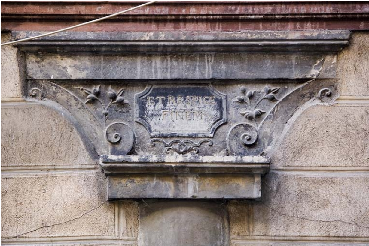
Détail du chapiteau du portique portant l'inscription latine "et considère la fin". 25, Besançon Grande Rue 91, lieudit : îlot Forum