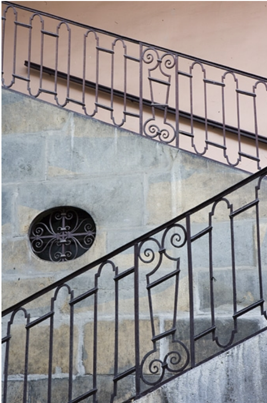
Détail de la rampe de l'escalier à cage ouverte à gauche de la deuxième cour. 25, Besançon Grande Rue 91, lieudit : îlot Forum