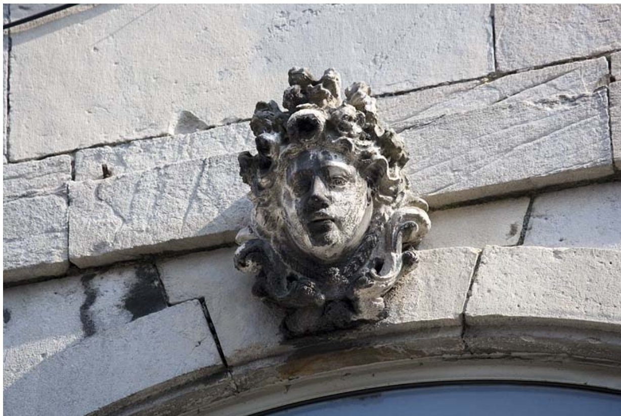
Détail de la clé d'une fenêtre au premier étage sur rue : figure coiffée d'une couronne de fleur.

25, Besançon Grande Rue 91, lieudit : îlot Forum