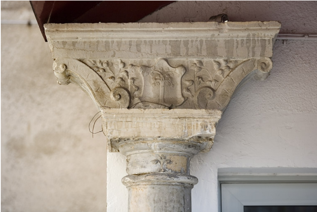
Détail du chapiteau de la colonne gauche : entrée du logis secondaire au fond de la deuxième cour.

25, Besançon Grande Rue 91, lieudit : îlot Forum