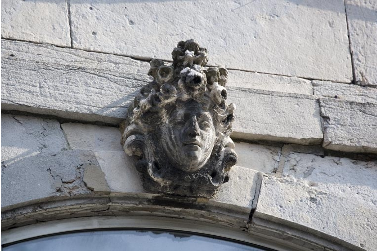
Détail de la clé d'une fenêtre au premier étage sur rue : figure coiffée d'un amas de fleurs.

25, Besançon Grande Rue 91, lieudit : îlot Forum