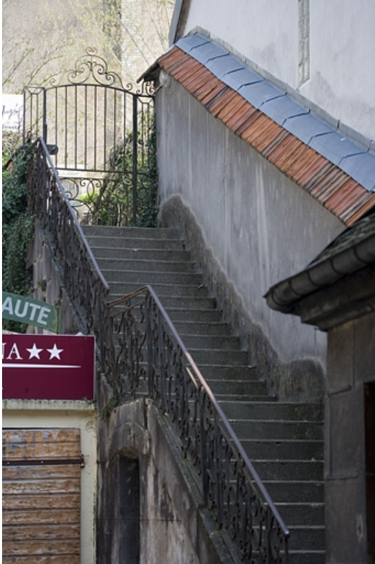
Vue de l'escalier isolé dans la deuxième cour conduisant à la terrasse gallo-romaine.

25, Besançon Grande Rue 91, lieudit : îlot Forum