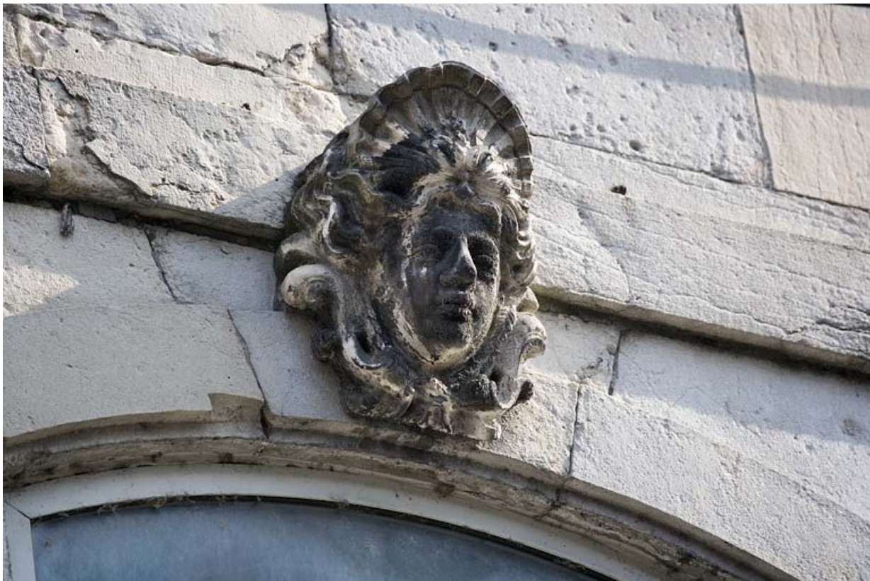
Détail de la clé d'une fenêtre au premier étage sur rue : figure coiffée d'une coquille.

25, Besançon Grande Rue 91, lieudit : îlot Forum