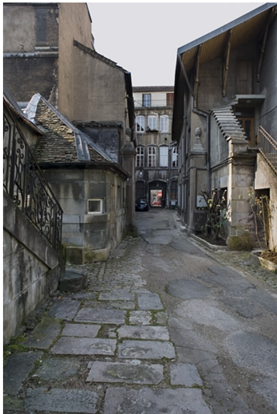
Vue d'ensemble de l'édifice depuis le fond de la parcelle.

25, Besançon Grande Rue 91, lieudit : îlot Forum