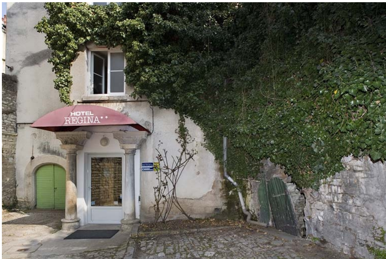
Vue d'ensemble éloignée du rez-de-chaussée du logis secondaire au fond de la deuxième cour.

25, Besançon Grande Rue 91, lieudit : îlot Forum