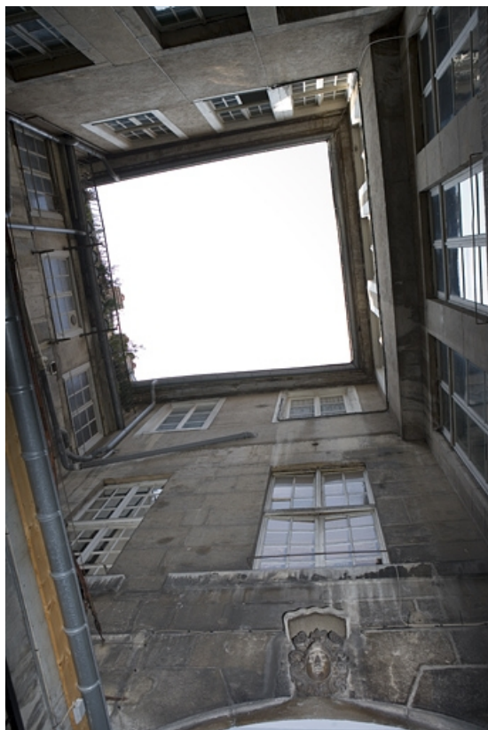
Première cour : vue d'ensemble en contre plongée.

25, Besançon Grande Rue 91, lieudit : îlot Forum