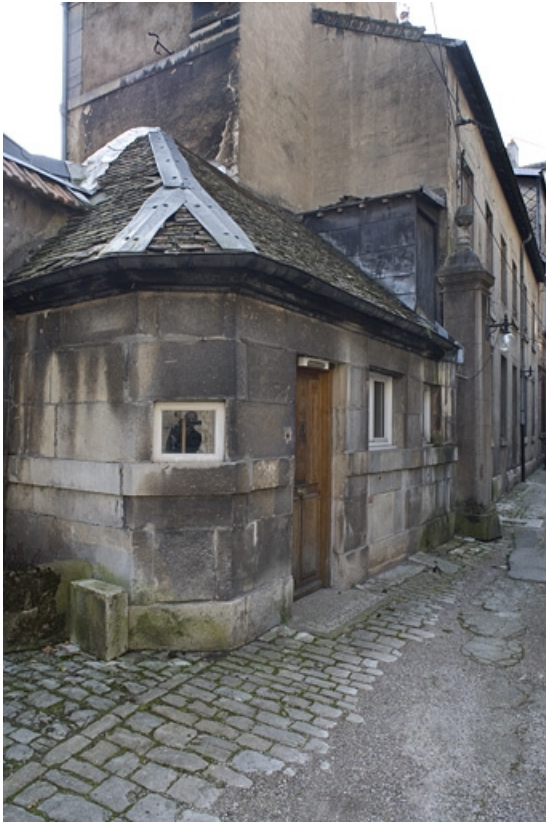
Détail de la fabrique de jardin située dans la deuxième cour.

25, Besançon Grande Rue 91, lieudit : îlot Forum