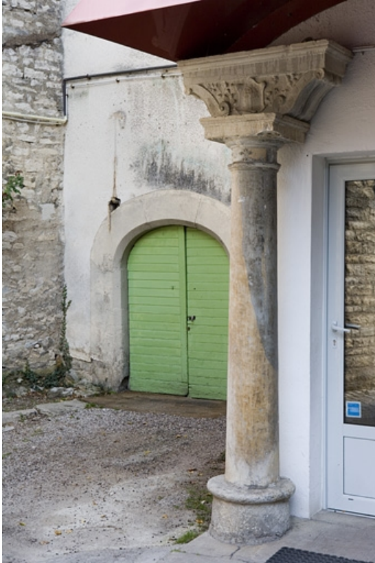
Détail de la colonne à gauche : entrée du logis secondaire au fond de la deuxième cour. 25, Besançon Grande Rue 91, lieudit : îlot Forum