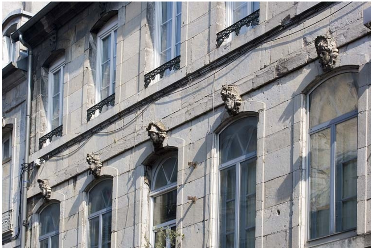
Détail des fenêtres au premier étage sur rue.

25, Besançon Grande Rue 91, lieudit : îlot Forum