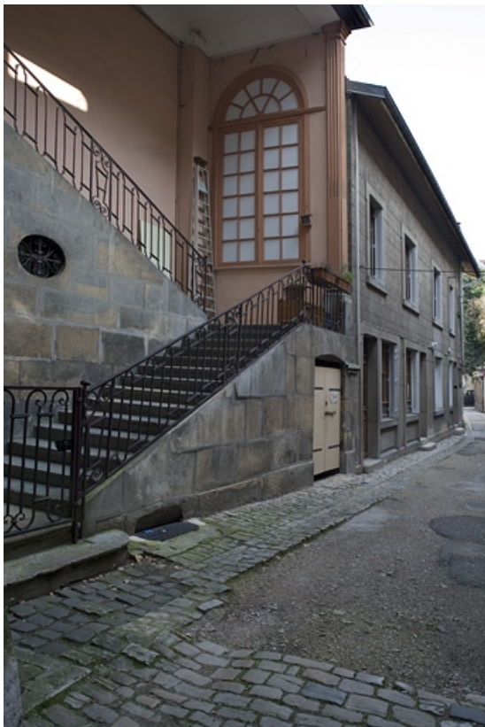
Vue d'ensemble de l'escalier extérieur dans la deuxième cour.

25, Besançon Grande Rue 91, lieudit : îlot Forum