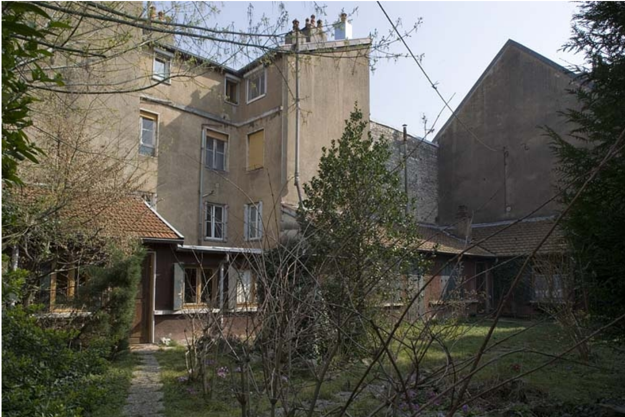
Vue d'ensemble de l'actuel institut de beauté sur la terrasse gallo-romaine.

25, Besançon Grande Rue 91, lieudit : îlot Forum