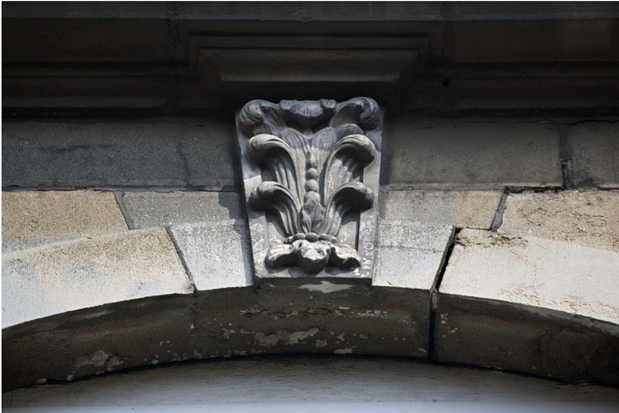
Détail d'une clé sur une fenêtre du deuxième étage sur rue.

25, Besançon Grande Rue 91, lieudit : îlot Forum