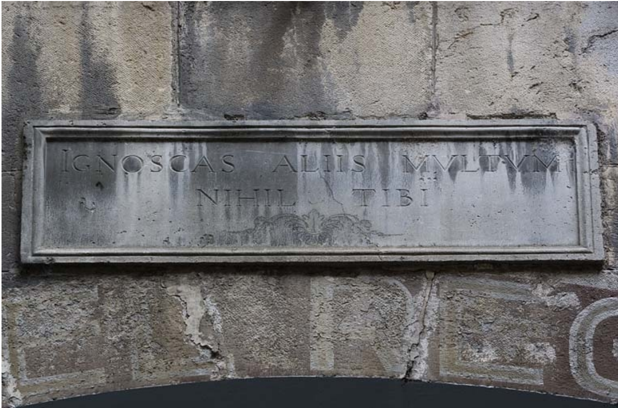
Première cour : détail d'une inscription latine.

25, Besançon Grande Rue 91, lieudit : îlot Forum