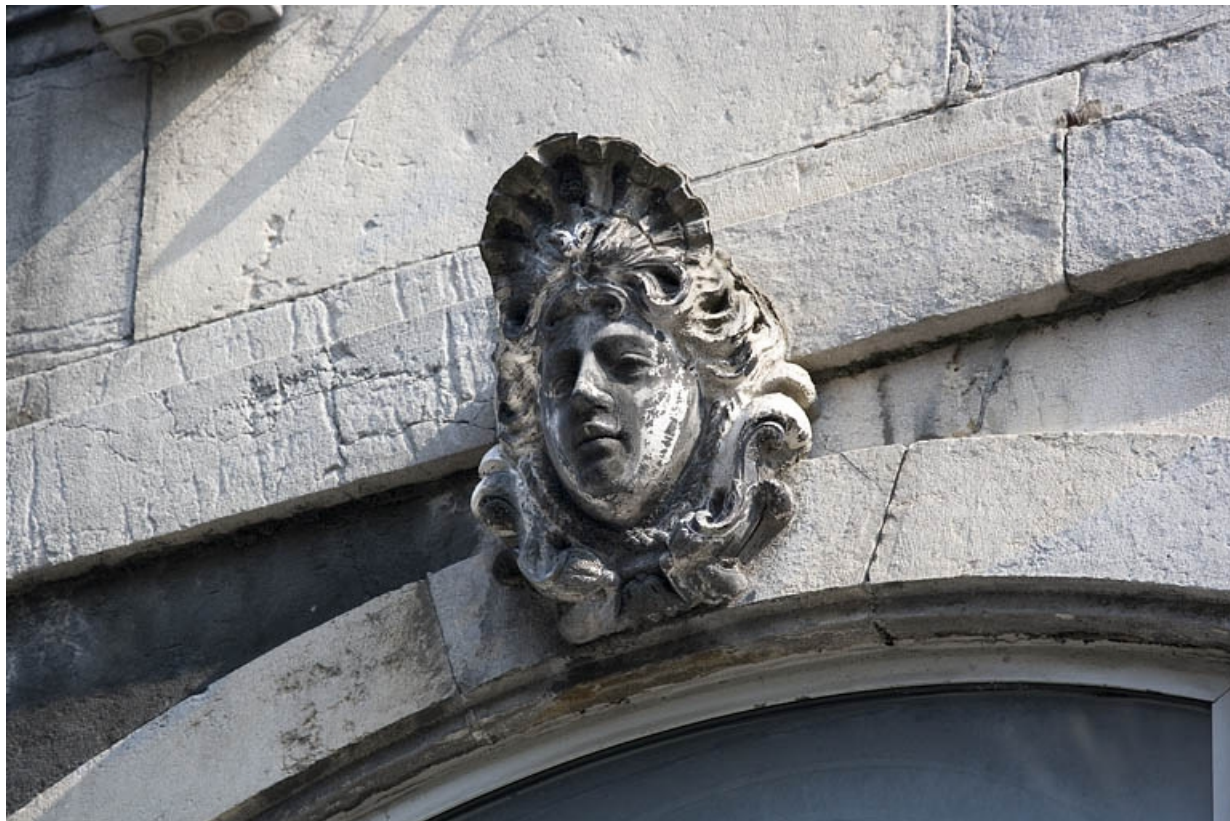
Détail de la clé d'une fenêtre au premier étage sur rue : figure coiffée d'une coquille.

25, Besançon Grande Rue 91, lieudit : îlot Forum