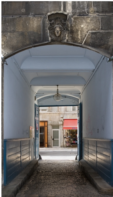
Vue du passage cocher depuis la première cour.

25, Besançon Grande Rue 91, lieudit : îlot Forum