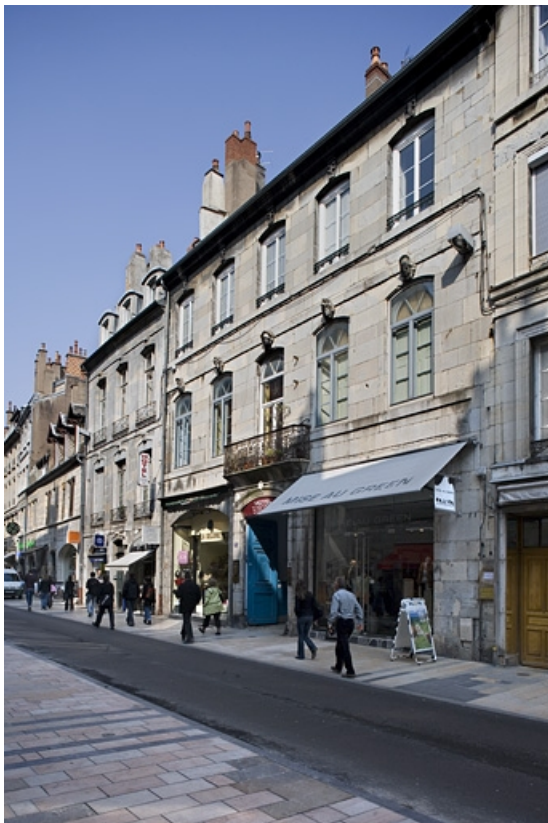
Vue d'ensemble de la façade sur rue : de trois quarts droit.

25, Besançon Grande Rue 91, lieudit : îlot Forum