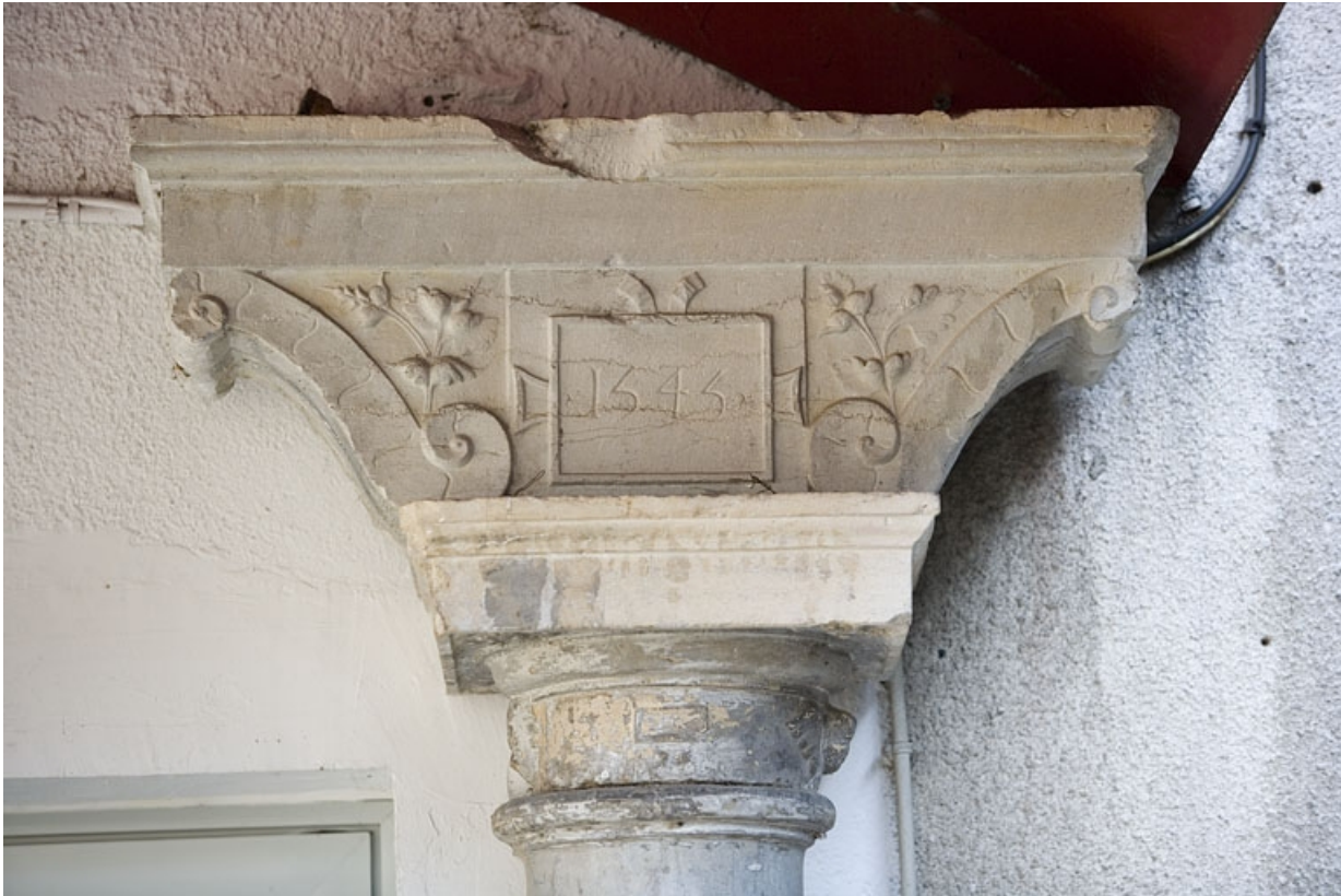
Détail du chapiteau de la colonne droite : entrée du logis secondaire au fond de la deuxième cour.

25, Besançon Grande Rue 91, lieudit : îlot Forum