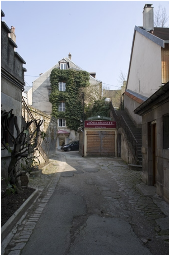
Vue d'ensemble du logis secondaire au fond de la deuxième cour.

25, Besançon Grande Rue 91, lieudit : îlot Forum