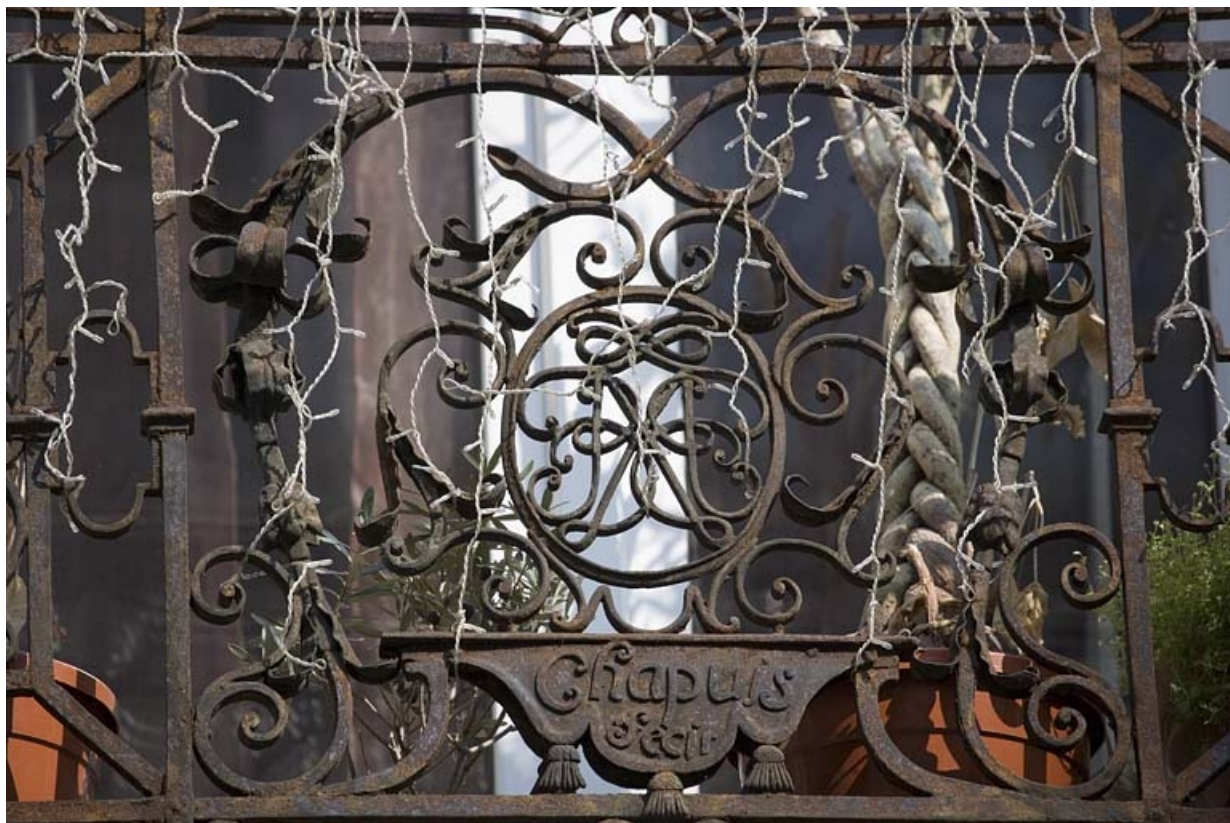
Détail de la grille du balcon : premier étage sur rue.

25, Besançon Grande Rue 91, lieudit : îlot Forum