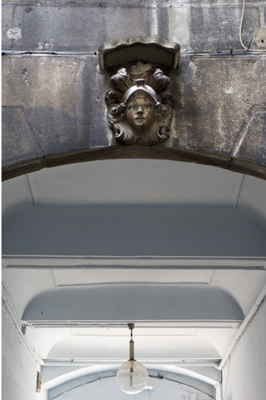
Première cour : détail du plafond du passage cocher avec une figure casquée sur la clé d'un arc.

25, Besançon Grande Rue 91, lieudit : îlot Forum