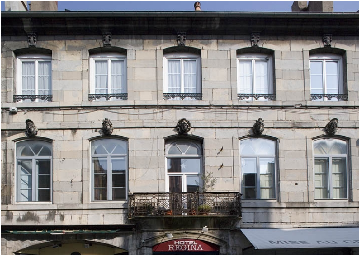
Vue d'ensemble de la façade sur rue à partir du premier étage : de face.

25, Besançon Grande Rue 91, lieudit : îlot Forum