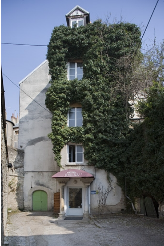
Vue d'ensemble du logis secondaire au fond de la deuxième cour.

25, Besançon Grande Rue 91, lieudit : îlot Forum