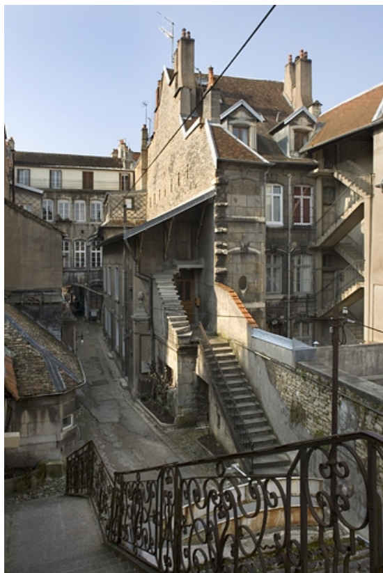
Vue d'ensemble de l'hôtel depuis l'escalier isolé au fond de la parcelle.

25, Besançon Grande Rue 91, lieudit : îlot Forum