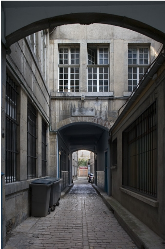
Première cour : vue d'ensemble en direction de la deuxième cour.

25, Besançon Grande Rue 91, lieudit : îlot Forum