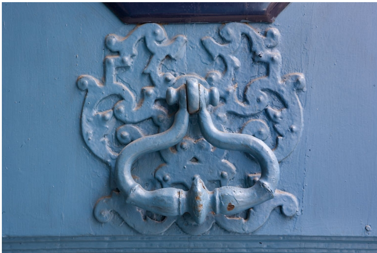
Détail du heurtoir du portail d'entrée.

25, Besançon Grande Rue 91, lieudit : îlot Forum