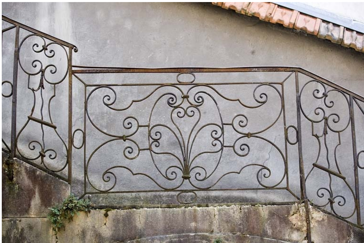
Détail de la rampe en fer forgé de l'escalier isolé dans la deuxième cour.

25, Besançon Grande Rue 91, lieudit : îlot Forum