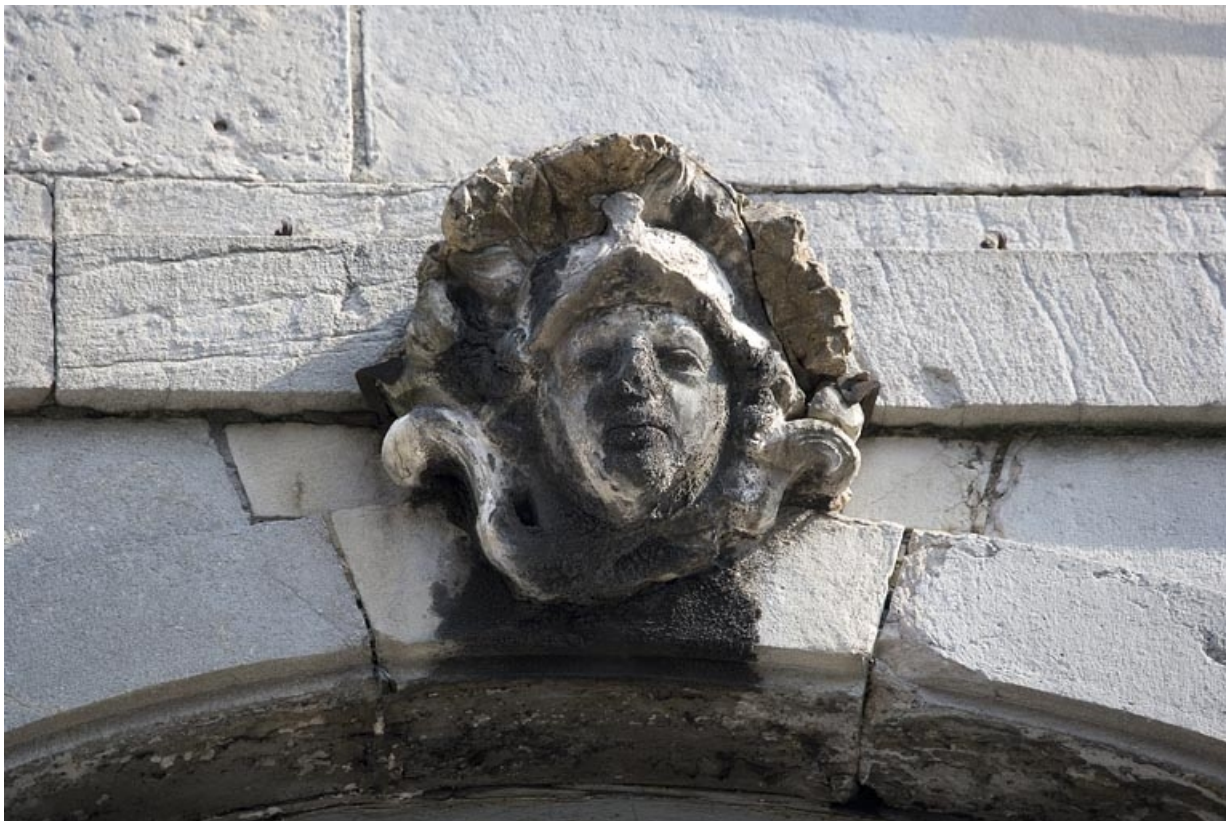
Détail de la clé d'une fenêtre au premier étage sur rue : figure casquée.

25, Besançon Grande Rue 91, lieudit : îlot Forum