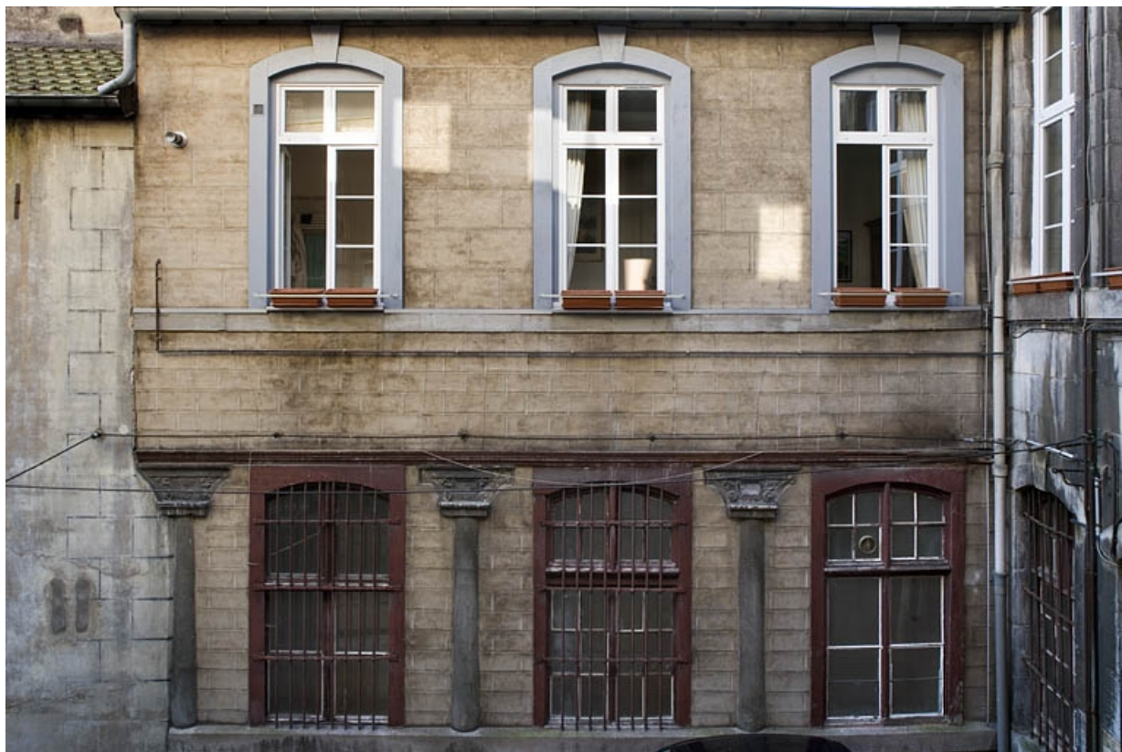
Vue d'ensemble du portique à droite de la deuxième cour.

25, Besançon Grande Rue 91, lieudit : îlot Forum