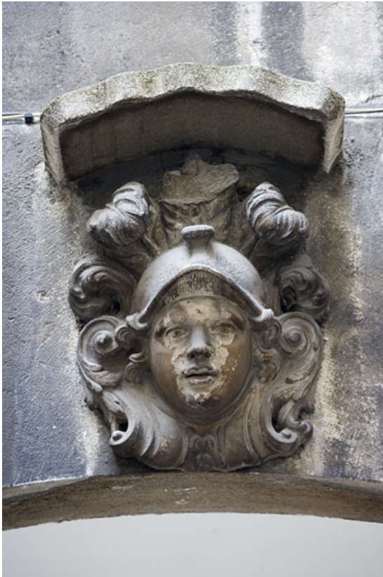
Première cour : détail de la clé d'un arc représentant une tête casquée.

25, Besançon Grande Rue 91, lieudit : îlot Forum