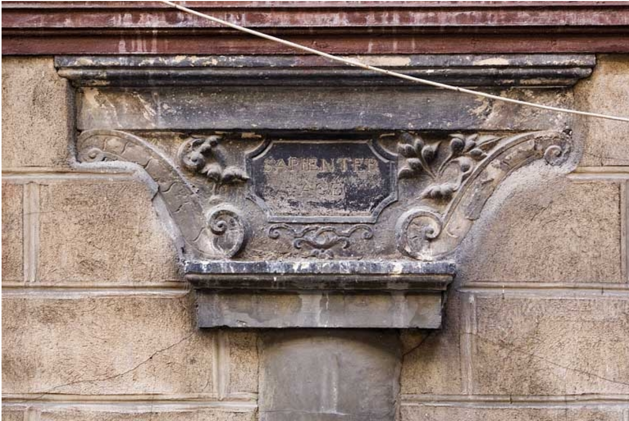
Détail du chapiteau du portique portant l'inscription latine "agis sagement".

25, Besançon Grande Rue 91, lieudit : îlot Forum