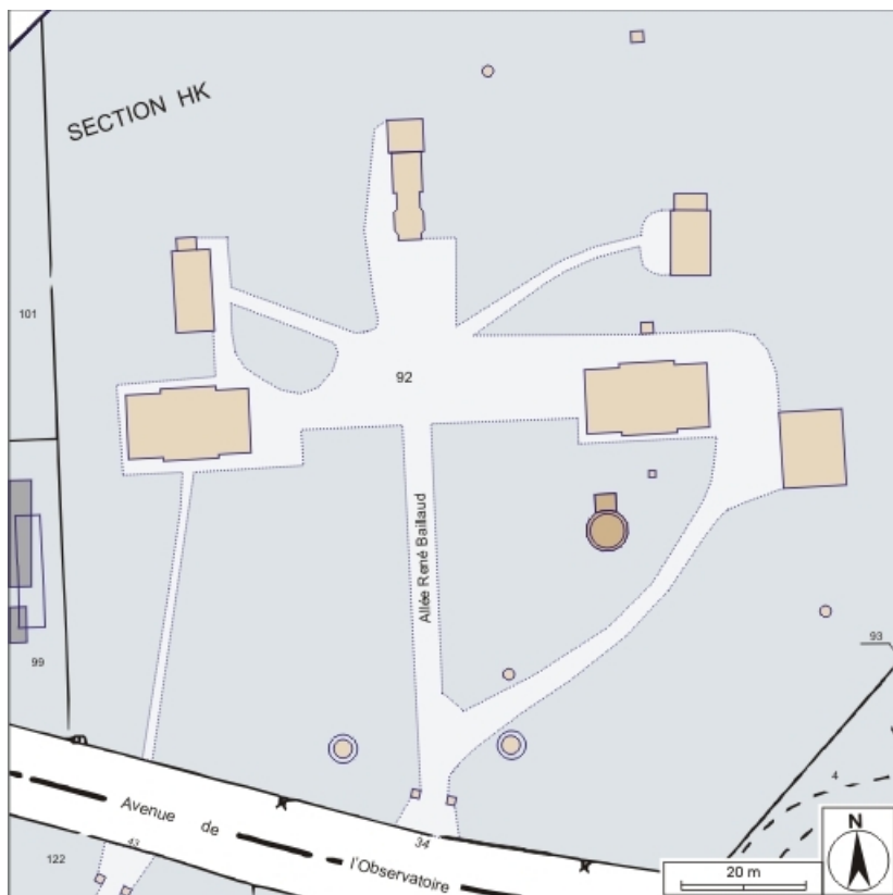
Plan-masse et de situation. Extrait du plan cadastral informatisé, 2004, section HK, échelle 1:1000 agrandie à 1:750. 25, Besançon, 34 avenue de l' Observatoire, lieudit : la Bouloie