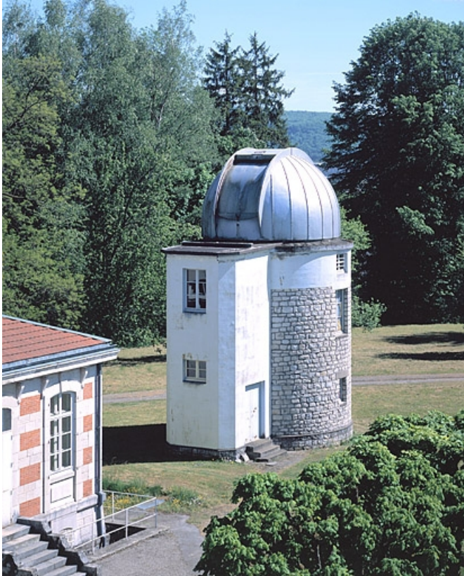
Vue d'ensemble plongeante depuis le pavillon de l'équatorial coudé, au nord-ouest.

25, Besançon, 34 avenue de l' Observatoire, lieudit : la Bouloie