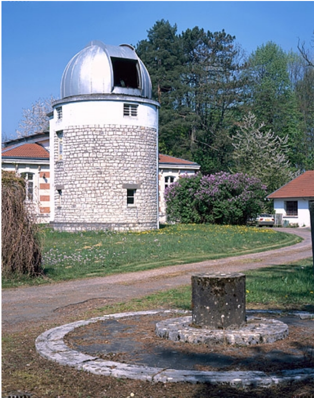
Tour avec la trappe du dôme ouverte, depuis le sud-ouest. 25, Besançon, 34 avenue de l' Observatoire, lieudit : la Bouloie