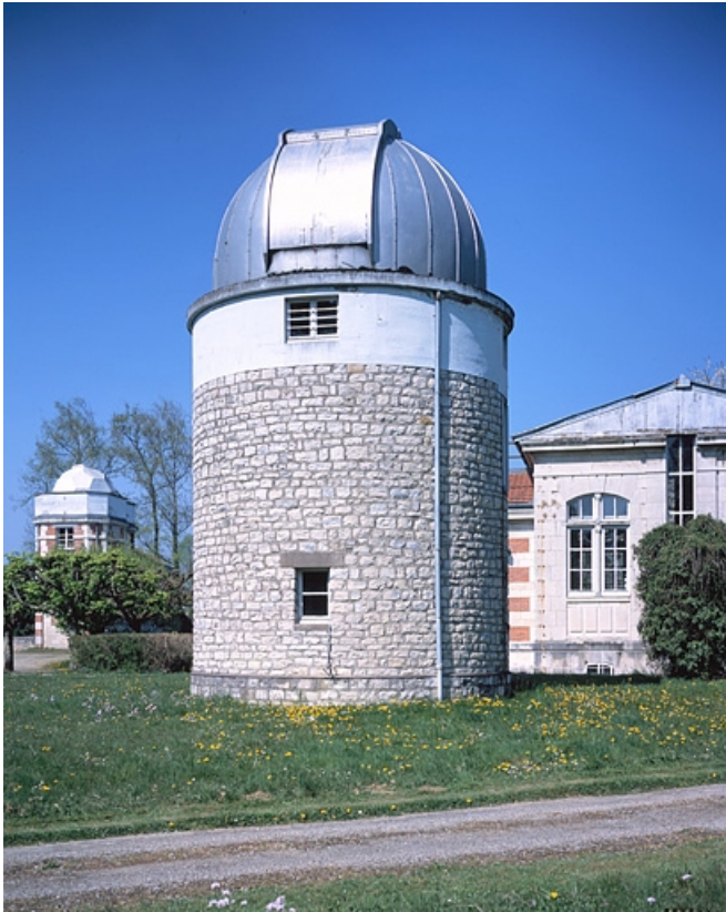
Tour avec la trappe du dôme fermée, depuis le sud-est.

25, Besançon, 34 avenue de l' Observatoire, lieudit : la Bouloie