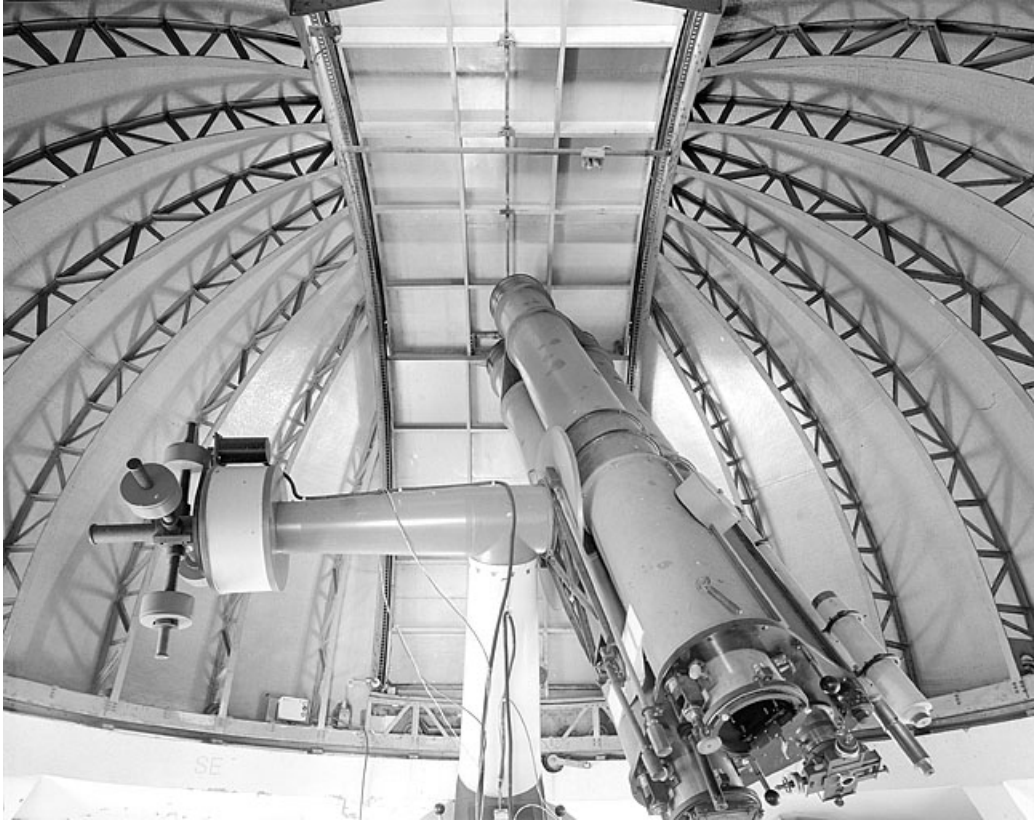
Intérieur du dôme (trappe fermée) et lunette.

25, Besançon, 34 avenue de l' Observatoire, lieudit : la Bouloie