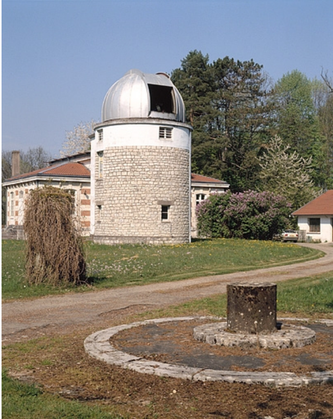
Tour avec la trappe du dôme ouverte, depuis le sud-ouest. 25, Besançon, 34 avenue de l' Observatoire, lieudit : la Bouloie