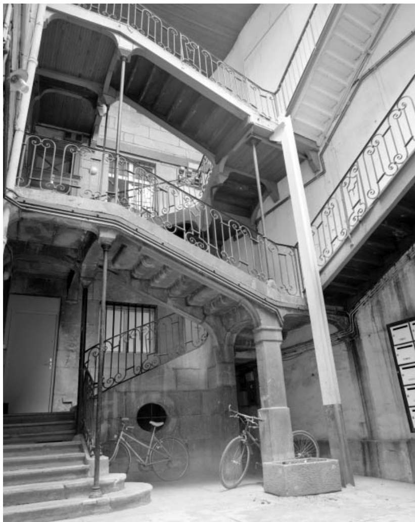
Vue d'ensemble de l'escalier à cage ouverte. 25, Besançon, 1 rue du Lycée, lieudit : îlot Pasteur