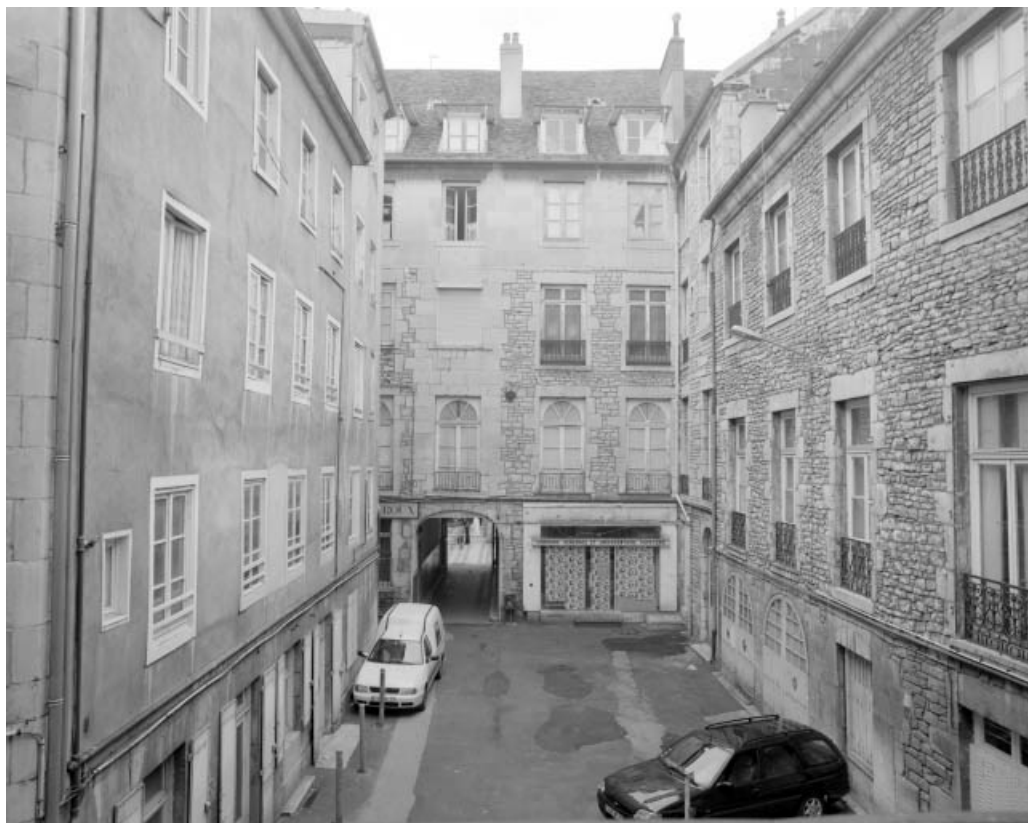
Vue de la première cour, depuis le logis sur cour.

25, Besançon Grande Rue 14, lieudit : îlot Pasteur