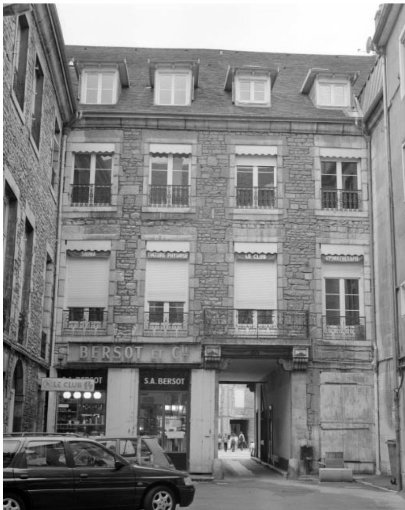
Façade antérieure du corps de logis sur cour : vue d'ensemble.

25, Besançon Grande Rue 14, lieudit : îlot Pasteur