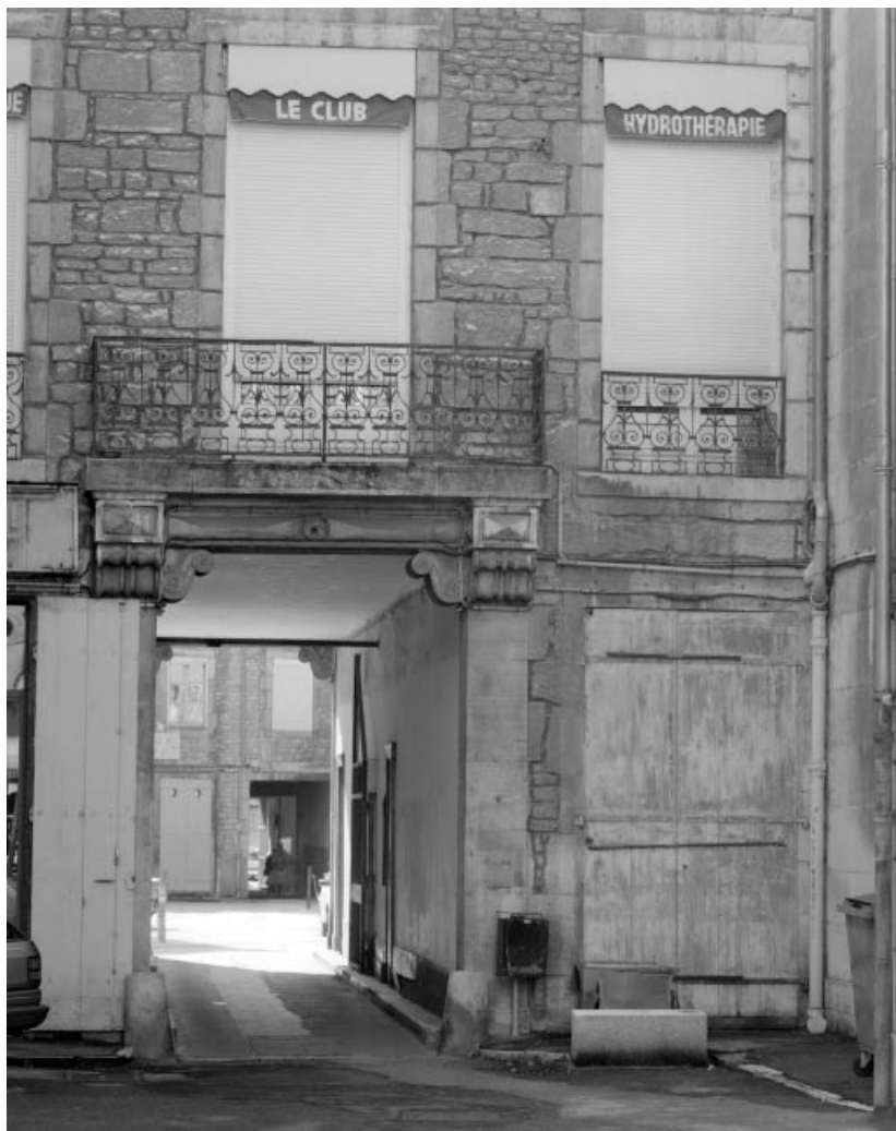
Façade antérieure du corps de logis sur cour : détail de l'entrée cochère. 25, Besançon Grande Rue 14, lieudit : îlot Pasteur