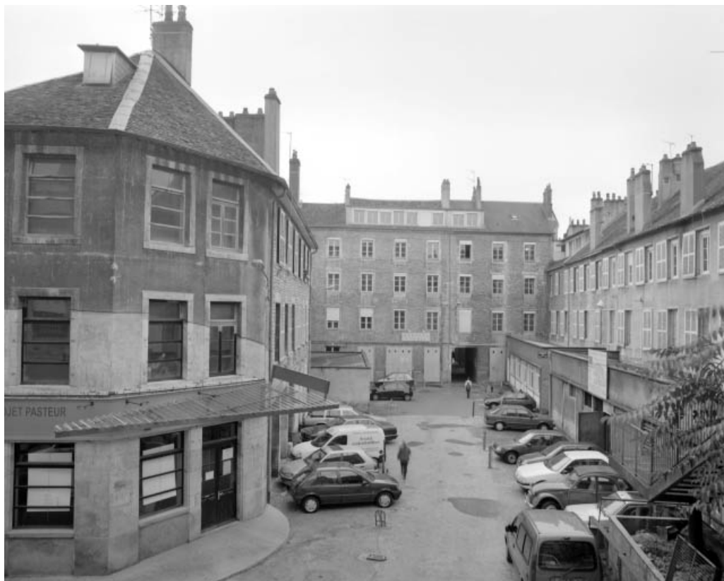
Vue d'ensemble des bâtiments bordant la deuxième cour.

25, Besançon Grande Rue 14, lieudit : îlot Pasteur