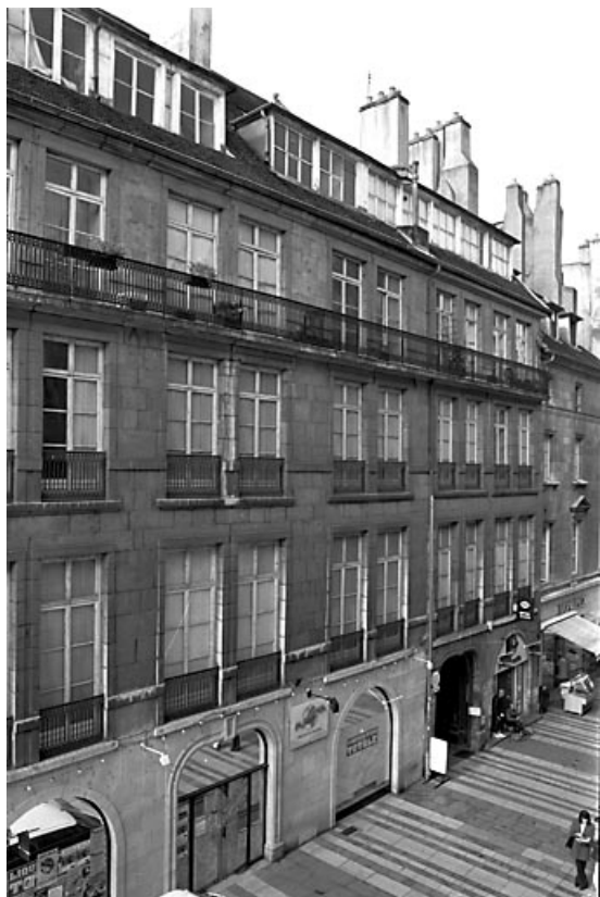
Façade sur rue, de trois quarts gauche : vue rapprochée. 25, Besançon Grande Rue 14, lieudit : îlot Pasteur