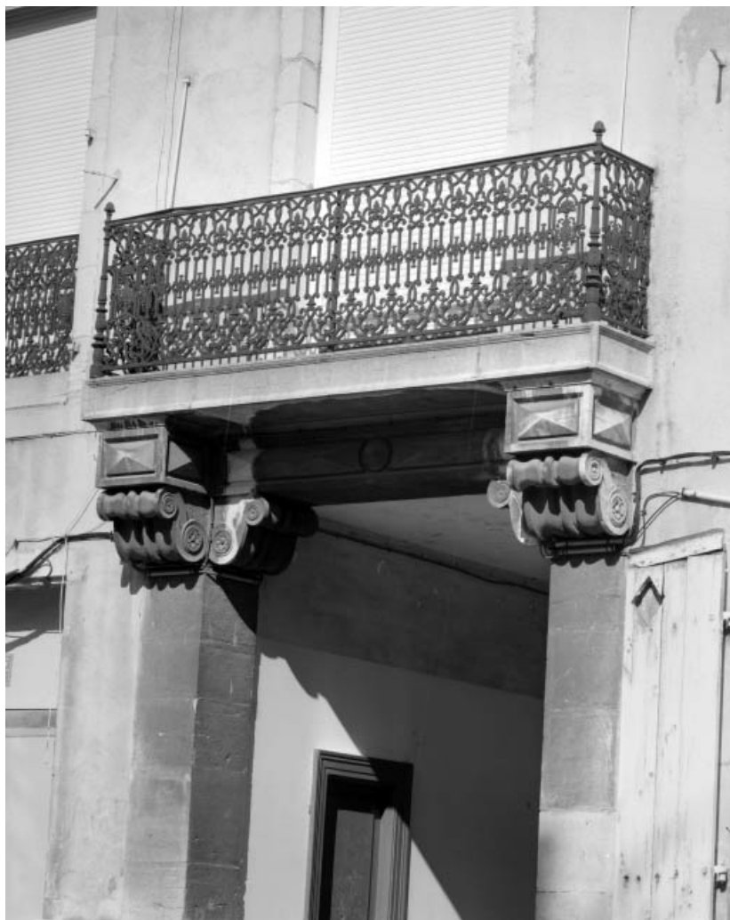
Façade postérieure du corps de logis sur cour, détail du balcon au-dessus de l'entrée cochère. 25, Besançon Grande Rue 14, lieudit : îlot Pasteur