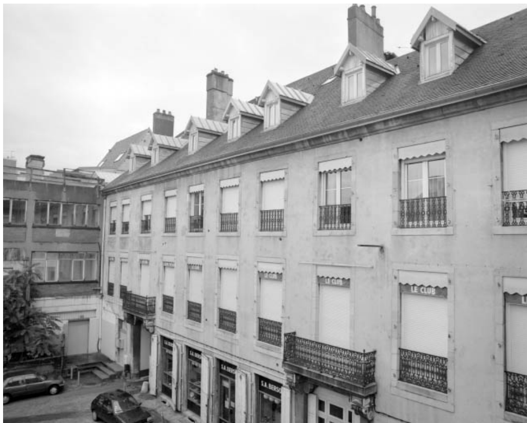
Façade postérieure du corps de logis sur cour, de trois quarts gauche.

25, Besançon Grande Rue 14, lieudit : îlot Pasteur