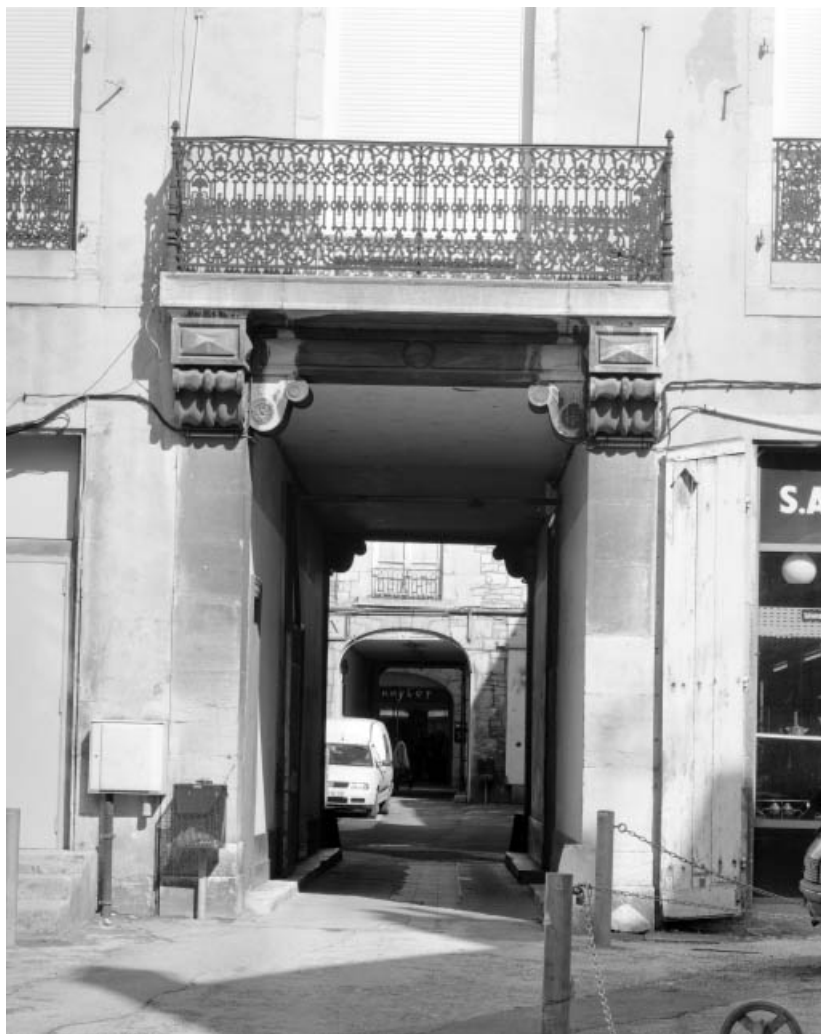
Façade postérieure du corps de logis sur cour, détail de l'entrée cochère. 25, Besançon Grande Rue 14, lieu dit : îlot Pasteur