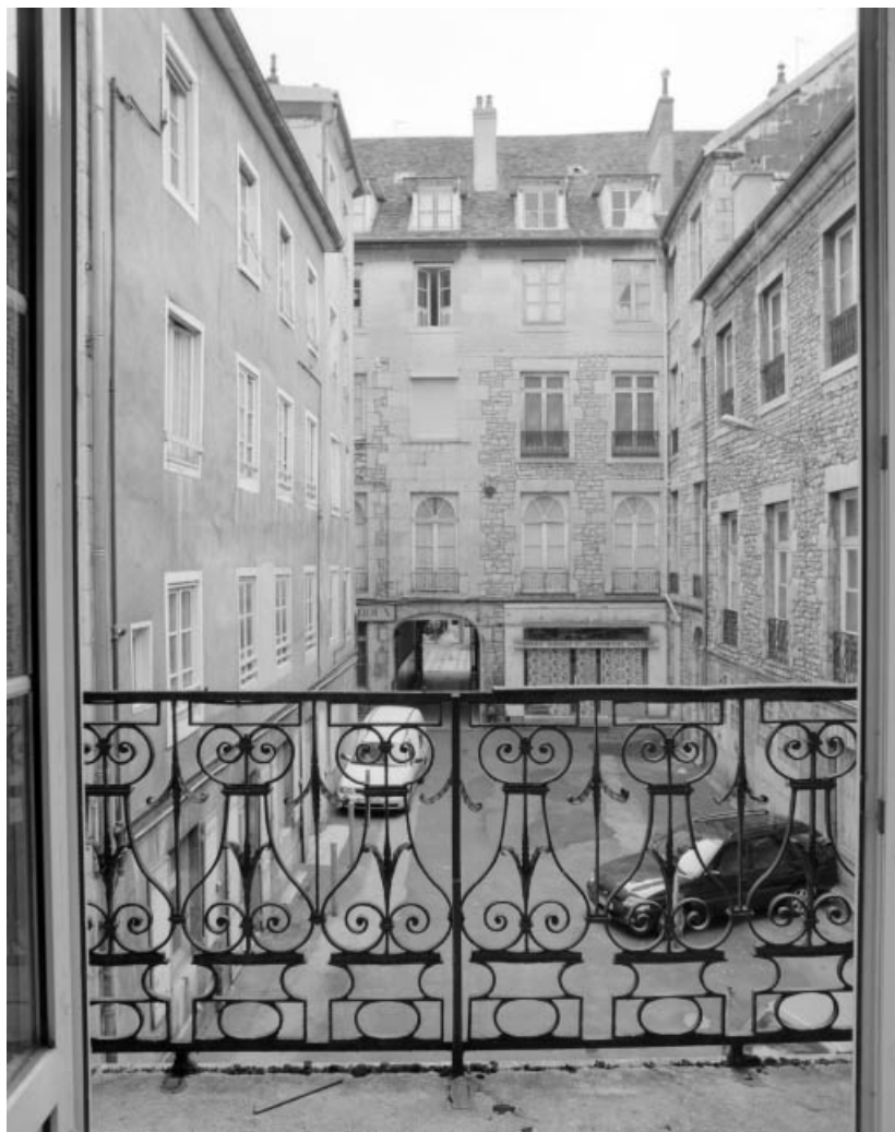
Vue de la première cour depuis le premier étage du logis sur cour.

25, Besançon Grande Rue 14, lieudit : îlot Pasteur