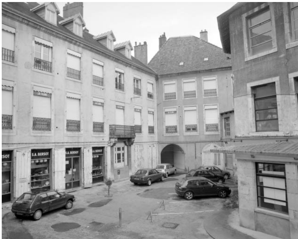
Façade postérieure du corps de logis sur cour, de trois quarts droit.

25, Besançon Grande Rue 14, lieudit : îlot Pasteur