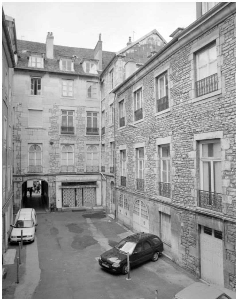
Vue de la première cour, depuis le logis sur cour : détail de l'aile des remises. 25, Besançon Grande Rue 14, lieudit : îlot Pasteur