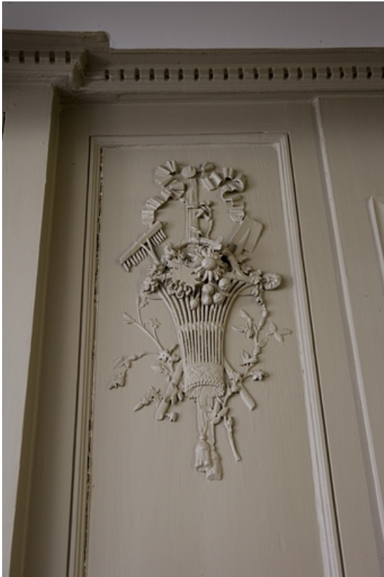
Détail d'un décor représentant le printemps ornant les lambris d'une pièce du premier étage. 25, Besançon Grande Rue 80, lieudit : îlot Terrier de Santans