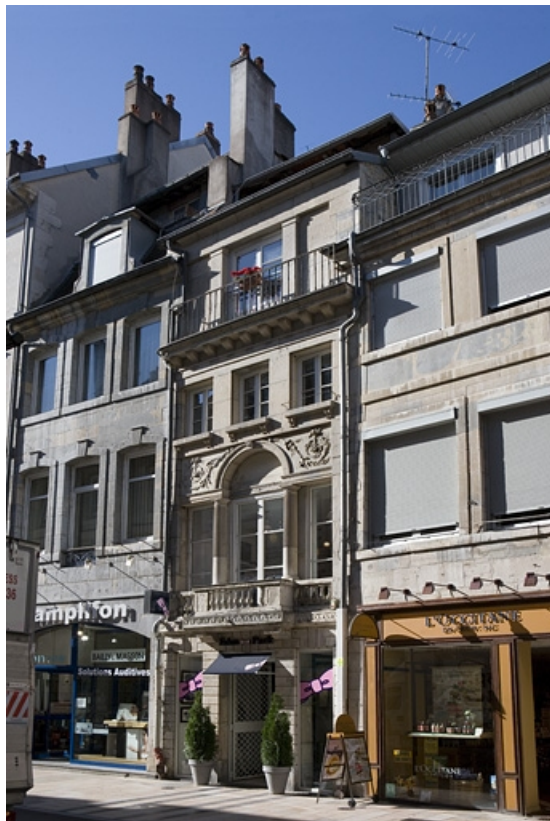
Vue d'ensemble de la façade sur rue de trois quarts droit.

25, Besançon Grande Rue 80, lieudit : îlot Terrier de Santans