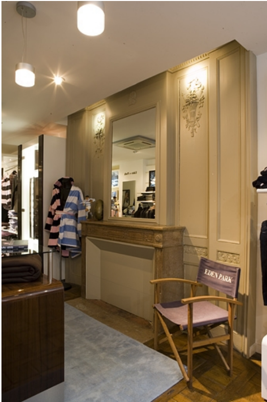
Détail d'une cheminée située au premier étage, de trois quarts droit.

25, Besançon Grande Rue 80, lieudit : îlot Terrier de Santans