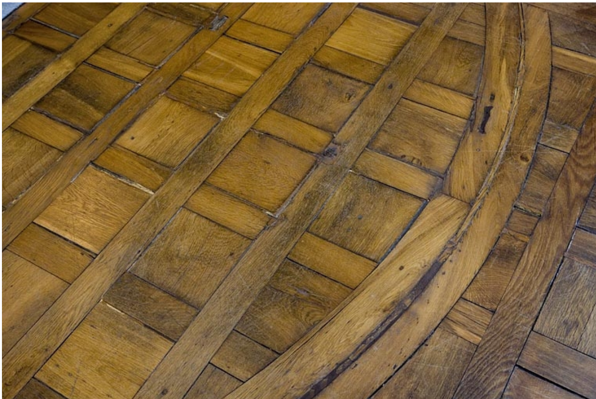
Détail du parquet d'une pièce située au premier étage.

25, Besançon Grande Rue 80, lieudit : îlot Terrier de Santans