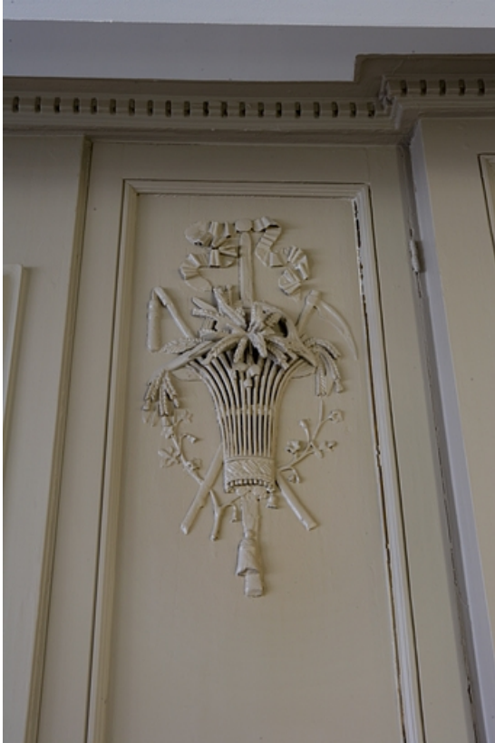
Détail d'un décor représentant l'été ornant les lambris d'une pièce du premier étage.

25, Besançon Grande Rue 80, lieudit : îlot Terrier de Santans