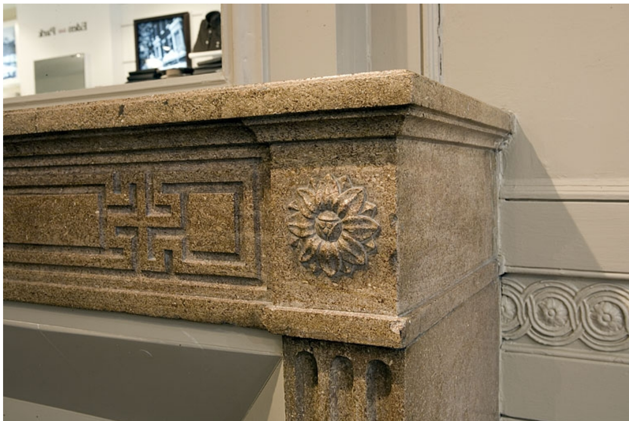
Détail d'une rosace couronnant l'un des piedroits de la cheminée située au premier étage.

25, Besançon Grande Rue 80, lieudit : îlot Terrier de Santans