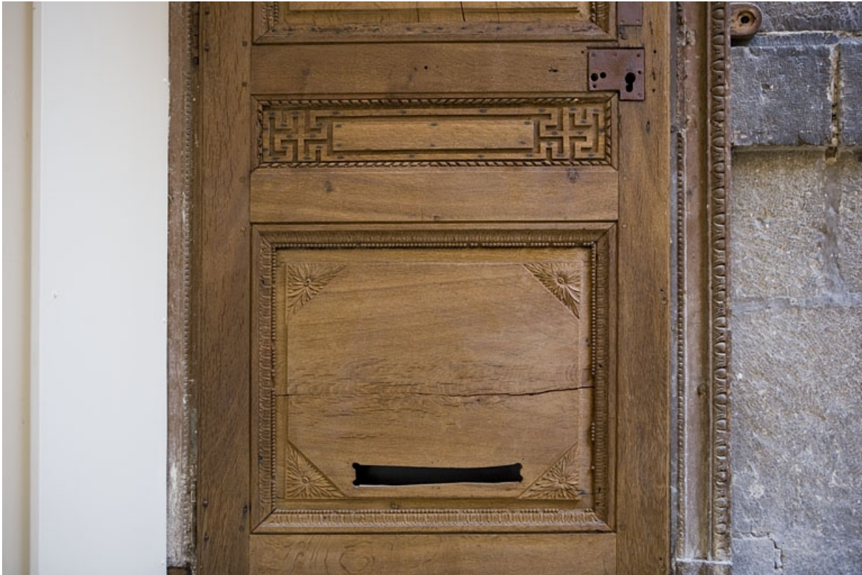
Détail des grecques ornant la porte d'entrée du logis secondaire.

25, Besançon Grande Rue 80, lieudit : îlot Terrier de Santans