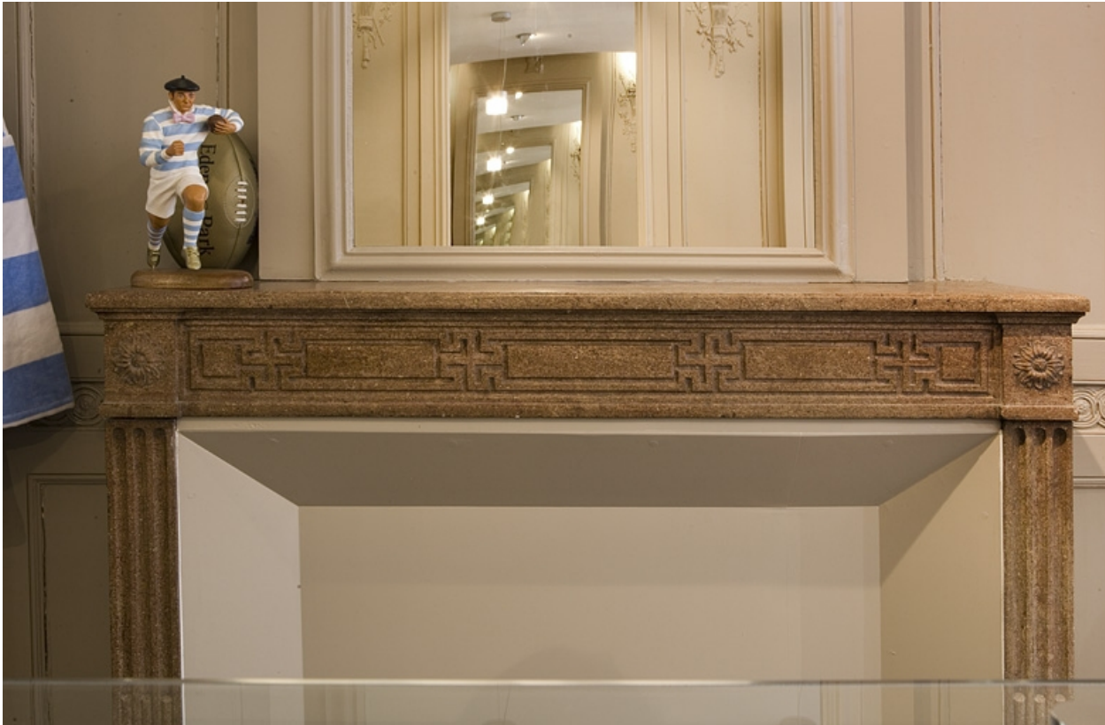
Détail de la tablette de la cheminée située au premier étage.

25, Besançon Grande Rue 80, lieudit : îlot Terrier de Santans