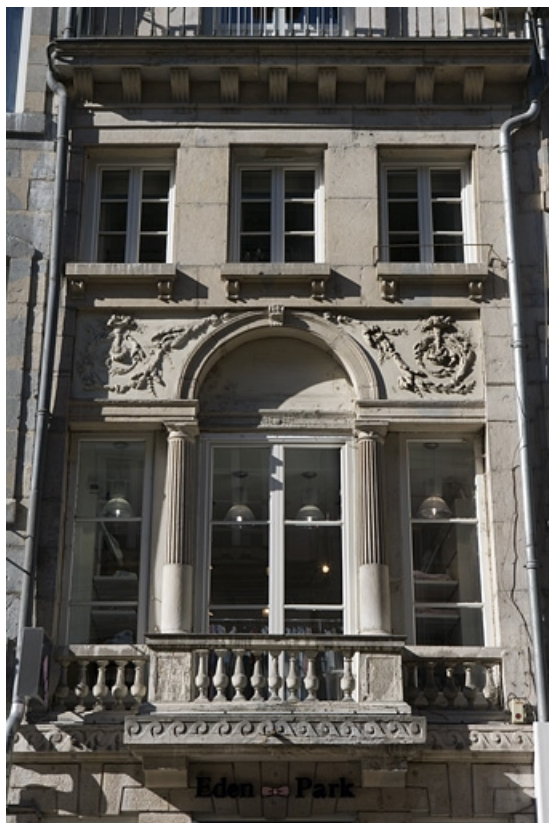
Détail de la serlienne du premier étage sur rue.

25, Besançon Grande Rue 80, lieudit : îlot Terrier de Santans