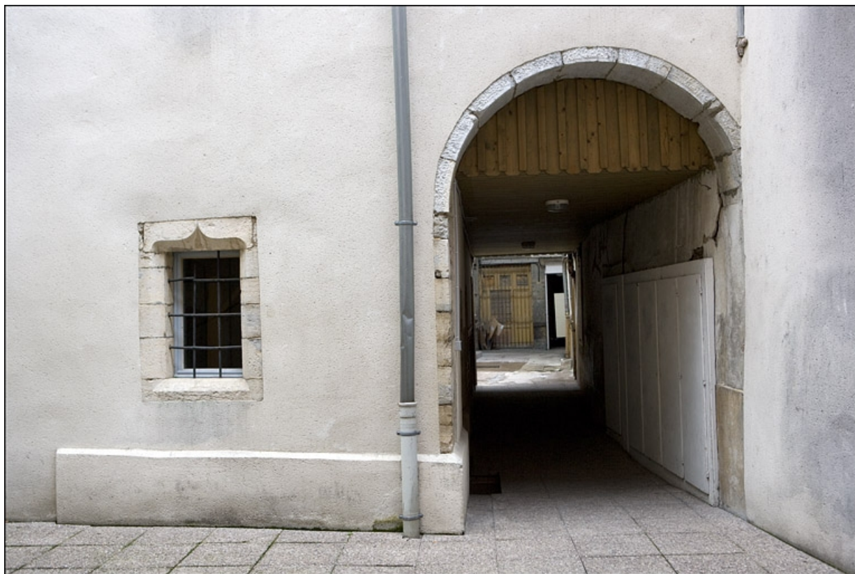
Premier logis secondaire, façade postérieure : détail du passage cocher.

25, Besançon Grande Rue 17, lieudit : îlot Chevanney