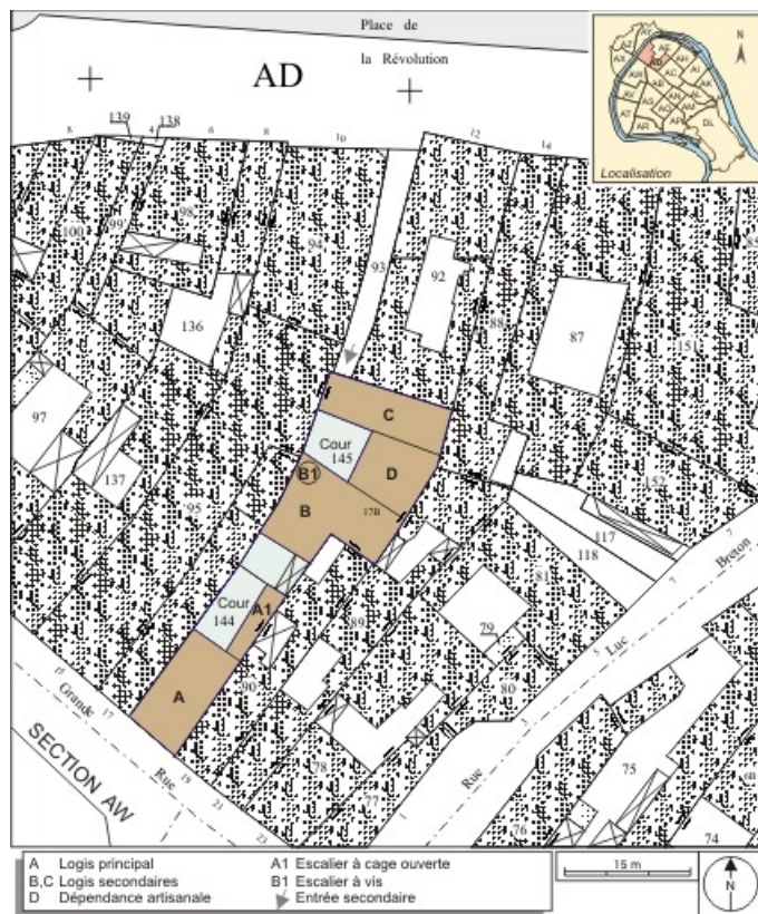
Plan masse et de situation. Extrait du plan cadastral, 1994, section AD. 25, Besançon Grande Rue 17, lieudit : îlot Chevanney