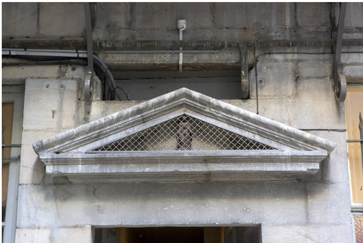
Façade postérieure du logis principal : détail du fronton sur la porte du couloir d'entrée. 25, Besançon, 11 Grande Rue, lieudit : îlot Chevanney