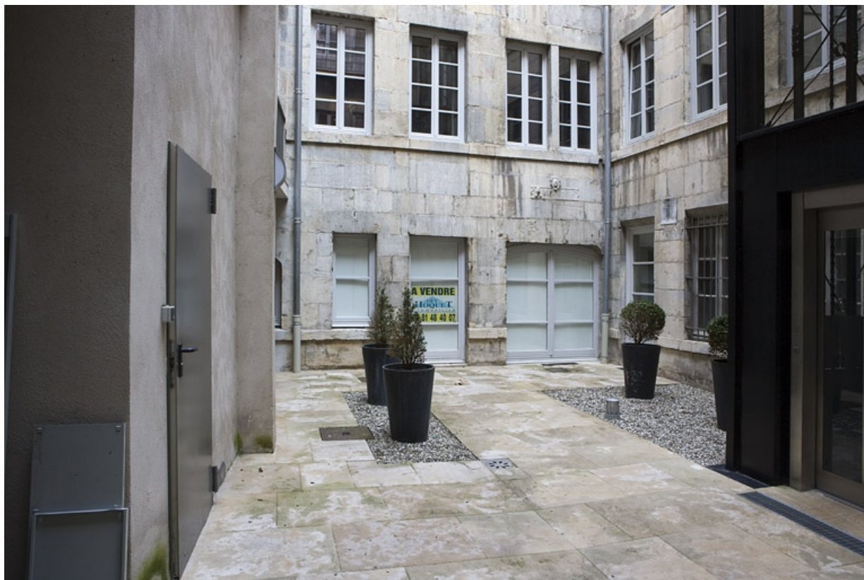
Façade antérieure du logis secondaire depuis l'entrée de la cour.

25, Besançon, 11 Grande Rue, lieudit : îlot Chevanney