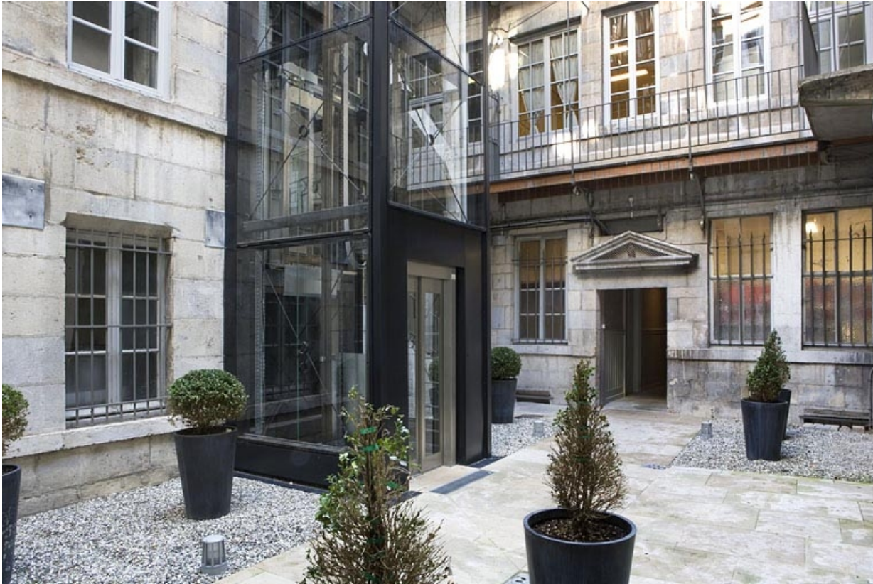
Façade postérieure du logis principal depuis le fond de la cour.

25, Besançon, 11 Grande Rue, lieudit : îlot Chevanney