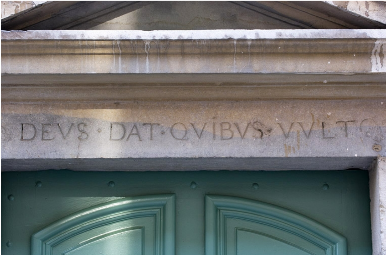
Façade antérieure du logis principal : détail de l'inscription au-dessus de la porte d'entrée.

25, Besançon, 11 Grande Rue, lieudit : îlot Chevanney