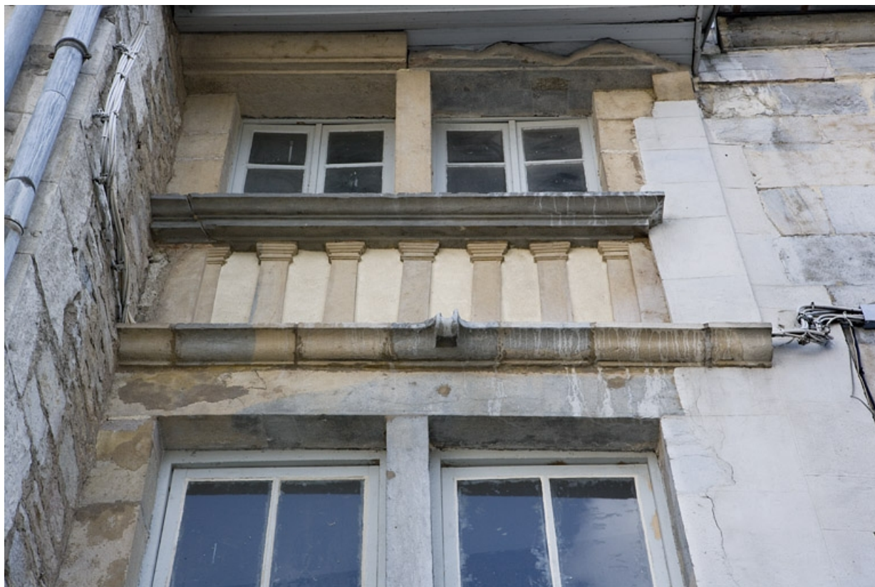
Détail du motif séparant le premier et le deuxième étage de l'entrée cochère. 25, Besançon, 11 Grande Rue, lieudit : îlot Chevanney