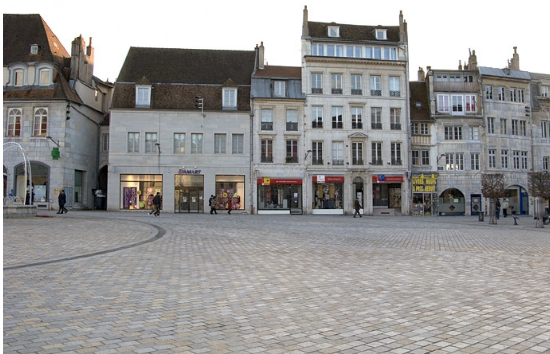
Vue de l'entrée cochère dans l'alignement de la rue depuis la place de la Révolution.

25, Besançon, 11 Grande Rue, lieudit : îlot Chevanney