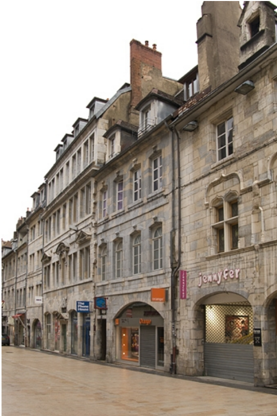
Vue d'ensemble du logis principal dans l'alignement de la Grande Rue.

25, Besançon, 11 Grande Rue, lieudit : îlot Chevanney