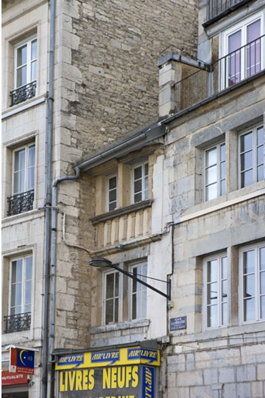
Vue d'ensemble des parties supérieures de l'entrée cochère.

25, Besançon, 11 Grande Rue, lieudit : îlot Chevanney