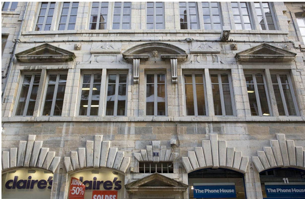
Façade antérieure du logis principal : détail du premier étage.

25, Besançon, 11 Grande Rue, lieudit : îlot Chevanney