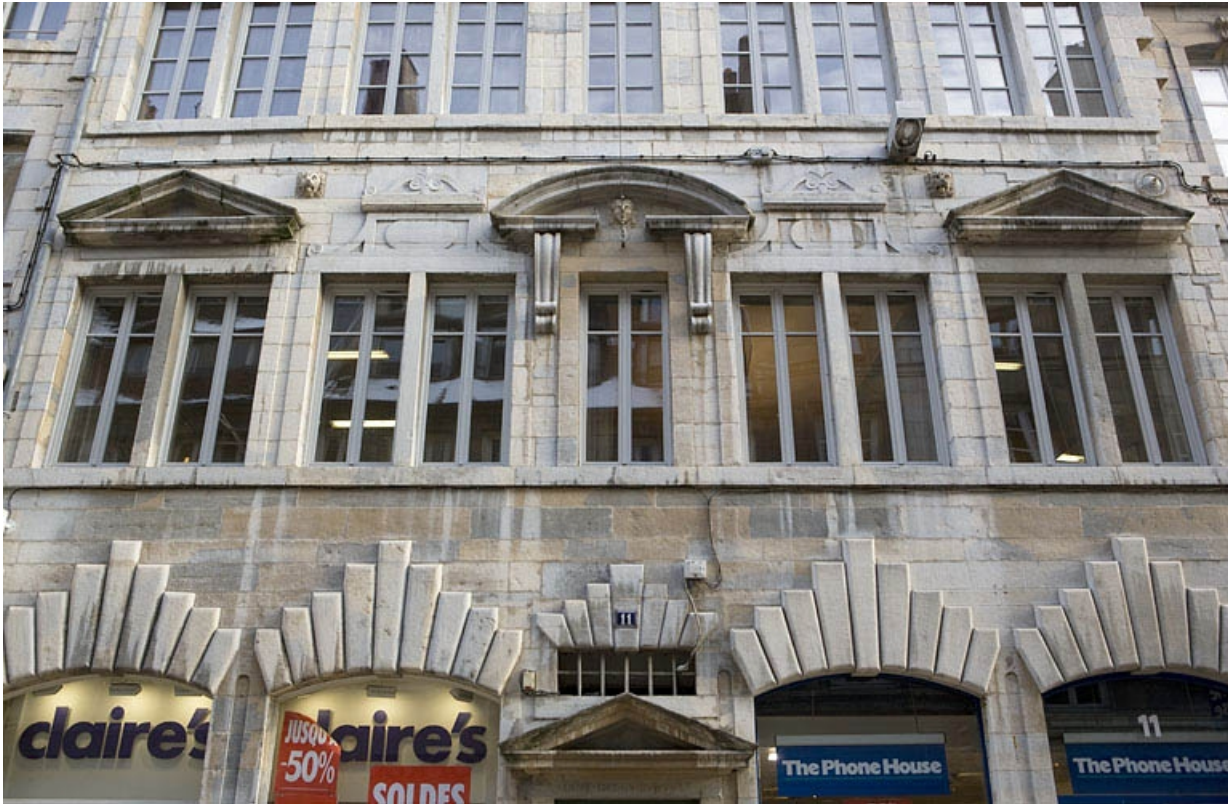
Façade antérieure du logis principal : détail du premier étage.

25, Besançon, 11 Grande Rue, lieudit : îlot Chevanney