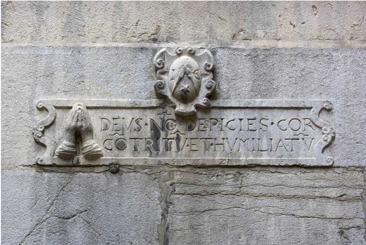
Façade antérieure du logis secondaire : détail d'une inscription.

25, Besançon, 11 Grande Rue, lieudit : îlot Chevanney