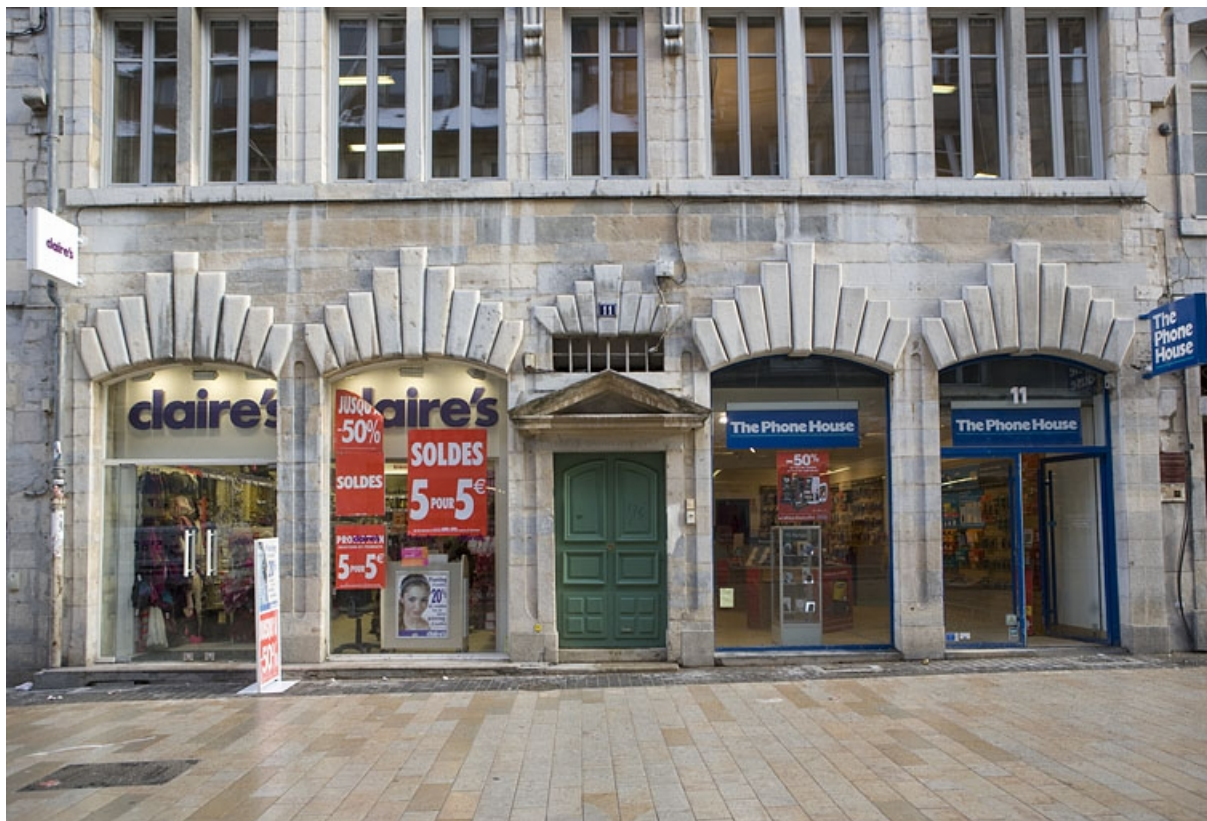
Façade antérieure du logis principal : détail du rez-de-chaussée.

25, Besançon, 11 Grande Rue, lieudit : îlot Chevanney