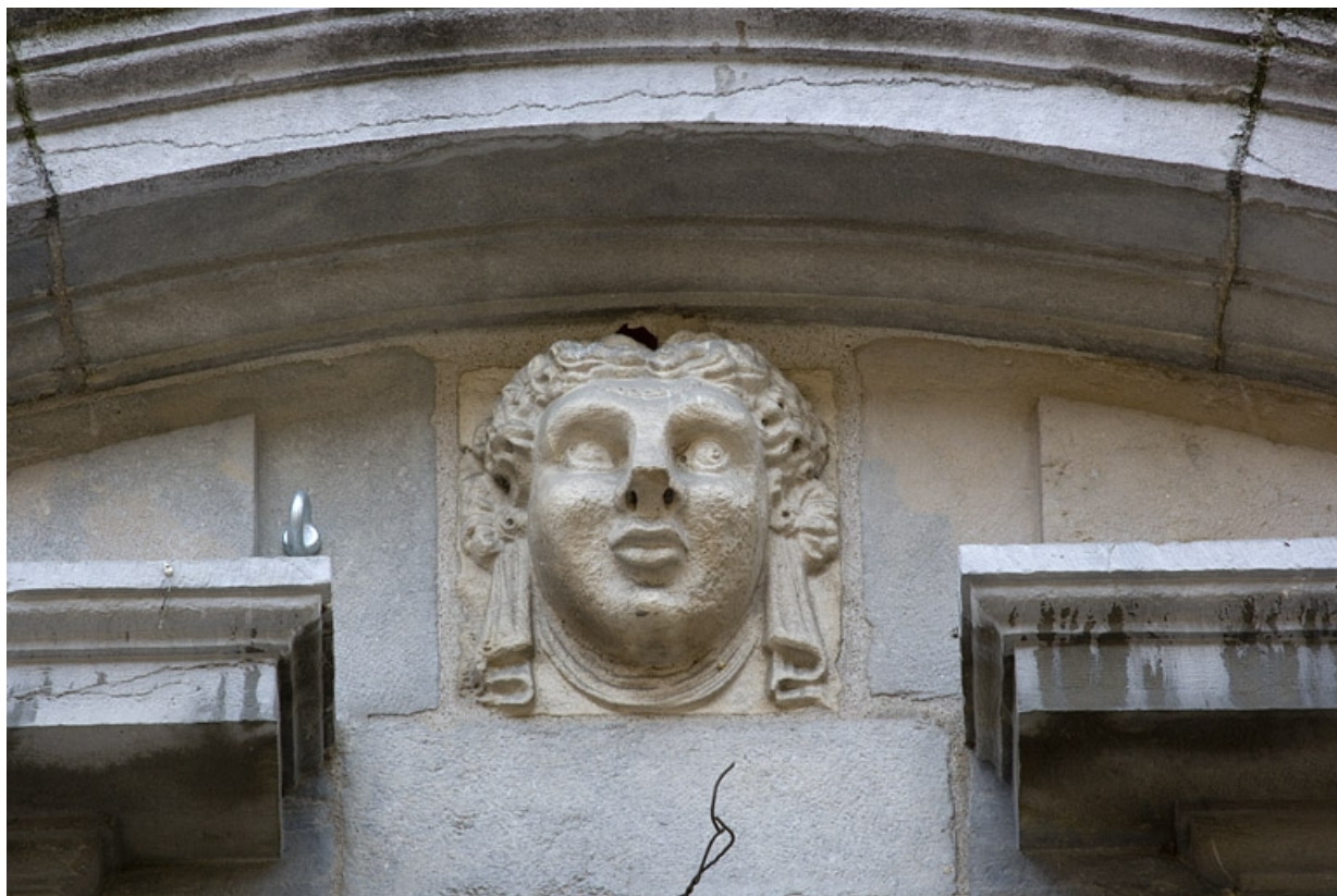
Façade antérieure du logis principal : détail d'une tête sculptée, fronton d'une fenêtre du premier étage. 25, Besançon, 11 Grande Rue, lieudit : îlot Chevanney