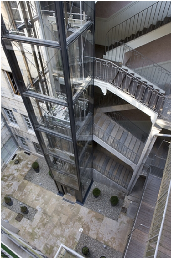
Vue d'ensemble de l'escalier à cage ouverte sur cour et de l'ascenseur.

25, Besançon, 11 Grande Rue, lieudit : îlot Chevanney