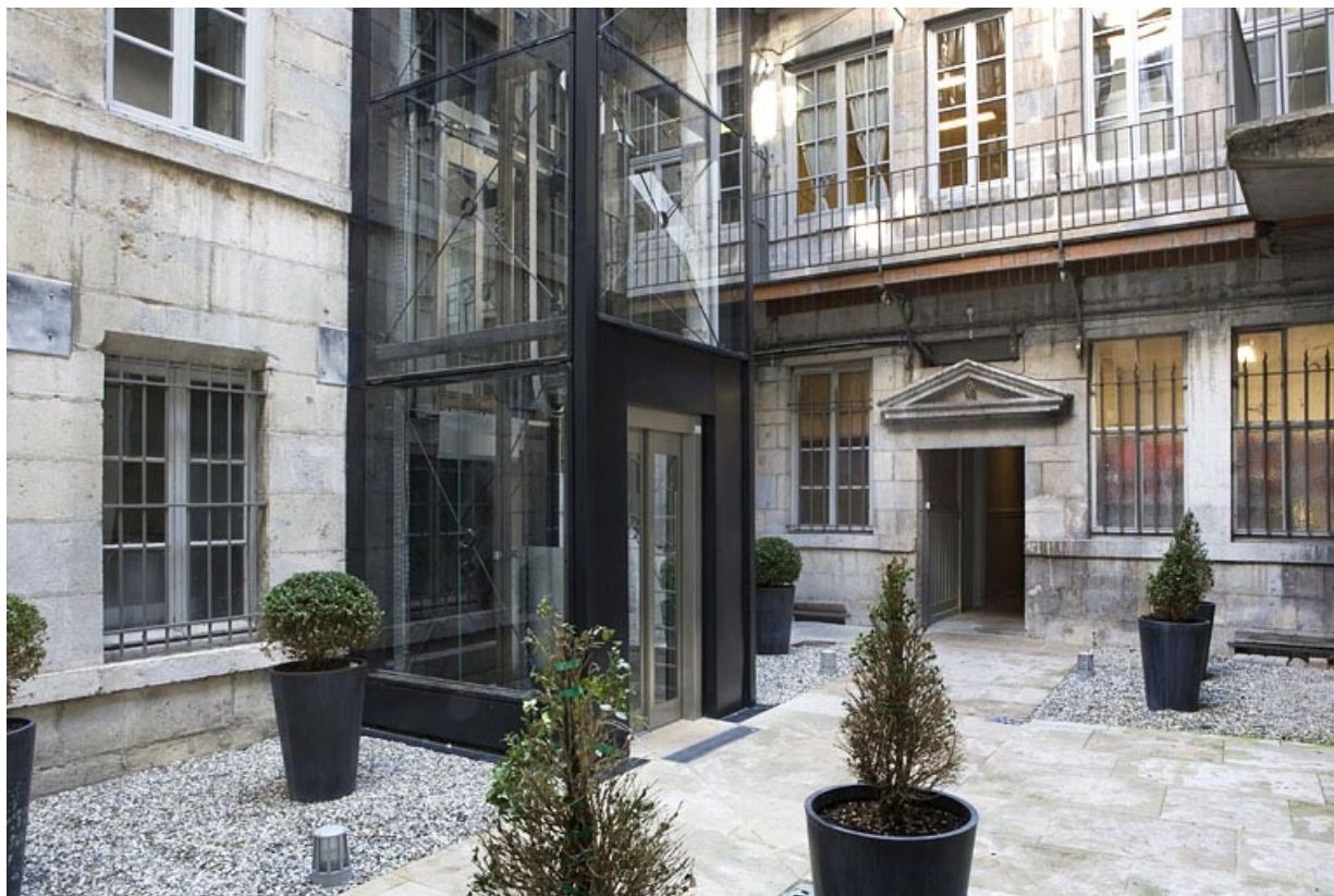
Façade postérieure du logis principal depuis le fond de la cour.

25, Besançon, 11 Grande Rue, lieudit : îlot Chevanney