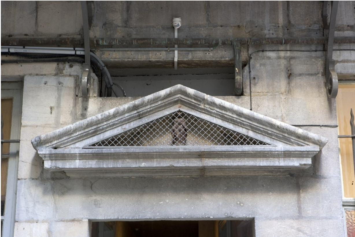
Façade postérieure du logis principal : détail du fronton sur la porte du couloir d'entrée. 25, Besançon, 11 Grande Rue, lieudit : îlot Chevanney