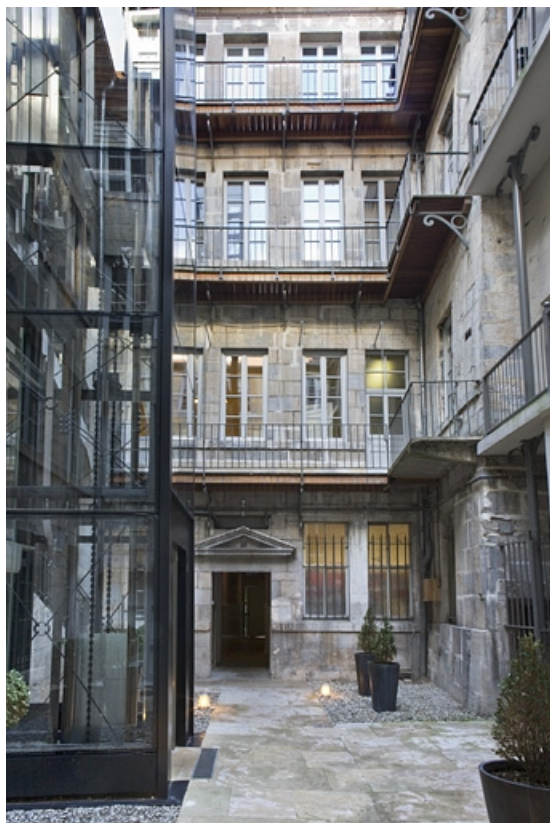
Vue d'ensemble des façades de l'hôtel depuis le fond de la cour.

25, Besançon, 11 Grande Rue, lieudit : îlot Chevanney