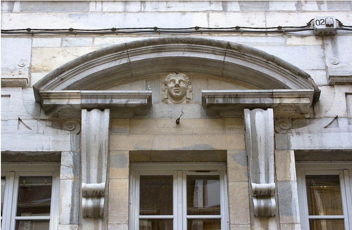
Façade antérieure du logis principal : détail d'un fronton cintré au-dessus d'une fenêtre du premier étage.

25, Besançon, 11 Grande Rue, lieudit : îlot Chevanney