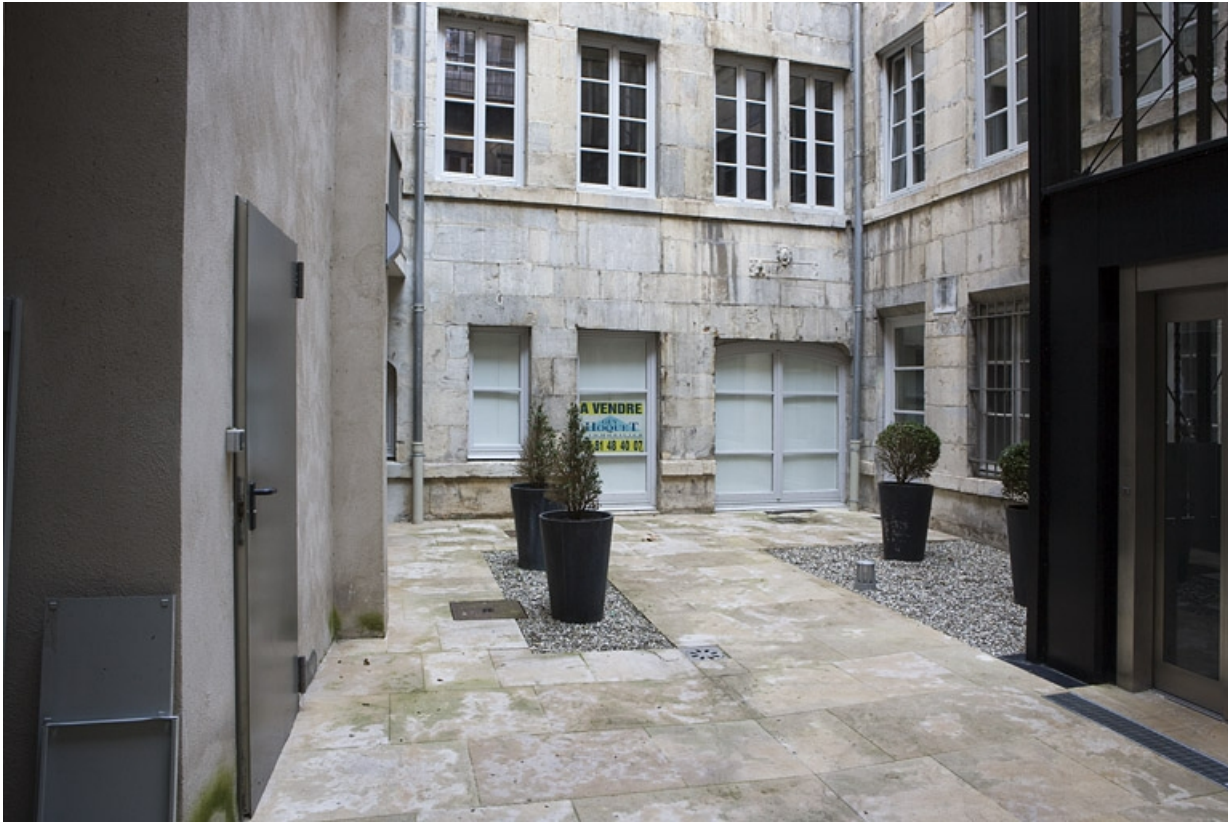
Façade antérieure du logis secondaire depuis l'entrée de la cour.

25, Besançon, 11 Grande Rue, lieudit : îlot Chevanney