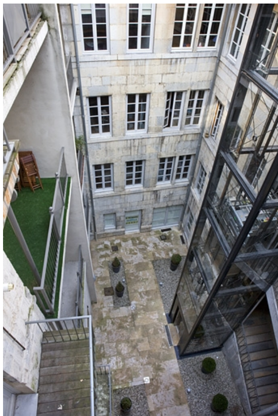
Vue d'ensemble de la façade antérieure du logis secondaire depuis la coursière du logis principal. 25, Besançon, 11 Grande Rue, lieudit : îlot Chevanney