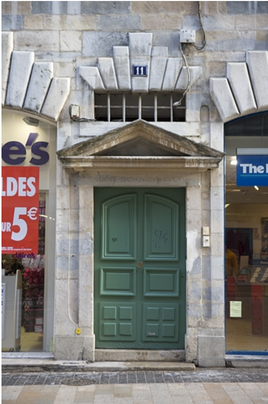
Façade antérieure du logis principal : détail de la porte d'entrée.

25, Besançon, 11 Grande Rue, lieudit : îlot Chevanney