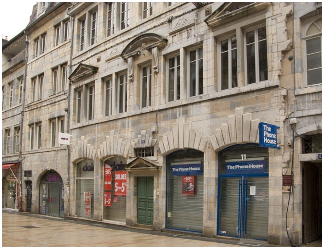
Façade antérieure du logis principal de trois quarts droit.

25, Besançon, 11 Grande Rue, lieudit : îlot Chevanney