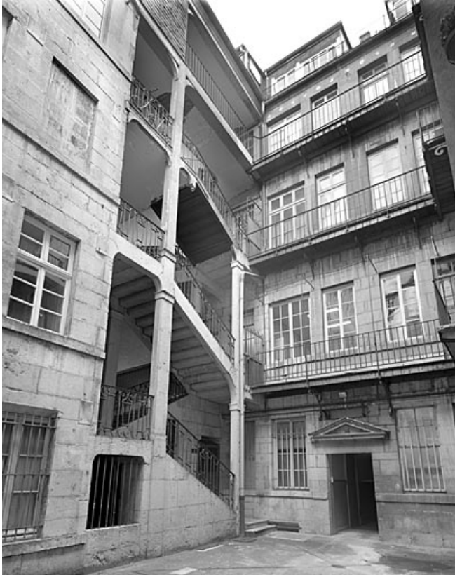
Vue d'ensemble de l'escalier à cage ouverte.

25, Besançon, 11 Grande Rue, lieudit : îlot Chevanney