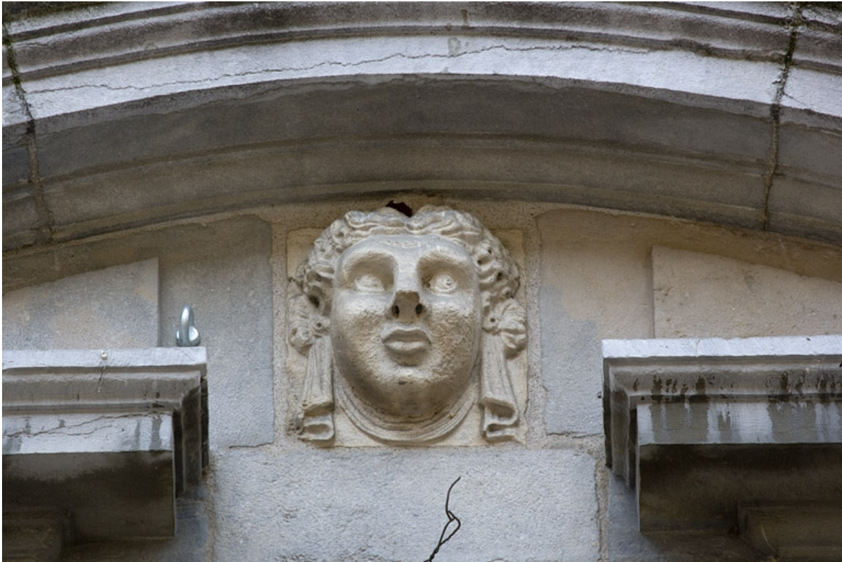
Façade antérieure du logis principal : détail d'une tête sculptée, fronton d'une fenêtre du premier étage.

25, Besançon, 11 Grande Rue, lieudit : îlot Chevanney