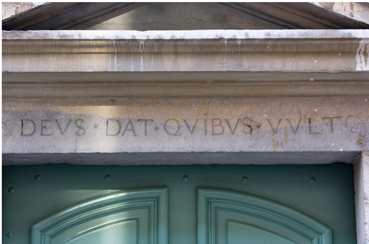
Façade antérieure du logis principal : détail de l'inscription au-dessus de la porte d'entrée.

25, Besançon, 11 Grande Rue, lieudit : îlot Chevanney