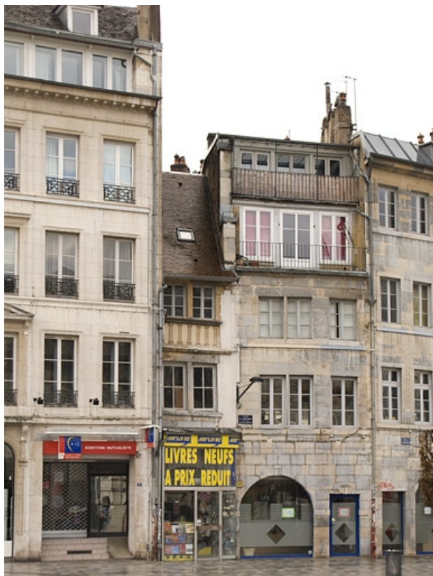
Vue d'ensemble de l'entrée cochère depuis la place de la Révolution.

25, Besançon, 11 Grande Rue, lieudit : îlot Chevanney