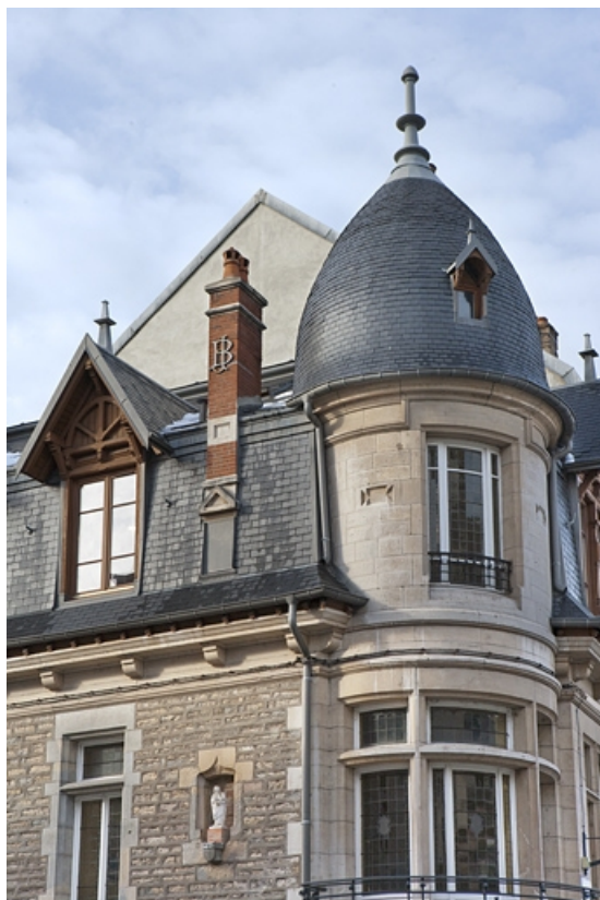
Détail de la partie supérieure de la tourelle d'angle.

25, Besançon, 15 rue Luc Breton, lieudit : îlot Chevanney