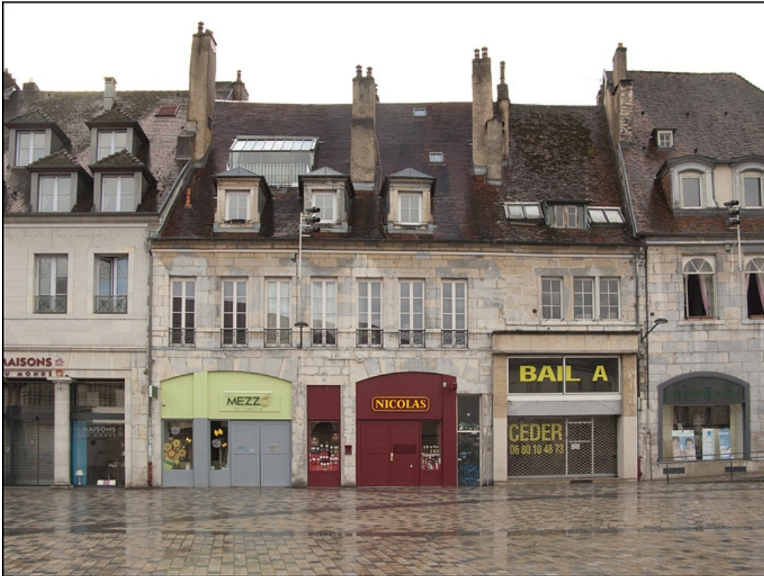
Vue d'ensemble de la façade antérieure, de face.

25, Besançon, 16 place de la Révolution, lieudit : îlot Chevanney