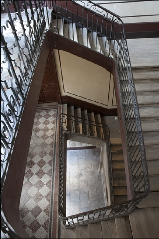
Vue d'ensemble de l'escalier principal depuis le dernier palier.

25, Besançon, 16 place de la Révolution, lieudit : îlot Chevanney