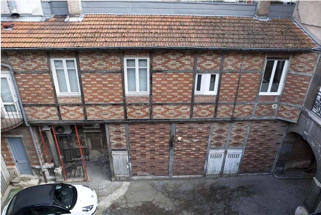
Vue d'ensemble du bûcher, en plongée.

25, Besançon, 16 place de la Révolution, lieudit : îlot Chevanney