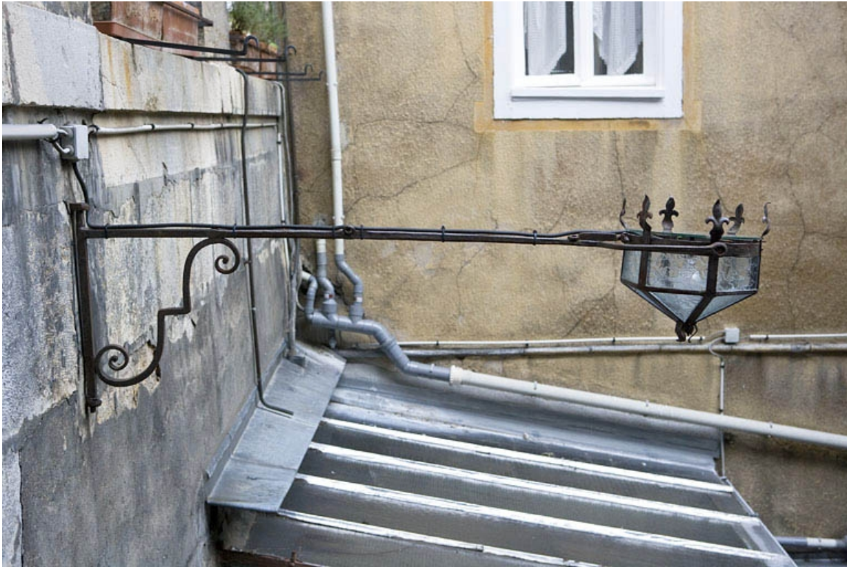
Détail du bras de lumière sur la façade postérieure du logis principal. 25, Besançon, 12 place de la Révolution, lieudit : îlot Chevanney