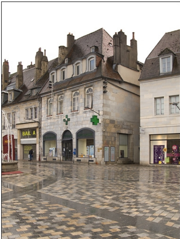
Vue d'ensemble du logis principal de trois quarts droit.

25, Besançon, 12 place de la Révolution, lieudit : îlot Chevanney