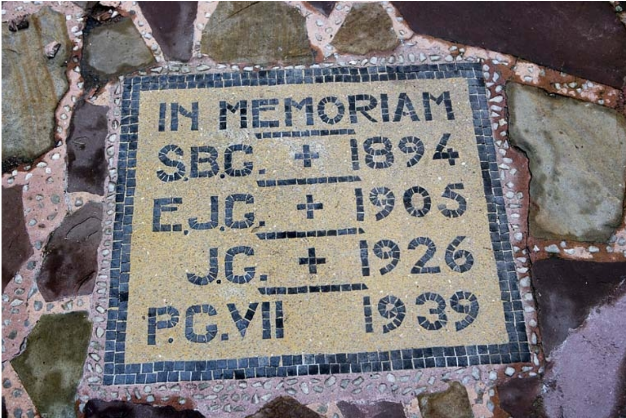
Détail d'une plaque commémorative, située dans la cour, en l'honneur des quatre derniers propriétaires de l'édifice. 25, Besançon, 12 place de la Révolution, lieudit : îlot Chevanney