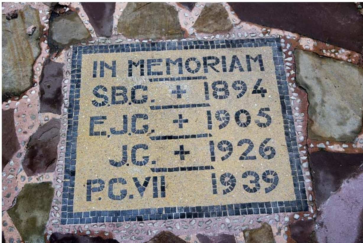
Détail d'une plaque commémorative, située dans la cour, en l'honneur des quatre derniers propriétaires de l'édifice. 25, Besançon, 12 place de la Révolution, lieudit : îlot Chevanney