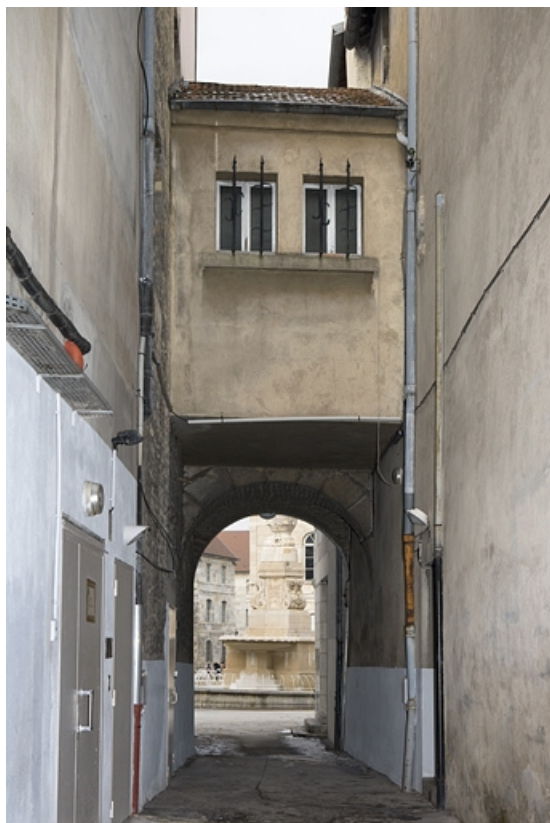
Détail du passage au-dessus de l'ancien trage, revers.

25, Besançon, 12 place de la Révolution, lieudit : îlot Chevanney