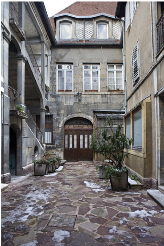
Vue d'ensemble de la cour.

25, Besançon, 12 place de la Révolution, lieudit : îlot Chevanney