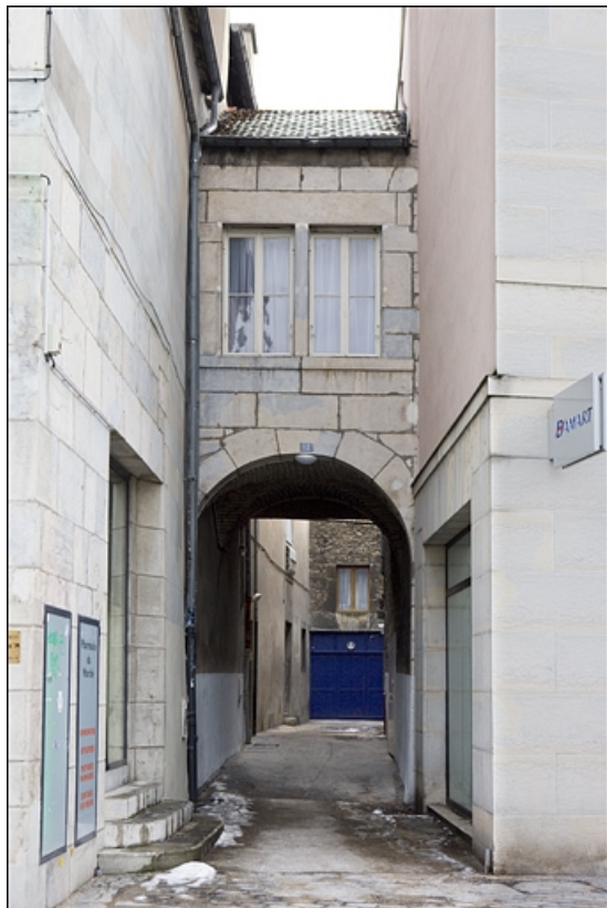
Détail du passage au-dessus de l'ancien trage, de face.

25, Besançon, 12 place de la Révolution, lieudit : îlot Chevanney