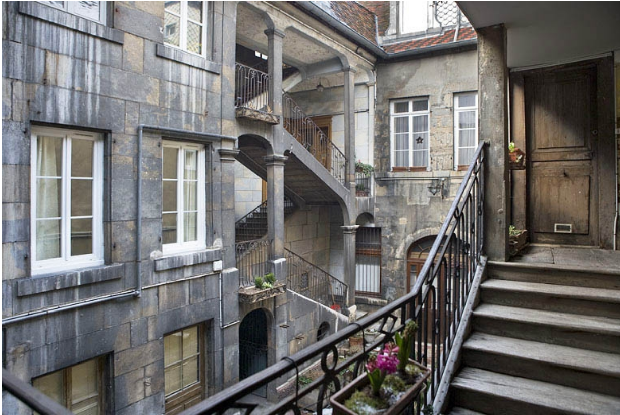
Vue de l'escalier à cage ouverte depuis celui des communs. 25, Besançon, 12 place de la Révolution, lieudit : îlot Chevanney