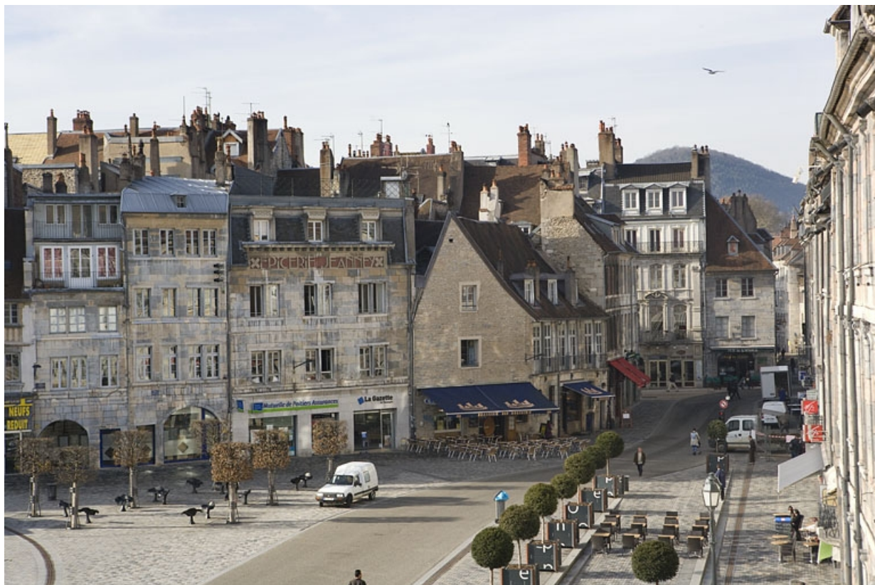
Vue éloignée du logis secondaire depuis la place de la Révolution.

25, Besançon Grande Rue 3, lieudit : îlot Chevanney