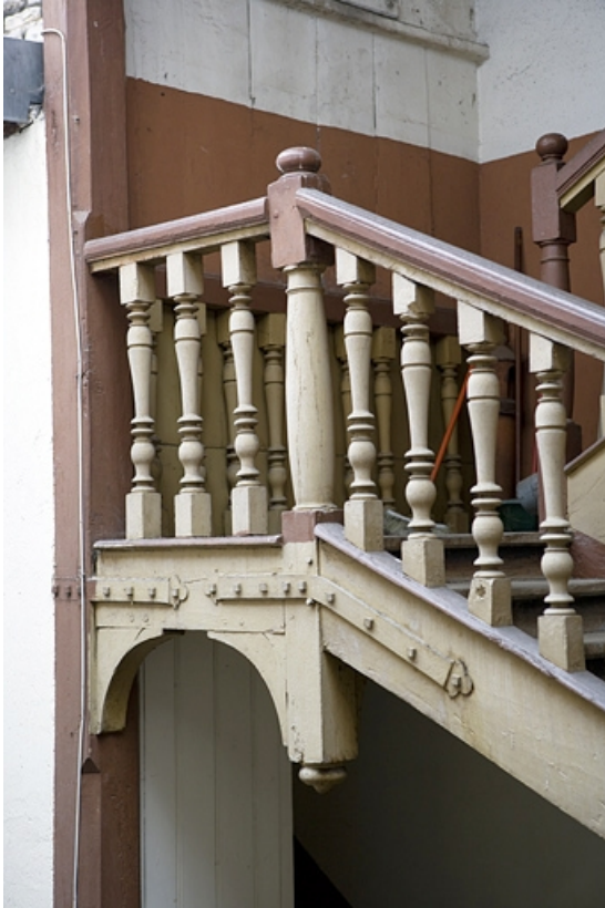
Détail des balustres de l'escalier à cage ouverte sur cour.

25, Besançon Grande Rue 3, lieudit : îlot Chevanney