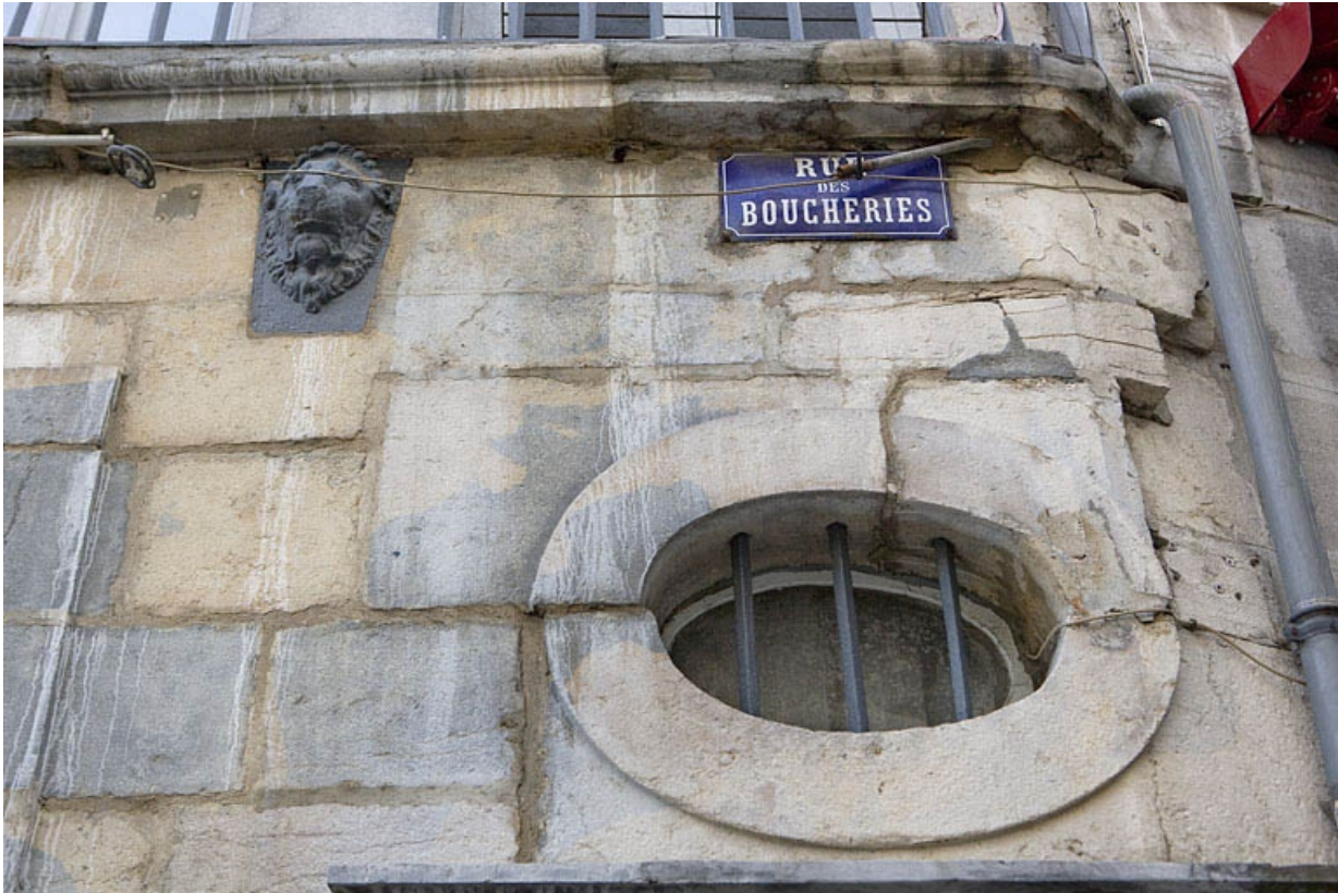
Détail de l'occulus au-dessus du linteau de porte du logis secondaire, rue des Boucheries.

25, Besançon Grande Rue 3, lieudit : îlot Chevanney