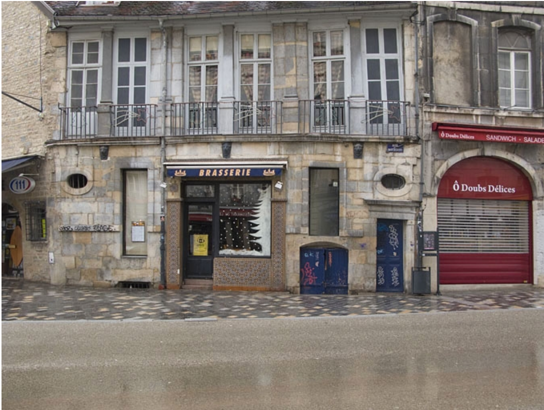
Détail de la façade antérieure du logis secondaire, rue des Boucheries.

25, Besançon Grande Rue 3, lieudit : îlot Chevanney