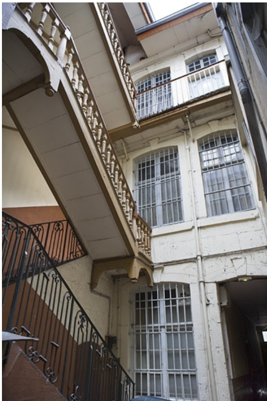
Façade postérieure du logis principal.

25, Besançon Grande Rue 3, lieudit : îlot Chevanney