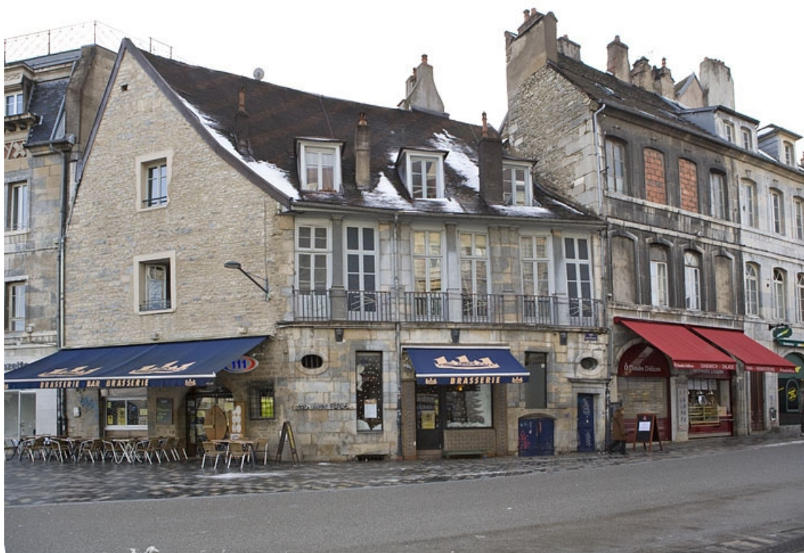
Vue d'ensemble du logis secondaire depuis la rue des Boucheries.

25, Besançon Grande Rue 3, lieudit : îlot Chevanney