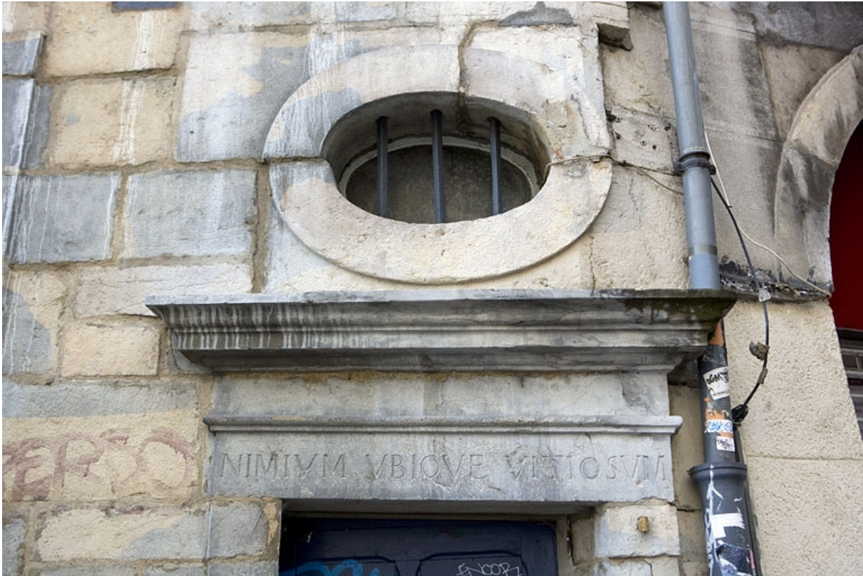
Détail du linteau de porte avec inscription du logis secondaire, rue des Boucheries.

25, Besançon Grande Rue 3, lieudit : îlot Chevanney