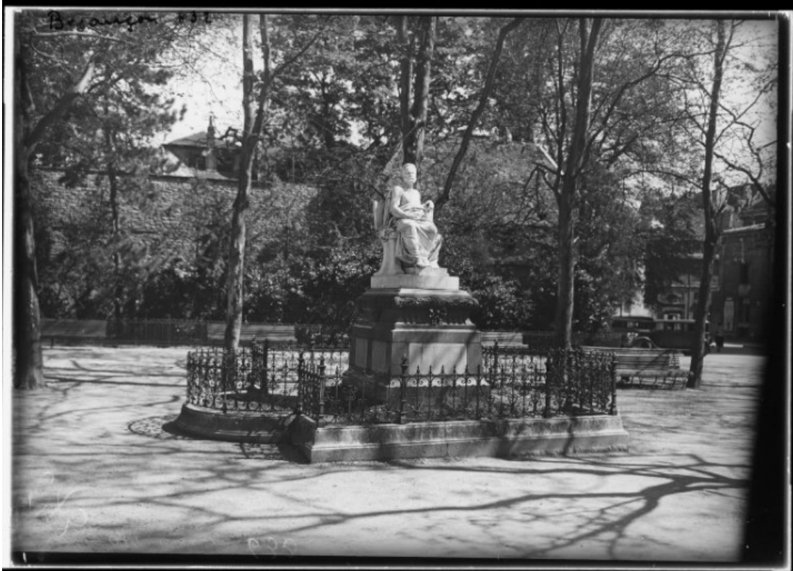
Monument dédié à Victor Hugo [1re moitié 20e siècle]. 25, Besançon rue de la Préfecture, lieudit : îlot Granvelle