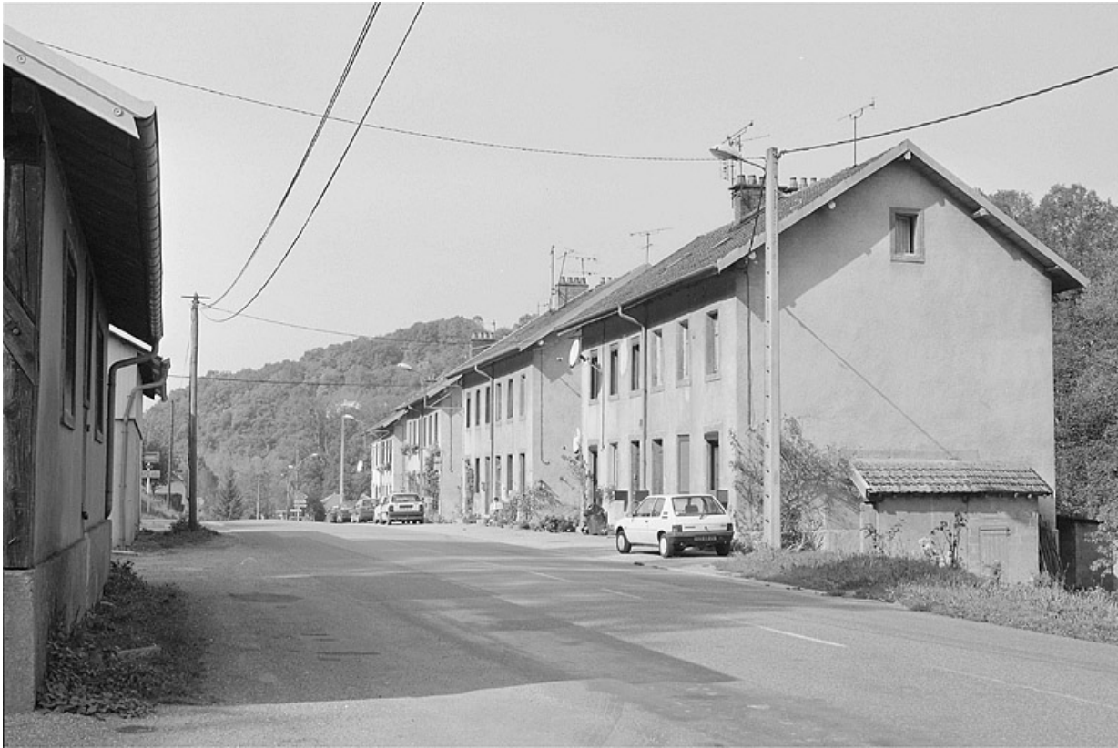
Vue d'ensemble depuis l'est.

25, Baume-les-Dames, lieudit : les Cités de Champard