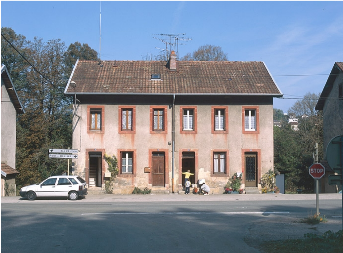
Façade antérieure d'une maison ouvrière.

25, Baume-les-Dames, lieudit : les Cités de Champard