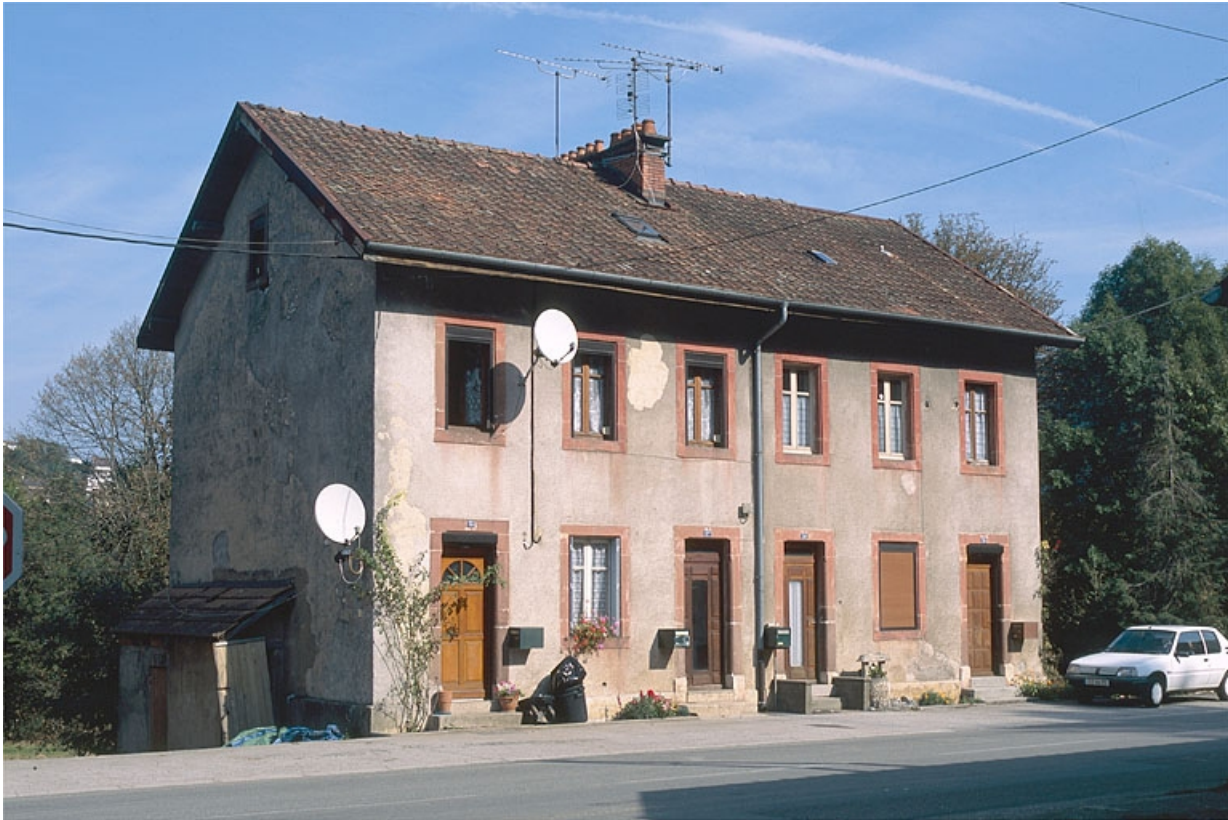
Vue de trois quarts d'une maison ouvrière.

25, Baume-les-Dames, lieudit : les Cités de Champard