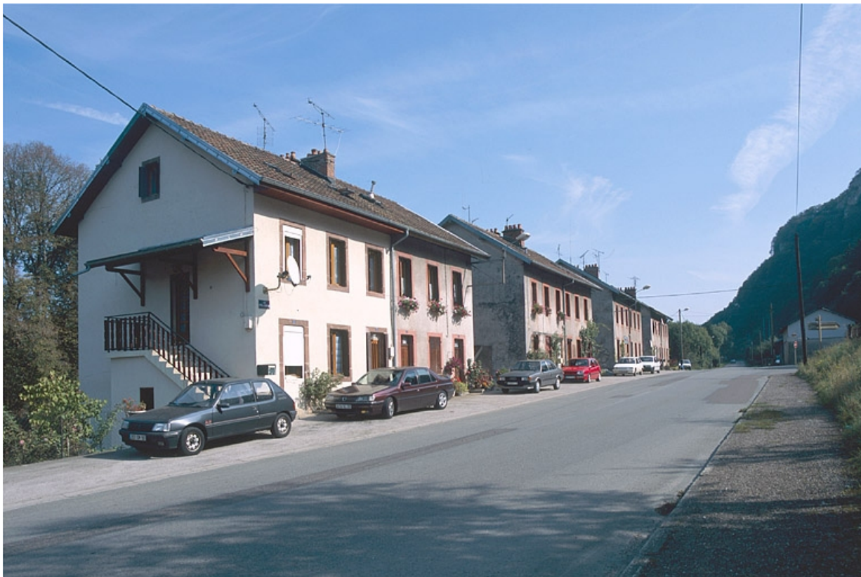
Vue d'ensemble depuis l'ouest.

25, Baume-les-Dames, lieudit : les Cités de Champard