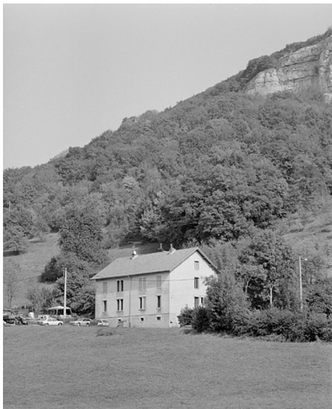
Logement ouvrier collectif vu de trois quarts.

25, Baume-les-Dames, 6, 8, 10 à 13 rue de Gondé, lieudit : Gondé