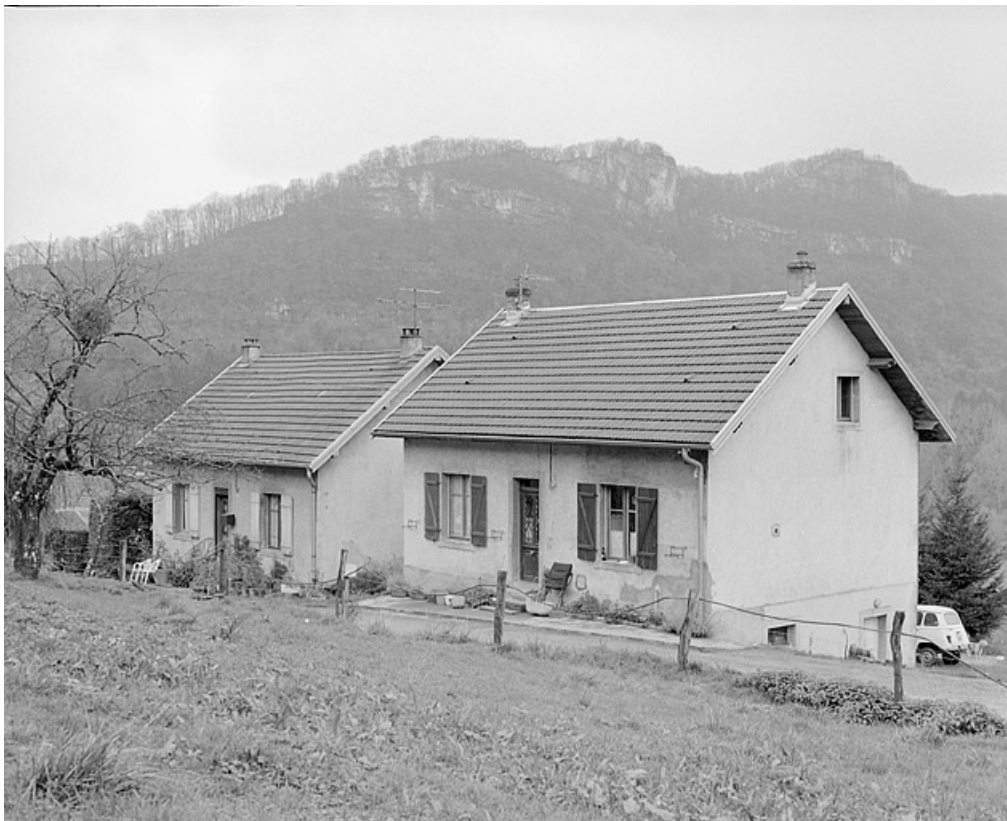
Vue de trois quarts des logements ouvriers individuels.

25, Baume-les-Dames, 6, 8, 10 à 13 rue de Gondé, lieudit : Gondé