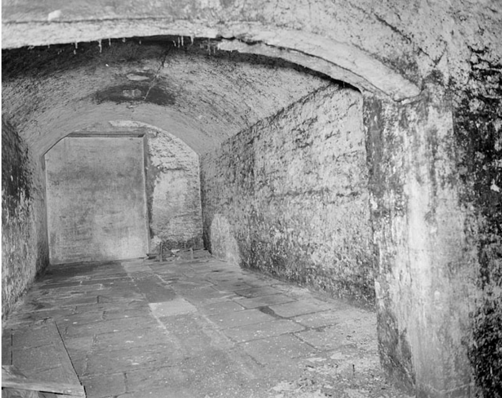
Rez-de-chaussée, sous la grande salle, une des 4 pièces parallèles.