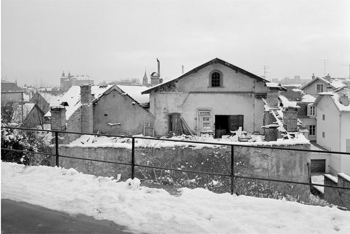
Pignons, côté nord.