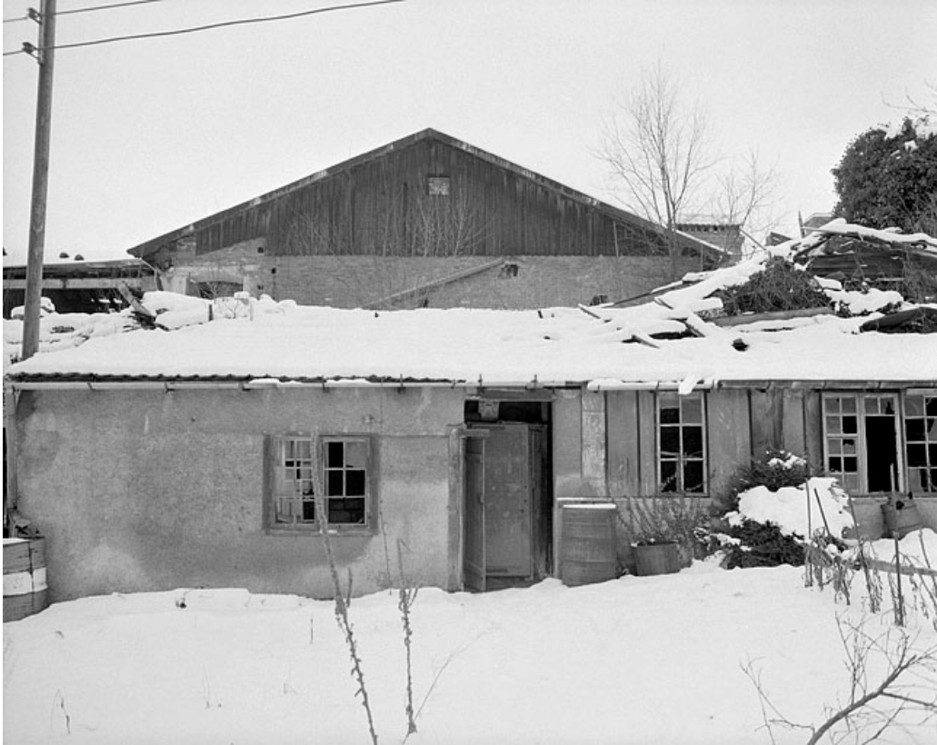
Corps de la grande salle, pignon est. 25, Montbéliard, 12 rue des Huisselets