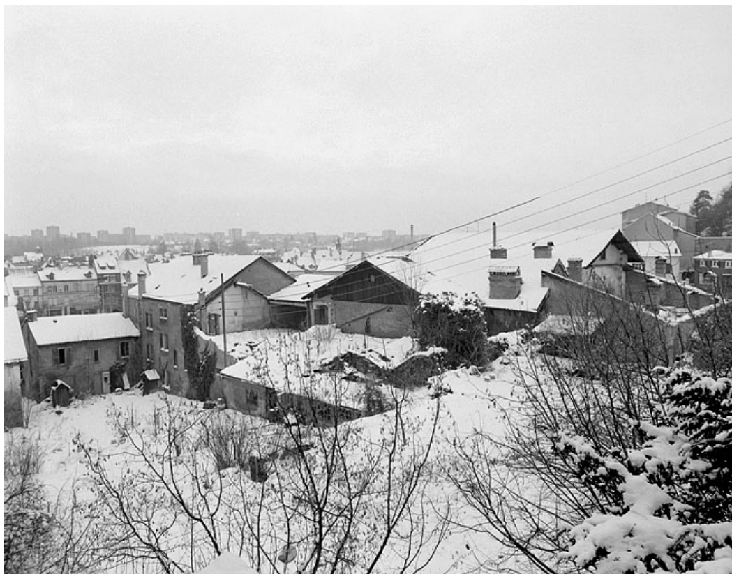
Vue d'ensemble sur l'angle nord-est. 25, Montbéliard, 12 rue des Huisselets