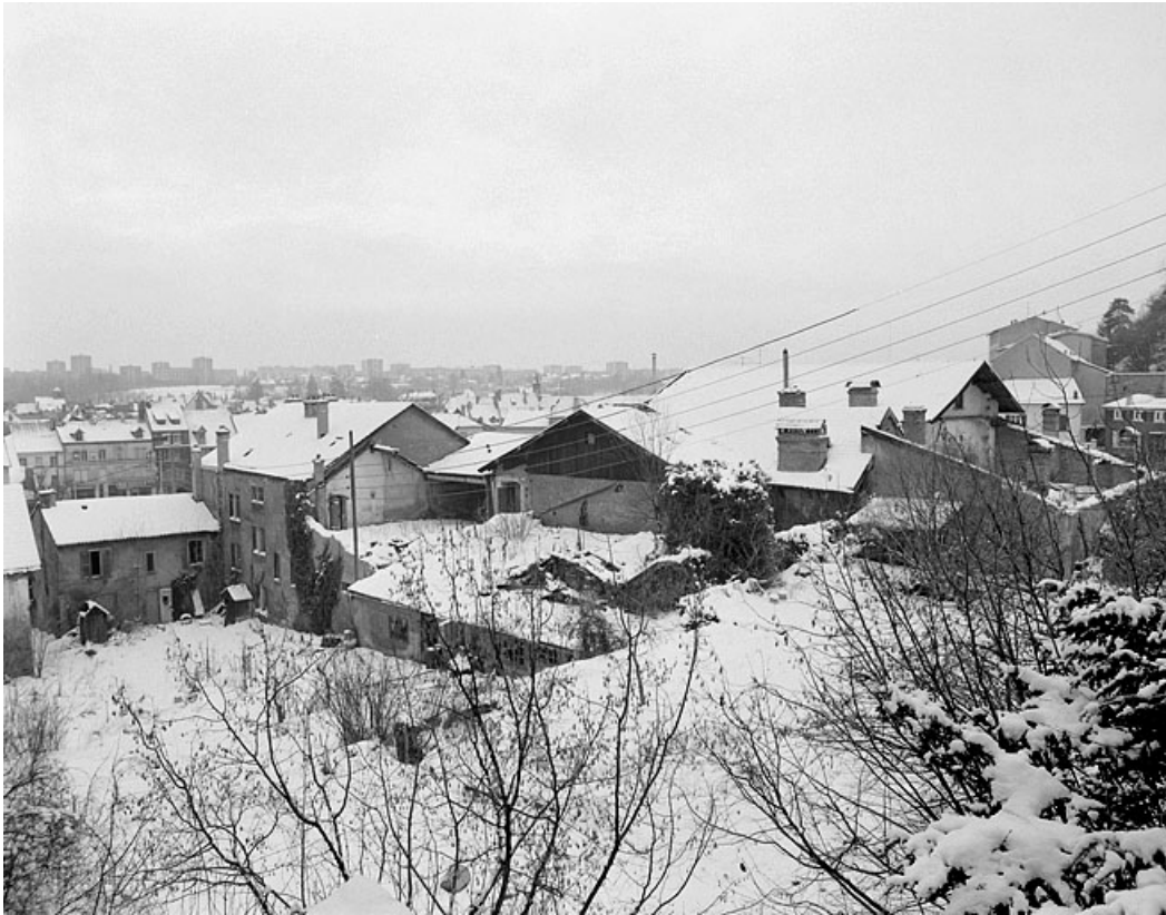
Vue d'ensemble sur l'angle nord-est.