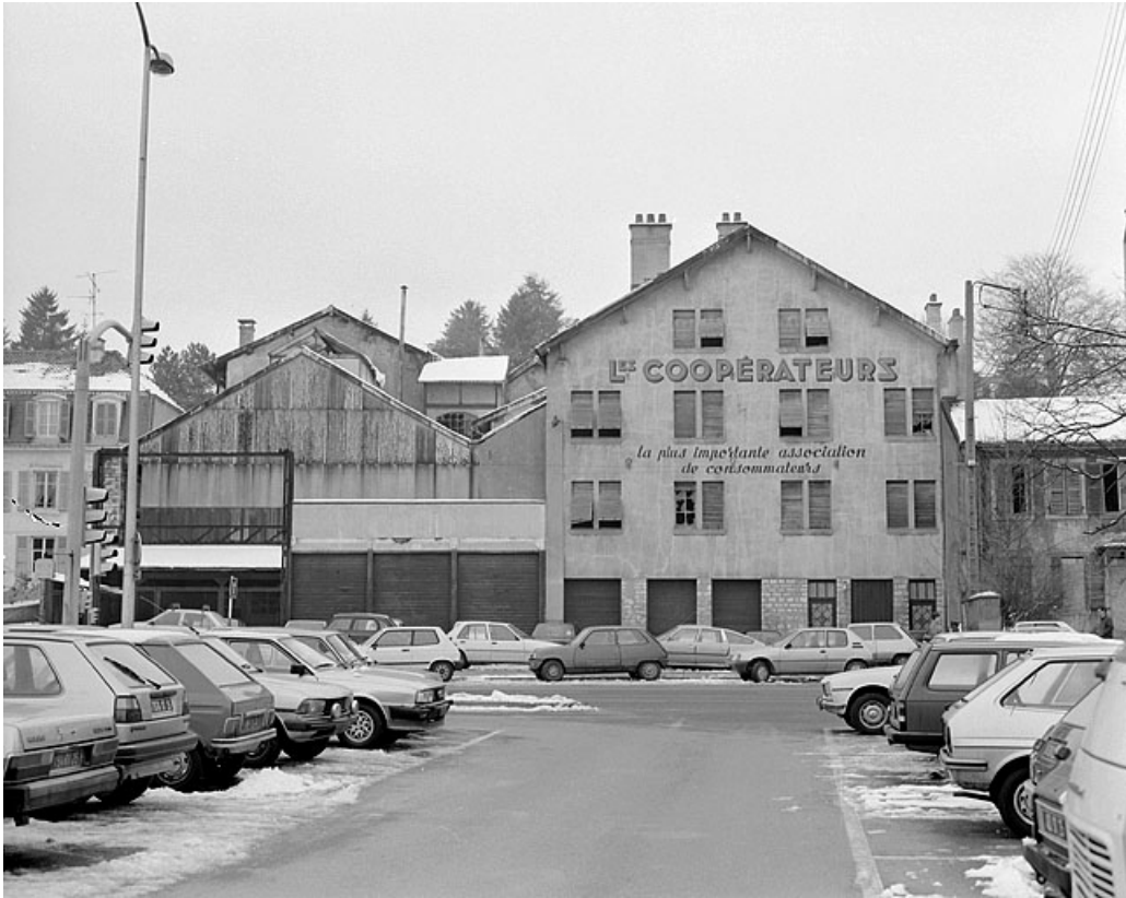
Façades sur la rue des Huisselets.