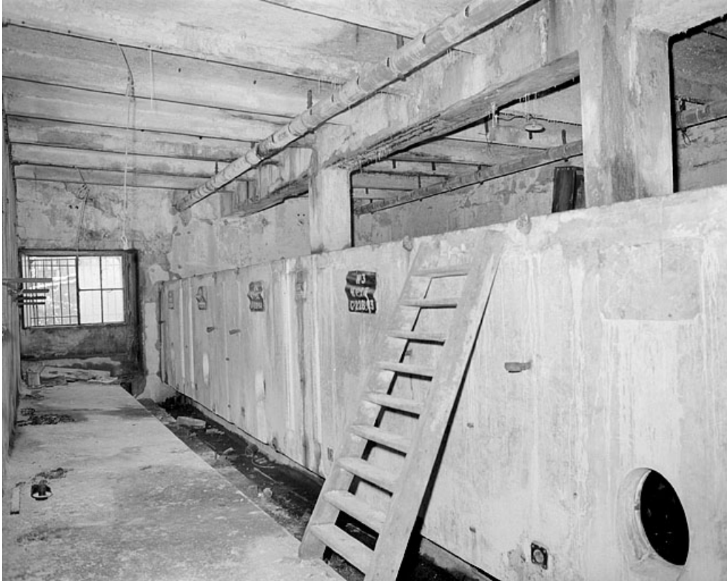
Premier étage, salle des cuves.