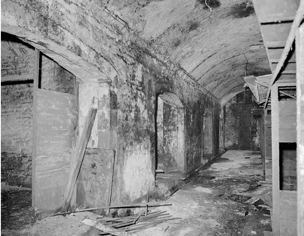
Rez-de-chaussée, sous la grande salle, pièce transversale à l'est.