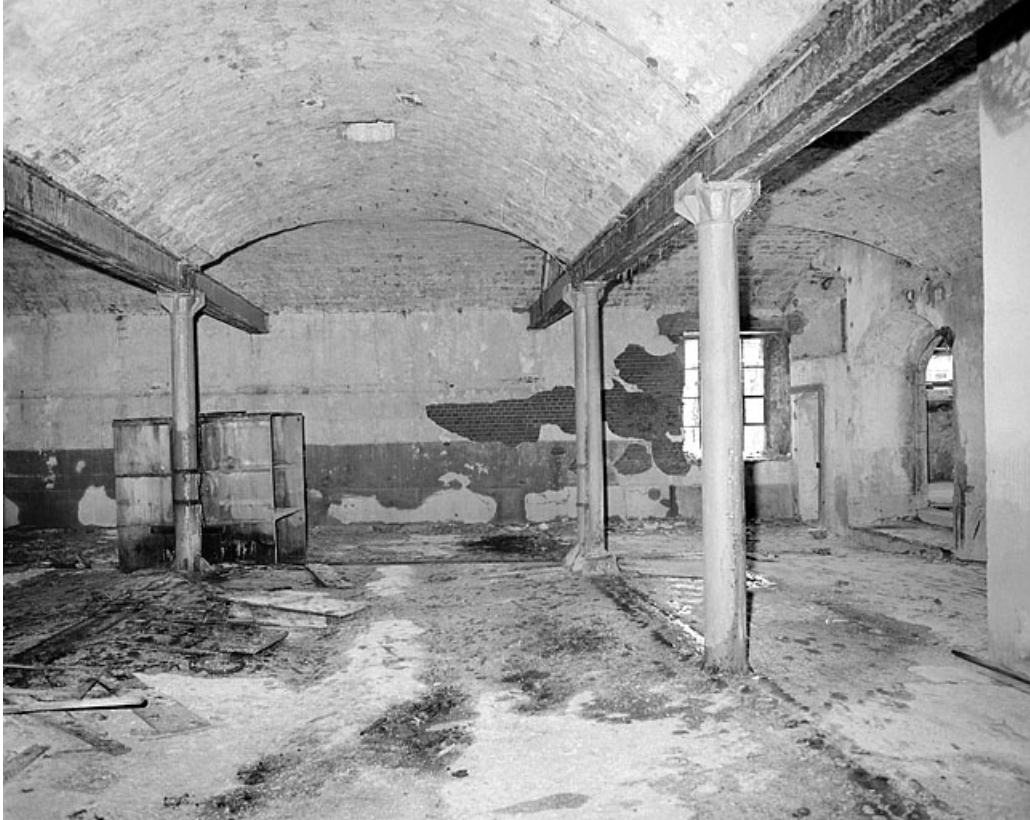
Premier étage, grande salle, côté est. 25, Montbéliard, 12 rue des Huisselets