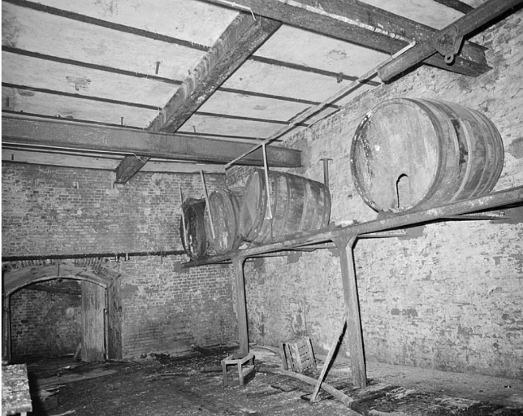
Rez-de-chaussée, salle des tonneaux.