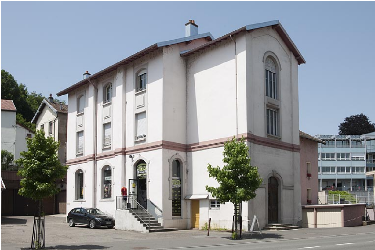
Bâtiments administratifs (?). Vue depuis le sud-ouest.