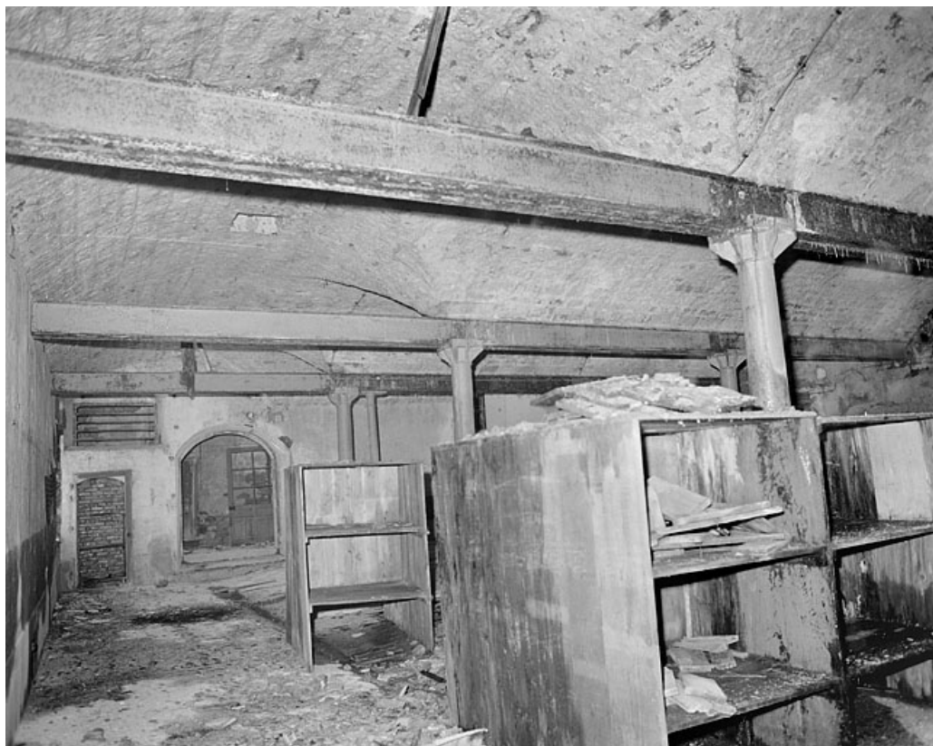
Premier étage, grande salle, côté sud. 25, Montbéliard, 12 rue des Huisselets