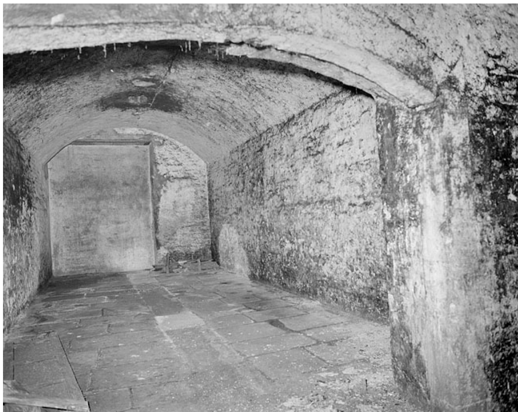
Rez-de-chaussée, sous la grande salle, une des 4 pièces parallèles.