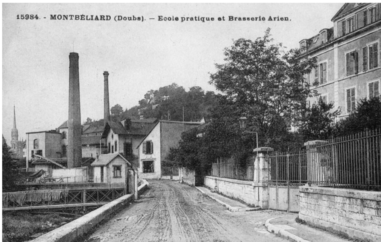
Montbéliard (Doubs) - Ecole pratique et brasserie Arlen.