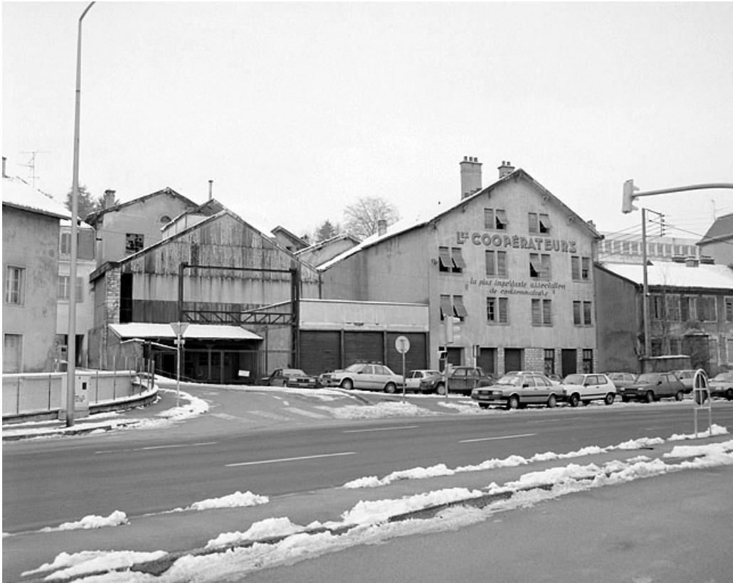
Vue d'ensemble sur la rue des Huisselets.