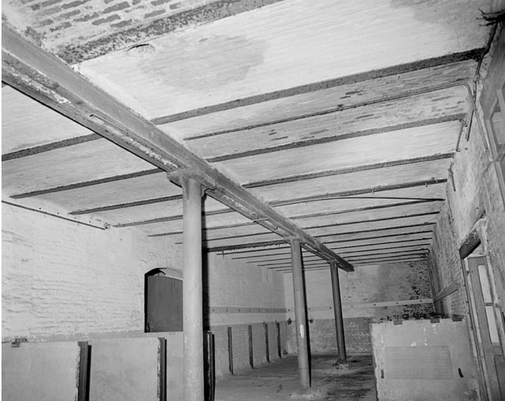
Premier étage, pièce à 2 vaisseaux.