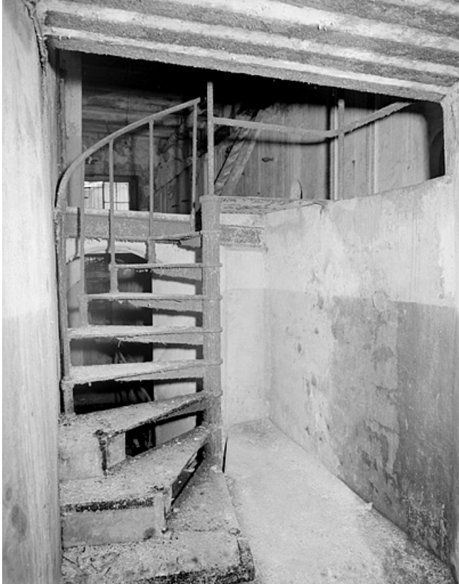
Premier étage, escalier d'accès à la salle des cuves.