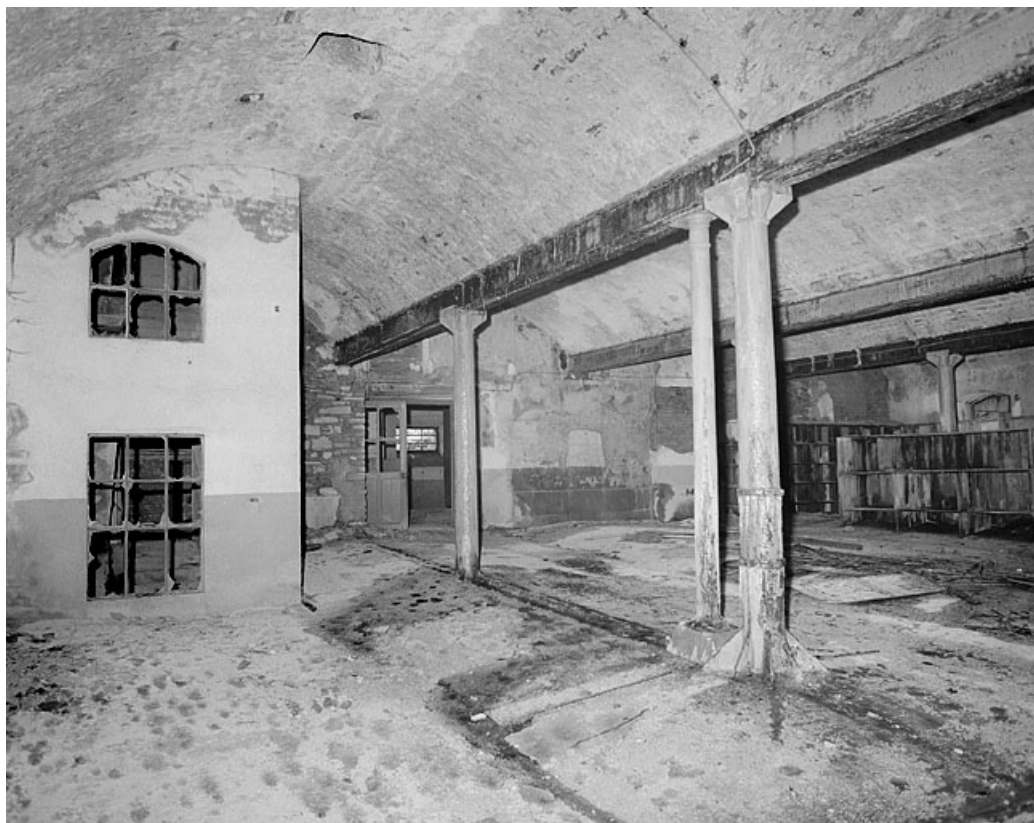
Premier étage, grande salle, côté ouest. 25, Montbéliard, 12 rue des Huisselets