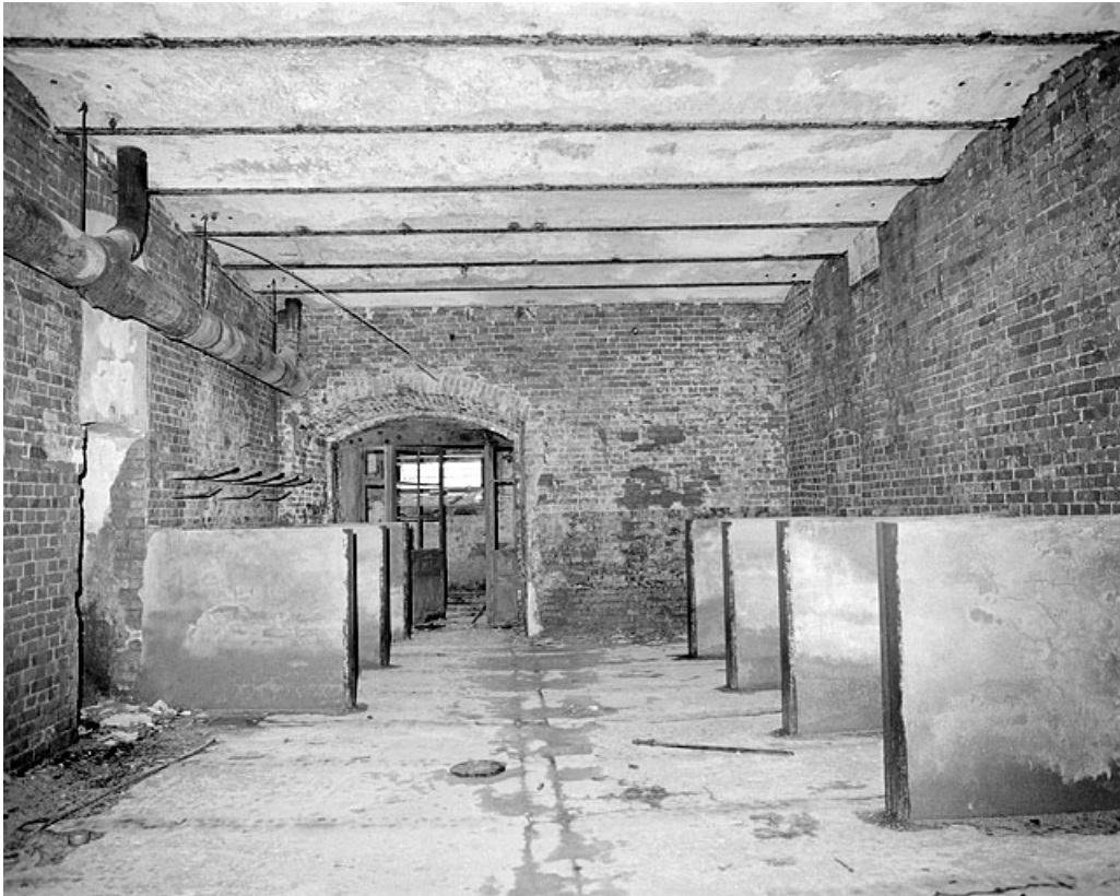
Premier étage, pièce à 1 vaisseau.