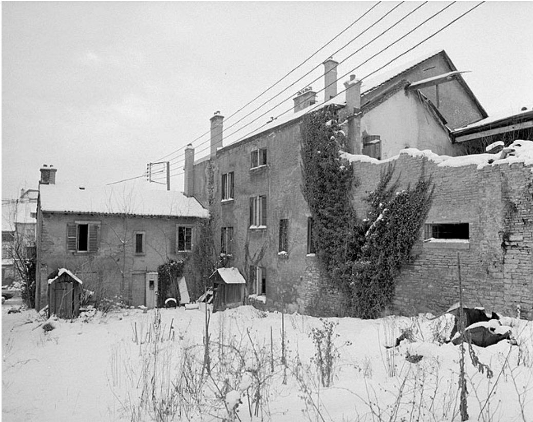
Corps de bâtiment sur rue, façade est. 25, Montbéliard, 12 rue des Huisselets