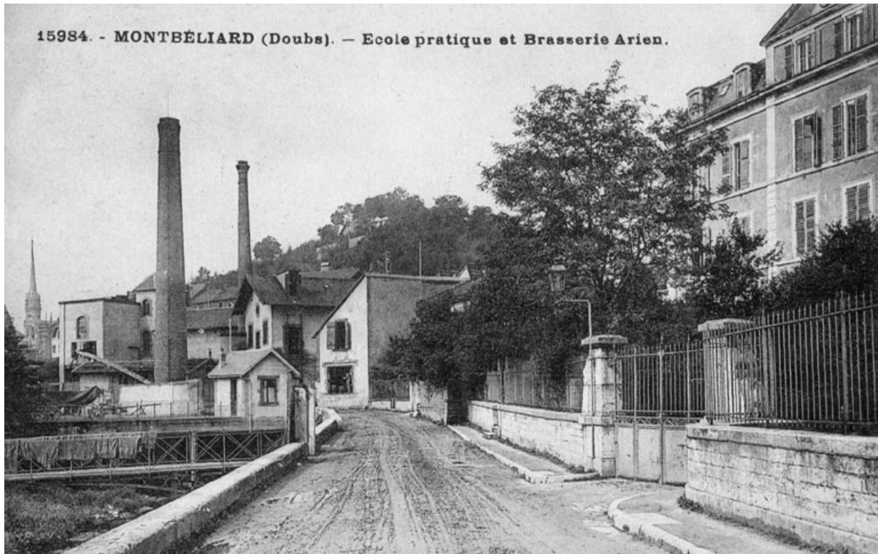
Montbéliard (Doubs) - Ecole pratique et brasserie Arlen. 25, Montbéliard, 12 rue des Huisselets