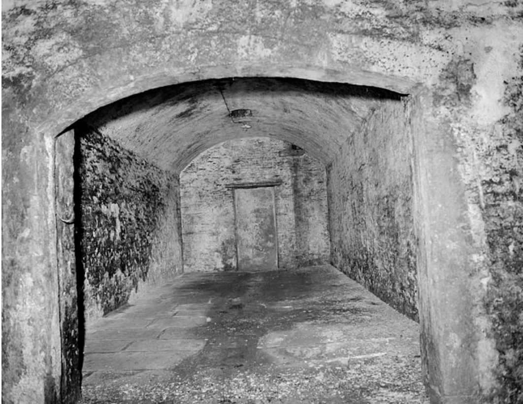
Rez-de-chaussée, sous la grande salle, une des 4 pièces parallèles.