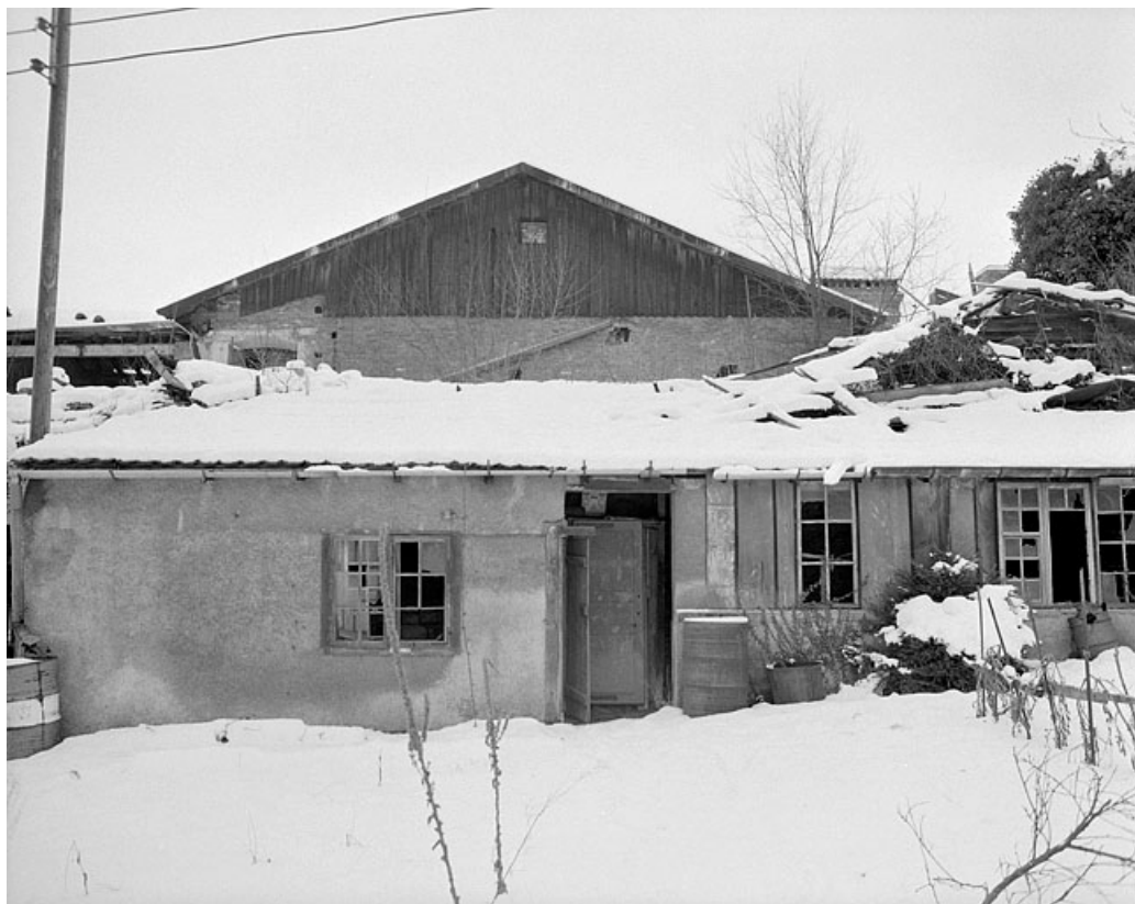
Corps de la grande salle, pignon est. 25, Montbéliard, 12 rue des Huisselets