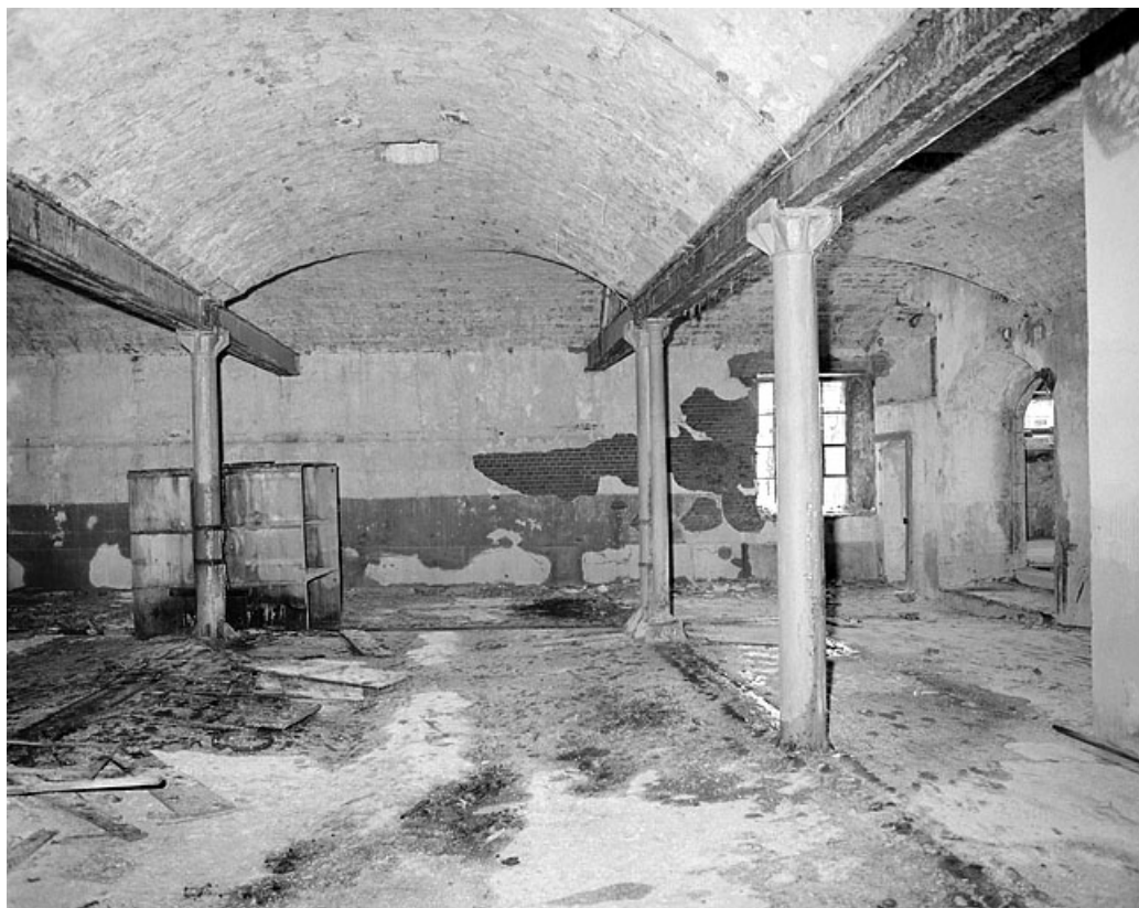
Premier étage, grande salle, côté est. 25, Montbéliard, 12 rue des Huisselets