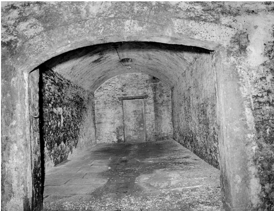
Rez-de-chaussée, sous la grande salle, une des 4 pièces parallèles.