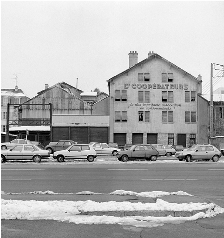
Façades sur la rue des Huisselets.