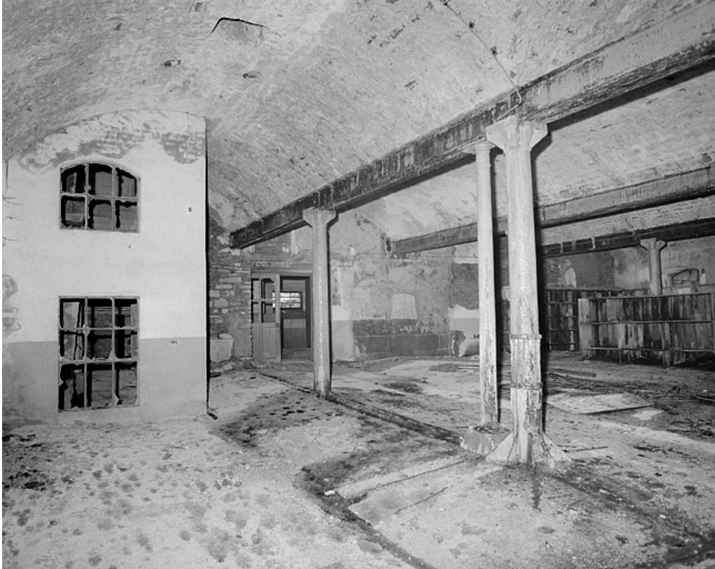
Premier étage, grande salle, côté ouest.