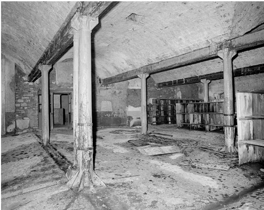
Premier étage, grande salle, côté ouest. 25, Montbéliard, 12 rue des Huisselets