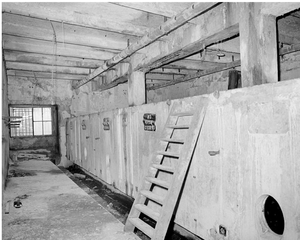
Premier étage, salle des cuves.