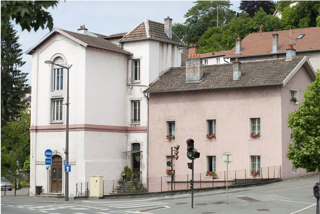
Bâtiments administratifs (?). Vue depuis le sud-est. 25, Montbéliard, 12 rue des Huisselets