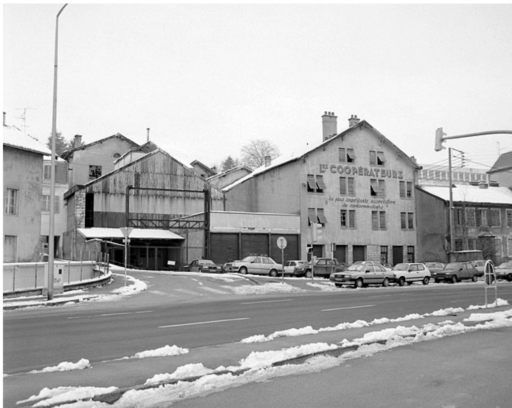
Vue d'ensemble sur la rue des Huisselets.