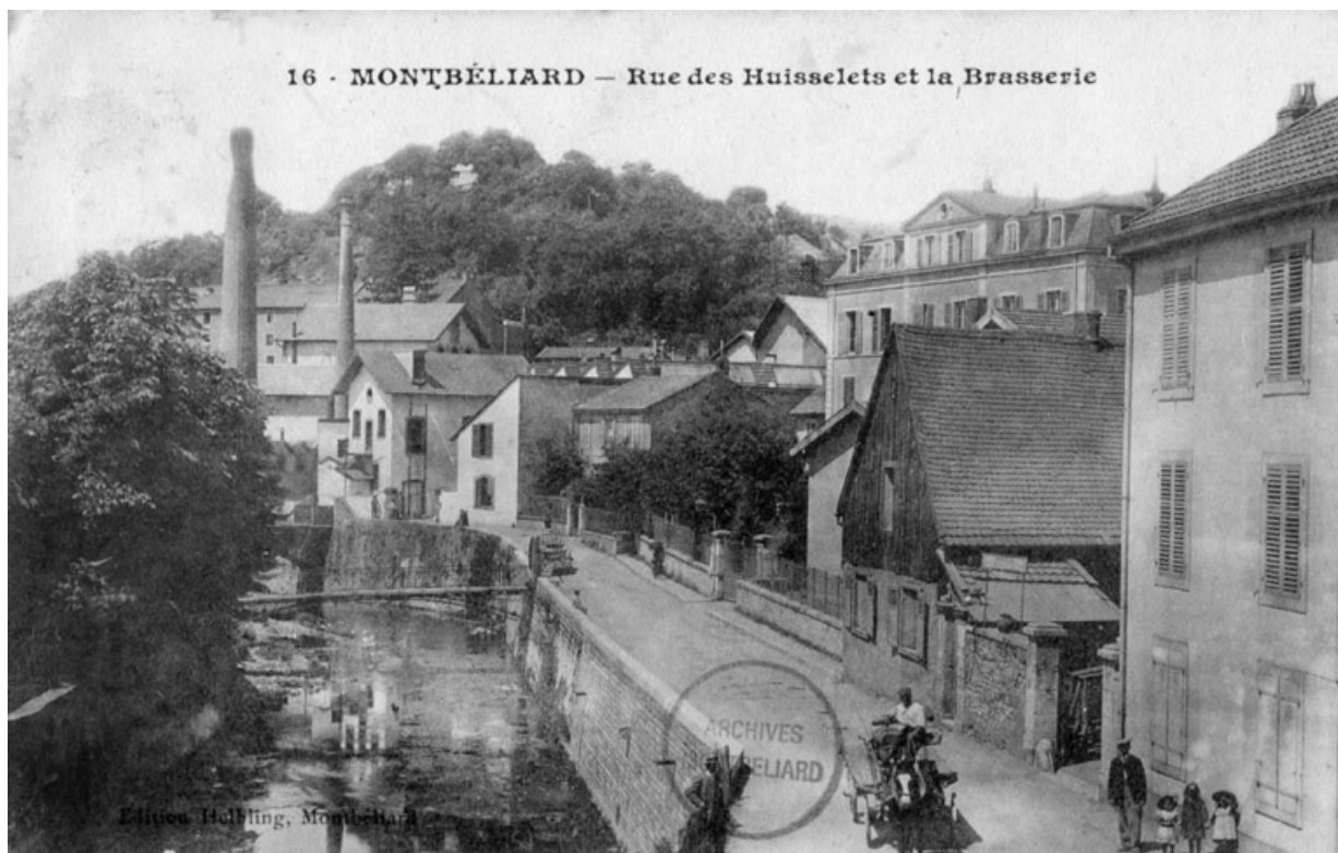
Montbéliard - Rue des Huisselets et la brasserie.