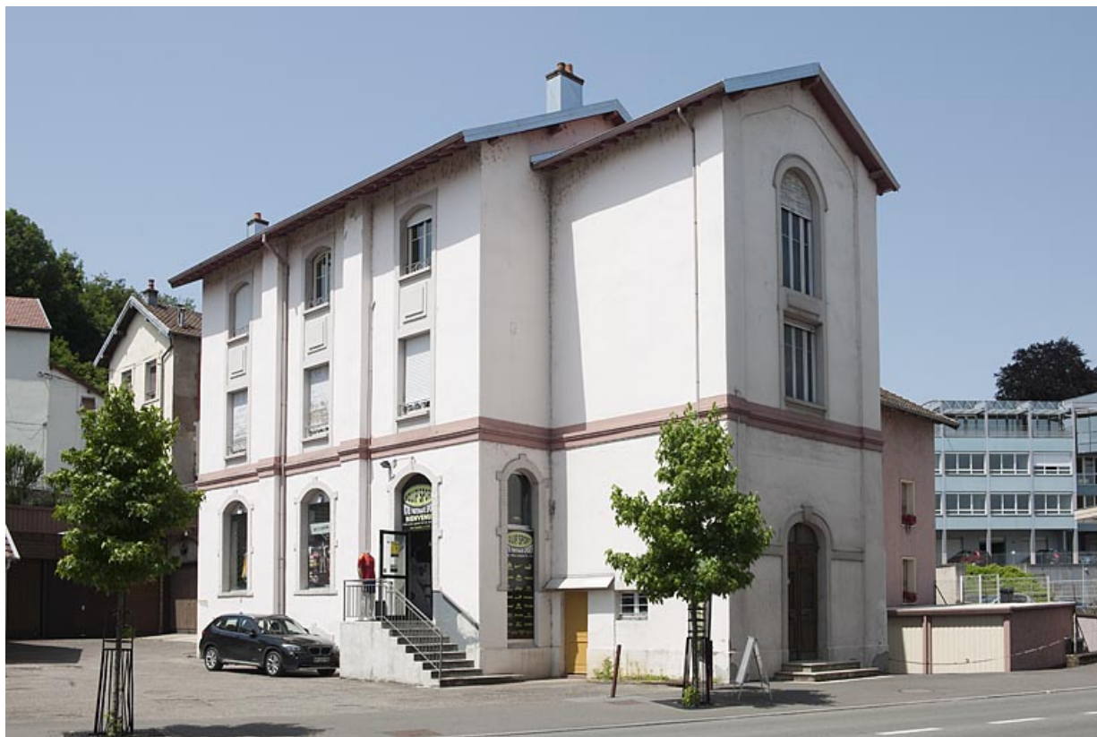
Bâtiments administratifs (?). Vue depuis le sud-ouest. 25, Montbéliard, 12 rue des Huisselets