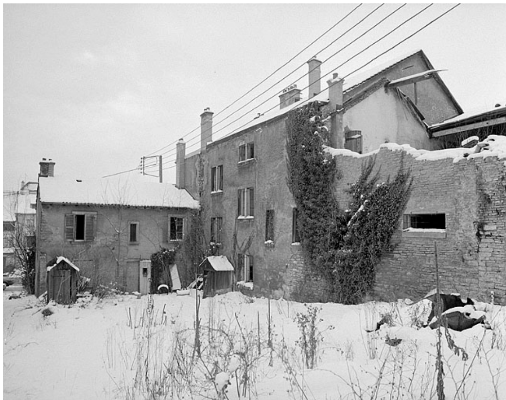
Corps de bâtiment sur rue, façade est. 25, Montbéliard, 12 rue des Huisselets