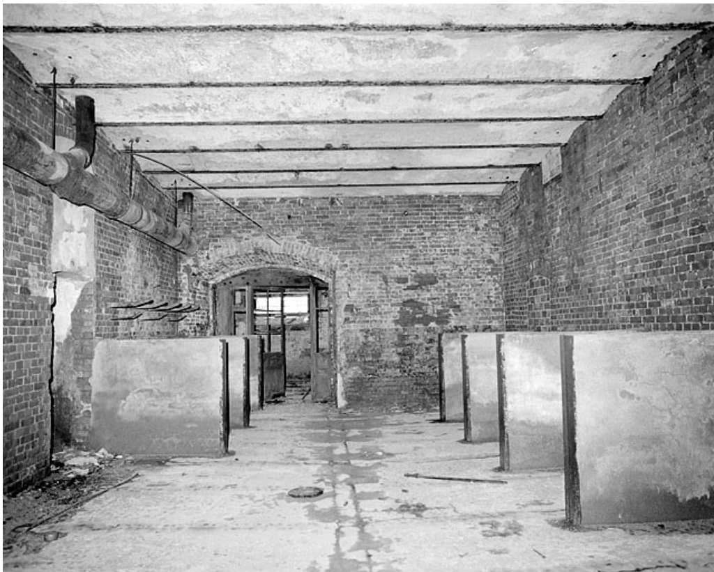
Premier étage, pièce à 1 vaisseau.