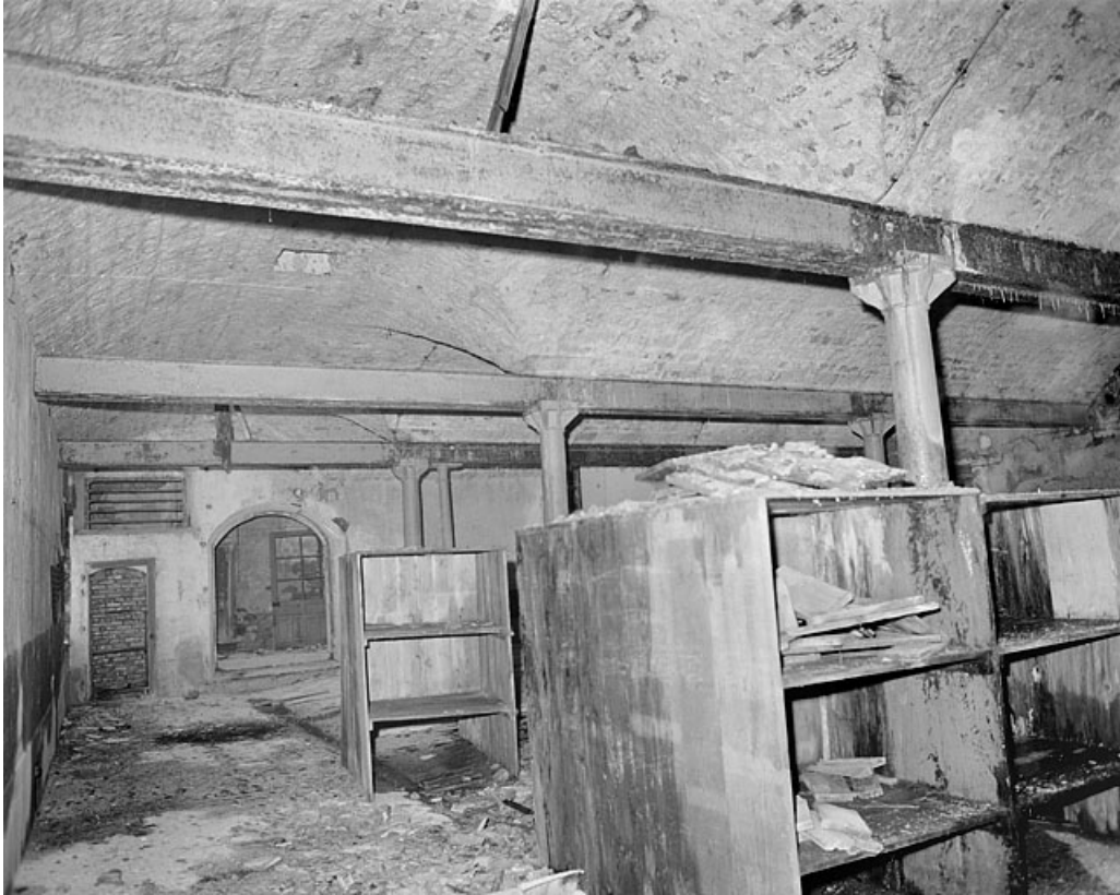
Premier étage, grande salle, côté sud.