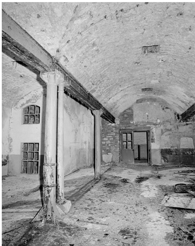
Premier étage, grande salle, côté ouest. 25, Montbéliard, 12 rue des Huisselets