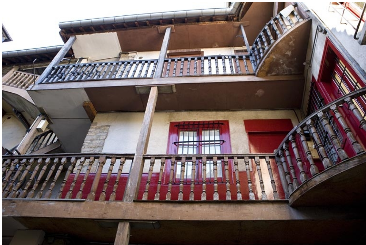
Détail des coursières prolongeant l'escalier à cage ouverte.

25, Besançon, 53 rue Mégevand, lieudit : îlot Granvelle