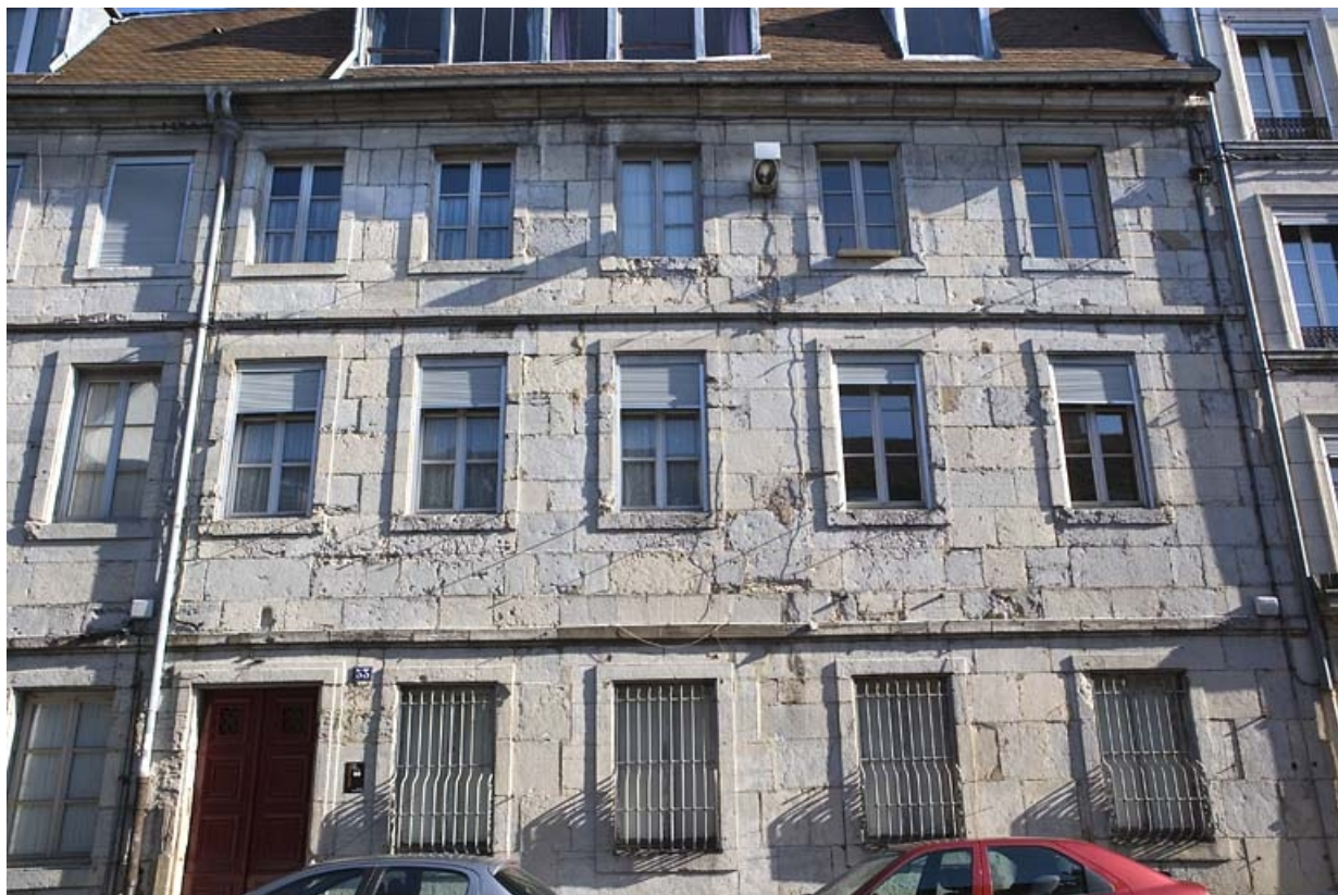
Vue d'ensemble de la façade sur rue, de face.

25, Besançon, 53 rue Mégevand, lieudit : îlot Granvelle