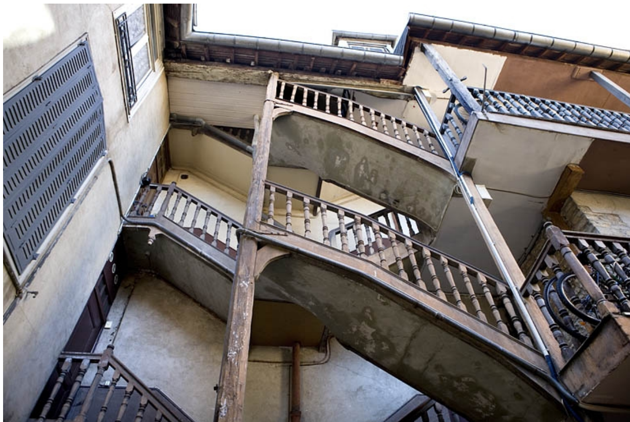
Détail de l'escalier à cage ouverte.

25, Besançon, 53 rue Mégevand, lieudit : îlot Granvelle