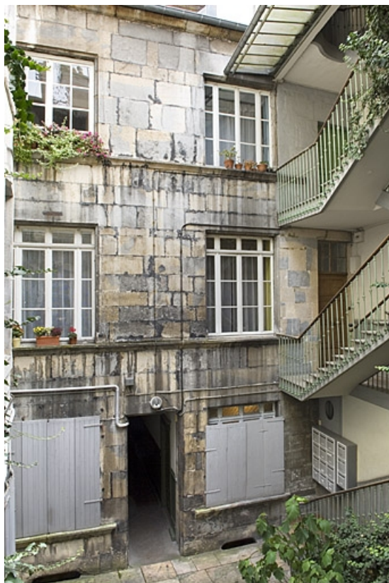
Vue d'ensemble de la façade sur cour du logis principal.

25, Besançon, 14 rue Ronchaux, lieudit : îlot Granvelle