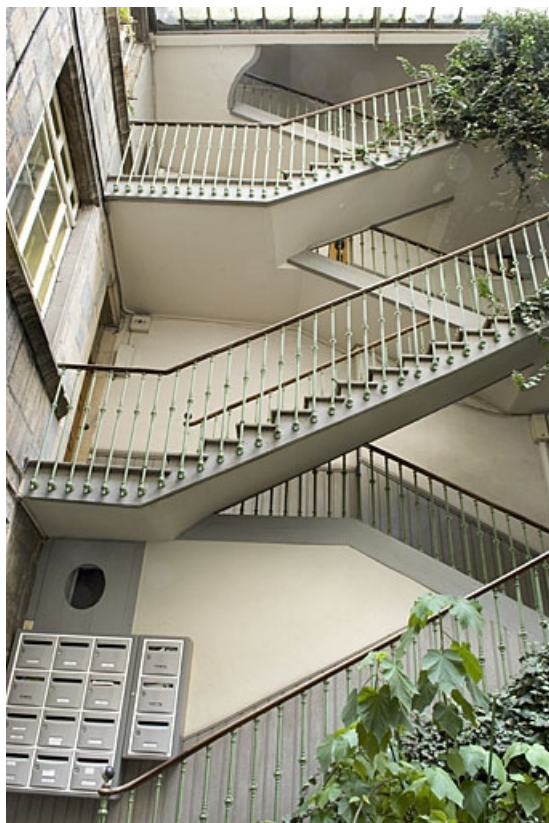
Vue de l'escalier à cage ouverte depuis la cour : partie supérieure.

25, Besançon, 14 rue Ronchaux, lieudit : îlot Granvelle