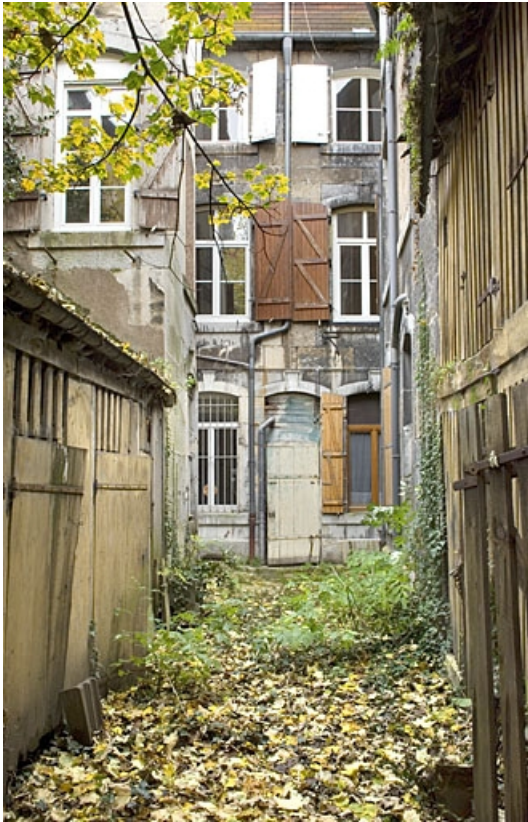
Vue d'ensemble de la façade postérieure du logis secondaire depuis le fond de la deuxième cour. 25, Besançon, 14 rue Ronchaux, lieudit : îlot Granvelle