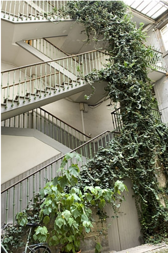
Vue de l'escalier à cage ouverte depuis la cour.

25, Besançon, 14 rue Ronchaux, lieudit : îlot Granvelle