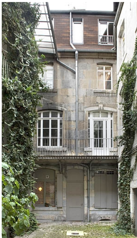
Vue d'ensemble de la façade principale du logis secondaire.

25, Besançon, 14 rue Ronchaux, lieudit : îlot Granvelle