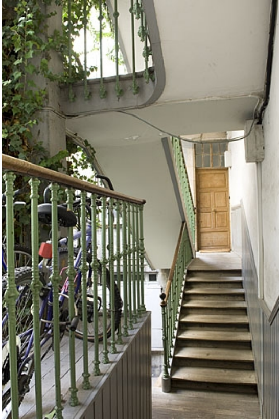
Détail de l'escalier à cage ouverte depuis la première volée.

25, Besançon, 14 rue Ronchaux, lieudit : îlot Granvelle