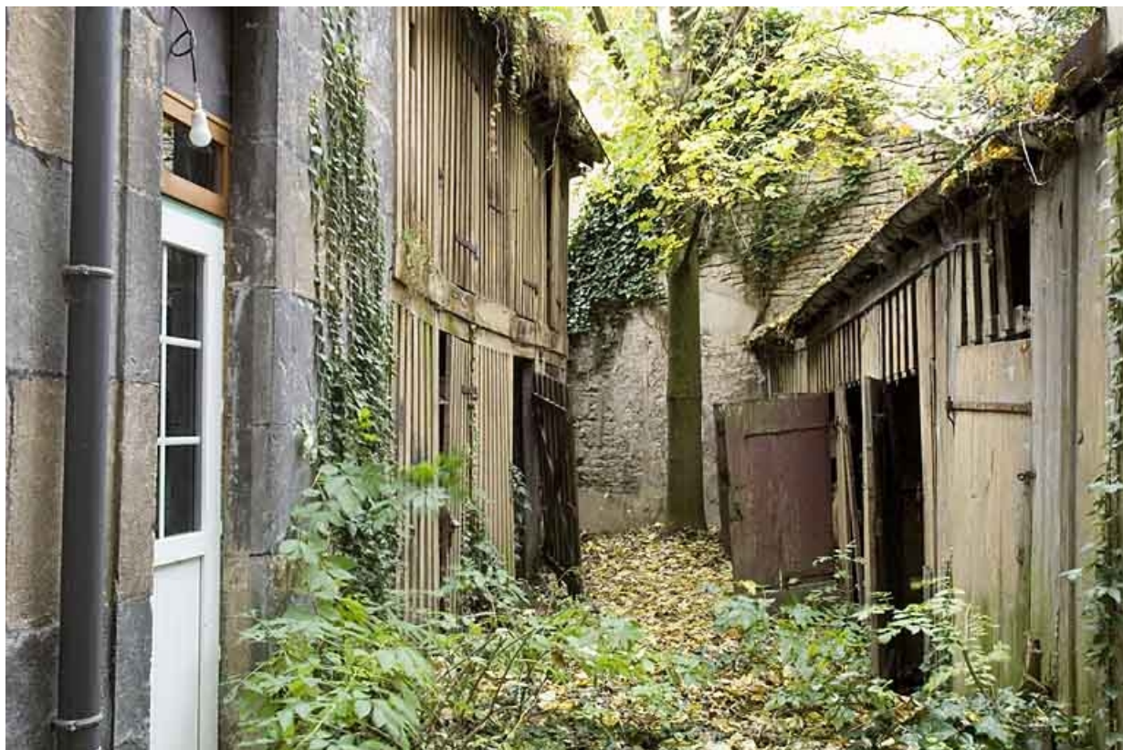
Vue d'ensemble de la deuxième cour depuis l'entrée.

25, Besançon, 14 rue Ronchaux, lieudit : îlot Granvelle