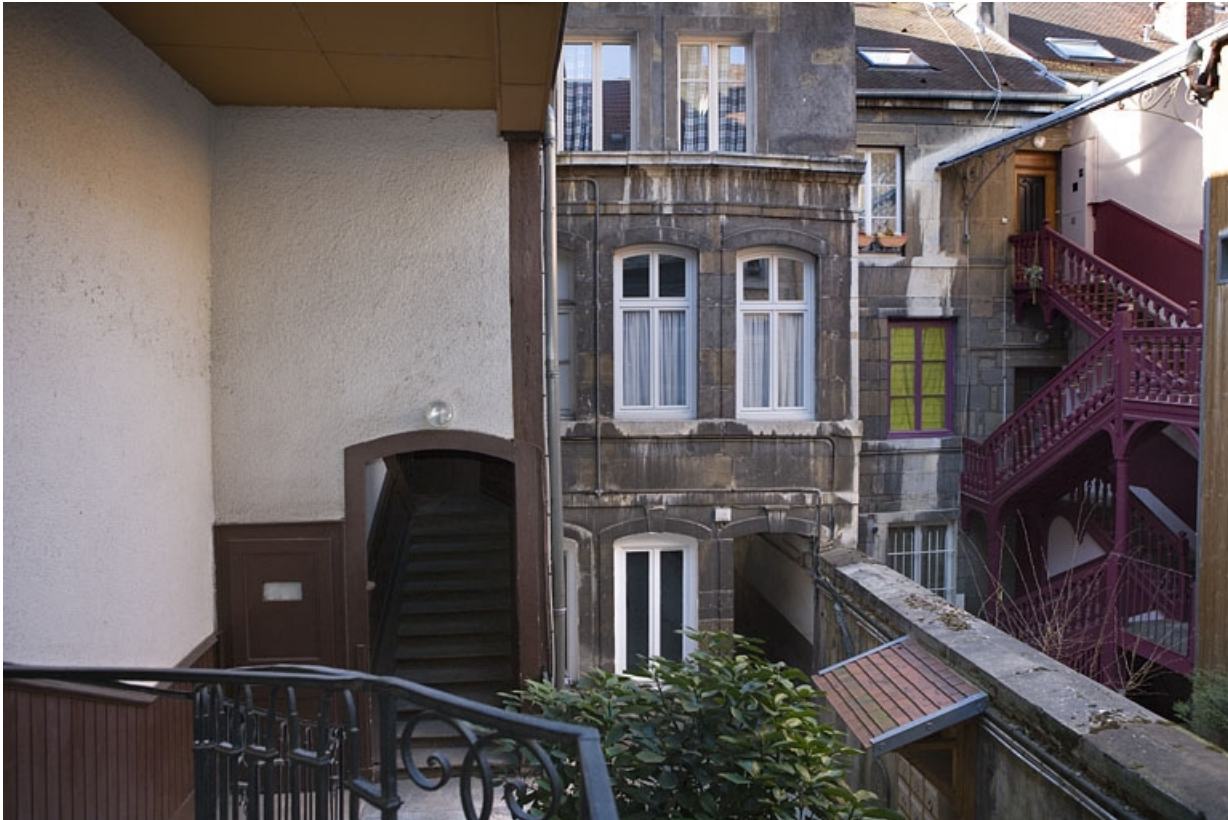
Vue de la façade antérieure du logis secondaire depuis l'escalier à cage ouverte.

25, Besançon Grande Rue 114, lieudit : îlot Granvelle