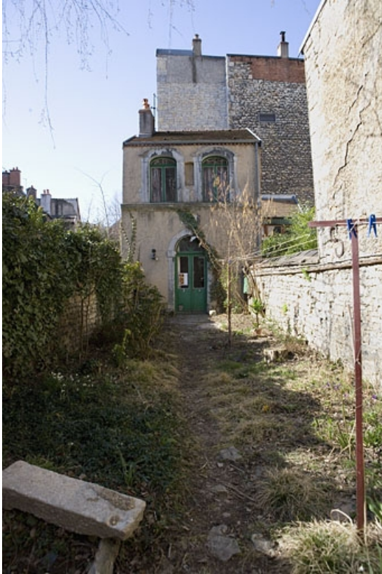
Vue d'ensemble de la fabrique de jardin au fond de la parcelle.

25, Besançon Grande Rue 114, lieudit : îlot Granvelle