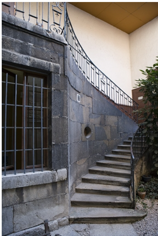
Vue du départ de l'escalier à cage ouverte.

25, Besançon Grande Rue 114, lieudit : îlot Granvelle