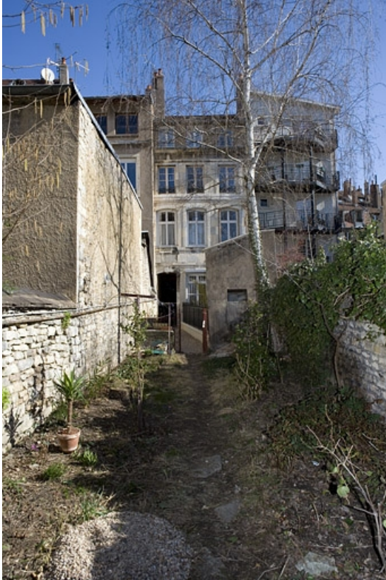
Vue de la façade postérieure du logis secondaire depuis le fond de la parcelle.

25, Besançon Grande Rue 114, lieudit : îlot Granvelle